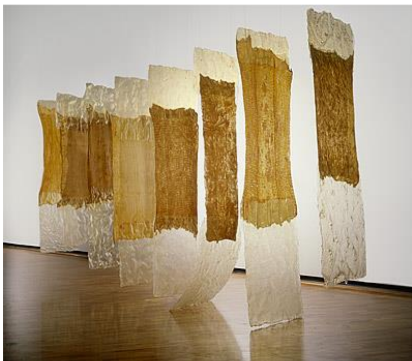
Slika 12: Eva Hesse, „Kontingent“, 1969., indijsko platno, lates, fiberglas u osam dijelova, instalacija, 3,7 x 2,9 x 0,98 m, National Gallery of Australia, Canberra

“Kontingenti”(1969.), u kojem je njezin rad upravo višefunkcionalna forma, koja visi u prostoru i stvara prividno tekstilnu formu kao nešto više.