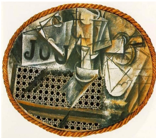
Slika 1: “Mrtva priroda s pletenom trskom za stolice“, Pablo Picasso, 1912., ulje i voštano platno s špagom 27 x 37 cm. Musée Picasso, Pariz

Slika “Gospođice iz Avignona”(1906.-1907.) koja je sazdana na Cézanneovim idejama, dovela je do tog pravca u umjetnosti. Prvo što se primjećuje je da nema osjećaja za dubinu. Žene su prikazane gotovo dvodimenzionalno, a njihova tijela su svedena na niz trokutastih i rombičnih oblika. Nema oponašanja stvarnosti, crte lica su im posložene u mješavini različitih kutova, a imamo i dramatično skraćivanje pozadine. (W. Gompertz, 2019; 120) Dobivamo novi odnos tijela i prostora u plohi te linije izrezuju elemente oblika iz plohe i međusobno se probijaju i potiskuju.(A. Schung, 1969; 68) Promatrač prolazi očima i iza sebe izvodi prostornu povezanost. Nemamo dojam tradicionalne iluzije nego žene agresivno iskaču s platna. (W. Gompertz, 2019; 120) Vidi se bit kubizma u začecima, a to je destrukcija predmeta intenzivnim analitičkim proučavanjem.