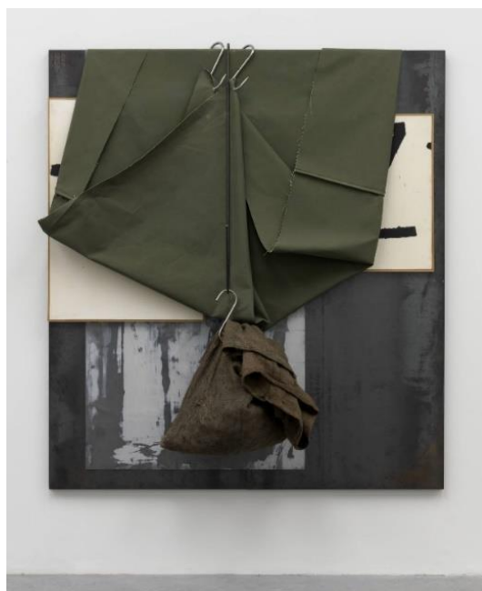
Slika 7: Jannis Kounellis, „Untitled“, 1960.-68., čelična ploča, emajl na papiru na 2 platna, tkanina, ugljen, 3 metalne kuke i metalna šipka, 2000 x 1800 cm, National Galleries of Scotland, Edinburgh

Bitno je naglasiti Maria Merza 11 i njegove iglue. Tim radom spaja prirodne materijale s industrijskim proizvodima poput metalnih cijevi i stakla.