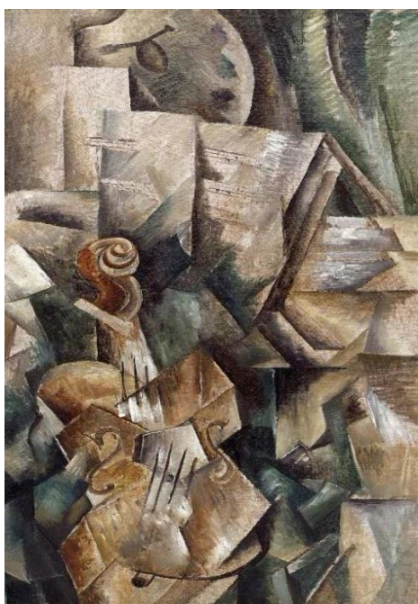
Slika 2: Georges Braque, „Violina i paleta“, 1909., ulje na platnu 91,7 x 42,9 cm, Solomon R. Guggenheim Museum, New York

Georges Braque kao suosnivač uz Pabla Picassa je isto ostavio veliki trag u pomicanju tradicionalne umjetnosti ka umjetnosti spremnoj eksperimentiranju.