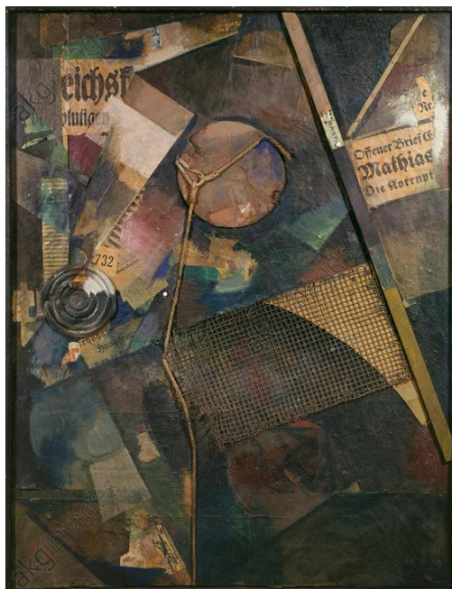
Slika 11: Kurt Schwitters, „Merzbild 25A“, 1920., asemblaž, 104,1 x 79,1 cm, Kunstsammlung Nordrhein-Westfalen, Düsseldorf

Možda najpopularniji primjer je njegov pojam i vlastita varijanta dade “Merz”. Najbolje je shvatiti riječ pomoću njegovog opisa: “Potkraj 1918.godine, shvatio sam da sve vrijednosti postoje jedino u odnosu prema drugima i da je ograničavanje na samo jedan materijal jednostrano i uskogrudno. Zahvaljujući toj spoznaji osnovao sam Merz, koji je iznad svega zbroj pojedinačnih umjetničkih formi.”(256,257) Kao najpoznatiji primjeri su “Merzbild 25A”(1920.) i “Merzbau”. 16