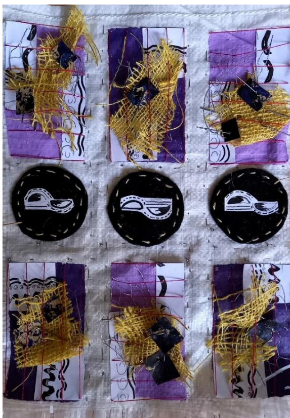
Slika 13: „Kompozicija 1“, 2021., asamblaz, 594 x 891

vlastitog kreativnog procesa je eksperiment, isprobavanje novih različitih tehnika i materijala te njihovo usuglašavanje u što zanimljivije likovne cjeline.