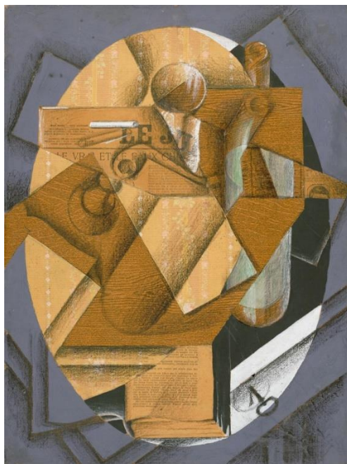
Slika 3. Juan Gris, „Stol“, 1914., nalijepljeni i tiskani papiri i ugljen na papiru, preneseno platno, 59,7 x 44x5 cm, Philadelphia Museum of Art

Dva bitna umjetnika za kubizam su bila i Juan Gris i Aleksandr Arhipenko. To su umjetnici, a ne osnivači kubizma. Oni su samo pokrenuli novi umjetnički pravac u javnosti.