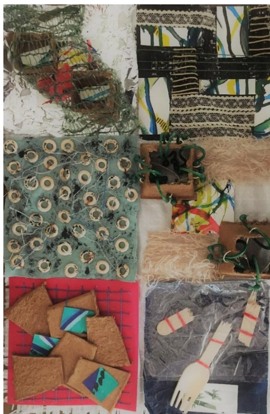
Slika 15: „Patchwork kompozicija“, 2021., asamblaž, 594 x 891

U radu se koristi aluminijska folija, tkanina, papir, papir za otiskivanje, ali i ostavlja se dio u kojem se vidi podloga. Ponavlja se element korištenja konca kao moment koji spaja više radova, ne samu u ovom radu nego sve radove. Vrtne posudice se ponavljaju u kvadratima i time se stvara određena ravnoteža unutar različitih trenutaka. Boje su različite i stvaraju određenu konfuziju i pretjeranost, ali se protežu ili u drugim kvadratima ili se ponavljaju u istom kvadratu. U ovome radu se najbolje može spoj asamblaža i patchwork tehnike.