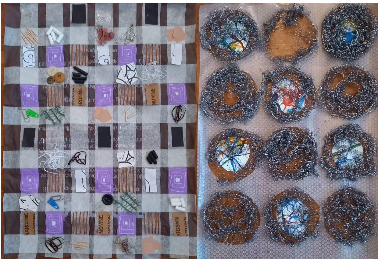
Slika 17: „Što je to?” 2021., asamblaz, 594 x 891 Slika 18: „Žica u prostoru”, 2021., asamblaz 594 x 891

Peti rad se razlikuje od ostalih radova, jer na njemu se vidi mali broj intervencija. Posebnost ovoga rada leži u odnosu s prostorom. Kako krugovi nisu puni, nego možemo gledati kroz njih, dolazi do nove razine i stvaranja komunikacije između prostora u kojem se nalazi i rada. Koristeći zanimljivu podlogu koja stvara određenu teksturu, nije ju bilo potrebno dodatno naglasiti. Kako bi podloga i prazni krugovi došli u ravnotežu, koristi se žice za pranje suđa. Njihova tekstura i fleksibilnost, nadopunjuju krugove i stvaraju cjelinu. Kako bi sami rad se povezo s drugim radovima, koristi se izrezani krugovi iz dijelova starih radova.