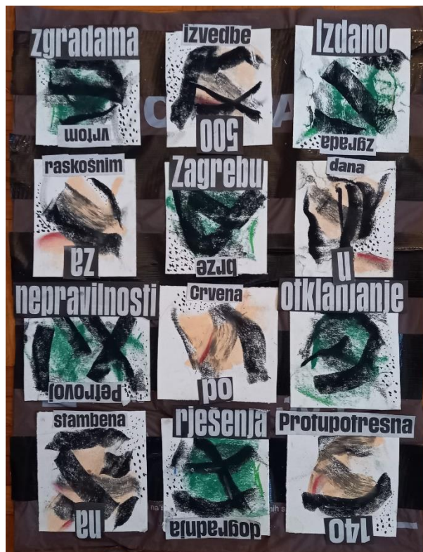
Slika 16: „Riječ”, 2021., asamblaž, 594 x 891

Na četvrtom radu, vidimo korištenje bio-vrećice, ali s pik trakom koja stvara rešetke, u kojima se nalaze različiti predmeti. U ovom radu koristi se mnogo predmeta, koja popunjavaju prostor i time stvaraju uzorak. Kako bi se ostvarila dinamika na radu, ubacujemo elemente, boje, stare ambalaže i vrećica. Njihovim ponavljanjem dobiva se kontinuitet i pravilan uzorak. Predmeti koji se koriste su svakodnevni poput zubnog konca, ugljena, gumica za kosu, čačkalica, flastera, konaca, spajalica, vreća za vrt, gumbiju i filtera za cigarete. Svaki od tih predmeta više nije samo običan svakodnevni predmet, nego postaje umjetnost.