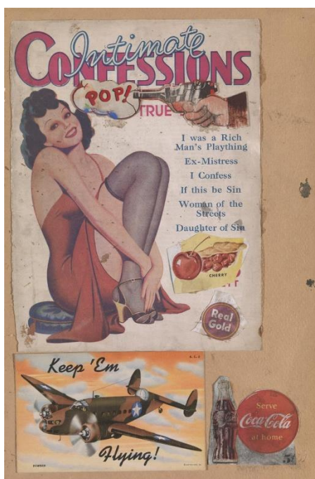
Slika 8: Eduardo Paolozzi, „ Bila sam bogataševa igračka”, 1947., karton, kolaž, 359 x 238 mm, Tate Modern, London

Bitan umjetnik koji koristi jedan motiv, umjesto više motiva, kako je radio i umjetnik Jasper Johns, kojeg će se spomenuti u neodadaizmu kao bitnu figuru, je Andy Warhol. Njegovo pojednostavljenje na grafički prikaz, postao je njegov zaštitni znak. Koristi motive koji su toliko popularni da ih svi primjećuju, on time rad stavlja na istu poziciju kao i reklamu ili proizvod pored kojeg prolazimo u svakodnevnom životu. Kao najbolji primjer možemo navesti i njegov rad naziva “Limenke Campbell juhe” (1962.) koji prikazuje trideset i dvije slike limenki Campbell juhe. Radi se trideset i dva platna na kojem je prikazano drugačiji okus iz Campbellove ponude. Platna su postavljena u horizontalni niz te izgleda kao da se još nalazi u trgovini. (W. Gompertz, 2019; 303) Sa slika je uspio ukloniti gotovo sve dokaze svoje prisutnosti, što znači da nema niti jednog dijela u kojem se označava on kao umjetnik. Tu se vidi ponavljanje metoda modernog oglašavanja, čiji je cilj infiltrirati proizvod u svijest javnosti, bombardirajući nas istim slikama. S ovim radom umjetnik osporava pravilo da umjetnost treba biti originalna.