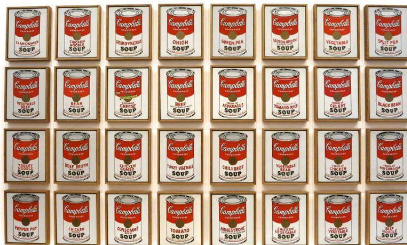
Slika 9: Andy Warhol, „Limenke Campbell juhe”, 1962., platno, sintetička polimerna boja, 51 x 41 cm, MoMA, New York

U Americi se stvaraju dva mlada umjetnika koja su imala slične ideje. Njihov rad je bio puno prije Andyja Warhola, ali ideja je bila slična. Dva mlada umjetnika imena Jasper Johns i Robert Rauschenberg su bili nesumnjivo nasljednici Marcela Duchampa i Kurta Schwittersa. Možemo reći da su upravo oni bili prethodnici Pop-art-a.