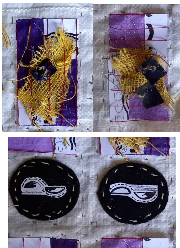
Slika 14: detalji „Kompozicija 1“, 2021., asamblaz, 594 x 891

Na uvećanim detaljima, vidimo kako su sami detalji iznimno kompleksni i da u kreiranju slojevitih uzoraka su korištene različite likovne i tekstilne tehnike i materijali. Pravokutnici pomalo neurednog, slobodnog izgleda imaju uz metalne predmete, kolaže i jutene trake dodatak crvenog konca, koji se spaja s crnim krugovima koji isto ima detalje konca samo u drugoj boji. To su oblici koji mogu stajati sami za sebe, ali sastavljeni zajedno stvaraju kompleksniju formu.