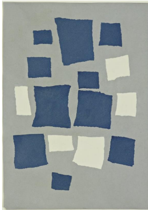
Slika 4: Jean Arp, „ Kolaž raspoređen prema zakonitostima slučajnosti, 1916.-17., rastrgani i lijepljeni papir, 48,6x 34,6 cm, The Museum of Modern Art, New York

Njujorški dadaizam je proizveo dva jedna od najbitnijih umjetnika, a to je Marcel Duchamp i Frances Picabia.