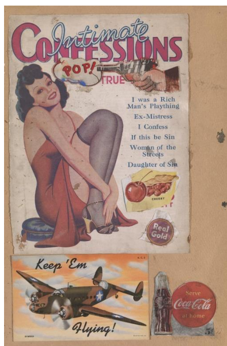
Slika 8: Eduardo Paolozzi, „ Bila sam bogataševa igračka”, 1947., karton, kolaž, 359 x 238 mm, Tate Modern, London

Bitan umjetnik koji koristi jedan motiv, umjesto više motiva, kako je radio i umjetnik Jasper Johns, kojeg će se spomenuti u neodadaizmu kao bitnu figuru, je Andy Warhol. Njegovo pojednostavljenje na grafički prikaz, postao je njegov zaštitni znak. Koristi motive koji su toliko popularni da ih svi primjećuju, on time rad stavlja na istu poziciju kao i reklamu ili proizvod pored kojeg prolazimo u svakodnevnom životu. Kao najbolji primjer možemo navesti i njegov rad naziva “Limenke Campbell juhe” (1962.) koji prikazuje trideset i dvije slike limenki Campbell juhe. Radi se trideset i dva platna na kojem je prikazano drugačiji okus iz Campbellove ponude. Platna su postavljena u horizontalni niz te izgleda kao da se još nalazi u trgovini. (W. Gompertz, 2019; 303) Sa slikom je uspio ukloniti gotovo sve dokaze svoje prisutnosti, što znači da nema niti jednog dijela u kojem se označava on kao umjetnik. Tu se vidi ponavljanje metoda modernog oglašavanja, čiji je cilj infiltrirati proizvod u svijest javnosti, bombardirajući nas istim slikama. S ovim radom umjetnik osporava pravilo da umjetnost treba biti originalna.