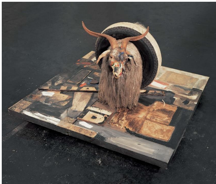
Slika 10: Robert Rauschenberg: „Monogram”, 1959., kombinirana slika: ulje i kolaž s predmetima, 106,7 x 161,3 x 163,8 cm, ModernaMuseet, Stockholm

Robert Rauschenberg kao jedan od najvažnijih umjetnika u definiranju Pop-art-a. Rauschenberg je koristio svijet kao svoju paletu, koristeći svaki materijal kao sirovinu za svoju umjetnost. Kao primjer se može navesti njegovo djelo „Monogram” (1959.). (H. Harvard Arnason, 2009.; 484) Njegovo korištenje i ljubav prema običnim predmetima masovne proizvodnje, dolazi do izražaja upravo s ovim djelom. Ovdje dolazi do miješanja visoke umjetnosti ulja na platnu sa skulpturom i kolažom. Taj spoj je nazvao combine, u prijevodu kombinacija. Njegov cilj je bio raditi u „praznini između umjetnosti života”, kako bi pronašao točku gdje se dodiruju ili stapaju. Upravo tim ciljem je sažeo bit pop-arta. Njegov opus spada pod neodadaizam, Pop-art i apstraktni ekspresionizam, ali ovaj rad najbolje ujedinjuje sva tri smjera. Kao inspiracija za rad „Monogram” mu je bio Duchamp i njegovi ready –madeovi i Schwittersov koncept „Merza”. (W. Gompertz, 2019; 296) Djelo je prepuno simbolike i anegdota, počevši od samog naziva. Monogram inače označava kombinaciju povezanih slova koja predstavljaju nečije inicijale, u ovom slučaju govori se o umjetniku.