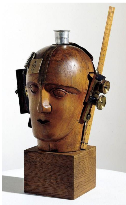
Slika 6: Raoul Hausmann, „Duh našeg vremena“, 1919., drvo, koža, aluminij, mjed i karton, 32,1 x 22,9 cm, Musée National d'Art Moderne, Pariz