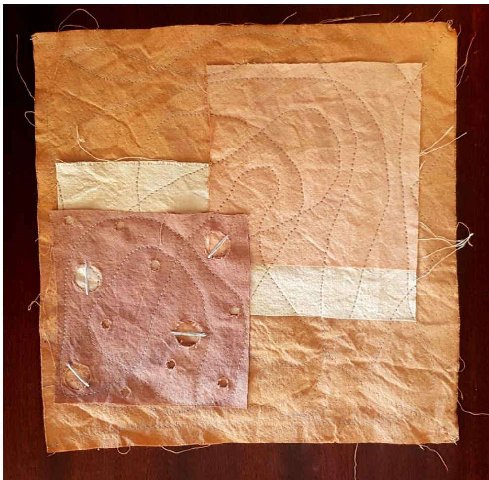
Slika 21 primjer likovnog rješenja

Ovaj rad sačinjavaju osnovna podloga i tri pravokutnika koji su različitih boja, a kao cjelina tvore slojevitou kompoziciju. Zasebni pravokutnici su za podlogu pričvršćeni slobodnim prošivanjem na šivaćoj mašini s koncem u svjetlo plavoj boji. Kvadrat u najtamnije obojenom tonu na sebi sadrži perforacije različitih promjera, a perforacije sa najvećim promjerom kružnice na sebi sadrže linije koje su ručno izvezene. Karakteristike ovoga rada su slojevitost materijala, odnos između toplih tonova te kontrast s hladnim tonom konca.