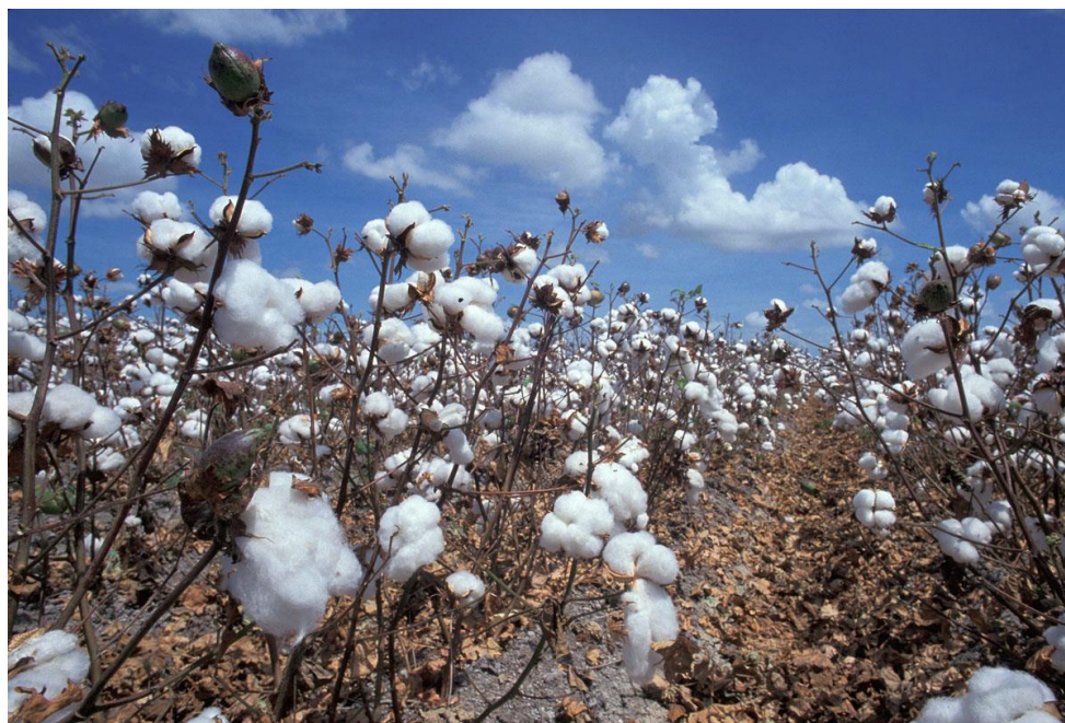
Slika 14: prikaz pamuka

U svrhu ovoga rada, korištena je pamučna tkanina. Pamuk je najšire i najviše upotrebljavano tekstilno vlakno te jedna od najvažnijih sirovina za izradu tekstilija za raznovrsna područja uporabe. Unatoč razvitku brojnih novih vrsta vlakana izvrsnih svojstava, milijuni ljudi diljem svijeta oblače se u pamučnu odjeću i svakodnevno koriste ugodne pamučne tekstilije. Povijesni izvori govore da najstariji pamučni tekstil potječe čak iz vremena oko 5800. g. pr. Kr. U to su vrijeme datirani ostaci pamučnih čahura i tekstila pronađeni u jednom nalazištu na tlu današnjeg Meksika. Vrlo stari nalazi vezani uz korištenje pamuka pronađeni su i u Južnoj Americi na području današnjem Perua te na sasvim drugom dijelu svijeta, na području današnjeg Pakistana (datirani u razdoblje 3000- 2800. g. pr. Kr.). U Europi je pamuk poznat tek od srednjeg vijeka. Ovamo su ga iz sjeverne Afrike, preko Sicilije, donijeli Arapi u 10. st. Danas se pamuk uzgaja u oko 75 zemalja svijeta na svim kontinentima, a najveći proizvođači su Kina, SAD, Indija, Pakistan, Uzbekistan i Turska. Tih šest zemalja proizvodi oko \frac{3}{4} ukupne količine pamuka u svijetu. 23