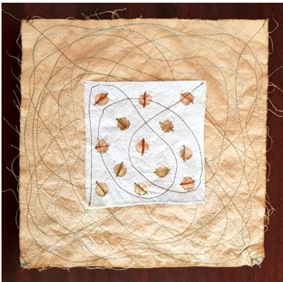
Slika 20: primjer likovnog rješenja

Rad je načinjen od dva sloja: podloge i kvadrata na sredini kompozicije. Podloga je crveno ružičaste boje izvezena slobodnim prošivanjem na šivaćoj mašini s koncima u plavoj i tamno zelenoj boji. Tekstilni kvadrat koji je centriran na sredini rada je u hladnom tonu i također je izvezen na šivaćoj mašini. Na sebi ima perforacije istih promjera preko kojih su linije u crvenoj i zelenoj boji. Likovne specifičnosti ovog rada su suptilni odnosi između toplih i hladnih tonova, vez kao linijski element i slojevitost.