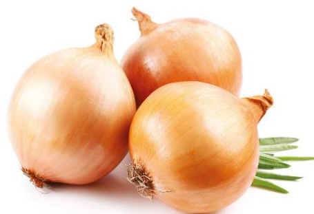
Slika 25: Crveni luk ( https://www.konzum.hr/web/products/luk-crveni9 )