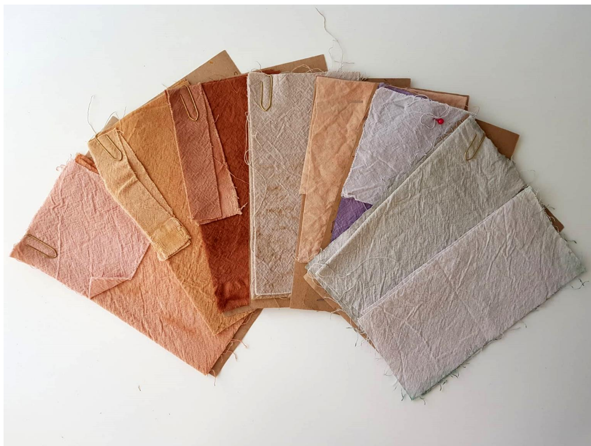
Slika 31: prikaz bojadisanih uzoraka prirodnim bojilima

Prilikom istraživanja u svrhu ovoga rada, pamučni materijal zbog svoje morfološke građe i afiniteta prema prirodnim kiselo-močilskim bojilima, poprima vrlo svijetle tonove i nijanse. Ovakav tip obojenja svrstava se u skupinu tercijsara, što znači da nemaju jasnu kroma (zasićenost). Obojenje uvelike ovisi i o stanju biljke. Može se zaključiti kako ista biljka daje različiti ton obojenja sukladno i tome da li je svježija ili osušena. Upravo ova karakteristika je specifična i posebna jer svaki uzorak je unikatno obojen. Da bi se istaknuo vez na uzorcima, te tako asocijalo na etno motive šlinge, na materijalu će se intervenirati vezom koncima koji su zasićenijih tonova u odnosu na podlogu- tekstil. Tako će se naglasiti vez, podloga koja je svjetlijih pastelnih tonova i perforacija.