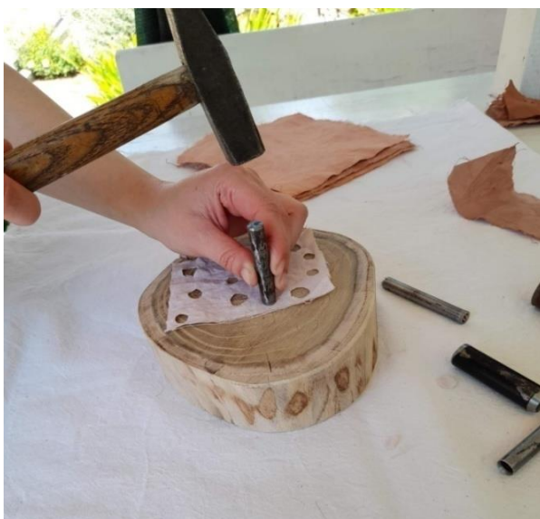
Slika 16: prikaz izrade perforacije