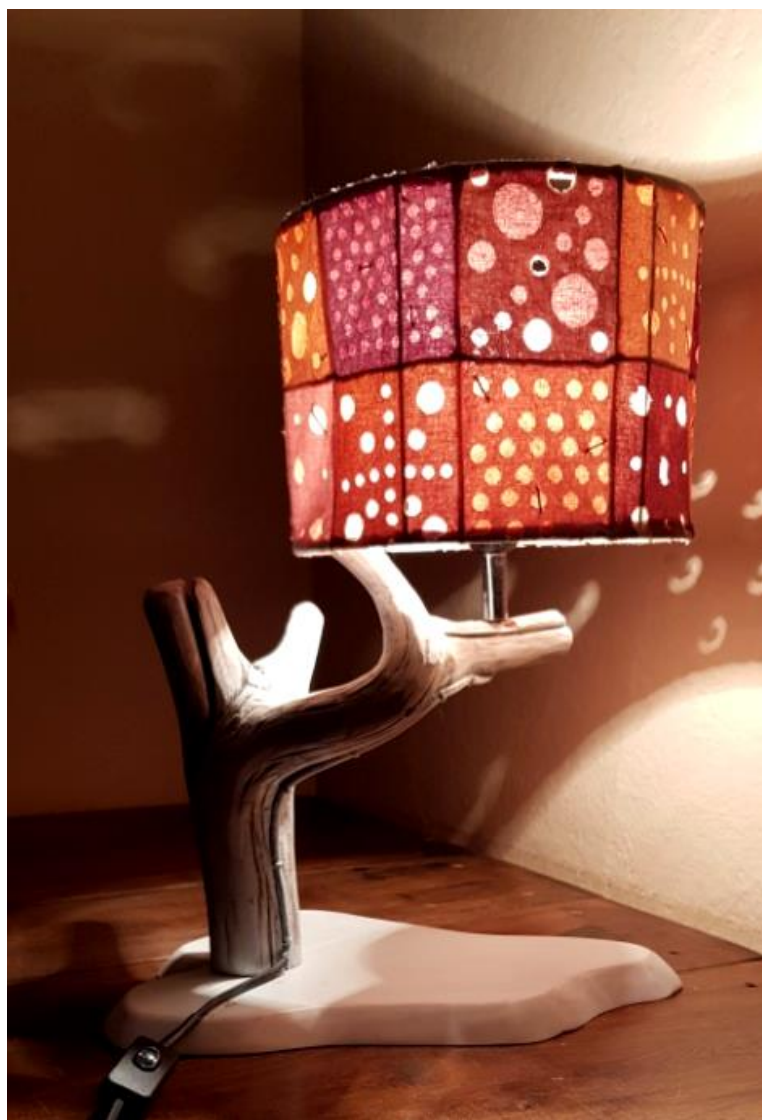
Slika 23: prikaz lampe

Podloga i postolje za lampu izrađeni su ručno od prirodnog drveta. Podloga je od drveta šljive, a postolje od drveta hrasta lužnjaka. Drvo je obrađeno tehnikom šmirglanja te tonirano bijelim pajcem kako bi se vidjela tekstura drveta. Svijetla boja postolja za lampu je odabrana kako bi se istaklo sjenilo. Konstrukcija za sjenilo izrađena je od žice i kružnog je oblika. Sjenilo je načinjeno patchwork tehnikom, odnosno, spajanjem više slojeva pravokutnih komada tekstila. Na pojedinim dijelovima, tekstil je potpuno probušen kako bi svjetlost mogla nesmetano prolaziti kroz sjenilo i tako u prostoriji stvarati poseban efekt.