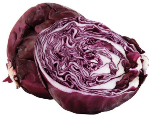
Slika 26: Crveni kupus

Od kora drveća korištena je kora stabla crnog oraha (lat. juglans nigra L.) koja je prikupljena od već otpalih ostataka stabla koje je uvenulo i ne razvija se više. Ovdje je važno naglasiti kako je ključno iskoristiti otpad biljaka iz prirode koje su nekim drugim čimbenikom prestale se razvijati kako se ne bi narušilo zdravlje same biljke ili drveta. Ekstrahirana kora drveta je tekstilnom pamučnom materijalu dala vrlo svjetlo bež obojenje. Istražena je i mogućnost bojadisanja jezgrom drveta šljive (lat. prunus domestica ) koja je dala izvanredno obojenje. Na pamuku je dobiveno svjetlo crveno do ružičasto obojenje. Do ideje bojadisanja ovom biljkom, autorica je došla sasvim spontano uočivši kako ostatci od obrade drveta šljive imaju narančasto crvenu boju (slika 19.)