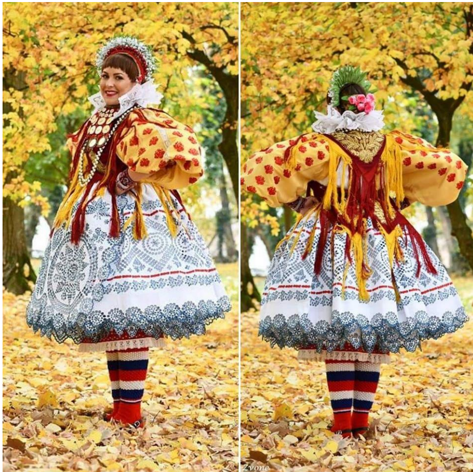
Slika 3: Primjer bizovačke narodne nošnje (preuzeto sa: https://siscia.hr/bizovackanarodna-nosnja/ )

Nošnja bizovačkog kraja je postala toliko prepoznatljiva da se već na prvi pogled može okarakterizirati kao izvorna bizovačka narodna nošnja. Kako je i sama specifična, mnogi ju svrstavaju u posebne tipove narodne nošnje. Iz ovog tradicijskog ruha mogu se izdvojiti tri najosnovnije značajke. Tu ponajprije pripadaju škrobljeni, uštirkani platneni skuti koji su vidljivo kraći u odnosu na ostale primjere slavonskih svečanih ruha. Ovo je prva karakteristika koja ovaj tip nošnje izdvaja iz mase ostalih. Donji dio ruha se sastoji od više slojeva što čini ruho vrlo raskošnim i širokim. Sveopće poznata značajka ovog ruha je svakako bušeni vez, ili šlinga. Šlinga je vezana za sve predjele panonske Hrvatske, ali je posebno svojstvena bizovačkom tipu narodne nošnje. 11