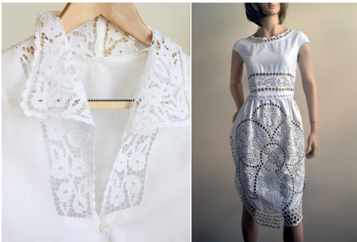
Slike 8 i 9: Etno butik Mara , http://etnobutik-mara.com/hr/proizvodi/22/zenska-odijeca?page=4