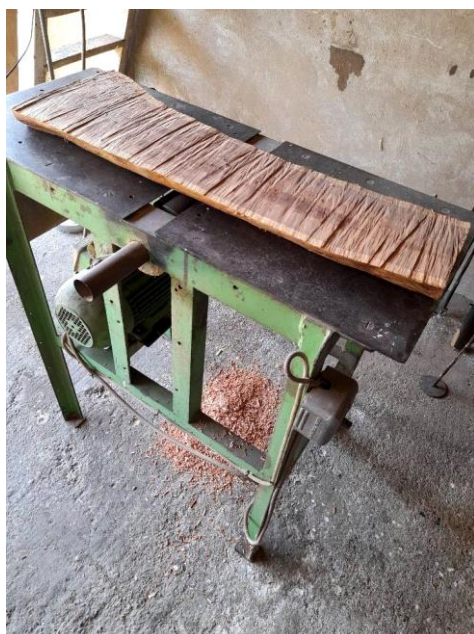
Slika 27: prikaz obrade drveta šljive

Od kora drveća korištena je kora stabla crnog oraha (lat. juglans nigra L.) koja je prikupljena od već otpalih ostataka stabla koje je uvenulo i ne razvija se više. Ovdje je važno naglasiti kako je ključno iskoristiti otpad biljaka iz prirode koje su nekim drugim čimbenikom prestale se razvijati kako se ne bi narušilo zdravlje same biljke ili drveta. Ekstrahirana kora drveta je tekstilnom pamučnom materijalu dala vrlo svjetlo bež obojenje. Istražena je i mogućnost bojadisanja jezgrom drveta šljive (lat. prunus domestica ) koja je dala izvanredno obojenje. Na pamuku je dobiveno svjetlo crveno do ružičasto obojenje. Do ideje bojadisanja ovom biljkom, autorica je došla sasvim spontano uočivši kako ostatci od obrade drveta šljive imaju narančasto crvenu boju (slika 19.)