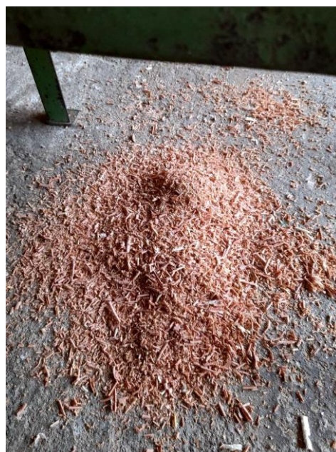
Slika 28: ostatci od obrade drveta