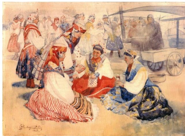
Slika 2: Licitarsko srce, autor: S.Tormelin, akvarel 1923. g., Etnografski muzej u Zagrebu

Tip ruha u čijem se konstrukcijskom sastavu najviše nalazi šlinga je i bizovački tip ruha ili bizovačka narodna nošnja. Prvi poznati zapis o bizovačkoj nošnji, točnije o oglavlju udatih žena, objavio je Baltazar Bogošić još 1874. godine. Već se iz tog kratkog zapisa može naslutiti da je bizovačka nošnja tog vremena bila svojstvena širem području za ono što će biti u 20.st. kada će promijeniti izgled i svesti se na četiri sela. Pola stoljeća kasnije, između dvaju svjetskih ratova, bizovački će tip tradicijskog ruha ponovno privući pažnju, što je posebno zanimljivo, slikara. Tako će poznati, iako zanemareni, hrvatski slikar Slavko Tomerlin, koji je inače bio zaokupljen temama iz seoskog života, 1923. godine naslikati ulje na platnu „Licitarsko srce“ te isti prizor u akvarelu manjeg formata, koji prikazuje skupinu ženskih likova u bizovačkom tipu nošnje. 8 Već i u samoj prošlosti, narodna nošnja i tradicija, su bili inspiracija umjetnicima.