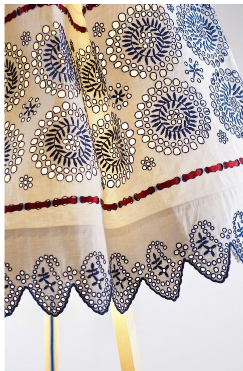
Slike 6 i 7: rasvjetni objekt i bizovačka narodna nošnja