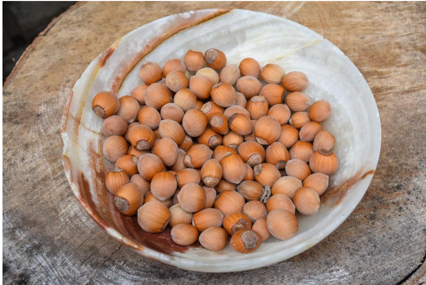
Slika 29: plod lješnjaka

Nadalje, napravljen je eksperiment s ostacima ljsaka od lješnjaka (lat. coriylus avellana ) koje je listopadno stablo iz porodice breza. Kako na području Brodsko-posavske županije postoje mnoge nasadi lješnjaka, odnosno, obiteljsko poljoprivredna gospodarstva koja se bave uzgojem lješnjaka , autorica je došla do ideje kako bi se ostaci lješnjaka (ljuske), koje se obično bacaju ili pale, mogli iskoristiti u svrhu bojadisanja. Provedeno je istraživanje i rezultati obojenja na pamuku daju svijetlo smeđe tonove.