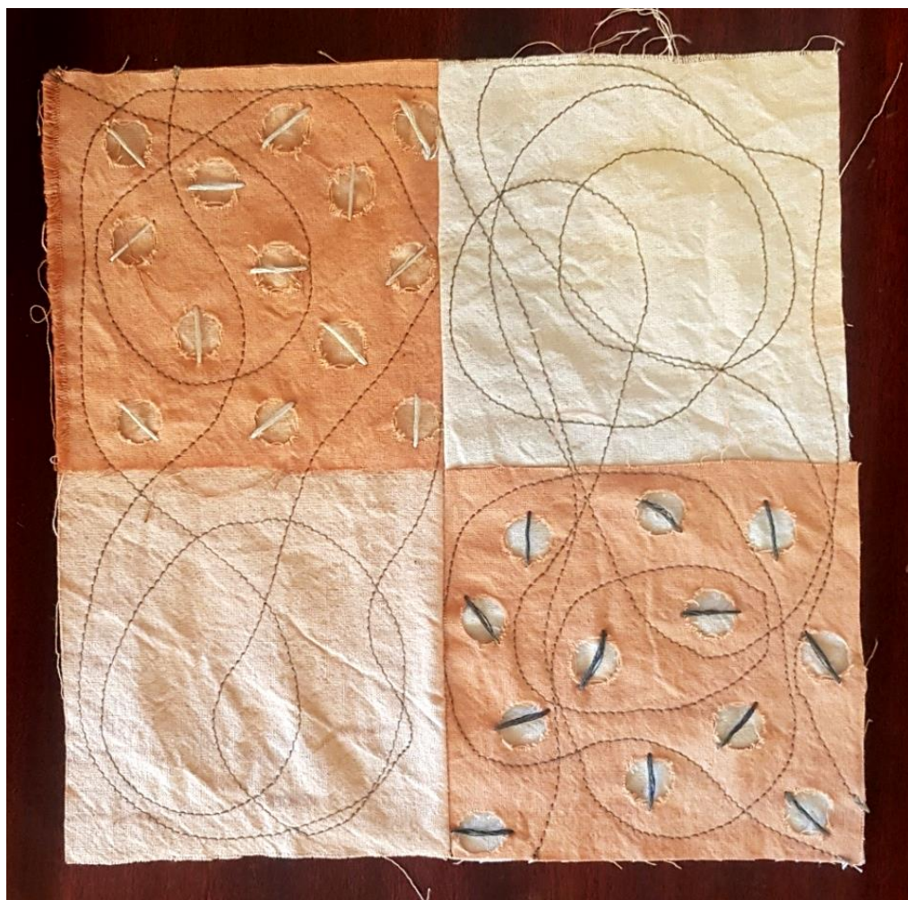
Slika 22: primjer likovnog rješenja

Rad je načinjen iz četiri dijela koja su spajana u patchwork. Tekstilni kvadrati međusobno su spajani slobodnim vezom na šivaćoj mašini. Kvadrati su perforirani kružnicama istih promjera i na njima su izvezene linije u svjetlom i tamnom tonu konca za vezenje. Na ovom radu ističe se odnos između toplih i hladnih tonova podloga i konca te slojevitost materijala.