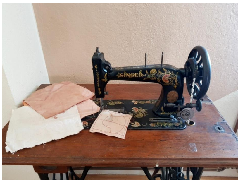
Slika 18: prikaz šivanja na šivaćoj mašini