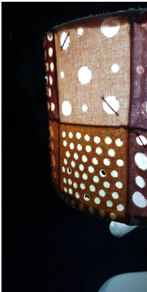
Slika 32: prikaz detalja sa lampe

Realizacija likovnih rješenja provedena je kroz neke od osnovnih likovnih elemenata te kroz slojevitost i slobodnu kompoziciju. Jedan od njih je linija koje se u ovoj realizaciji međusobno razlikuje po svome toku ili karakteru, odnosno, debljini, dužini i jednolikosti. Linija će biti prikazana kao ručni vez sa koncem za vezenje te prošivanje na šivaćoj mašini. Sljedeći element je kružnica koja je pravilnog promjera različitih veličina, a dobiva se bušenjem tekstilnog materijala pomoću alata. Perforacije na tkanini predstavljaju odnos između šupljine i tkanine, a ujedno simboliziraju i šlingu. Boje tkanine- podloge su pastelnih tonova, a boja konca za vezenje je tamnijih tonova u odnosu na podlogu. Za realizaciju predmeta od tekstila odabrano je sjenilo za lampu i tekstilna knjiga. Pošto su ispitivanja bojadisanih uzoraka prirodnim bojilima pokazala kako postojanost na pranje i Sunčevo svjetlo nije zadovoljavajuća, odabrani su predmeti koje nije potrebno prati te neće biti izravno izložena Sunčevim zrakama.