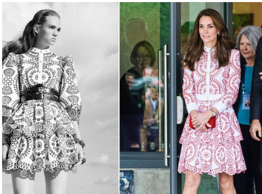
Slika 5: Alexander McQueen, Resort 2017.

Perforacija, prema latinskom perforare : probušiti, bio bi svaki rezultat bušenja, probijanja ili provrtanja, koja u konačnici čini niz rupa na nekoj materiji. 14 Šlinga, kao dio tradicijske kulture, izvrstan je primjer odnosa između perforacije i tekstila. U nastavku će biti prikazani mnogi današnji dizajneri i umjetnici koji su inspiraciju pronašli u tradiciji, odnosno u šlingi. Jedan od tih kulturalnih agenata je i odjeća. Moda i stil su vrlo samosvjesni i vidljivi elementi te njihovo postojanje ovisi o površinskoj prezentaciji, zadovoljavajuće dubine značenja koje oni nose su skrivene i zamaskirane ispod te vidljive trivijalnosti. 15 Odjeća kao pojavnost, u svakom svom obliku, ima svoju dubinu i dublje značenje. Ono što tu odjeću čini vitalnom je inspiracija koju je sam kreator imao dok ju je stvarao. Prilikom posjeta Kanadi, vojvotkinja od Cambridgea pojavila se u haljini dizajnera Alexandra McQueena. Lijevo na fotografiji prikazan je haljina u originalu, a desno prilagođenu verziju za Kate Middleton. Haljina na sebi sadrži motive bizovačke šlinge, odnosno motive cvjetova bazge koji su, prema tradiciji, bili osnovni motiv za izradu motiva i sheme za šlinganje.