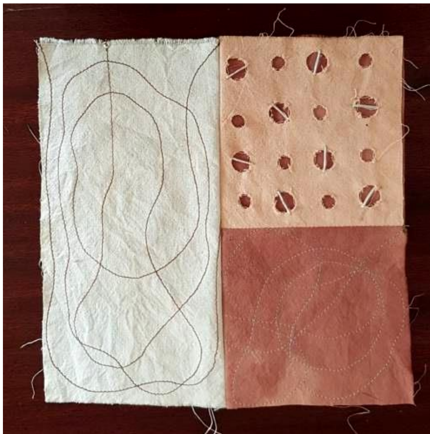
Slika 19: primjer likovnog rješenja

Rad je sastavljen od tri kompozicije u tri boje patchwork tehnikom. Lijeva polovica rada nastala je slobodnim prošivanjem na mašini tamno smeđim koncem kako bi se naglasio vez u odnosu na podlogu koja je svjetlo plave boje. Desna polovica načinjena je iz dva dijela, donji koji je ujedno i podloga tamnije nijanse i gornji sloj na kojemu su perforacije s dva različita promjera kružnice. Sljedeći bitan element su intervencije ručnim i strojnim vezom u svjetlijem tonu konca u odnosu na podlogu. Rad karakterizira odnos između hladnih i toplih tonova boja, igra pozitivna i negativna te slojevitost u korištenju materijala, likovnih elemenata i tehnika.