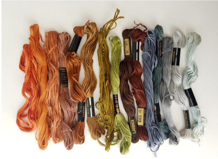
Slika 17: primjer konaca za vez

Za ručni vez na tekstilu je odabrana je pređa namijenjena za vez i goblene. Sirovinski sastav pređe je 100% češljani pamuk. Pređe su uglavnom u zagasitim zemljanim tonovima kako bi se vez istaknuo na tekstilu koji je pastelnih prirodnih tonova. Za šivanje na šivaćoj mašini korišten je konac namijenjen za strojno šivanje.