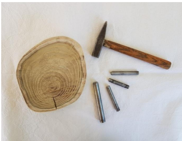
Slika 15: alat za izradu perforacija

Izrada perforacija na tkanini provedena je uz pomoć metalnih šupljih cijevi, različitih promjera, koje prilikom udarca čekićem tvore perforacije na tkanini.