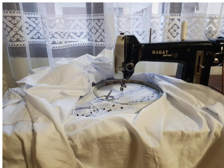
Slika 1: Prikaz izrade šlinganog stolnjaka na šivaćoj mašini

Muška nošnja je također bila izvezena šlingom i to stariji primjerci iz 19. stoljeća. 6 Tijekom 20 stoljeća u Štitaru i Bošnjacima pojavile su se platnene bijele šlingane marama, te ih Županjke nisu nosile često, već u specifičnim prigodama. Od druge polovice 19. stoljeća razvija se noviji oblik ruha koji je bio namijenjen svečanim prigodama. Vrijednost ruha ogleda se u tome da su korištene fine tvorničke tkanine i najkvalitetnijim vezom su vezene, u koje svakako spada i šlinga. To je vrsta bijelog veza čija je karakteristika bušenje, rezanje ili perforiranje tekstila nakon čega se rubovi obrađuju vezenjem s koncem. Ovaj vez se uglavnom izvodio na domaćem bijelom platnu, najprije od lanenong, a kasnije, posebno tijekom 20. stoljeća, i od pamučnog materijala. 7 Najzastupljenije boje za obradu perforacija su bijela i plava. Prvotno se ovaj vez izrađivao ručno, a već prvom pojavom mašina za šlinganje, sam se proces bitno ubrzao. Ova tehnika spada u kategoriju „vezova po pismu“, zajedno sa tehnikama toleda, sviloveza i zlatoveza. Vez po pismu podrazumijeva prethodno pripremljene podloge sa skicom koje se preslikavaju na tkaninu. Tradicionalan način ocrtavanja mustri i dezena na platno naziva se fodrukovanje . Točnije, na prozirnrom papiru se izrađuje željeni dezen nakon čega se, prema mustri, papir izbada fodrukom ( stroj za izradu rupica ). Da bi se dezen uspješno preslikao na platno ili tkaninu, pomoću spužvice i plave boje u prahu (plavila) motiv se oslikava na materijal.