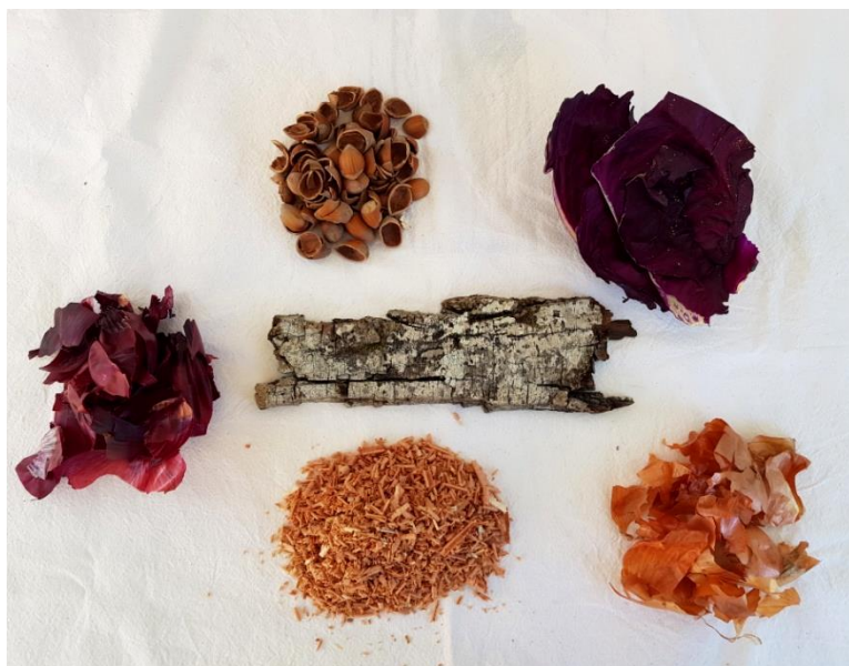
Slika 13: primjer biljnih materijala za bojadisanje

Autor se u ovom istraživanju odlučio za pred obradu i fiksiranje tkanine u kiselom mediju, točnije u kupelji alkoholnog octa i vode (9%) u omjeru 1:4. Ovaj način pred obrade tkanine prije bojadisanja iste omogućuje bolje migriranje bojila između vlakana te se produljuje kvaliteta i postojanost boje.