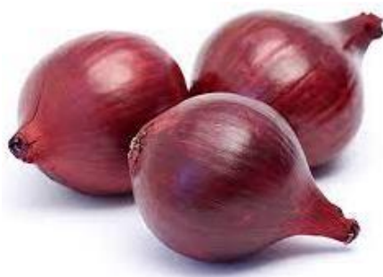
Slika 24: Ljubičasti luk

Prilikom realizacije ovog završnog rada korištena su prirodna bojila koja su u autorici probudila veliku zainteresiranost i želju da istraži mogućnosti bojadisanja prirodnim bojilima. Sve biljke koje su korištene su karakteristične za područje Slavonije koja je ujedno i simbol „velik žitnice“. Posebno je zanimljivo kako se za bojadisanje tkanine mogu iskoristiti otpadci raznih biljaka iz kućanstva, koje se konkretno koriste u kuhinji, sve do onih koje možemo naći u prirodi. Bitno je naglasiti kako je, za bojadisarska svojstva pigmenta koji se ekstrahira iz biljaka, važan podatak koji dio biljke se ekstrahira, da li je osušena ili svježa i sl. Među prvim biljkama u istraživanju su korištene ljuske od crvenog i ljubičastog luka (lat. allium cepa ) koje zasigurno svako kućanstvo ima kao bio otpad. Bojadisanje ovim biljkama se pokazalo vrlo uspješnim i zadovoljavajućim za daljnju realizaciju. Nadalje, korištena je i povrtna biljka crveni kupus (lat. brassica oleracea ) koja je također pokazala zadovoljavajuće rezultate. Samo obojenje kupelji je tamno ljubičaste do indigo boje, a obojenje poprimljeno na tkanini je plavozelene do ljubičaste boje.