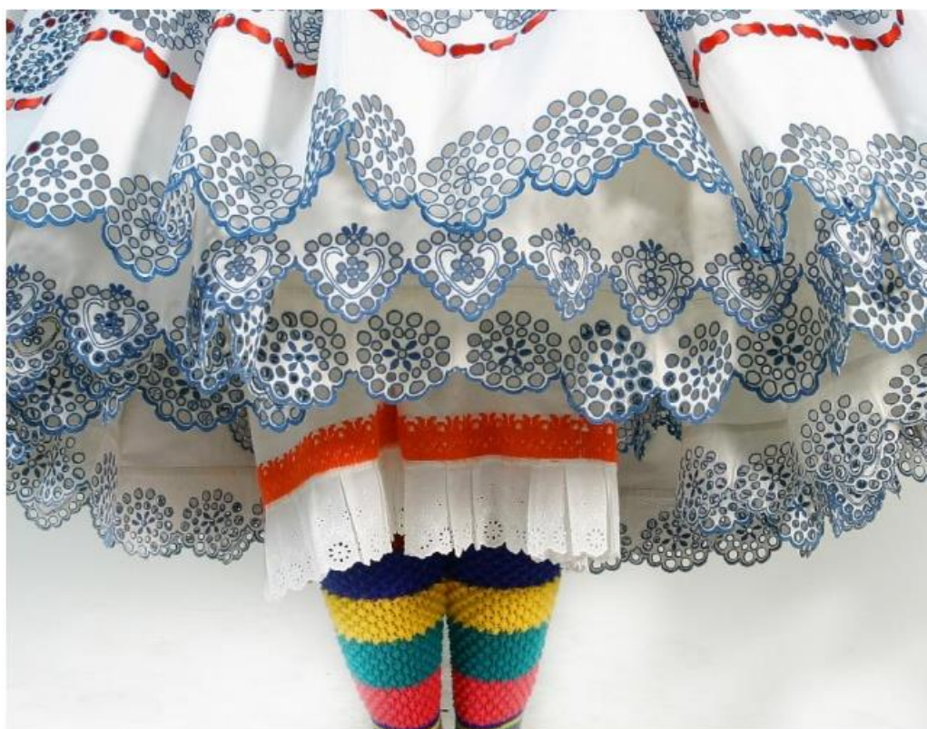
Slika 4: Kričica i šlingeraji , snimljeno u Brođancima 2007.g.

Na šlingerajima, suknji, i kecelji šlinga se izvodi tako da se pomoću kalupa- modela s cvjetnim ili geometrijskim uzorkom bojom otiskuje uzorak na platnenu podlogu, zatim se platno, prema dezenu, obreziva te opšiva gusto jedanput. Nakon što se to učini na svakoj rupici otisnutog motiva, izvodi se završno šlinganje bijelim ili plavim pamučnim koncem. Starije bizovačko šlinganje izvodilo se bijelim šlingvulom, približno od 1910. godine kada je u Bizovac došao bračni par učitelja- Fredo i Antonija Frlolich. 12 Učiteljica je kroz nastavu podučavala žene i djevojke raznim vrstama ručnog veza, pa tako i šlinganju. Poslije Prvog svjetskog rata počelo se šlingati plavim koncem postojeće boje koja se nije razlijevala prilikom pranja i iskuhavanja. 13 Ova doduše mala promjena, učinila je bizovačku nošnju manje decentnom i profinjenom, te je došlo do izražaja bogatstvo perforacija na materijalu, odnosno obilje šupljikavog veza, po čemu je i danas bizovačko ruho zaštitni znak tog područja. Šlingane suknje i svileni oplećci bili su namijenjeni isključivo za djevojke i mlađe žene od približno trideset pet godina