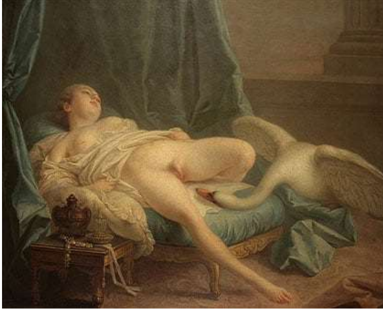
Slika 14. Francois Boucher, Leda i labud (1740)

ono što je razuzdano i uvredljivo, tj. 'pornografsko', i ono što je prihvatljivo i estetski ugodno ili 'umjetničko', nikad nije izravno jer značenja pornografije i umjetnosti dosta variraju.