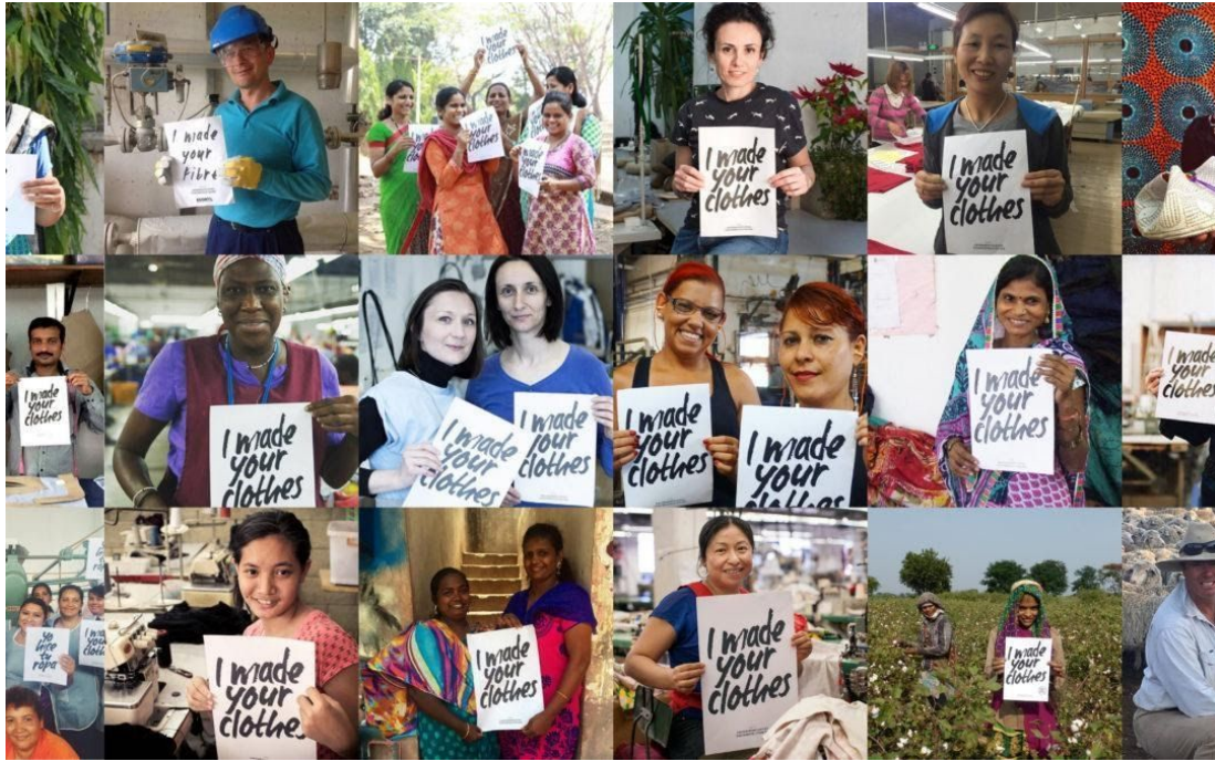
Slika 1 - Prikaz inicijative #whomademyclothes osnovane od strane Fashion Revolution-a, gdje su se radnici koji rade u proizvodnji odjeće slikali s natpisom I made you clothes u svrhu privlačenja pažnje potrošača gdje se proizvode artikli koje koriste