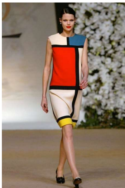
Sl. 4, Yves Saint Laurent, kolekcija Mondrian