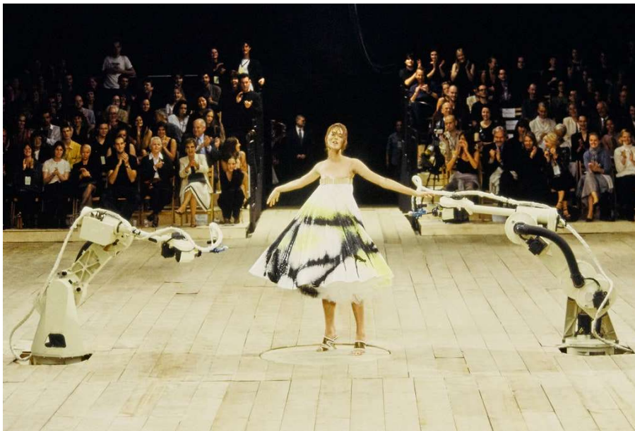
Sl. 3 , Alexander McQueen, proljeće/ljeto, 1999.

Kolekcija jesen/zima 2020. modne kuće Balenciaga, dizajnera Demne Gvasalia također se može istaknuti kao izvedbena umjetnost. Osim što bi samu modnu kolekciju neki nazvali umjetnošću, ono što je ovu reviju učinilo još posebnijom, bio je trenutak kada su ljudi u publici shvatili da su prva dva reda u zamračenoj dvorani preplavljena vodom. Modeli u pretežito crnim, mračnim kreacijama hodali su kroz poplavljenju pistu, a iznad njih se nalazila projekcija apokaliptičnog neba, mora i vatre.