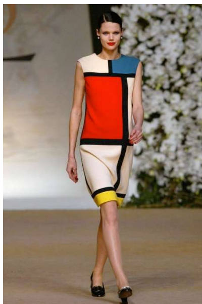
Sl. 4, Yves Saint Laurent, kolekcija Mondrian