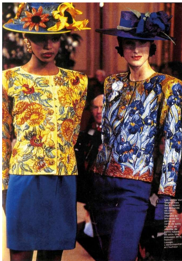
Sl. 5, Yves Saint Laurent, kolekcija proljeće 1988.