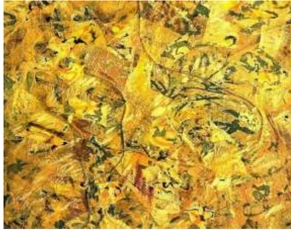
(slika br. 4, Jackson Pollock, 'Number 2', 1951)