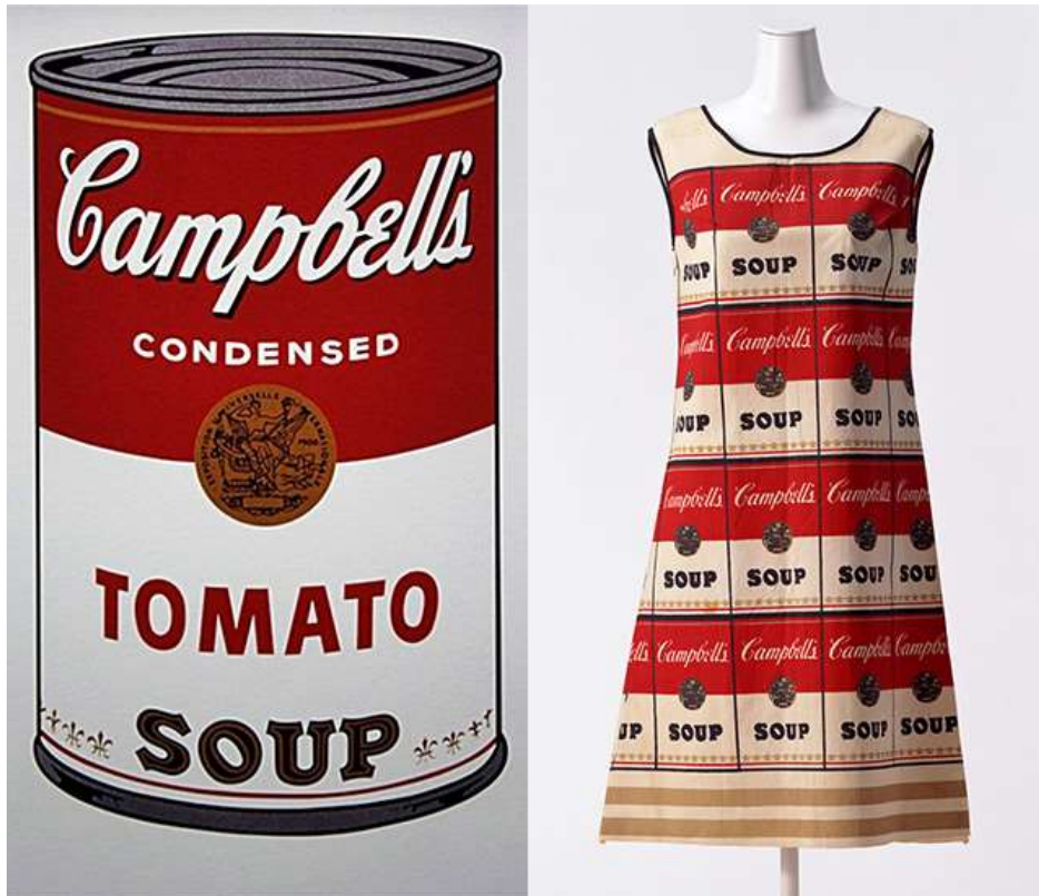
(slika br. 9, haljina prema Warholovoj slici, 1965.)

Dizajner modne kuće Moschino, imena Jeremy Scoot svojim kreacijama iz sezone u sezonu neprestano nas vodi u pop-art dimenziju. Njegov rad je nevjerojatno sličan Warholovom. Kolekcije su mu jako zabavne, koristi svoj logotip kao printeve na odjeći i torbama, šarene jarke boje i nespojive dezene. Za kolekciju AW 2009 manipulirao je sveprisutnim logom Coca-Cole koji je spajao s vjerskim riječima. Printevi se protežu kroz cijelu kolekciju kao glavni motiv na haljinama, majicama i puloverima u kombinaciji sa suknjama i hlačama od umjetne lakirane kože. Na toj kolekciji znatno je vidljiv utjecaj pop-kulture, iako na prvu bi se reklo da je to dizajnirao sam Warhol.