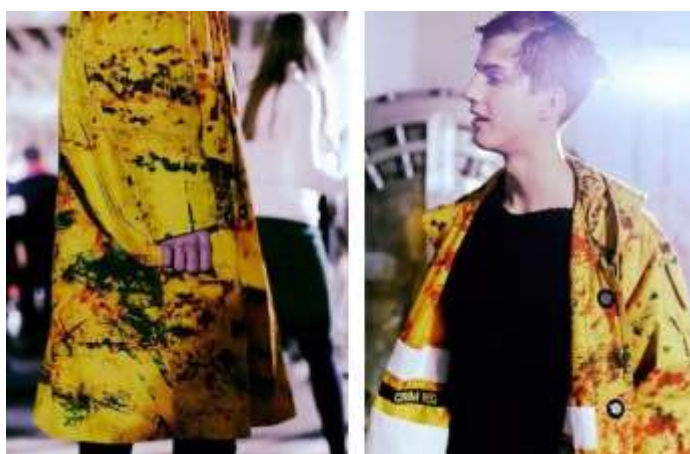
(slika br. 5, Raf Simons, X Ruby Sterling, AW 14 )

Mihara Yasuhiro, Japanski dizajner u kolekciji proljeće/ljeto koristio se ekspresionističkim potezima spontanog razlijevanja boje na svojim modelima. Model koji je vidljiv na slici br. 9 bijele je boje, prošaran s crveno crnim linijama i točkama baš kao na Pollockovoj slici „Untitled“ iz 1948. godine. Koristio je model umjesto platna kako bi prenio poruku publici. Crvena žarka boja, simbol snage u kombinaciji s neograničenim pokretima čine dezen u kojem dizajner ostavlja vlastiti rukopis, baš kako što su i slikari ostavljali na svojim djelima.