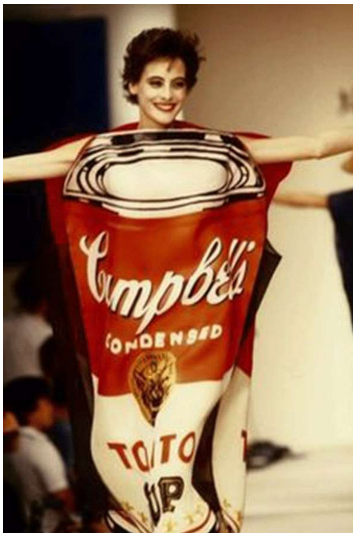
(slika br. 8, Jean-Charles de Castelbajc, s/s 1984)

Moda i umjetnost su jako utjecale na produkte u dizajnu i nijedan umjetnički pravac nije imao tako snažan utjecaj na komercijalni dizajn kao pop-art. Pop umjetnici, Andy Warhol, Jasper Johns, Roy Lichtenstein i Robert Indiana okrenuli su svijet umjetnosti naglavačke slikajući svakodnevicu i reciklirajući to kao ironiju – irelevantnu umjetnost. Mega-popularna Andyjeva slika Campbell juhe korištena je kao motiv tj. raport na haljini od papira koju je 1965. tvrtka Campbell iskoristila i producirala. U poslijeratno doba, kada je odjeća bila luksuz, ova haljina je promijenila način na koji su žene tada gledale na kupnju. Bila je doslovno za jedno nošenje, a potom ste je mogli baciti. Koštala je svega 1 dolar, a danas primjerak haljine stoji 7.500 $.