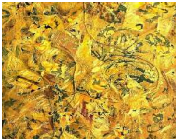
(slika br. 4, Jackson Pollock, 'Number 2', 1951)