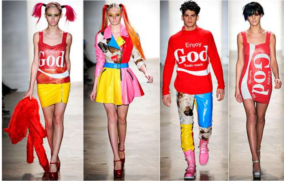
(slika br. 10, Jeremy Scott, jesen/zima, 2011)

Gianni Versace je 1991. godine napravio kolekciju koja sadrži verziju Warholovih “Merlinki”, koja je uistinu učinila umjetnika sinonim za visoku modu. 2008. Diana von Furstenberg izbacila je liniju kaftana i kupaćih kostima koristeći „pop“ boje i ikone portreta. Potom su velike tržišne marke Vans i Supreme 2012. izbacili kolekciju tenisica, majci i pokrivala za glavu također s Andyjevim Campbell juhama. Tu nije bio ni početak a ni kraj Warholovog utjecaja na modu, broj dizajnera koji je koristio njegove radove kao print na svojoj odjeći zapanjujuće je velik. Svaki njegov rad zarazno je mamio, znao je kako pronaći sljedeću stvar koja će zgrabiti ljude. Imao je instinkt i jedinstven talent za vizualizaciju i konceptualizaciju. Bez obzira na to odakle je njegova inspiracija došla, ili što ga je natjeralo na slikanje, jedna stvar je sigurna – njegov utjecaj je i dalje snažan i još uvijek postoji strast prema odjeći nadahnutoj stilom pop-arta.