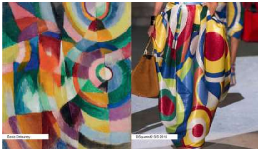
(slika br. 1, lijevo: electric prisms; 1914, desno: Dsquared2 S/S 2015)

Svaka ideja na papiru namijenjena tekstilnoj proizvodnji naziva se kreacijom tekstila. Tako da ako želimo neki uzorak, šaru ili dezen za tkaninu, pletivo ili vez prikazati na papiru, a potom realizirati u materijalu, moramo odrediti njezin raspored ponavljanja s obzirom na čitavu širinu tkanine koju zamišljamo izraditi, kao i visinu samog uzorka. Takav raspored ponavljanja jednog uzorka u odnosu na širinu tkanine zovemo raportom. Dizajn znači crtež ili skica, neka ideja izražena crtežom. Dizajn je umjetničko oblikovanje predmeta za upotrebu, što znači da je dizajn tekstila proces izrade dizajna za tkanine, pletiva i sl. To je proces od sirovine do gotovog proizvoda. Da bismo došli do gotovog proizvoda treba od nečeg krenuti. Prvo nam je potrebna osoba koja će sve to osmisliti (modnog dizajnera), osoba koja će potaknuti na ideju za završni produkt. U ovom slučaju mnogi su dizajneri ideje crpili iz već poznatih umjetničkih djela i uključivali ih u svoje. Tako je i Sonia Delaunay svojom umjetnošću i kreacijama utjecala na rad suvremenih modnih dizajnera. Dobivši ideju na temelju već nastalih radova, u ovom slučaju umjetničkog djela na platnu, to je bilo potrebno realizirati i prebaciti u uporabni tekstilni materijal iskoristiv namjeni odijevanja.