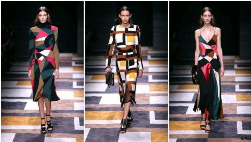
(slika br. 3, Massimiliano Giannetti A/W 2015)

Massimiliano Giannetti za jesen/zimu 2015 kreirao je kolekciju u kojoj je naglasak stavio na dezone više nego na sam kroj haljina. Krojevi su elegantni i ženstveni ali snaga dezone stavlja ih u drugi plan. Kroz cijelu kolekciju protežu se plohe geometrijskih oblika kontrastne boje. Materijali su laganiji, a na nekim modelima i kombinirani s drugom vrstom tkanine gdje se stvaraju nabori. Cijela scena usklađena je s kolekcijom zbog tepiha koji je u dezonu, kao i haljina s kojom je bila zatvorena kolekcija. Zbog kontrasta boja i geometrije na pojedinim dijelovima modeli haljina izgledaju kao da imaju proreze. Igrom rasporeda oblika stvara dojam treperenja koji daje živahnost i slobodu a istovremeno imamo dojam profinjenosti i kontrole. Nužno je dodati da su Sonjini radovi imali velik utjecaj na nastanak ove kolekcije, ali i sam dizajner je to spomenuo u jednom od intervjua s novinarima.