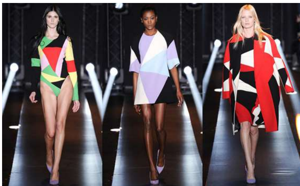
(slika br. 2, Fausto Puglisi, AW14-15 )

Pod utjecajem kubizma i stilskih karakteristika koje obilježavaju taj pravac proizašlo je mnogo ideja za stvaralački rad tekstilnih dizajnera. Sve što u prirodi postoji može se likovno prikazati osnovnim likovima (kocka, kugla, valjak, stožac). U kubizmu je prisutan utjecaj i afričke umjetnosti, a osnova je kocka. Ti svi motivi vidljivi su na sljedećim kolekcijama Fausta Puglicia jesen/zima 2014-2015 i Massimiliana Giornettia za jesen/zimu 2015. Kolekcija Fausta Puglicia bogata je velikim geometrijskim plohamama u kontrastnim šarenim bojama po uzoru na stil i radove Sonie Delaunay. Na svakom modelu vidljivi su crni trokuti koji stvaraju balans među ostalim bojama. Daju dojam profinjenosti i elegancije uz jednostavne krojeve. Fini materijali i boja savršeno su usklađeni i ugodni oku. Svaki komad odjeće priča je za sebe, ali su istovremeno povezani kao cjelina. Koristio se žarkim bojama u kombinaciji s monokromatskim. Oblik kroja također je usklađen s geometrijom, linije su čiste, a krojevi plošni zbog korištenja krutog materijala. Na moderan način u skladu s vremenom uveo je dašak kubizma u modni svijet.