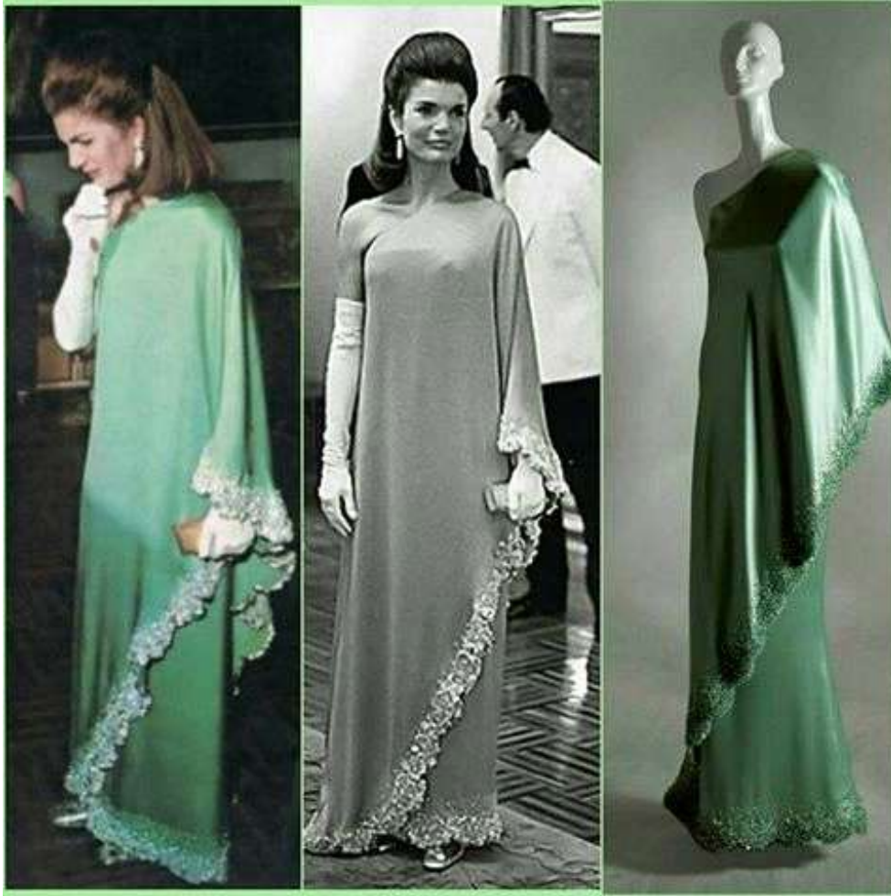
Slika 3. Jackie Kennedy u Valentino kreaciji

Audrey Hepburn je tokom šezdesetih godina blistala u Valentinovim kreacijama, dok se pored nje izdvojila još i Elizabeth Taylor koja je njegovu elegantnu plisiranu haljinu od šifona nosila tokom premijere fima