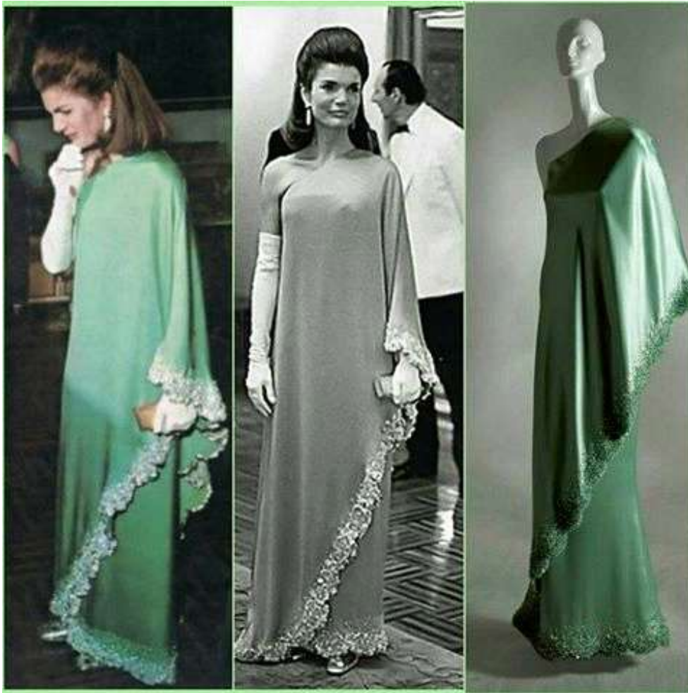
Slika 3. Jackie Kennedy u Valentino kreaciji

Audrey Hepburn je tokom šezdesetih godina blistala u Valentinovim kreacijama, dok se pored nje izdvojila još i Elizabeth Taylor koja je njegovu elegantnu plisiranu haljinu od šifona nosila tokom premijere fima