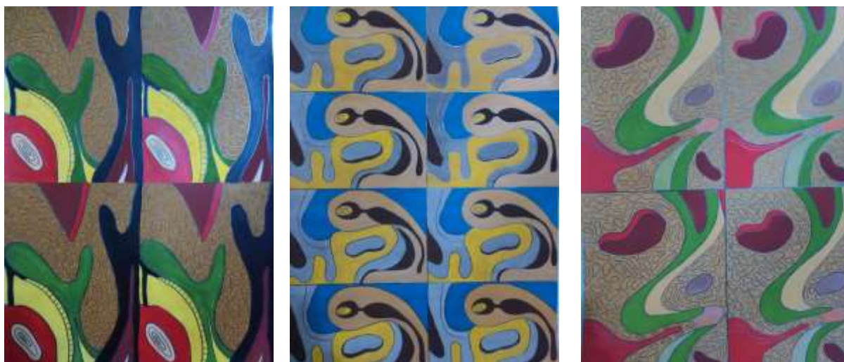
Slika 51: Kreiranje tekstila; Raport.

Iz svega se može zaključiti da svaki umjetnik ima drugačiji utjecaj, a krajnji rezultat je ova kolekcija koja bi se mogla podijeliti u nekoliko skupina prema elementima koji radove unutar njih međusobno povezuju. Karakteristični elementi, koji radove unutar jedne skupine povezuju, a između dvije skupine razdvajaju potječu svi iz istog ishodišta-nadrealizma, su: boja odjevnih predmeta i vrsta (imaginarni prostor) pozadine. Kod svih radova početnu točku je predstavljala modna figura na koju su bez ikakvog prethodnog razmišljanja nizani elementi tj. oblike različitih formi koji bi se kasnije formirali u odjevni predmet. Oblici su obrubljeni tankom crnom linijom (olovkom) koja ih međusobno razdvaja ali ujedno i povezuje u jednu cjelinu. Tijekom stvaranja korištene su različite tehnike: olovka, drvene bojice, vodene boje te različite vrste papira, špaga. Vodenim i drvenim bojama dobiven je volumen a pomoću papira, špage postići reljef i unijeti život u kreaciju. Po završetku izrade modnog crteža uklopljena je pozadina koja se sastoji uglavnom od apstraktnih elemenata. Kao i kod modnog crteža tako i kod pozadine korištena je olovka. Kolekcija je namijenjena mladim individualcima koji se žele isticati te žele biti autentični u ovom svijetu gdje unikatnost ne dolazi do izražaja već svi slijepo prate nametnute trendove