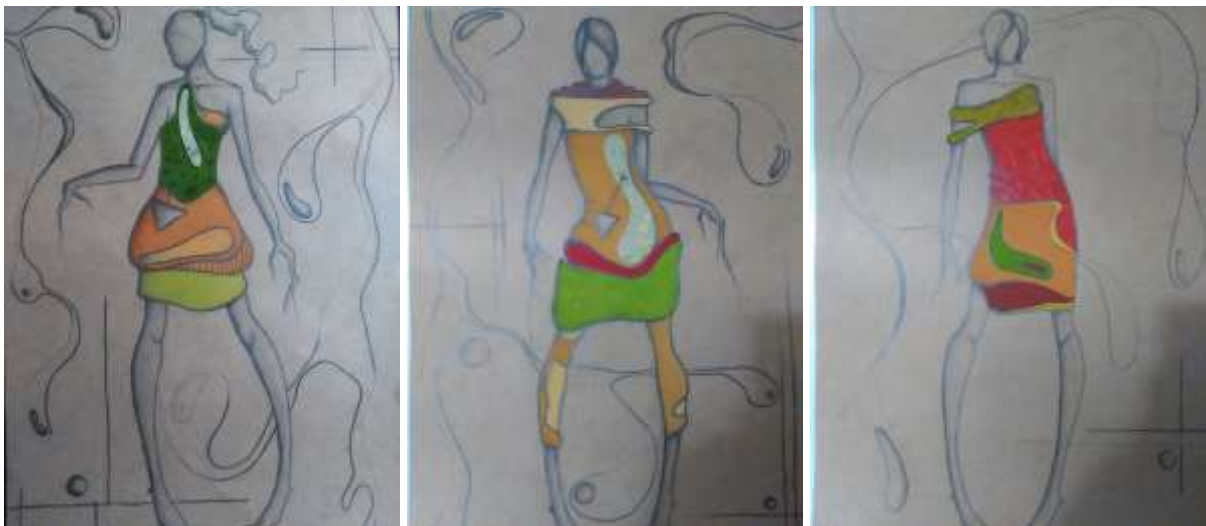
Slika 50: Modni crteži.

Promatrajući njegova djela ulazi se u tajanstven i nadasve privlačan i novi svijet u kojim je fantazija samo početak. A kroz fantaziju jedino možemo doći do onog stvarnog u nama samima, ono što inače skrivamo i potiskujemo. Dovoljno je samo osloboditi i prepustiti se kao što je to učinio Salvador Dali kroz svoje slike. Nespojivi elementi preneseni su u radove uklapanjem modnog crteža, asimetričnim formama, koje su osnovno obilježje slika. Asimetrične forme postignute su na svim modelima, kombiniranjem raznobojnim materijalima, s mnogo zaobljenih linija koje djelomično prate siluetu tijela, a djelomično izlaze iz nje. Korištene su zemljane boje (crvena, oker, zelena, smeđa, žuta...), jer su to boje koje se koriste u većini Dalievih slika. Tijekom stvaranja vodi zanos, a kao posljedica toga dogodilo se automatsko nizanje elementa u uravnoteženu cjelinu čiji su elementi vezani u dragocjenu vezu. Olovka je preuzela potpunu slobodu kretanja bez ikakvog prethodnog analiziranja i usmjeravanja poteza.