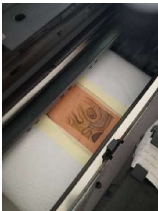
Slika 47: Odjevni predmet u procesu.