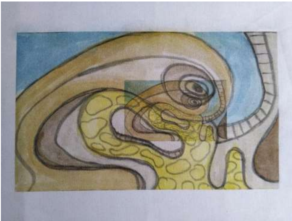
Slika 49: Uzorak; Fiksirani tisak.

Kad je odabrana skica, za realizaciju tehnikom digitalnog tiska, provodi se skeniranje uzorka i pomoću računala koje je direktno spojeno s tiskarskim strojem. Slijedi proces za digitalni tisak. Po završetku tiska slijedi fiksiranje na temperaturi 120°C u vremenu od 2 minute. Procesom fiksiranja završen je odjevni predmet sa željenim tiskom.