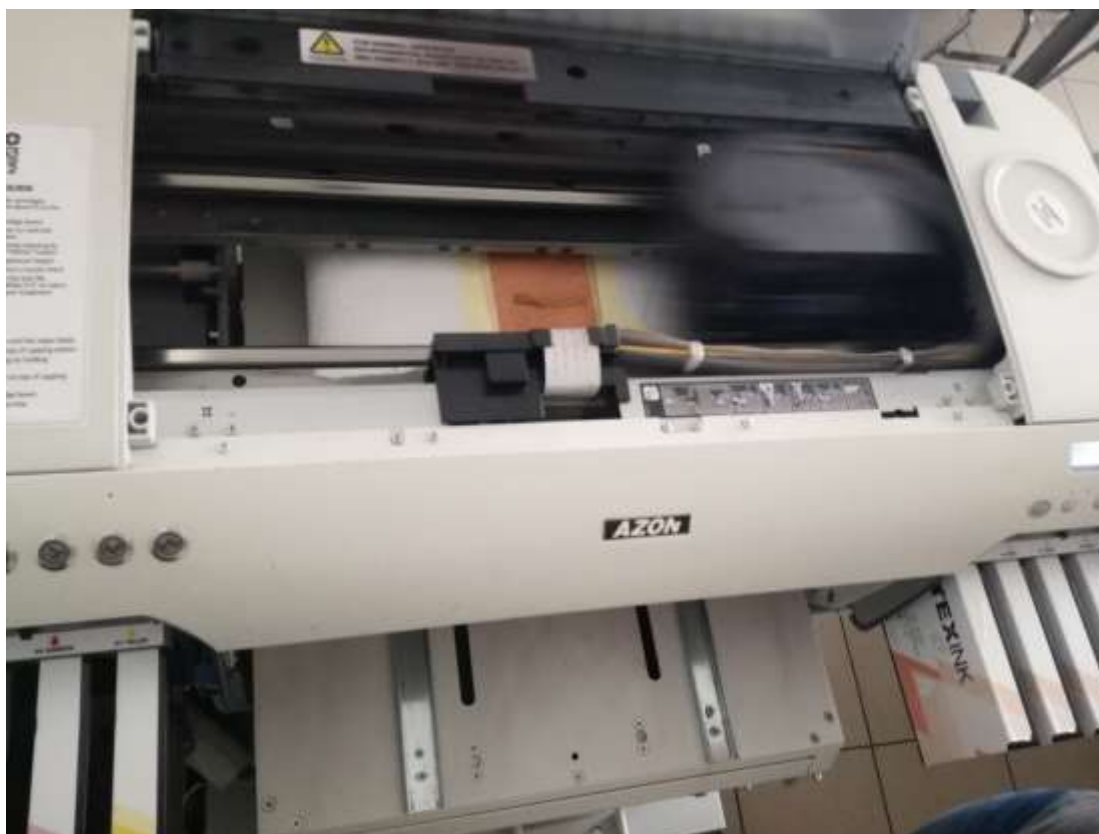
Slika 46: Pripremljen odjevni predmet za digitalni tisak.