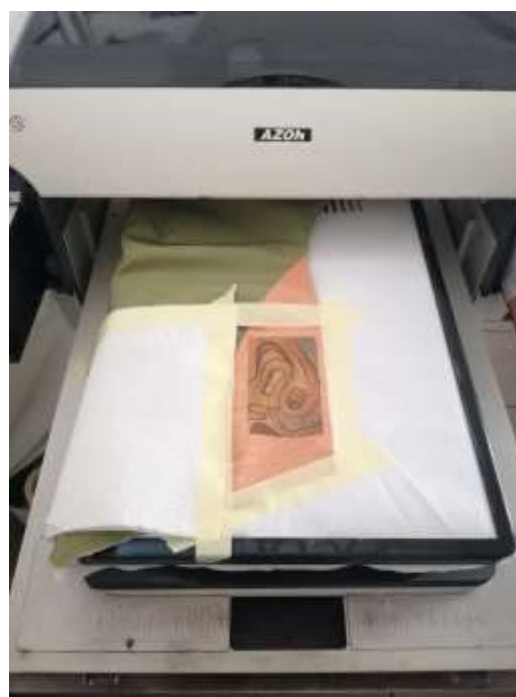
Slika 48: Završen digitalni tisak.