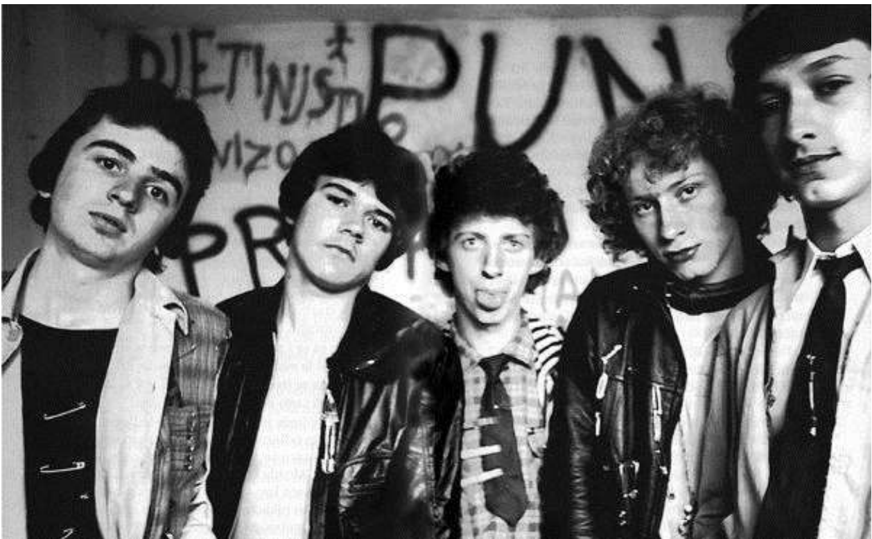
Slika 10.: Prljavo kazalište 1976.

Premda su danas poznati kao rock sastav, Prljavo kazalište isprva svira punk te stilski podsjeća na Sex Pistols. Krajem sedamdesetih u Hrvatsku donose trend "neurednog" , odijevaju raskopčane košulje, kožne hlače te visoke čizme.