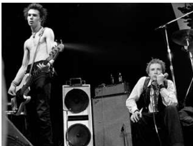
Slika 9.: Sex Pistols na zadnjem koncertu 1978.

Uz Pistole je istih godina vladao još jedan britanski punk bend, The Clash, koji su najpoznatiji po svojem trećem albumu „ London Calling “. Također su održavali punkerski stil. Sex Pistols se raspadaju 1978. godine odlaskom Johnny Rottena nakon što je posljednji koncert završio pjesmom “ No Fun ” vjerojatno sugerirajući na cijeli taj punk način života.