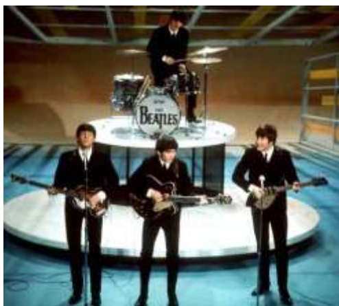
Slika2.: The Beatles u emisiji Ed Sullivana 1964.

Iz crnih odijela ubrzo su prešli na jakne bez ovratnika koje je kreirao Pierre Cardin i koje su ubrzo postale popularne diljem svijeta