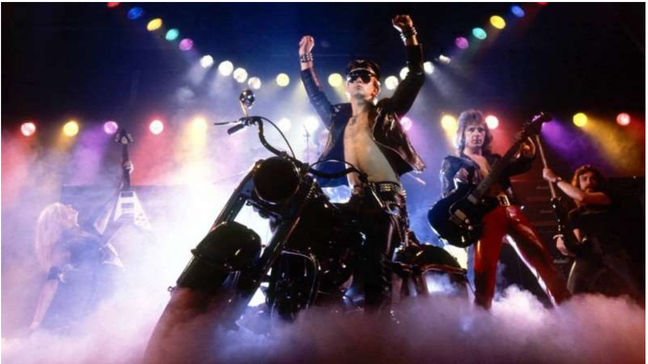
Slika 5.: Koncert Judas Priesta 1979.

Heavy metal postaje najkontroverznijim smjerom te ga se i danas takvim smatra. Tekstovi pjesama zvuče kao horror priče, a mladi naraštaji u želji za što strašnijim izgledom počinju nositi tamnu šminku, leće u bojama pa čak i vampirske zube.