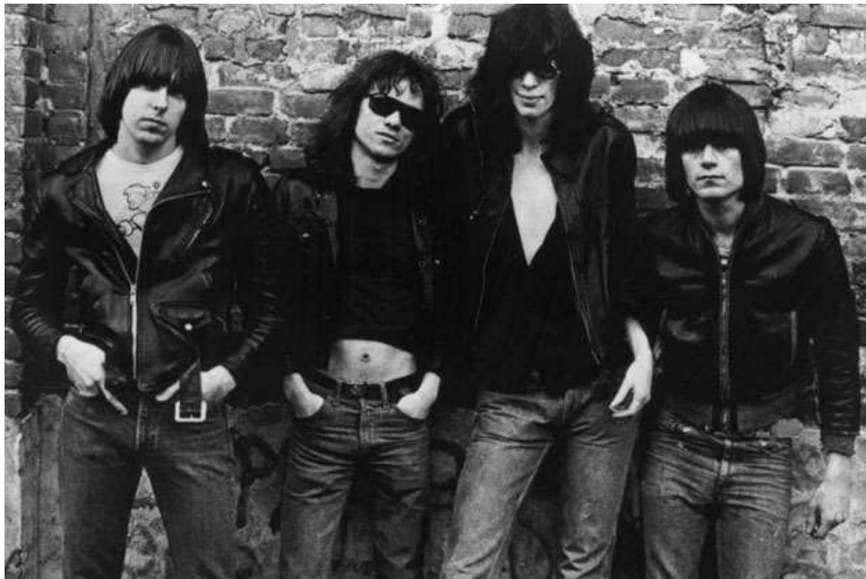
Slika 8.: Ramones, 1976.

Ni ne čudi što je upravo taj stil već desetljećima popularan kod ljubitelja rocka (pa i šire) s obzirom da su pored pomalo kostimiranog heavy metal stila i razuzdanog punk stila odabrali skromnost i jednostavnost ukazujući na kosu kao najveći ukras.