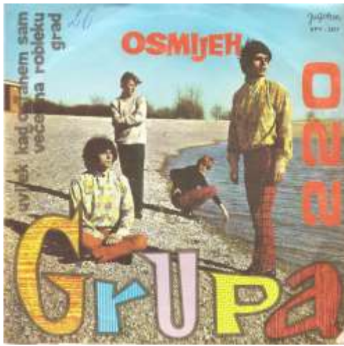
Slika 11.: Naslovnica albuma „Osmijeh“ Grupe 220 iz 1967. godine

Omasovljavanje rock scene u Hrvatskoj zbilo se sedamdesetih godina prošloga stoljeća, kada se rock počeo dijeliti na žanrove poput hard rocka, progresivnog rocka, jazz rocka, art rocka, glam rocka, folk rocka, simfonijskog rocka, blues rocka i boogie rocka. Hrvatski rock bendovi nisu nimalo zaostajali za svojim kolegama u svijetu, pa je svaki od ovih žanrovskih pravaca imao barem jednog predstavnika. U tom periodu su se pojavili i neki od najvećih hrvatskih stadionskih rock sastava: Time, Parni valjak, Atomsko sklonište. Što se njihova stila tiče, na svojim su se koncertima odijevali identično bendovima istog žanrovskog opredjeljenja u npr. Engleskoj ili SAD.