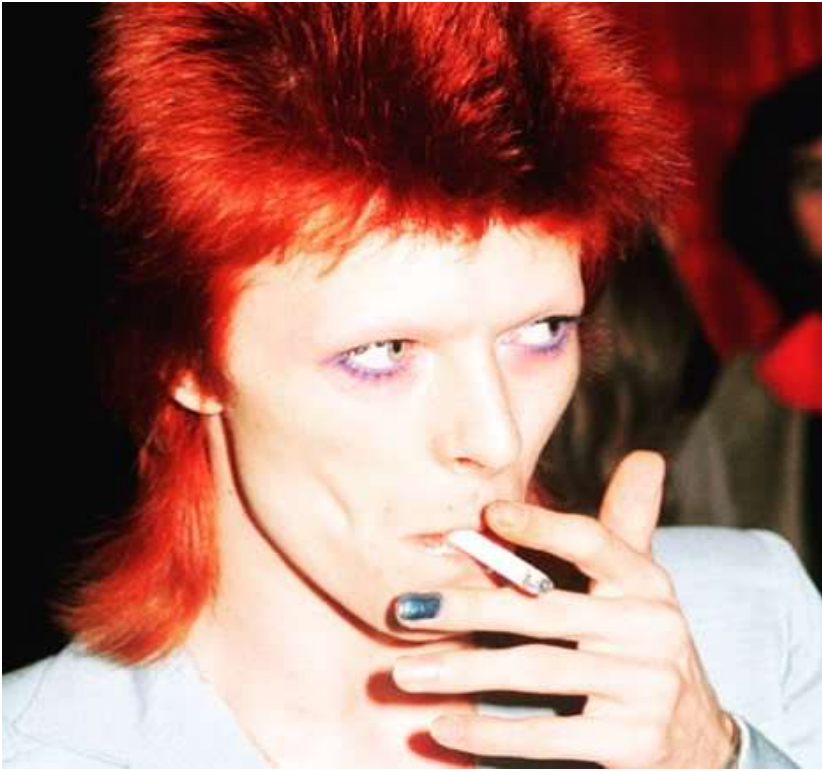
Slika 4.: David Bowie 1973.

Upravo zbog pojave različitih stilova i naglih promjena trendova, krajem šezdesetih odjeća se počinje masovno proizvoditi, a otvara se i sve više specijaliziranih butika. No baš zbog svoje dostupnosti, odjeća gubi na kvaliteti jer se više ne proizvodi da bi dugo trajala već se kolekcije mijenjaju po sezoni. (G. Lehnert., 2000., )