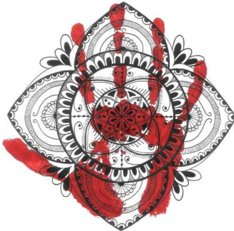
Sl. 20. Crvena mandala [20]

Crteži crvene, žute i plave mandale prikazani su plošnom perspektivom, kako se standardno i prikazuju mandale. Crteži sadrže dvije boje, crnu boju crteža i kolor otisak u jednoj boji ljudskog dlana. Boje otiska odgovaraju boji čakre na koju se mandala povezuje crtežom kako bi se postigla energizacija. Od boja se koriste akrilni otisak dlana i tinta iz flomastera. Uklapanjem asimetričnog oblika dlana u inače savršeno simetričan oblik mandale prikazan laticama lotosovog cvijeta mandala dobiva određenu snagu i dinamičnost koja asocira na previranje i kolanje energije izražene bojom određene čakre. Upravo te specifične boje i različiti oblici dlanova daju čitavoj kolekciji dojam kretanja i kolanja energije među njima. Mandala je kreirana minucioznim grafičkim rješenjima u popunjavanju različitih ploha različitim slikovnim uzorcima tako da je dojam vrlo detaljan i precizan.