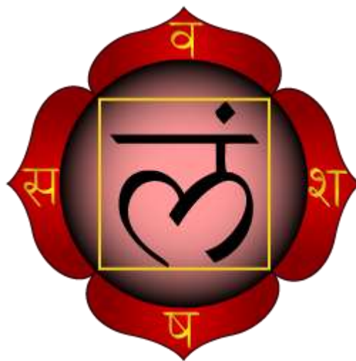
Sl. 9. Muladhara [9]

Ako je prva čakra zatvorena ili blokirana, blokirana je i čovjekova vitalnost; čini se da čovjek nije prisutan. Javlja se duševni i tjelesni umor, bezvoljnost, strah, nedostatak samopouzdanja. Blokirana prva čakra može uzrokovati anemiju, artritis, hemeroide, išijas, tumore ili rak na tom području, proširene vene, slabu cirkulaciju [11].