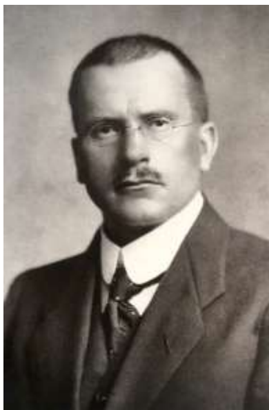
Sl. 6. Carl Gustav Jung [6]

Ako se prihvate Jungove zamisli o univerzalnom simboličkom koncentričnom geometrijskom poretku usuglašavanja suprotnosti, tada se primjeri mandale mogu pronaći u mnogobrojnim magijskim i alkemijskim zapisima, crtežima i slikama zapadne ezoterične tradicije (dijagrami Jakoba Bemea ili Roberta Flada) [10].