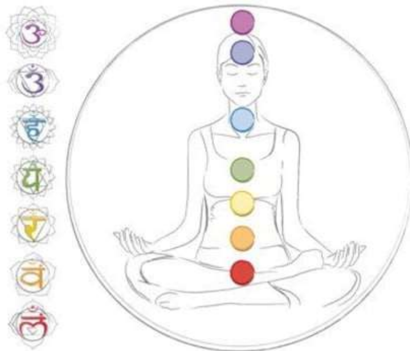
Sl. 8. Čakre i njihov položaj u tijelu [8]

Ajna, Grlena čakra Visuddha, Srčana čakra Anahata, Čakra solarnog pleksusa Manipura, Sakralna čakra Svadisthana i Korijenska čakra Muladhara. Svakoj čakri pripada određena boja, simbol, mantra, element te kristali koji odgovaraju energetskim frekvencijama pojedinog energetskog vrtloga. Također, svaka čakra se razlikuje i u svojoj građi, što se ide na više, to su one suptilnije, složenije i jače. Povezuju se sa lotosom koji se u Indiji smatra svetim cvijetom. Otvaranje latica odgovara otvaranju čakre. Svaka je čakra prikazana s određenim brojem latica, započinje korijenskom čakrom koja je prikazana s četiri laticice, a završava krunskom čakrom koja se naziva lotosom od tisuću latica ili lotosom s mnogo latica [11].