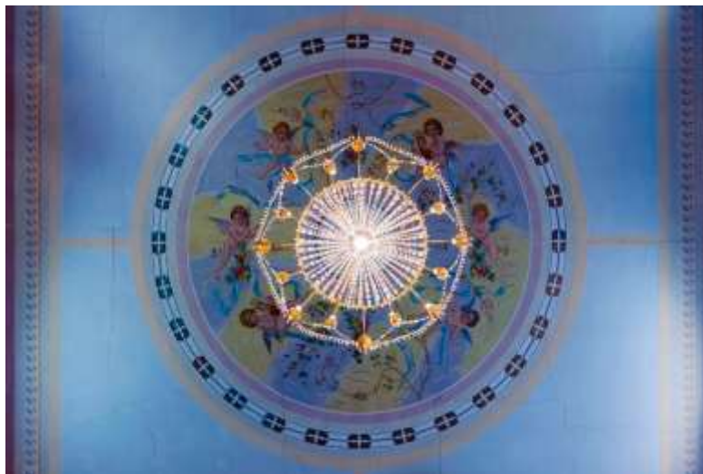
Sl. 16. Svijećnjak-mandala umjetnice Miriam Ferstl [16]

Ciklus "Božanska svjetlost" rezultat je njenog višegodišnjeg terenskog rada na otocima Braču, Korčuli, Visu i Hvaru, u čijem su fokusu crkveni lusteri i svijećnjaci, fotografirani iz žablje perspektive. Na ovaj način Ferstl želi navesti promatrača na gledanje svakodnevnih detalja, često zanemarenih i neprimjetnih predmeta iz crkvenog inventara na posve drugačiji način, ne samo dubljim pogledom na površinu predmeta, već i promatranjem duhovnim očima.