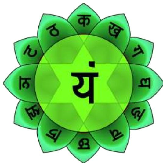
Sl. 12. Anahata [12]