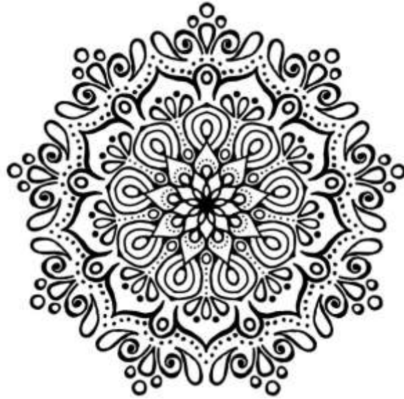
Sl. 1. Mandala [1]