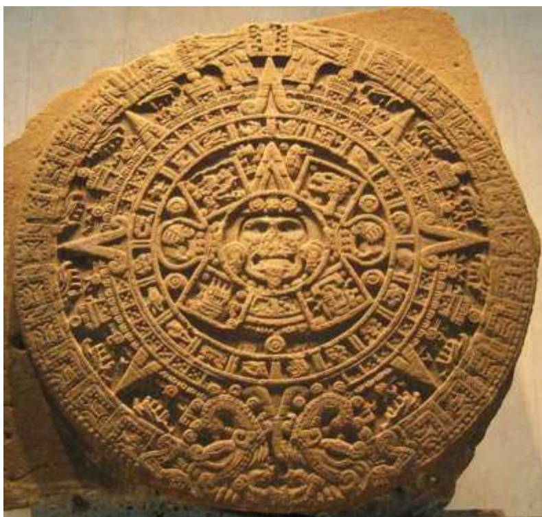
Sl. 5. Aztečki kalendar [5]