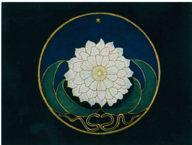
Sl. 7. Mandala Jungova pacijenta [7]