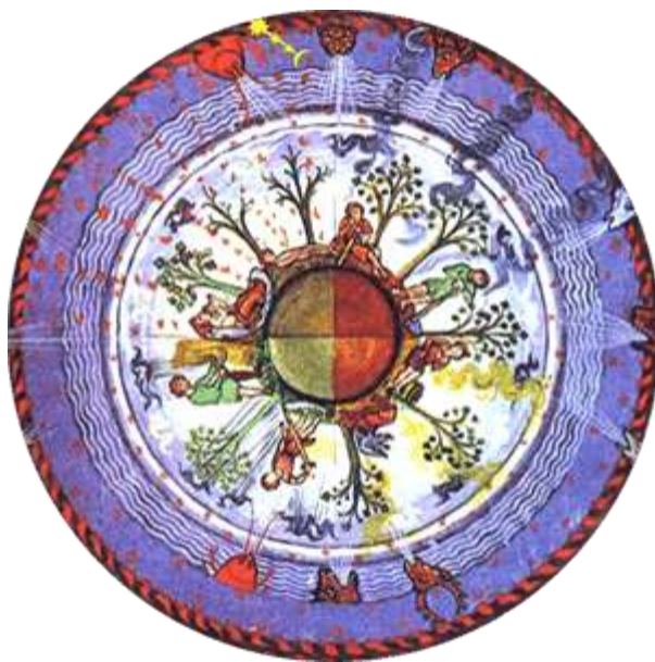
Sl. 4. Mandala Hildegard von Bingen [4]