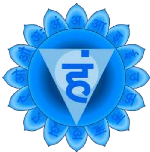
Sl. 13. Vishuddha [13]

Posljedice neuravnotežene pete čakre izražavaju se kao nemogućnost izražavanja osjećajnih potreba, osjećaja i vlastitog mišljenja. Ljudi ne mogu izraziti žalost ni plakati, dok se s druge strane blokada može manifestirati i kao pretjerano nadziranje drugih ljudi. Blokada te čakre povezana je s tremom, s uznemirenošću, s anginama koje se ponavljaju, s problemima s štitnjačom, s rakom grla, bolestima zubi i desni, upalama grla te s glavoboljama koje nastaju zbog napetosti u gornjem dijelu vrata [11].