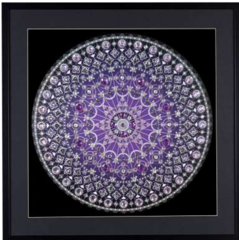
Sl. 19. Mandala umjetnice Grodane Grahovar [19]