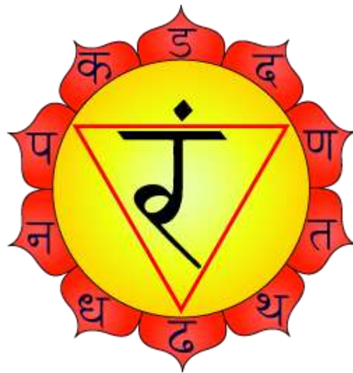
Sl. 11. Manipura [11]

Društvo ovu čakru često podvrgava odgojnoj represiji, posebice vezano uz uvjerenja vezana uz osobine spolova, što ostavlja u odrasloj osobi negativne emocije i blokade, zarobljenost na nesvjesnim razinama i može uzrokovati ozbiljne psihosomatske poremećaje, pa i teška oboljenja i oštećenja imunog sustava [11].