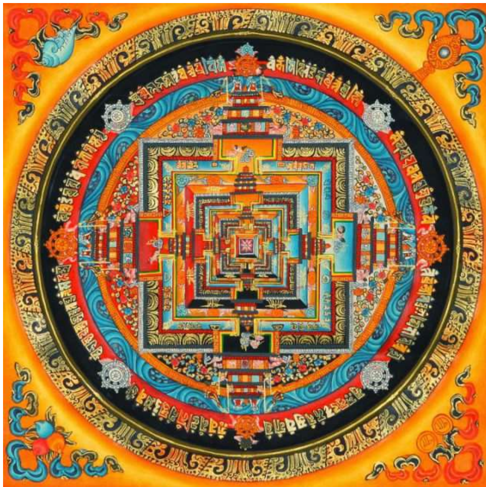
Sl. 3. Tibetanska Kalachakra [3]

U Europi, u tradiciji hermetizma također nalazimo Mandale. Arhitektura gotičkih katedrala pokazuje drugi put prema prosvjetljenju. Obojeno staklo koje podsjeća na drevne Mandale, simbol je prosvjetljenja ljudskog duha [7].