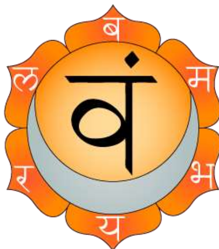
Sl. 10. Svadhishthana [10]