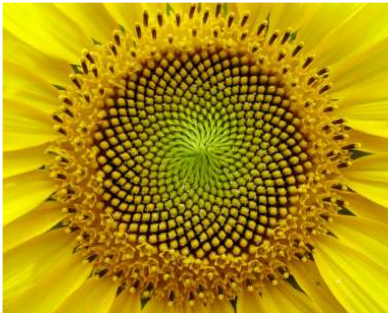
Sl. 2. Mandala u prirodi [2]