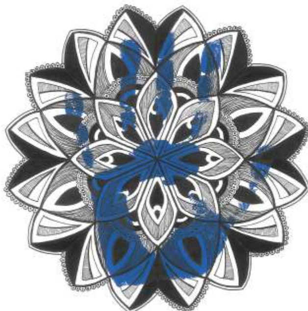
Sl. 22. Plava mandala [20]