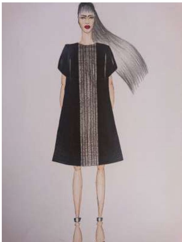
Slika 16: Modni crtež br. 1