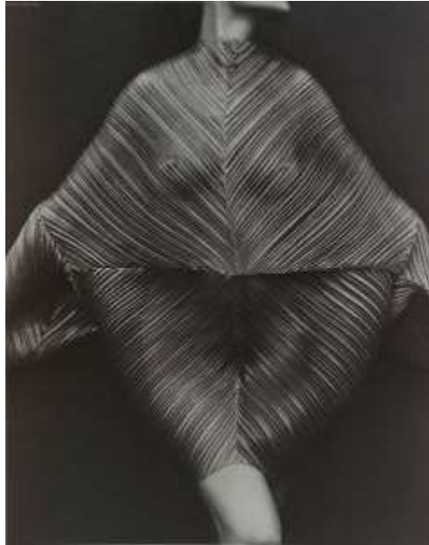
Slika 2: Issey Miyake dizajn, kolekcija "Pleats Please"

Dok Miyakea prvenstveno povezujemo s plisiranjem, japansku dizajnericu Rei Kawakubo karakterizira korištenje slojevitosti kao princip artikulacije odjevnog oplošja. Vezano uz temu koja se obrađuje posebno zanimljiva je njezina izložba Rei Kawakubo/Comme des Garçons Art of the In-Between održana ove godine u Metropolitan Museum of Art, a među izloženim radovima ovom prilikom posebno treba istaknuti crne haljine.