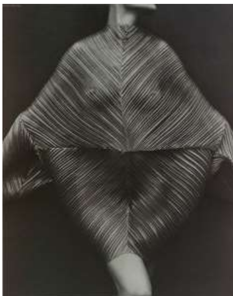
Slika 2: Issey Miyake dizajn, kolekcija "Pleats Please"

Dok Miyakea prvenstveno povezujemo s plisiranjem, japansku dizajnericu Rei Kawakubo karakterizira korištenje slojevitosti kao princip artikulacije odjevnog oplošja. Vezano uz temu koja se obrađuje posebno zanimljiva je njezina izložba Rei Kawakubo/Comme des Garçons Art of the In-Between održana ove godine u Metropolitan Museum of Art, a među izloženim radovima ovom prilikom posebno treba istaknuti crne haljine.