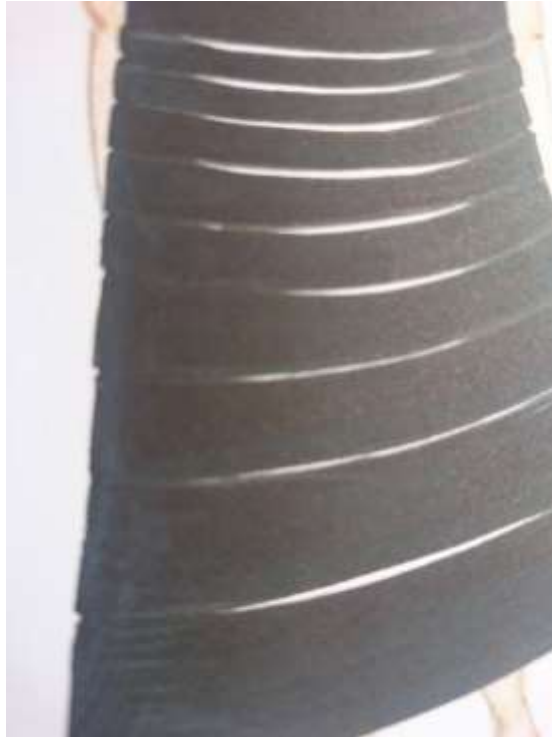
Slika 15: Svjetlo – sjena, sjenčanje bijelom drvenom bojicom na modnom crtežu

Sjenčanjem se postižu tonske vrijednosti, čime se može stvoriti privid plastičnosti oblika.