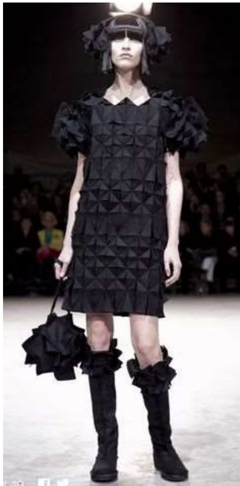
Slika 4: Yohi Yamamoto/ Paris Fashion Week 2013.-2014.

Zanimljive primjere artikulacije crnih odjevnih formi nalazimo i u radu Yohjia Yamamota.