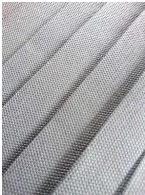
Slika 8: Artikulacija površine tekstila br. 1

U nastavku slijedi niz fotografija idejnih rješenja na kojima se vidi korištenje navedenih principa.