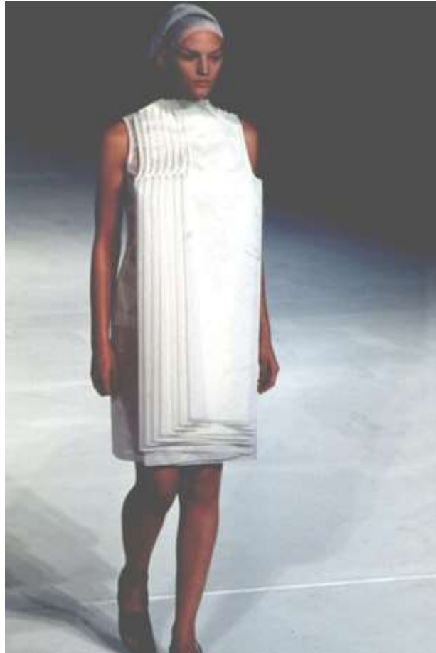
Slika 5: Hussein Chalayan Spring/Summer 1999.god.

Artikulacija površine prikazana na slici 5 izvedena je na izuzetno jednostavan, ali istovremeno zanimljiv i neočekivan način, pretvarajući jednostavnu ideju u nešto posebno, neočekivano (Slika 5).