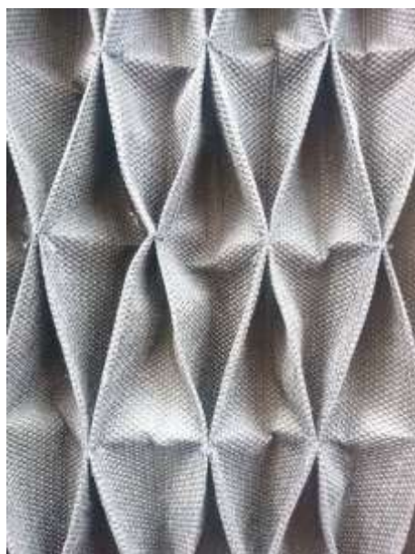
Slika 27: Artikulacija tekstila prikazana u modnom crtežu br. 6