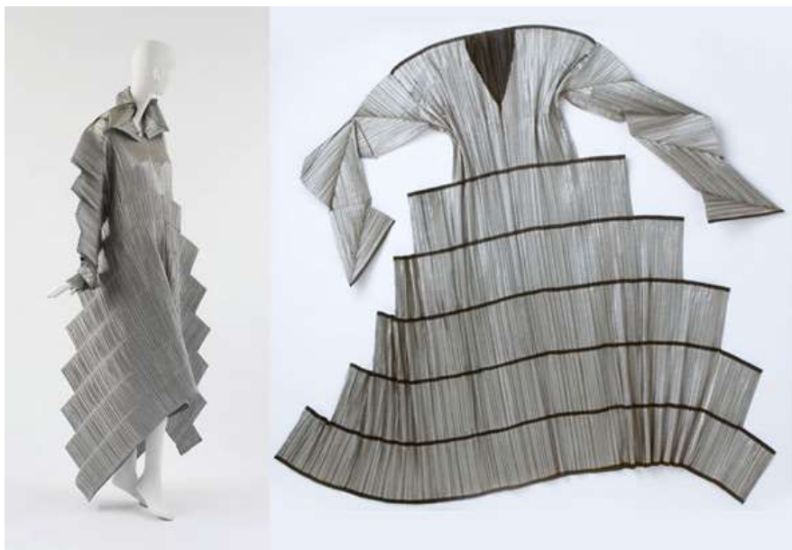
Slika 1: Issey Miyake dizajn, kolekcija "Staircase series"

Japanski dizajner Issey Miyake je nezaobilazan kada se govori o ovoj temi. Njegovi čudesni, svjetski poznati modeli nastali su korištenjem navedenih principa: tehnikom plisiranja i origamija. U nastavku, na slikama 1 i 2 prikazana su dva modela koja su bazirana na plisiranju.