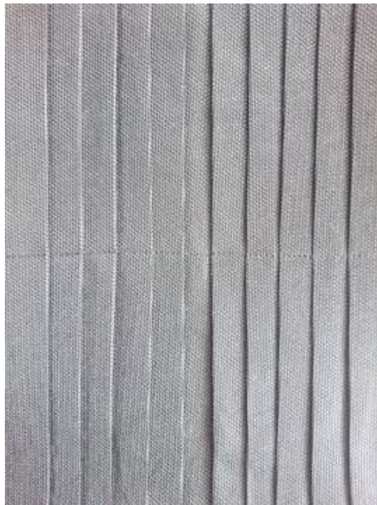
Slika 17: Artikulacija tekstila prikazana u modnom crtežu br. 1