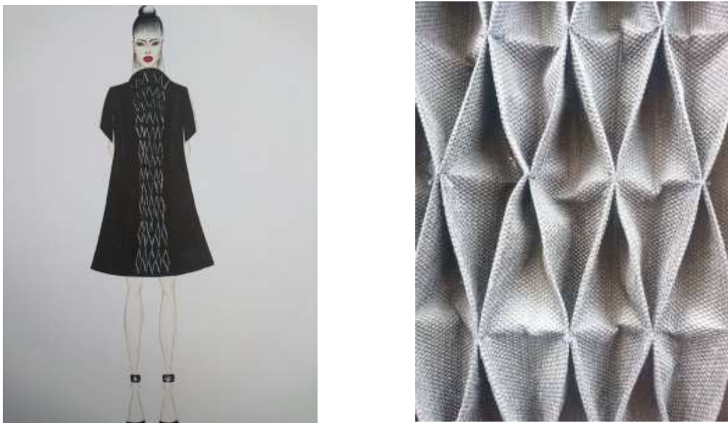
Slika 30: Modni crtež i artikulacija površine tekstila realiziranog idejnog rješenja

Nakon što je načinjena serija modnih crteža prikazanih u prethodnim poglavljima, rješenje prikazano na slici 30 odabrano je za realizaciju. Razlog odabira ovog rješenja je taj što je kod njega posebno naglašena reljefnost površine. Kreirani, gotovo pravilni romboidni oblici omogućavaju bogatu i zanimljivu igru svjetla i sjene.