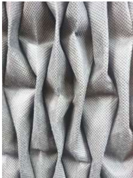
Slika 23: Artikulacija tekstila prikazana u modnom crtežu br. 4