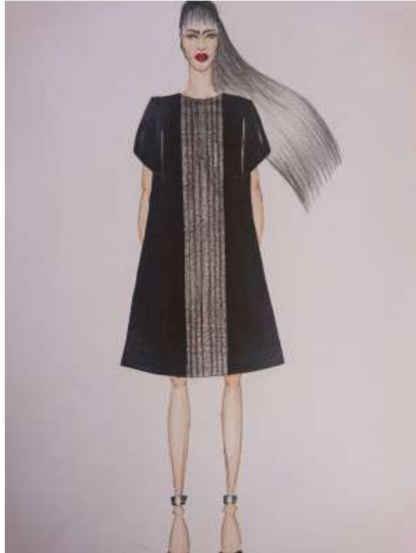
Slika 16: Modni crtež br. 1