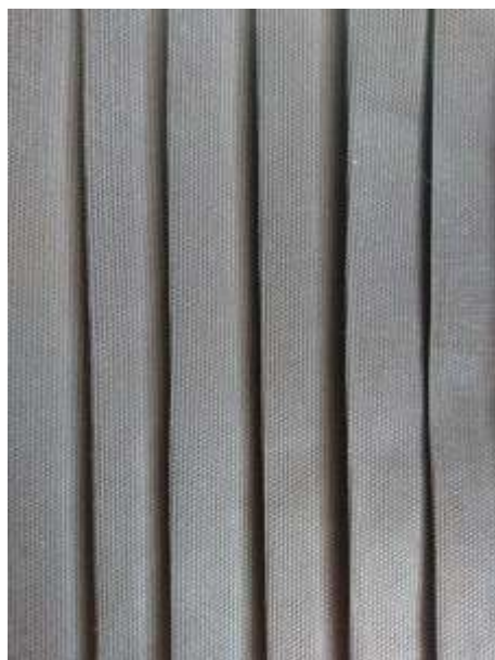
Slika 19: Artikulacija tekstila prikazana u modnom crtežu br. 2