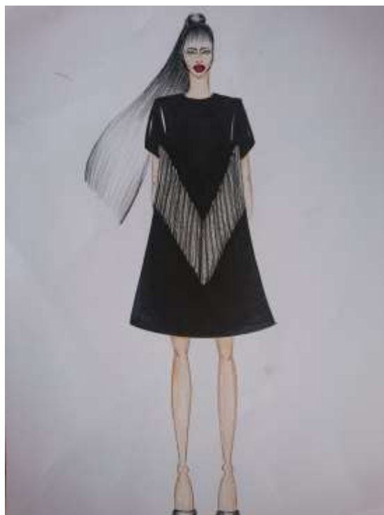
Slika 20: Modni crtež br. 3

Na slici 20 prikazan je modni crtež na kojem je reljefni plisirani dio smješten na prednjicu haljine u obliku slova V koje počinje ispod ruku, a završava na donjoj četvrtini dužine haljine. Plise je postavljen vertikalno.