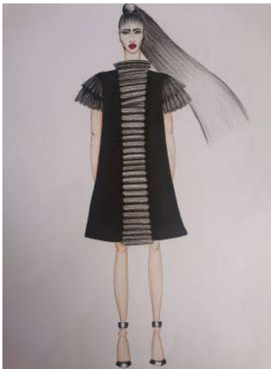
Slika 24: Modni crtež br. 5

Slika 24 prikazuje modni crtež na kojem je primijenjena artikulacija površine tekstila prikazana na slici 25. Za razliku od prethodnih artikulacija, ovdje se radi o višeslojnosti plisiranoj tekstila i bogatoj reljefnosti. Dio koji je naglašen, kompozicijski je smješten na sredinu prednjice i na rukave što modelu daje svečan dojam.