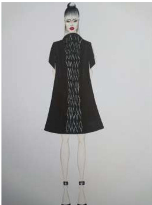
Slika 26: Modni crtež br. 6

Na slici 26 prikazan je modni crtež na kojem je primijenjena artikulacija površine tekstila koju vidimo na slici 27. Termofiksiranjem tekstila u pravilne nabore nastao je plise, nakon čega su, samo na pojedinim mjestima, na jednakim udaljenostima, spajani vrhovi plisiranoog tekstila. Tako su nastali romboidni reljefni elementi koji čine pravilan uzorak i artikuliraju srednji dio prednjice haljine.