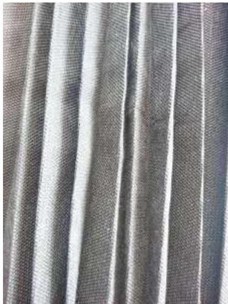
Slika 10: Artikulacija površine tekstila br. 3

Za razliku od prethodnih idejnih rješenja, reljefnost prikazana na slici br.10 dobivena je samo termofiksiranjem pomoću glačala na paru. Rezultat su pravilni nabori – plise.