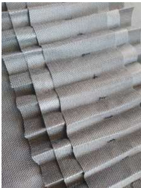
Slika 25: Artikulacija tekstila prikazana u modnom crtežu br. 5