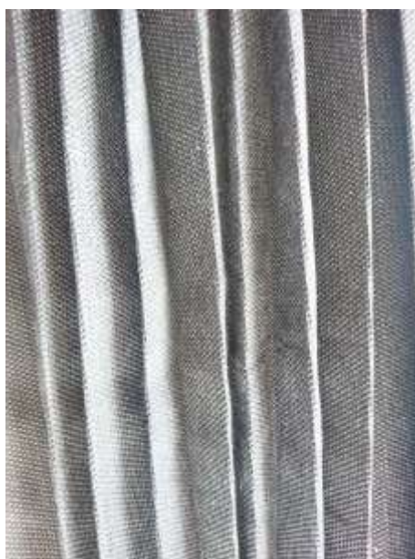
Slika 21: Artikulacija tekstila prikazana u modnom crtežu br. 3