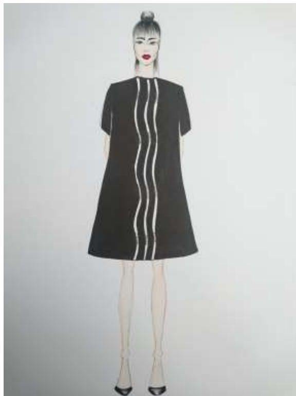
Slika 28: Modni crtež br. 7

Na slici 28 prikazan je modni crtež na kojem je primijenjena artikulacija površine tekstila sa slike 29. Vijugavi, valoviti, reljefni elementi čiji je ulazak u prostor dinamičan, smješteni su vertikalno na srednji dio prednjice haljine.