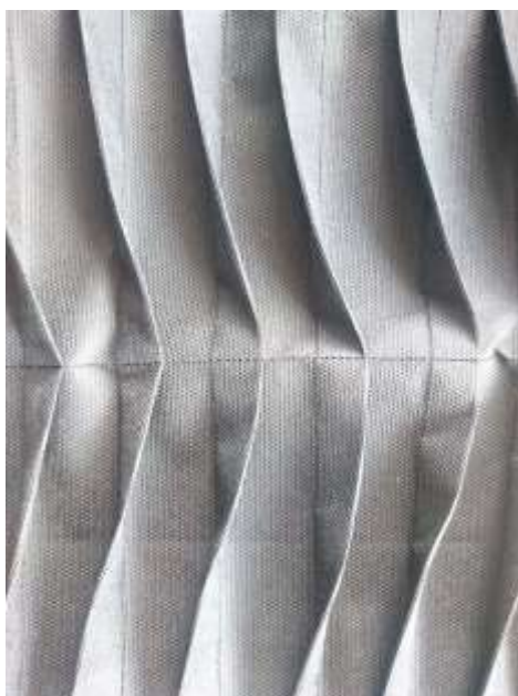
Slika 29: Artikulacija tekstila prikazana u modnom crtežu br. 7