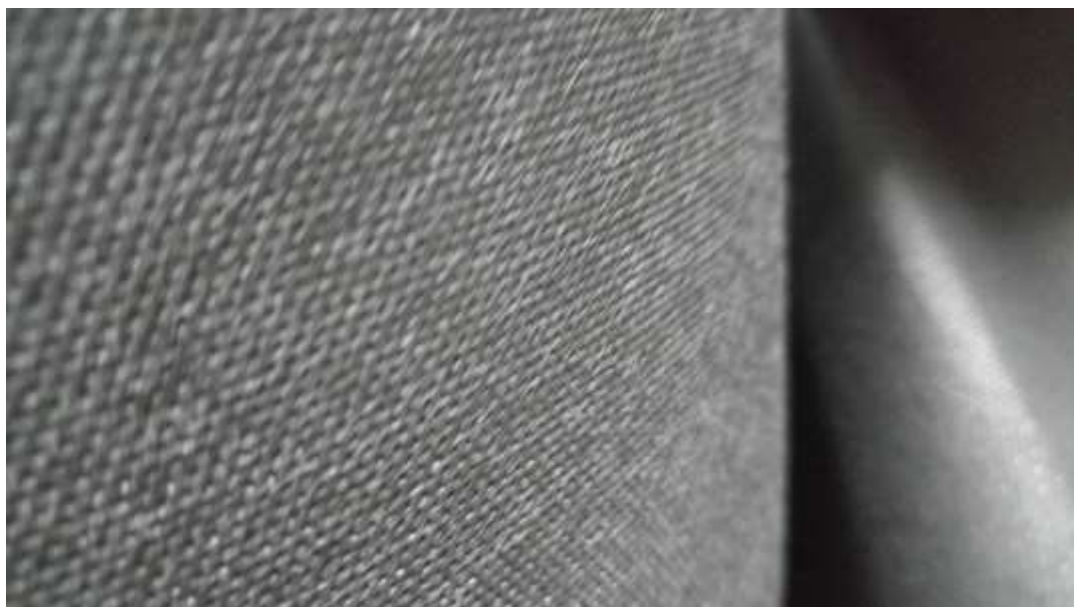
Slika 7: Retex

Materijal korišten u istraživanju je crni retex (Slika 7). Retex je netkani tekstil koji ima različitu primjenu u industrijskoj ambalaži (ambalažne vreće, vrećice za kupovinu, promotivni materijal), poljoprivredi (tkanine za suzbijanje korova, tkanine za pokrivanje usjeva, tkanine za zaštitu), tekstilnoj industriji (zaštitna odjeća, podstave, konfekcija), industrijskom namještaju (proizvodnja madraca, proizvodnja džepičastih jezgri, tapetarska industrija).