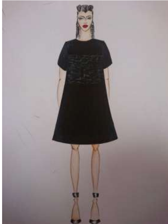
Slika 22: Modni crtež br. 4

Na slici 22 prikazan je modni crtež na kojem je artikulirana površina prikazana na slici 23 smještena na gornji dio prednjice haljine koji je na taj način bogato artikuliran naglašeno reljefnim, nepravilnim naborima, romboidnog oblika.