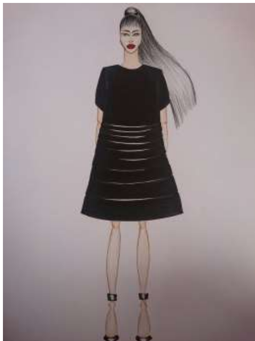
Slika 18: Modni crtež br. 2

Na slici 18 prikazan je modni crtež na kojem je artikulacija tekstila dobivena plisiranjem. Dio koji je naglašen kompozicijski je smješten na donji dio prednjice na način da postoji gradacija u veličini plisea od manjeg u struku, od većeg prema donjem dijelu haljine.