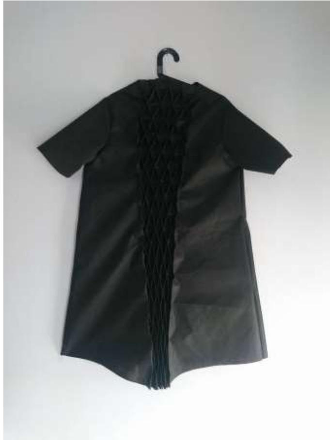
Slika 31: Realizirana haljina