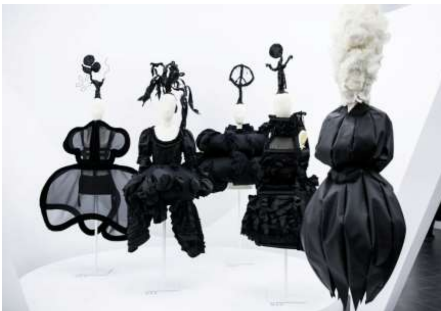
Slika 3: Rei Kawakubo/Comme des Garçons Art of the In-Between

Dok Miyakea prvenstveno povezujemo s plisiranjem, japansku dizajnericu Rei Kawakubo karakterizira korištenje slojevitosti kao princip artikulacije odjevnog oplošja. Vezano uz temu koja se obrađuje posebno zanimljiva je njezina izložba Rei Kawakubo/Comme des Garçons Art of the In-Between održana ove godine u Metropolitan Museum of Art, a među izloženim radovima ovom prilikom posebno treba istaknuti crne haljine.