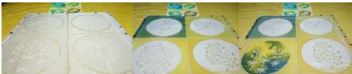
Slika 33: prikaz faza oslikavanja svile