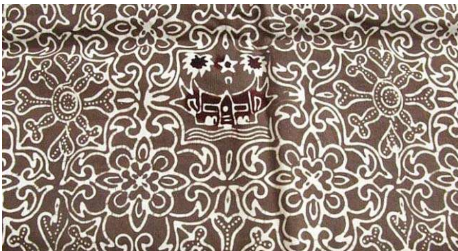
Slika 6: prikaz primjera TanahLiek batika

Trgovinski odnosi između Melayu Kraljevstva u Jambi i javanskih obalnih gradova napredovali su još od 13. stoljeća i stoga je obalni batik sa sjevera Jave vrlo vjerojatno utjecao na Jambi. Godine 1875. HajiMahibat iz Središnje Jave ponovno je pokrenuo padajuću batik industriju u Jambiju. Mjesto MudungLaut u području Pelayangan poznato je po proizvodnji jambi batika . Batik jambi je kao i javanskibatik utjecao na malezijski batik. Ljudi Minangkabau proizvode batik nazvan batiak tanahliek (glini batik), te koriste glinu kao boju za tkaninu. Tkanina je uronjena u glinu više od jednog dana, a zatim ukrašena životinjskim i floralnim motivima. Batik iz Bengkulu, grada na zapadnoj obali Sumatre, zove se batik besurek , što u doslovnom prijevodu znači "batik sa slovima", jer inspiraciju crpe iz arapske kaligrafije[2, 3, 4, 5].