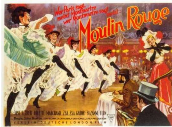
Slika 9. Plakat za John Hustonov film „Moulin Rouge“

Queen (1951.), The Asphalt Jungle (1950.), The Red Badge of Courage (1951.) i Moulin Rouge (1952.).