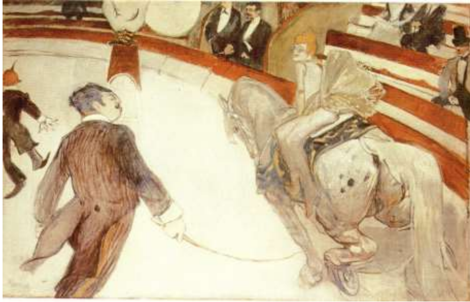
Slika 1. „Cirque Fernando: The Equestrienne“, 1888, Oil on canvas, 100.3 x 161.3 cm, Art Institute of Chicago, Chicago