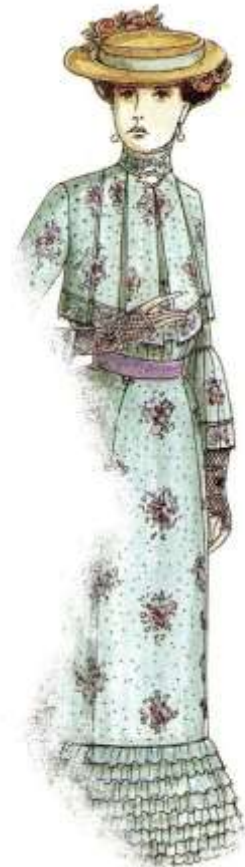
Slika 20. Peacock, John, The chronicle of western costume , str.177, Thomas &Hudson, London, 2007.

Slika prikazuje francusku damu iz razdoblja oko 1903. godine (Slika 20). Takva vrsta odjeće nosila se u posjetima. Na glavi je tvrdi slamnati šešir (žirardi) ukrašen svilenim ružama i bijelom ukrasnom trakom. Haljina od pamučne tkanine prekrivena je čipkom i s povišenim je ovratnikom. U istom uzorku je kratki nabrani kaputić koji ima uske rukave. Rukavi su uski do lakta, a ispod se nastavljaju širokim volanom. Suknja je zvonasto krojena, a donji rub ukrašen je redovima volana. Na rukama su čipkaste rukavice bez prstiju.