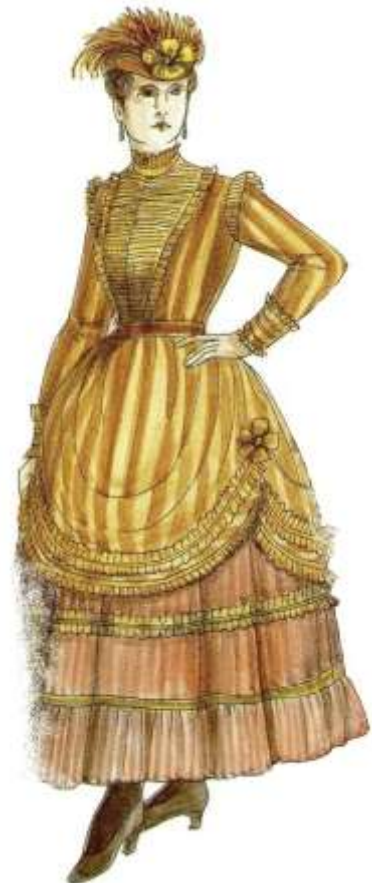
Slika 12. Peacock, John, The chronicle of western costume , str.163, Thomas &Hudson, London, 2007.

Ovdje je prikazana engleska glumica, koja na sebi ima kostim za pozornicu, iz razdoblja oko 1868. godine (Slika 12). Na glavi je pričvršćen šešir ukrašen perjem i rozetom. Haljina je u gornjem dijelu ukrašena ribljom kosti, ispod čega je korzet. Gornji skuti haljine zadignuti su i pričvršćeni tako da vise u uredno složenim naborima. Nabori su ukrašeni našivenim pliseom 64 i vrpcom. Donji skuti haljine su do gležnja i završavaju širokim volanom. Na nogama su visoke čizme na kopčanje.