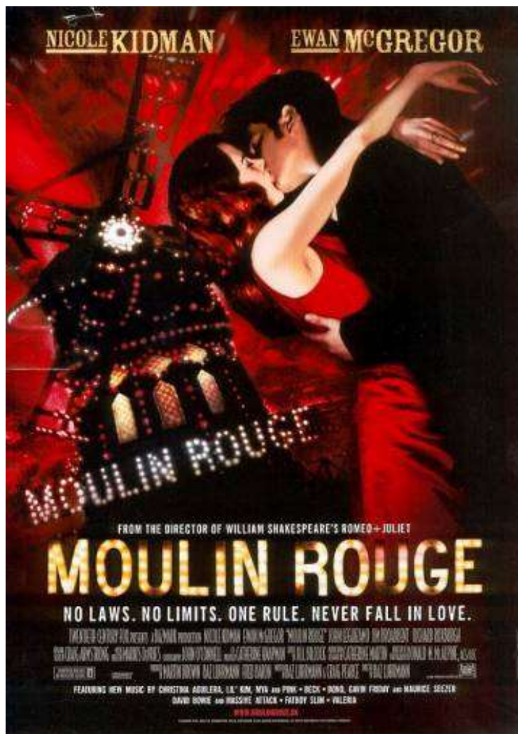
Slika 10. Plakat za Baz Luhrmannov film „Moulin Rouge“