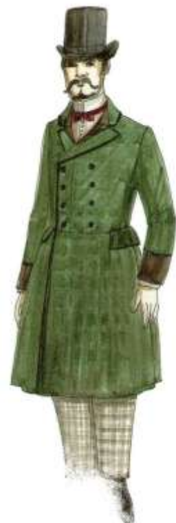
Slika 14. Peacock, John, The chronicle of western costume , str.165, Thomas &Hudson, London, 2007.

Odjeća na ovoj slici karakteristična je za razdoblje oko 1880. godine (Slika 14). Na glavi je cilindar, a na licu su vidljivi brkovi, brada i zalisci. Ispod salonskog kaputa od karirane vunene štofa, dvorednoga kopčanja s ovratnikom, vidljiva je košulja s krutim ovratnikom i orukvicama, s leptir-kravatom i uske karirane hlače. Na nogama su čizme.