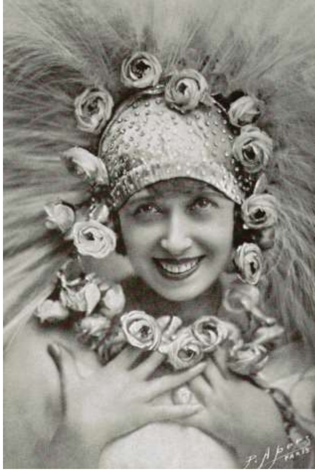
Slika 7. Mistinguett, fotografija iz predstave Paris qui tourne

Prvi dio predstave obogaćen je recitalima Harry Fragsona koji je francuskoj prijestolnici predstavio anglo-saksonske 35 plesne ritmove. Dvije godine kasnije Mistinguett i Max Dearly imali su premijeru s operetom La Valse chaloupée . Predstava je inspirirana temom iz Offenbachovog baleta Le Papillon (The Butterfly) . Uspjeh je bio nevjerovatan i sve plesne dvorane izvodile su ples viđen u Le Papillonu . Ukus javnosti tada je naginjao temama i likovima „mutnog“ Montmartra, mračnom svijetu propalica i djevojaka upitnog morala. Taj novi trend postao je jako popularan baš kad je La Miss, tako su obožavatelji zvali Mistinguett, počela izvoditi pjesmu Mon Homme Francisa Carcoa. Bez obzira na posjećenost novih izvedbi, Moulin Rouge je zapadao u financijske probleme, a došlo je i do promjena u vodstvu.