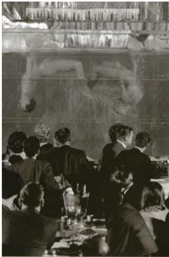
Slika 8. Veliki akvarij, u kojem su plesale plesačice.

1962. godine Doris Haug, koja je već bila zadužena za balet i plesačice u Moulin Rougeu, počinje smišljati nove operete u suradnji s Ruggerom Angelettijem. Od tada su Doriss Girls bile glavna atrakcija i Moulin Rouge je imao hit do hita. Giorgio Veccio je osmislio scenografiju i dizajnirao kostime. Jacki Clérico, upravitelj opereta, osmislio je jednu od najvećih atrakcija Moulin Rougea: veliki akvarij i sklopivo stubište (Slika 8).