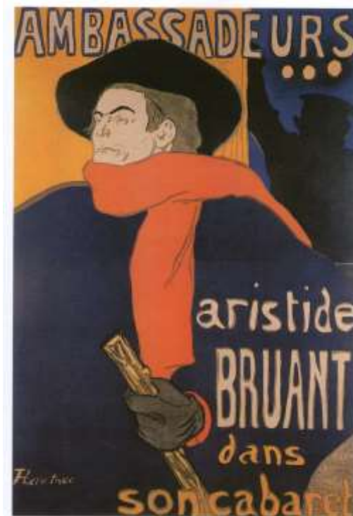
Slika 4. „ Ambassadeurs: Aristide Bruant “, 1892; Coloured lithograph (poster), 150 x 100 cm; Private Collection

Yvette Guilbert, koja je nastupala u različitim kavanama i kabaretnim klubovima i povremeno pjevala Bruantove šansone, bila je još jedna proslavljena zvijezda kojoj je Henri radio plakate. Zaštitni znak bile su joj duge, crne rukavice. Izradio je brojne crteže, gvaševe i litografije s njezinim likom. Na svojim je plakatima umjetnik ovjekovječio i ostale zvijezde, među njima ponajviše žene poput Jane Avril, koja je nastupala u Moulin Rougeu.