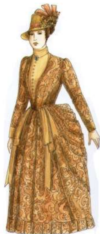
Slika 16. Peacock, John, The chronicle of western costume , str.166, Thomas &Hudson, London, 2007.

Francuska dama, iz 1886. godine, ima šešir visoke glave s obodom zavrnutim prema gore koji je ukrašen omčama od vrpce i cvijećem (Slika 16). Brokatna haljina je dubokog izreza koji je ispunjen jednobojnom svilom s visokim ovratnikom, a poprsje je ukruženo umetnutom ribljom kosti. Ispod haljine se nalazi korzet, a rukavi su uski. Skuti 66 su straga skupljeni i poduprti jastučićem (bustleom). Donji rub haljine nabran je.