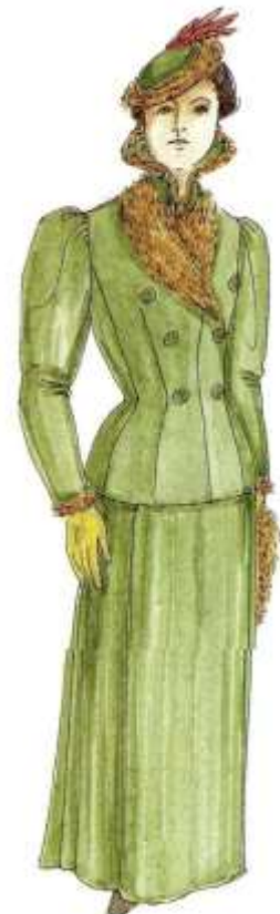
Slika 18. Peacock, John, The chronicle of western costume , str.177, Thomas &Hudson, London, 2007.

Francuska dama, iz 1900. godine, ima karakterističnu odjeću toga razdoblja za putovanje (Slika 18). Šešir je ukrašen krznom i perjem. Kratki kaput s dvostrukim kopčanjem i rukavima je u obliku buta 67 . Kaput je ukrašen krznom na ovratniku i orukvicama. Na rukama su kožne rukavice, a jedna ruka drži muf 68 od istoga krzna kao na kratkom kaputu.