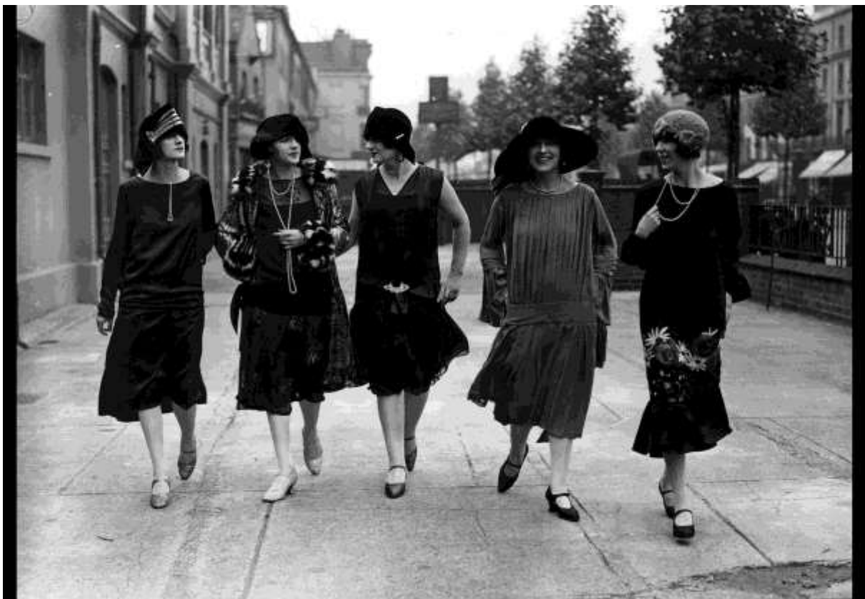
Sl. 2. Chanel haljine

„Luksuz mora biti udoban, inače nije luksuz.“ - Coco Chanel