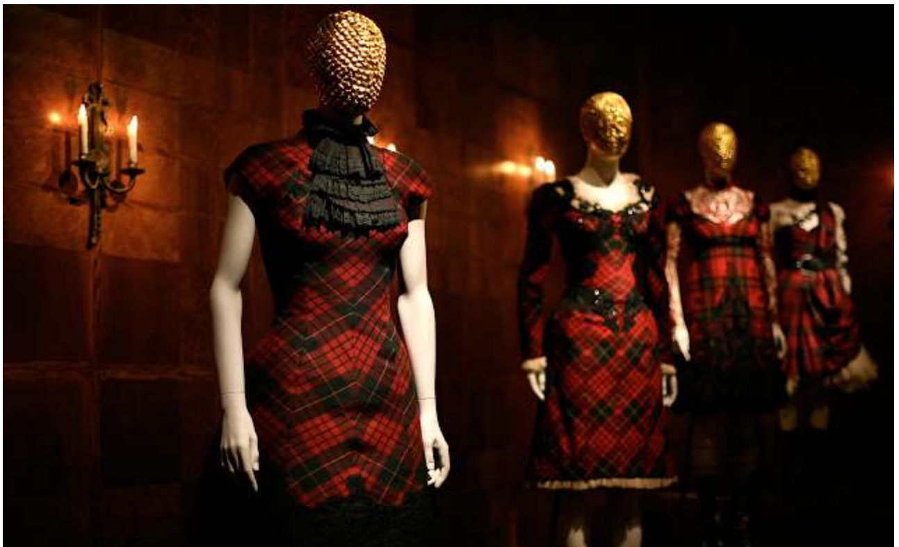
Sl.17. Modeli iz McQueen-ove kolekcije Highland Rape iz 1995.godine