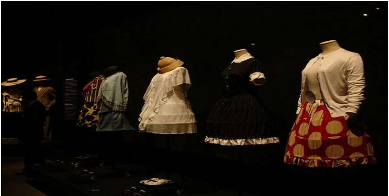
Sl. 15. Kreacije Vivienne Westwood iz kolekcije "Mini-Crini", 1987.

Kolekciju visoke mode koja je ponovo potresla javnost Vivienne Westwood plasirala je na tržište 1985. godine pod nazivom "Mini-Crini", i inspirirana modom 19. stoljeća. Westwood je inspiraciju za kolekciju pronašla u baletu Petruška . Dok su drugi dizajneri u to vrijeme isticali ženska ramena umetcima i jastučićima, Westwood je ponovo bila drugačija i u ovoj kolekciji te je stavila naglasak na bokove. Kolekcija je bila prožeta točkicama, zvjezdicama i printovima. Kritičari su smatrali da kolekcija pretjerano naglašava ženske obline. Uz vrlo smjele kreacije, modeli su uglavnom nosili cipele s vrtoglavo visokim platformama, što se ponekad smatra apsurdnim i vulgarnim. 9 Vivienne Westwood već sredinom 70-ih postaje prva dizajnerica 20. stoljeća, nakon Poiratove zabrane nošenja korzeta, koja je počela koristiti izvorni oblik korzeta u svojim kreacijama. Ostali dizajneri počinju sljediti njen stil početkom 80-ih. 10