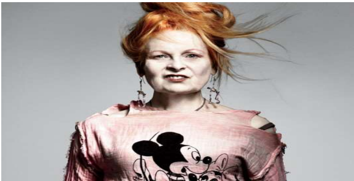
Sl. 13. Vivienne Westwood

Vivienne Westwood jedna je od najpoznatijih i najutjecajnijih dizajnerica s kraja dvadesetog stoljeća. Rođena je 1941. godine u Tintwistleu, malom mjestu u Ujedinjenom Kraljevstvu. Vivienne Westwood je u velikoj mjeri odgovorna za popularizaciju Punk stila u odijevanju. Originalna, razuzdana i kontroverzna, kao dizajnerica nije poznavala granice u modi. Njezin punkerski stav je življi sada nego što je bio 70-ih. Klasične kolekcije nepokolebljivo su ukorijenjene u njezine interese i uvjerenja, bez obzira da li se radilo o ljudskim pravima ili odijevanju. Sredinom dvadesetih, život Vivienne Westwood kao da prolazi na izrazito neprimjetan način. S 25 godina bila je u braku, živjela je u Willesdenu, posjećivala crkvu i predavala u lokalnoj osnovnoj školi. Iako je Vivienne tada živjela poprilično mirnim životnim stilom, oduvijek je imala kreativnu crtu koja će ju kasnije potaknuti da promijeni svoj život iz temelja. Sama je dizajnirala svoju vjenčanicu, a najdraži hobi bio joj je izrada nakita. Sve se promijenilo nakon što je susrela Malcolma McLarena, budućeg menadžera Sex Pistolsa i to je bio početak jedne velike dizajnerske karijere. Njezin prvi uradak bio je izložen u dućanu Let It Rock na King's Roadu, 1971. godine. Pet godina kasnije dućan mijenja naziv i postaje vrlo popularan pod imenom SEX, gdje se prodaje punkerska odjeća, poderane majice i lanci. Bila je predvodnica Punk scene, proslavila se izrađujući dizajnerske kreacije u koje je oblačila članove benda Sex Pistols. 8