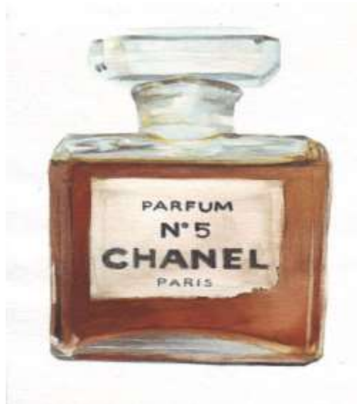
Sl. 5. Bočica parfema Chanel No. 5

„Žena bez parfema je žena bez budućnosti“ - Coco Chanel