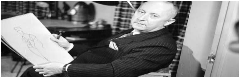
Sl. 6. Christian Dior

„Moja slabost je arhitektura. Razmišljam o svojim djelima kao o kratkotrajnoj arhitekturi, posvećenoj ljepoti ženskog tijela“ - Christian Dior