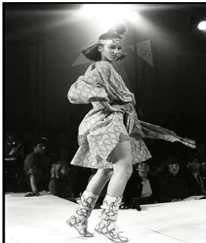
Sl. 14. Revija Vivienne Westwood pod nazivom “Pirates” u London, 1981. godine