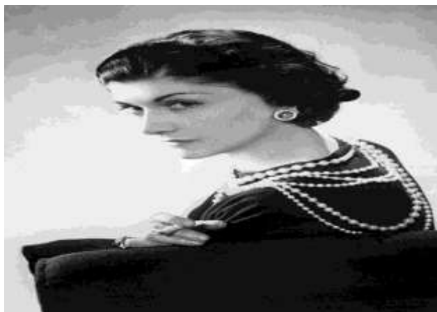
Sl. 1. Coco Chanel