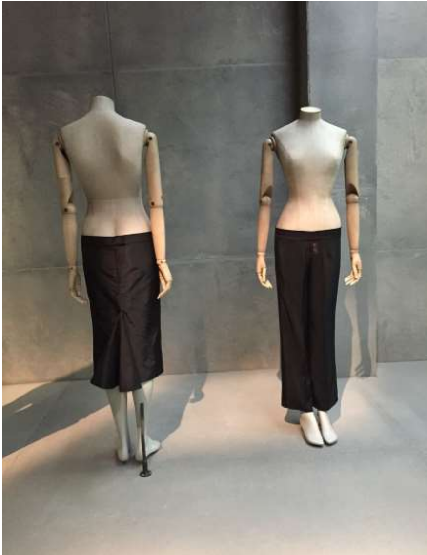
Sl.18. “Bumsters” suknja i hlače spuštenog struka iz McQueen-ove kolekcije Highland Rape

Hlače i suknje “bumsters” su izazvale brojne komentare i rasprave u tadašnjoj modnoj javnosti, ali zahvaljujući tome postale popularne širom svijeta, imale su toliko nizak struk da se modelima na reviji vidjela stražnjica.