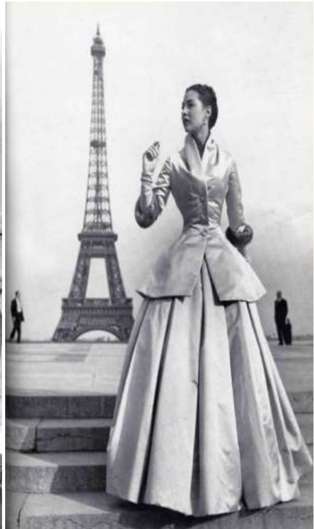
Sl. 8. i 9. Kreacije iz „New Look“ kolekcije iz 1947. godine