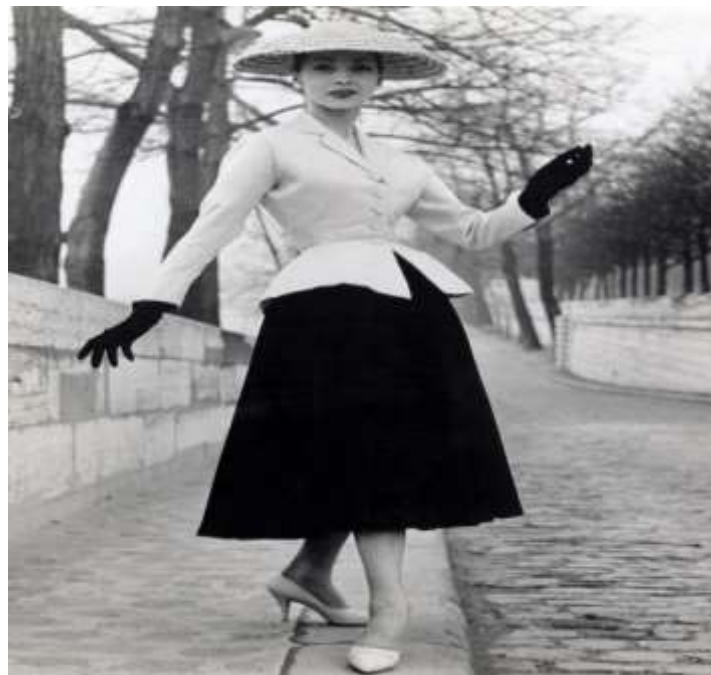
Sl.7. Najpoznatija kreacija iz „New Look“ kolekcije 1947., koja je postala sinonim za Diorovu modu

Diorova moda je prava suprotnost konzervativnoj modi ratnih godina. Inspiraciju za žensku modu crpio je iz prirode, a bio je poznat i kao veliki obožavatelj cvijeća što je bilo jasno vidljivo u njegovim kreacijama. Također, smatrao se majstorom kreiranja oblika i silueta, što je on sam obrazložio rekavši: „Dizajnirao sam ženu cvijet“. U krojeve je umetao kosti, žice i mnogo slojeva tkanina, bazirao ih je na isticanju struka žene. Haljine koje je radio bile su pripijene u struku, a jako odmaknute od linije tijela u bokovima čime je postizao izgled cvijeća i okrugli oblik odjeće. Rub suknji bio je naglašen, stvarajući lijepu siluetu. 1947. godine Dior je predstavio svoju prvu samostalnu kolekciju nazvanu Corolle ali je u svijetu prihvaćen naziv „New Look“ kojeg je kolekciji nadjenula Carmel Snow, urednica časopisa Harper's Bazaar. Spomenutom kolekcijom uzdrmao je modnu industriju time što je hrabro istaknuo ženski struk. „New Look“ je i danas inspiracija za mnoge naraštaje modnih dizajnera. Najpoznatija kreacija iz kolekcije i njezin prototip, odijelo je naziva „Bar“. Ono je Diorova ikona i simbol uspjeha, a fotografija na kojoj njegova manekenka u toj kreaciji pozira pokraj rijeke Seine postala je u modnom smislu bezvremenska. U toj kreaciji vidljivi su svi elementi Diorove mode – jasno je naglašena ženska silueta, uvučen struk i izraženi bokovi, što je postignuto umetanjem žice u rub plisirane suknje.