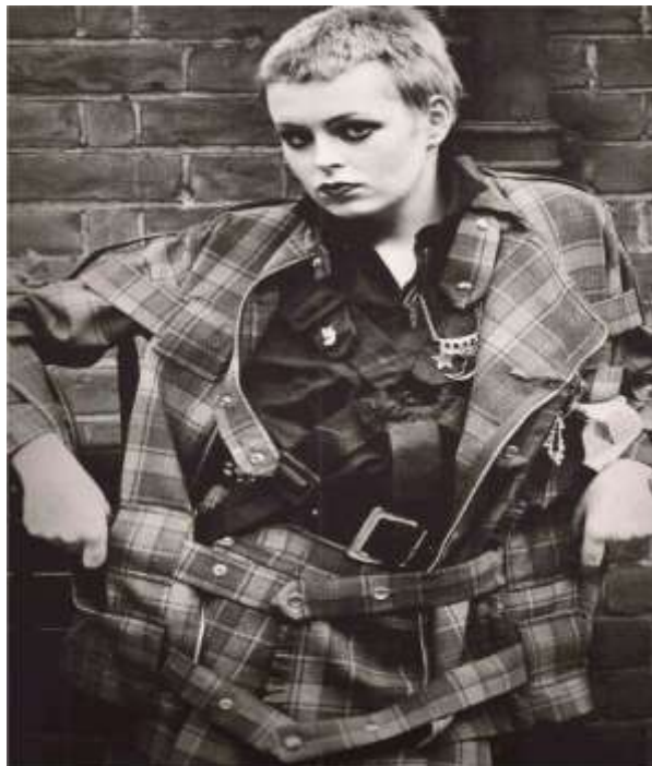
Sl. 14. Kreacija Vivienne Westwood iz kolekcije 1977. godine – Punk faza

Dizajnerski rad Vivienne Westwood započinje susretom s Malcolmom McLarenom. Prva faza njezine dizajnerske karijere bila je usmjerena isključivo na Punk. Kako smo spomenuli, postala je poznata nakon što je dizajnirala odjeću za dućan na King's Roadu koji je postao popularan pod nazivom SEX. Njezine prve kolekcije u spomenutom dućanu bile su povezane sa Punk pokretom na koji danas gledamo kao na kulturološki fenomen koji je 70-ih godina zavladao svijetom i osim glazbe ostavio nam je i bogato modno nasljeđe. Ponukana velikim uspjehom dućana, Vivienne otvara još četiri u raznim dijelovima Londona i naposljetku se širi po cijeloj Velikoj Britaniji i svijetu. Inspiraciju za odjeću crpi iz ljudi na marginama društva, poput prostitutki, beskućnika, motorista, fetišista. Obilježja Punk mode bili su zakovice, koža, lanci, igle, šiljci, ogrlice za pse koji bi se nosile kao lančić, a elementi koje je Vivien dodala na svoje modele, cjelokupnu kreaciju činili bi još šokantnijom. Eksperimentirala je i spajala naizgled nespojive elemente tradicionalne nošnje s Punk stilom, npr. škotski uzorak. Društvo nije prihvaćalo njezin rad, zamjerali su joj izraženu seksualnost, a često je bila ismijavana i smatrali su je previše ekstravagantnom.