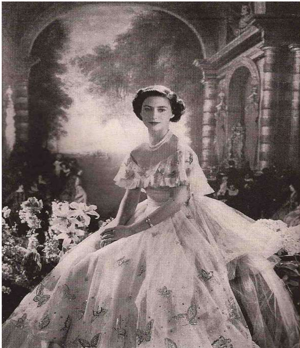
Sl. 10. Princeza Margareta Rose u Diorovoj haljini koju je nosila na svoj 21. rođendan

„Jednostavnost, dobar ukus i njega tri su osnove dobrog stila, a one ne koštaju mnogo novca“ – Christian Dior