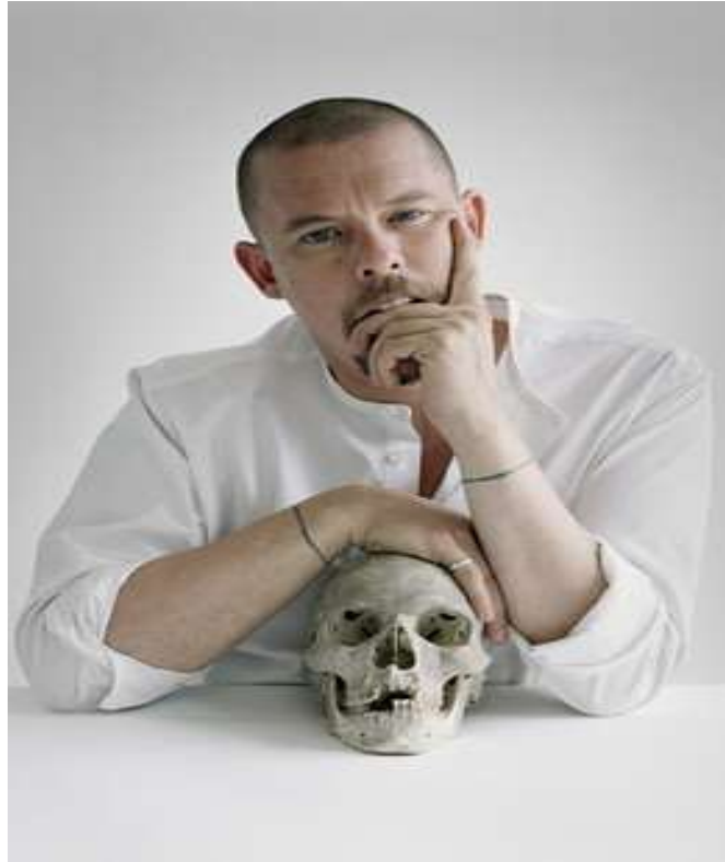
Sl. 16. Alexander McQueen