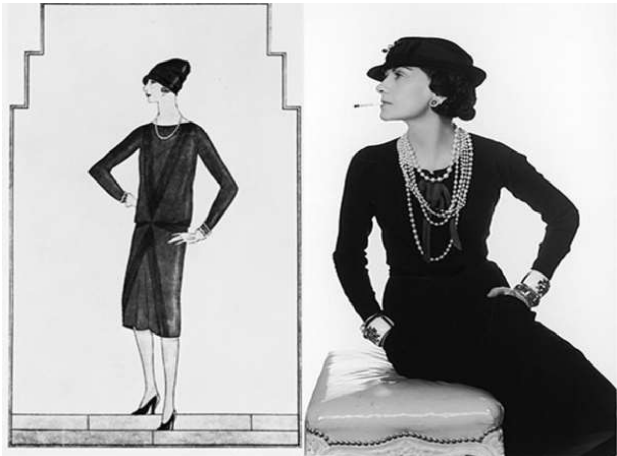
Sl. 4. Mala crna haljina

„Moda je postala šala. Kreatori su zaboravili da se u haljinama nalaze žene. Većina se žena odijeva za muškarce i želi da im se dive. Ali moraju biti sposobne i kretati se, ući u auto bez da popucaju po šavovima! Odjeća mora imati prirodan oblik“ - Coco Chanel