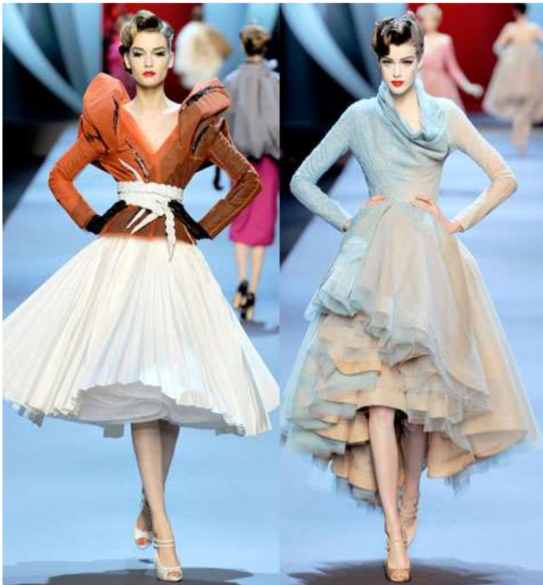
Sl. 12. Kreacije Johna Galliana za modnu kuću Dior inspirirane kolekcijom Diora iz 1947. godine „New Look“

Dior je umro u 52. godini života. Iako je samo deset godina bio na čelu vlastite modne tvrtke, ostavio je neizbrisiv trag u modnoj industriji. Imao je utjecaj na brojne dizajnere prošloga stoljeća, a nema sumnje da će Diorov stil biti prisutan još godinama. Nakon njegove smrti na mjestu kreativnog direktora modne kuće zamijenio ga je Yves Saint Laurent. Svi njegovi nasljednici, među kojima se posebno ističe John Galliano, u svojim kolekcijama uvijek su odavali počast njegovom modnom izričaju.