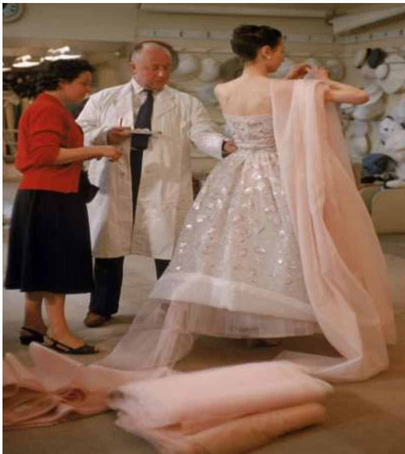
Sl. 11. Pripreme za reviju Christiana Diora u Parizu 1957. godine

Dior je jedan od najutjecajnijih dizajnera 20. stoljeća, vladao je francuskom modnom scenom 40-ih i 50-ih godina prošlog stoljeća. Vratio je ženama eleganciju i ženstvenost. U teškim postratnim vremenima ulijevao je nadu u oporavak modne industrije, premda su mu mnogi zamjerali što je u ratom osiromašenoj Francuskoj, gdje je vladala nestašica osnovnih namjernica, koristio luksuzne i raskošne materijale. Dior je smatrao da će tako probuditi optimizam i vjeru u skori dolazak boljih vremena, što se u konačnici i pokazalo točnim. Ljepotu žene uspoređuje s cvijetom, traži inspiraciju u prirodi. Diorova žena je elegantna i putena, vraćena joj je ženstvenost koja se tijekom rata izgubila. Kako su muškarci odlazili u rat, žene su morale preuzeti sve njihove uloge i raditi muške poslove, a to, naravno, nije bilo moguće u nefunkcionalnim haljinama. Dior je smatrao da, budući da je rat završio, žene bi trebale ponovo vratiti svoje prvobitne uloge. Njegova percepcija ljepote i estetike se uvelike razlikuje od one Coco Chanel. Dior je težio tome da žene budu uređene i dotjerane makar i na račun funkcionalnosti odjeće.