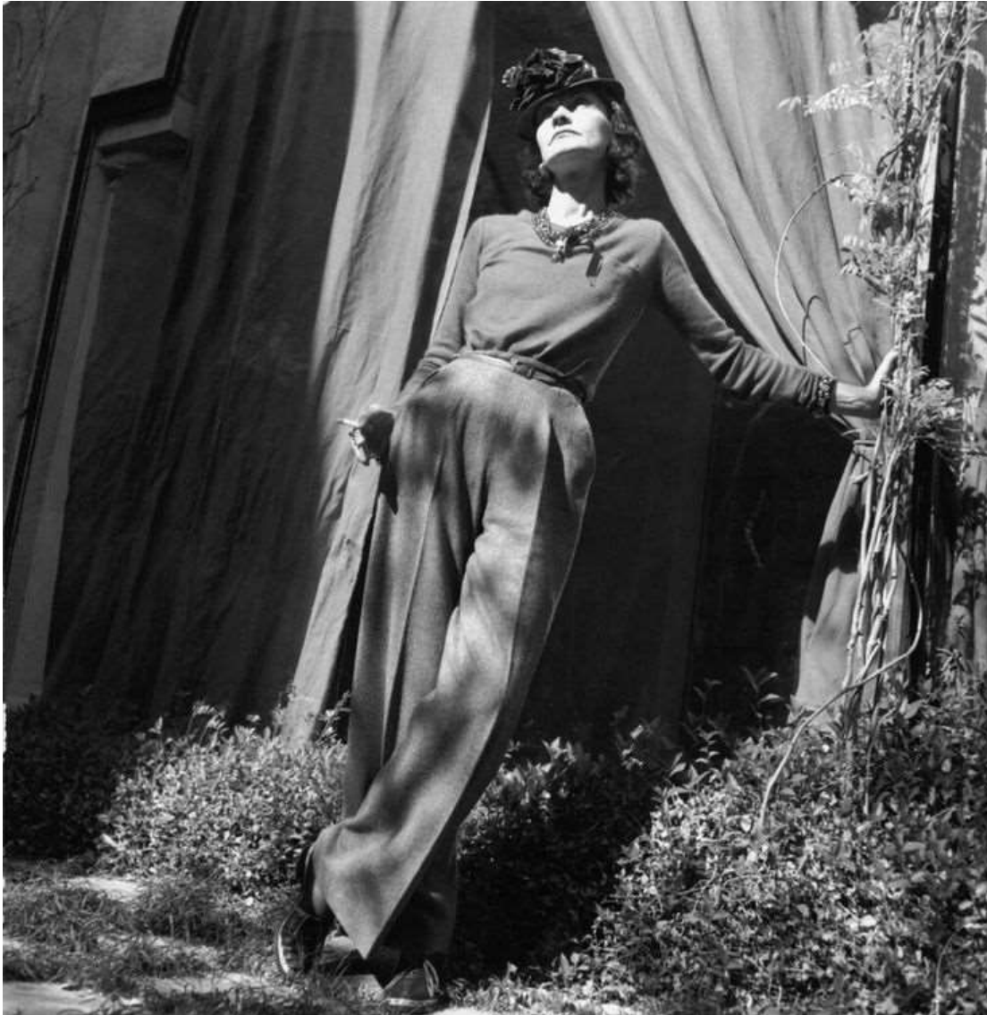
Sl. 3. Coco Chanel u vlastitoj kreaciji

„Hlače čine ženu slobodnom.“ – Coco Chanel