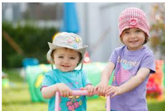
Slika 1 Tekstil za bebe i djecu do treće godine

Tekstil i igračke od tekstila za bebe i djecu do 3 godine starosti npr. donje rublje, kombinezoni, posteljina, mekane igračke i sl.