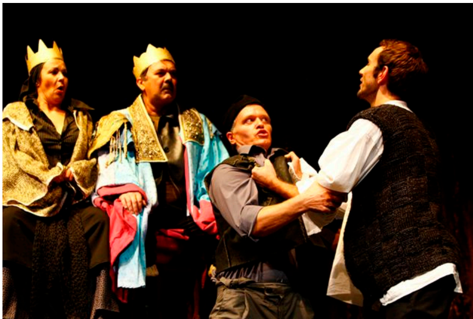
Slika 24. Prizor iz predstave, Kralj, Kraljica gledaju Jocu i Mačka kako se tuku