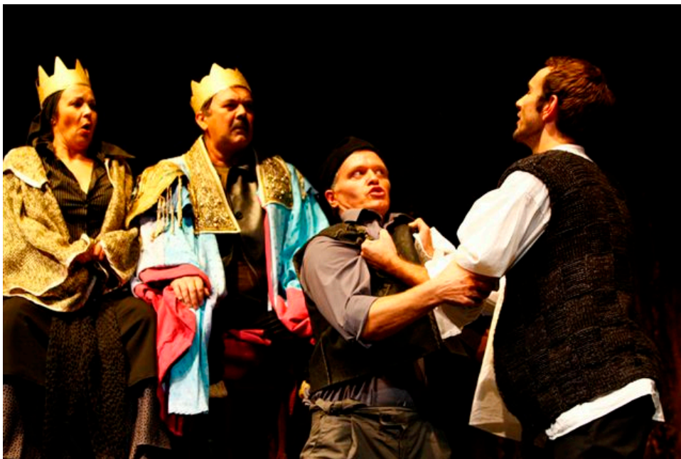
Slika 24. Prizor iz predstave, Kralj, Kraljica gledaju Jocu i Mačka kako se tuku