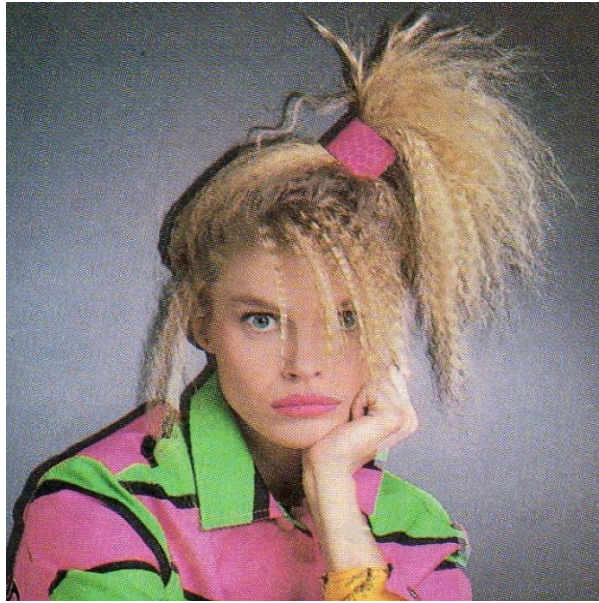
Slika 3. Frizura iz doba 80-tih