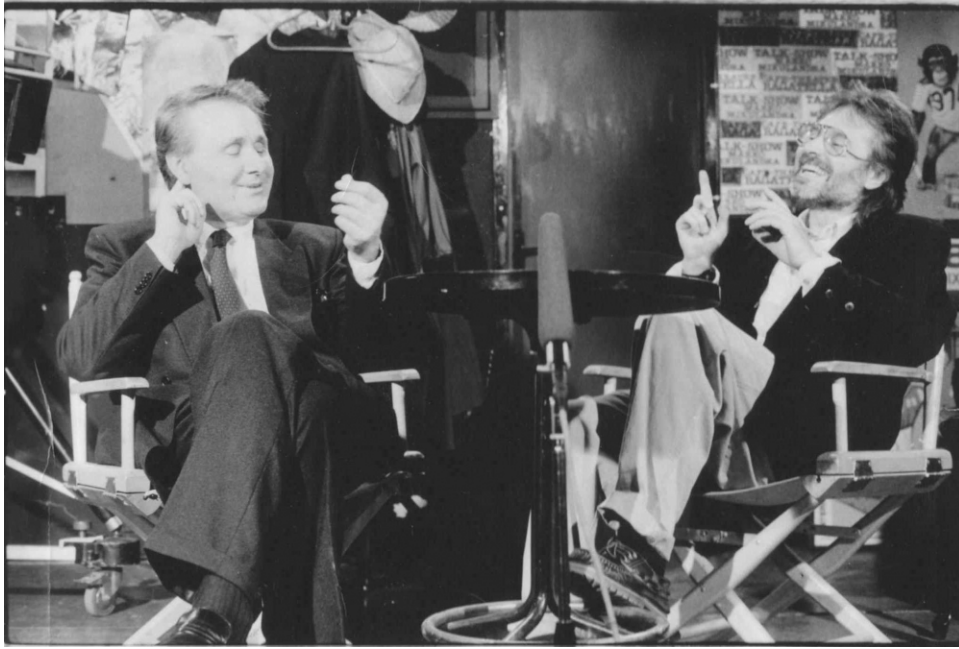
Slika 21. Prikaz Krste Papića u mlađim danima

Osim dokumentaraca, Krsto Papić je postao poznat i po svojim igranim filmovima. Godine 1969. režirao je „Lisice“ koje problematiziraju represiju komunističke tajne policije. Film je osvojio Zlatnu arenu i prikazan je u Cannesu. Potom su uslijedili „Predstava Hamleta u selu Mrduša Donja“ pa horor „Izbavitelj“ (1976.) 80-ih godina prošloga stoljeća Papić je režirao biografski film „Tajna Nikole Tesle“, a 1988. snimio je „Život sa stricem“, svoj najbolji film. Film je bio veliki hit, iritirao je komunističke vlastodršce, ali je ipak dobio Zlatnu arenu i nagradu festivalu u Montrealu. Nakon osamostaljenja Hrvatske, Papić je snimio „Priču iz Hrvatske“ (1992.). „Kad mrtvi zapjevaju“ tragikomedija je kojom je osvojio treću Zlatnu arenu.