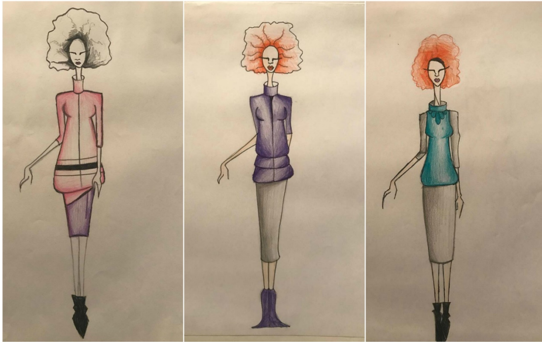
Slika: Primjer kostima za predstavu "Predstava Hamleta u selu Mrduša Donja"