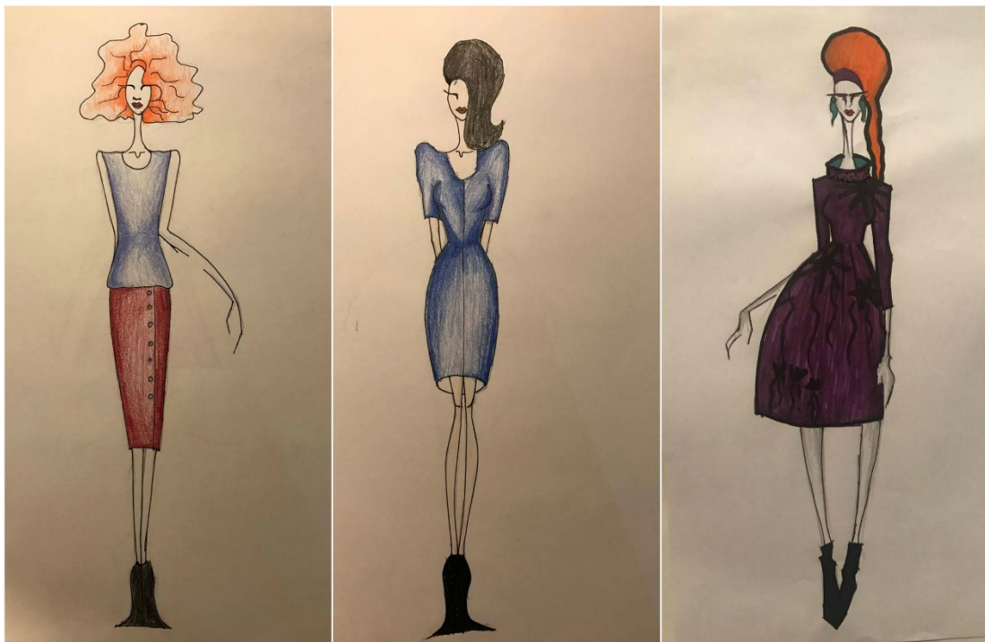
Slika: Primjer kostima za predstavu "Predstava Hamleta u selu Mrduša Donja"