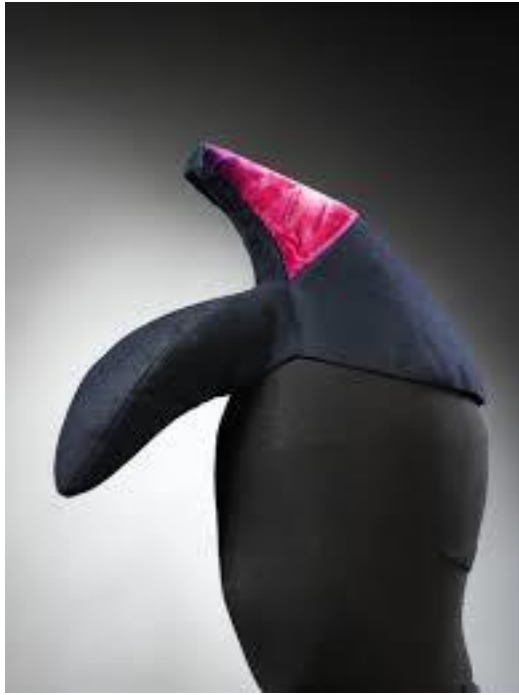
Sl.1. Prenamijena crne cipele sa rozom štiklom

Tridesetih godina dvadesetog stoljeća Hollywood postaje ovisan o modi stoga se javlja pojam personalityja , za koje Edgar Moren govori da su se proizvodili kao roba odnosno da su ju čak u potpunosti predstavljali jer su bili zaduženi za samu promociju i plasiranje modnih trendova koja je tad bila mješavina visoke mode, narodnog spektakla i uličnog stila. Također ih definira kao kontradikciju zvijezde kao božanstva i zvijezde kao robe. (Kastelli, 2007: 5,105) Dyer je personalityje definirao kao modne ikone koje su uz konotaciju visokog društva i ekskluzivnosti predstavljale modu masama. (Kastelli, 2007: 107 prema Dyer 1979:42) Javlja se i pojam glamura, koji u francuskom rječniku označava „ charme ”, odnosno šarm, koji 1961. godine biva u internacionalnom rječniku opisan kao: „neshvatljiva, misteriozno uzbudljiva, često iluzorna privlačnost koja potiče maštu i podmiruje želju za nekonvencionalnim, neočekivanim i egzotičnim”, a u drugome pokušaju, glamur je opisan kao: „primamljiva atmosfera romantične začaranosti, opčinjujući, neopipljivi, neodoljivo privlačan šarm i stav u kombinaciji sa fizičkom i seksualnom privlačnošću”. (Kastelli, 2007:7)