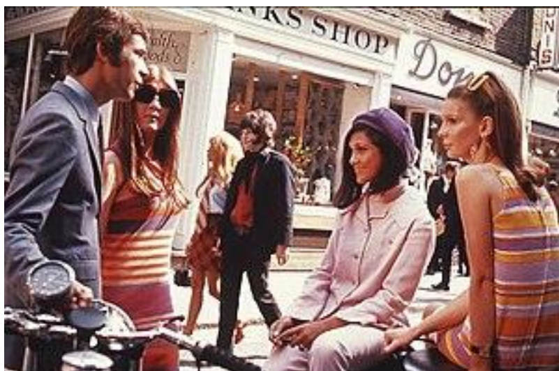
sl.3. Epicentar mode šezdesetih, London, 1966. godina

Sedamdesetih godina dvadesetog stoljeća, odijevanje predstavlja obranu životnog stila i individualne filozofije, u mnogim slučajevima postaje i antikapitalistički i antiratni statement . U osamdesetima nastupa revolucija u modnoj fotografiji te izniču parade fantastičnih umjetnika dizajnera avangarde ( Rei Kawabuko, Alexander Mcqueen, Martin Margiela ). Modni performans se koristi kao sredstvo provokacije javnosti, a suvremena se moda približila umjetnosti, porušila sve granice i pomiješala različitosti. Javlja se konceptualizam koji propituje beskrajni umjetnički potencijal mode. Devedesetih godina tijelo poprima novo značenje, kiborgizacijom tijela ono postaje živi stroj. Zalazimo u kulturu spektakla, gdje se kulturom trguje, a roba je vodeća stavka kapitalizma, čime se sama moda podvrgnula stezi globalnog tržišta.