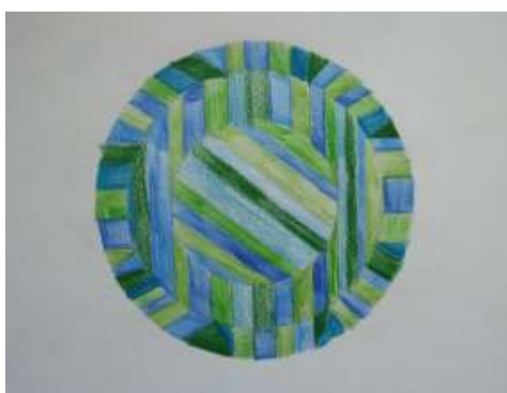
Slika 28 2.krug

Drugi krug sam podijelila na tri kružnice sa istim ishodištem osi. Vanjski najveći krug podjelila sam zrakasto ravnim linijama koje dolaze iz osi. Dva unutarnja kruga podjeljena su usporednim linijama iste širine s time što je unutarnji najmanji krug zaokrenut za 45°.