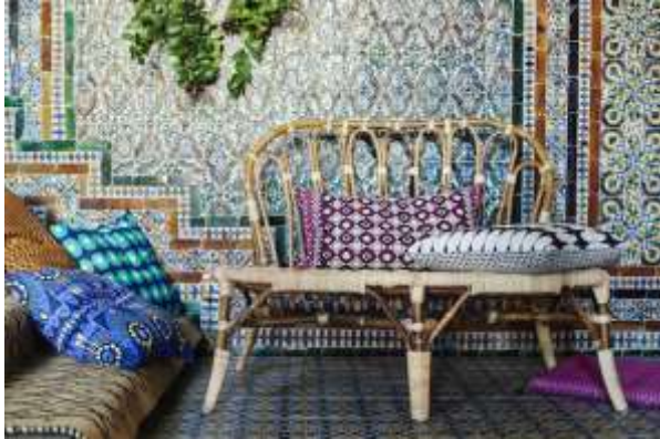
Slika 8 Paulin Machado