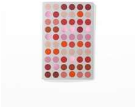
Slika 1 Hella Jongerius

Hella Jongerius zanimljiva je zbog istodobnog spajanja suvremenog dizajna i tehnika koje su se koristile u prošlosti. Koristeći uglavnom iste šarene boje u svom dizajnu stvara njihove različite nijanse, a to dobija kombinirajući ih sa različitim akromatskim tonovima u podlozi (crna, bijela, siva).