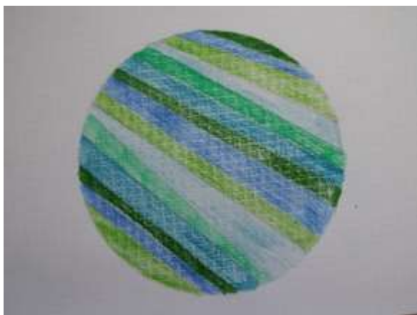
Slika 27 1.krug

Prvi krug podijelila sam na 10 širokih površina ravnih linija obojenih naizmjenično sa tri plava i tri zelena tona.