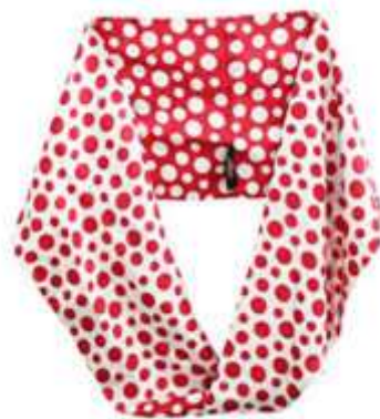
Slika 18 Yayoi Kusame