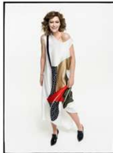
Slika 5 Modni brend I - gle