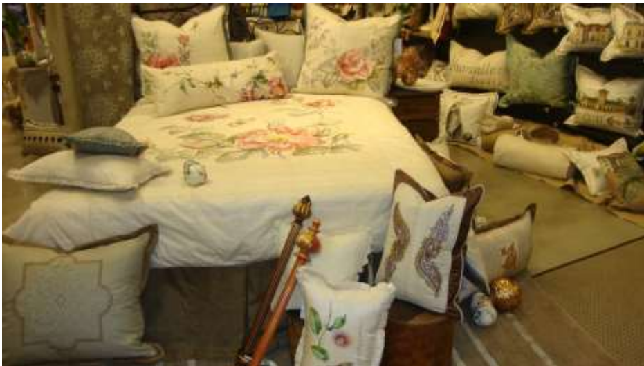
Slika 11 Shantalles

Ova tvrtka posluje iz Amerike. Osnovana je prije više od 20. godina. Oni nude ekskluzivne i ručno oslikane tekstilije i jastuke, kao i ručno rađene kućne potrepštine i draperije. Materijal od kojeg izrađuju svoje proizvode za posteljno rublje većinom je svila. Iako za svaku sezonu imaju određene uzorke sa svojim se kupcima mogu dogovoriti i oko izrade uzorka kojeg su prije imali u svojoj ponudi, broju boja, dimenzijama samog proizvoda. U svome se poslovanju uz to što svojim kupcima žele osigurati što bolju kvalitetu proizvoda, brinu i o zaposlenicima svoje tvrtke.