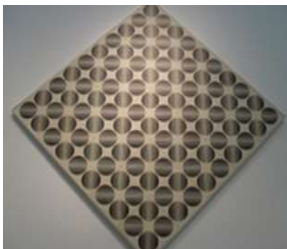
Slika 25 Ivan Picelj

Ivan Picelj jedan je od rijetkih umjetnika čiji mi se radovi samo u akromatskim tonovima dopadaju. Na radovima na kojima koristi boje dobiva odlične kombinacije korištenjem minimalnog broja boja (svega dvije do tri). Igra se sa pravokutnim oblicima slažući ih u koncept labirinta, a takve je njegove radove također moguće gledati na različite načine.