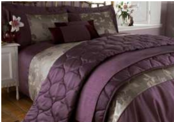
Slika 6 Modna kuća Trussardi