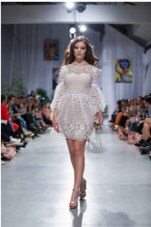
Slika 3 Modni brend Elfs

Modni brend Elfs zanimljiv je zbog toga što osim odjeće u svojim modnim kolekcijama imaju i druge predmete. Također, zanimljivo je i to što uz liniju za žene imaju i liniju muške te dječje odjeće. Uz cvjetne motive koriste i životinjske motive te je upravo po tome njihov brend najprepoznatljiviji.