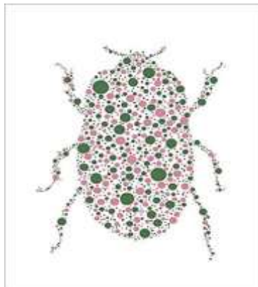
Slika 16 Takehito Koganezawa