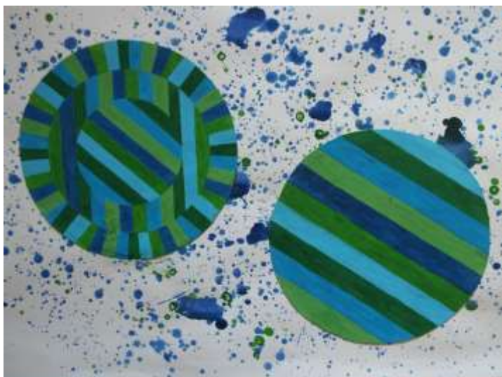
Slika 29 krugovi popluna na podlozi

Treći krug podijelila sam tako da je u središtu krug veličine za \frac{1}{5} promjera kruga. Kroz središte osi provukla sam ukrštene linije a uz rub manjeg kruga provukla sam linije tako da prave križ sa dvije trake, koje sam obojila naizmjenice plavo i zeleno u zadanim tonovima. Po dijagonali križa povukla sam usporedne linije koje izlaze zrakasto iz središta. Četvrti krug ponovila sam usporedne linije kao kod prvog kruga, ove elemente sam uklopila u navlaku za jastučnicu. Krugovi su veličine 35 cm i 23 cm a ploha jastučnice je veličine 77 X 68 cm.