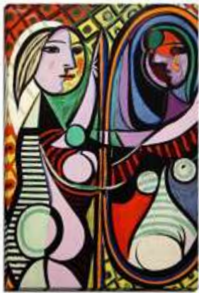
Slika 20 Pablo Picasso

Pablo Picasso rođen je 1881. u Španjolskoj. Studirao je na umjetničkoj akademiji u Madridu. Umro je 1973. godine. Bio je slikar, kipar, grafičar, a bavio se i književnošću. Veći dio svojega života proveo je u Francuskoj. Njegovi periodi u slikarstvu bili su: Plava faza, Ružičasta faza, Kubizam, Neoklasicizam, Surrealizam. Još jedna od njegovih faza bila je Afrička umjetnost i primitivizam. Time se bavio u razdoblju od 1906. do 1909. Ta se faza naziva još i Crni period. Picassov je interes izazvao Henri Matis koji mu je pokazao afričku masku. Njegovi radovi potaknuti tom tematikom su: Gospođice iz Avignona, Poprsje žene, Majka i dijete. Inspiracija afričkom maskom napravila je revolucionarni preokret u modernoj umjetnosti početka 20 stoljeća. Bavio se kostimografijom za Ruski balet.