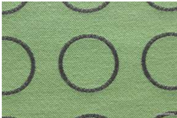
Slika 2 Hella Jongerius