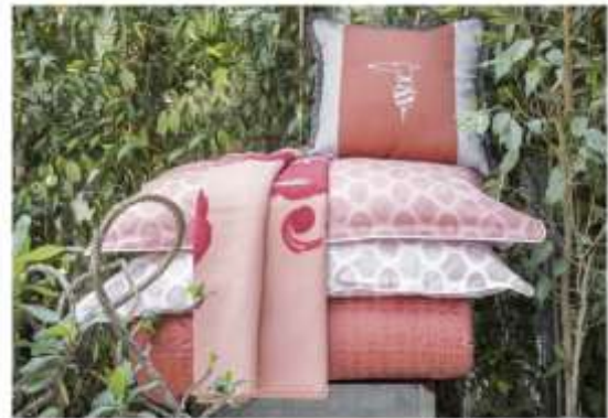
Slika 7 Modna kuća Trussardi