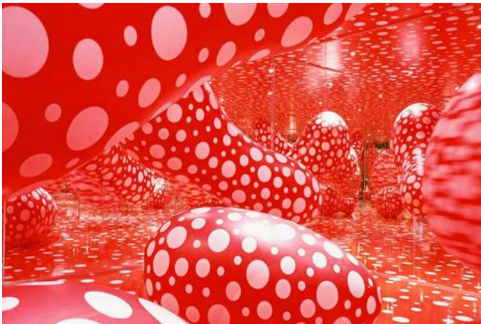
Slika 17 Yayoi Kusame

Kod Yayoi Kusame je dobro to što kombinacijom samo dvije boje priča cijelu svoju umjetničku priču; a u to uklapa i boju kose svojih modela.