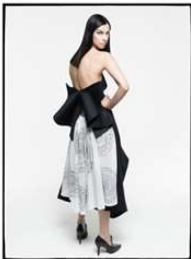
Slika 4 Modni brend I - gle

Modni brend I - gle prepoznatljiv je po svom šarenom dizajnu koji se sviđa mnogim ženama. Njihove proizvode moguće je kupiti u njihovom dućanu po nešto nižoj cijeni, kao i model izrađen po mjeri u njihovom salonu. Iz osobnog iskustva znam da prema potencijalnim klijentima imaju divan odnos koji je vidljiv već pri prvom dolasku u salon. Također, jako su susretljive i spremne pomoći pri odabiru materijala i davanja savjeta o kroju budućeg proizvoda. Sam krajnji model ispada doista predivan.