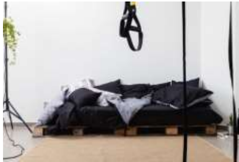
Slika 14 Lull

Uzela sam dvije veće firme, jednu manju, te dva dizajnera iz IKEA-e. Kod većih firmi jedna koju sam odabrala bavi se tiskom na posteljno rublje, a druga je firma koja se bavi ručnim oslikavanjem tekstila. Kod njih je jako dobro to što njihovi kupci mogu sami izabrati ono što bi oni htjeli na svojim proizvodima unatoč tome što se nalazi u njihovoj trenutnoj kolekciji. Kod dizajnera koji rade za IKEA-u dobro je to što je kreator uz moderan dizajn i tisak na proizvode izabrao i doradu ručnom tehnikom, a druga je cijelu kolekciju izradila ručnom tehnikom. Također, je dobro i to što se pri izradi proizvoda vode i razgovorom sa lokalnim stanovništvom iz zemalja iz kojih ti uzorci potječu. Brend Lull odabrala sam zbog puno šarenih boja na kojima se bazira njihov dizajn.