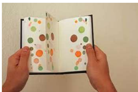
Slika 15 Takehito Koganezawa

Kod Takehita Koganezawe zanimljivo je to što od minijaturnih geometrijskih oblika dobiva veće. Koristi puno šarenih boja koje se međusobno dobro uklapaju. U svojoj video umjetnosti koristi se i povijesnim ali i suvremenim elementima. Od povijesnih elemenata imamo na primjer starinski televizor na kojeg su mnogi od nas već zaboravili, a projekcija na zid u šarenim bojama primjer je uporabe moderne tehnologije.