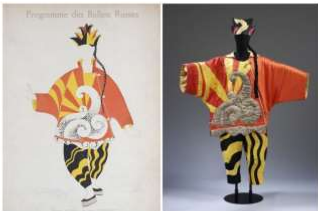
Slika 22 Pablo Picasso