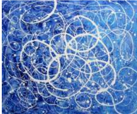
Slika 24 Jackson Pollock