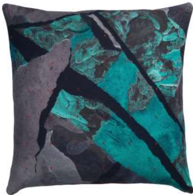
Slika 10 Martin Bergstrom

Martin Bergstrom švedski je modni dizajner i dizajner uzoraka. Rođen je 1978. Školovao se u Berlinu. Za IKEA-u je 2018. godine radio kolekciju ANNANSTANS. U njoj se sa suvremenim konceptom dizajna (računalni dizajn) spaja izraz vještih ruku obrtnika iz Indije, Rumunjske i Tajlanda. U kolekciji jastuka postoji osam komada, i različitih su dimenzija. Na svakoj strani nalaze se različiti računalno napravljeni uzorci. Indijskom vezu dodao je čar ručnog dizajna.