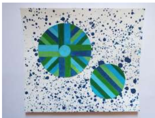
Slika 31 3. i 4.krug na podlozi