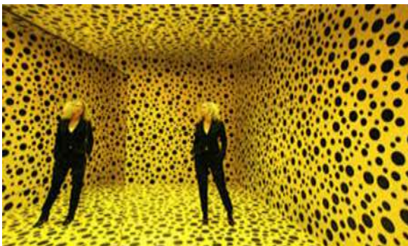
Slika 19 Yayoi Kusame