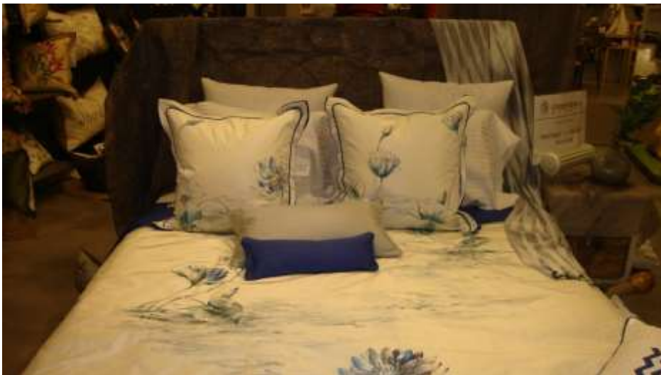
Slika 12 Shantalles