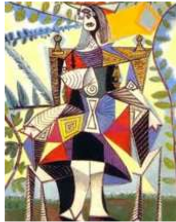
Slika 21 Pablo Picasso