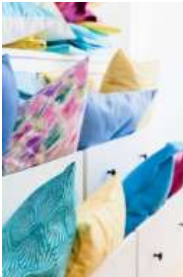
Slika 13 Lull

Značenje naziva brenda u hrvatskom jeziku je mir, tišina, odmor. Kolekcije posteljine nose naziv Dream On, True Colors, Gajba, Keep it simple. Kolekcija Dream on sanjiva je i romantična, a bogata je detaljima kao što su volani i čipka. Kolekcija True Colors sugerira pozitivan stav i otvorenost za nova iskustva, a zbog jake eksplozivnosti boja linije proizvoda su čiste. Kolekcija Gajba snažna je i sirova, a prevladava tamna paleta boja te je prilagođena i muškom spolu. Kolekciju Keep it simple označavaju jednostavne linije i osnovne boje.