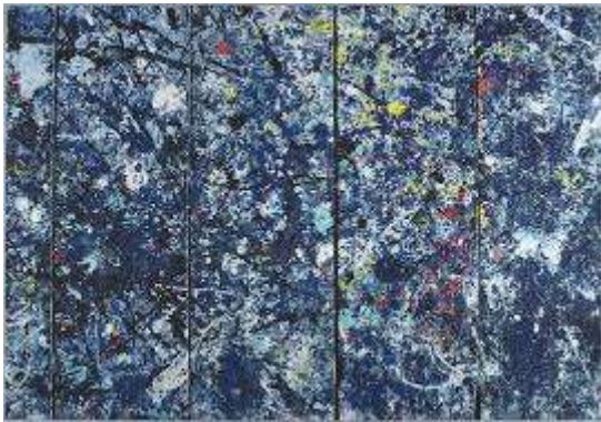
Slika 23 Jackson Pollock

Jackson Pollock radove je izvodio na principu kapanja, lijevanja i prskanja bojom.