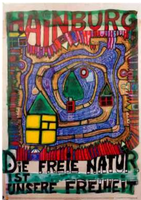
Slika 6. , Hundertwasserov plakat: " Slobodna priroda je naša vlastita sloboda" , 1984.