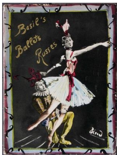
(sl. 18) / ilustracija za Ballet Russes, monte carlo 1937., C. Berard

Uz to, svoje ilustracije izlagao je u mnogim časopisima poput Vogue-a, Harper's Bazaar-a, Art et Style-a te Formes et Couleurs-a. Mnogim dizajnerima je bio inspiracija, radio je na kreiranju unutarnjeg dizajna te dizajnirao tapete i ogrtače. Poslije njegove smrti 1949. mnogi radovi sačuvani su u New Yorku u Muzeju Moderne umjetnosti.