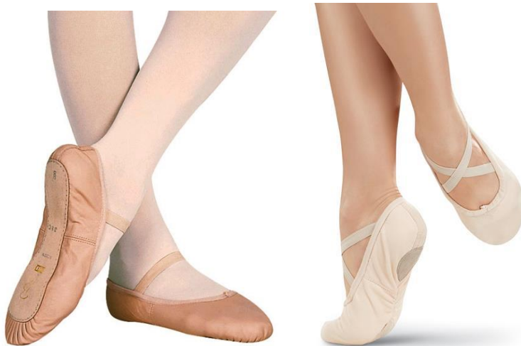
(sl.2) Baletne papučice danas

Izuzev toga što olakšavaju plesačima da se kreću nesmetano po pozornici, pružaju i dodatnu sigurnost time što su učvršćene elastičnom trakom koja naliježe preko samoga gležnja te vrpce koje se reguliraju u otpuštanju i zatezanju same papučice. Dolaze u varijanti jedne elastične trake ili dvije u obliku slova X. Nekada proizvođači samo našiju dvije trake te ostavljaju plesačima da ih sami zašiju kako bi se prilagodile stopalu.