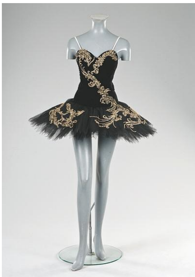
(sl.5) „Pačkica“ , Labuđe jezero