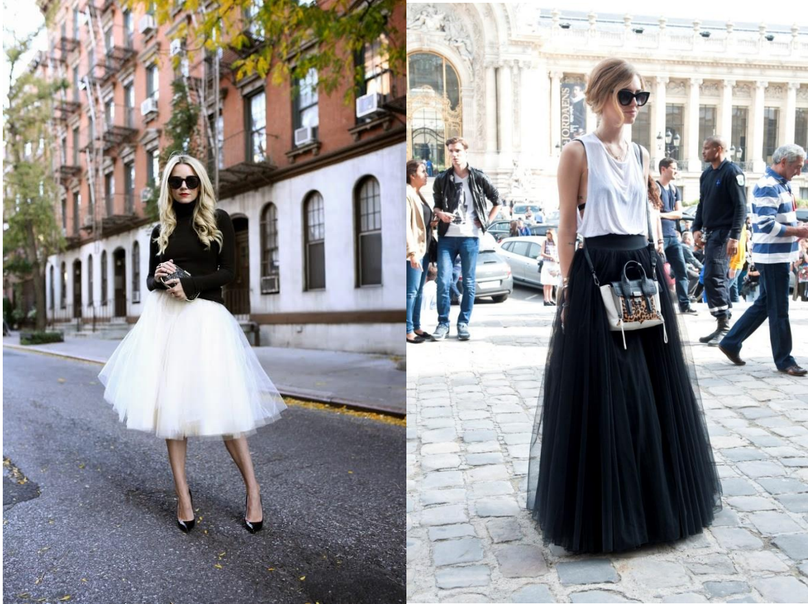
(sl.11/12) Varijacije na klasične baletne haljine u modnom izričaju