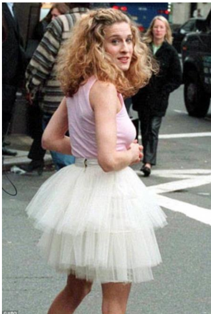
(sl.10) Sarah Jessica Parker, „Seks i grad“ 1998.god