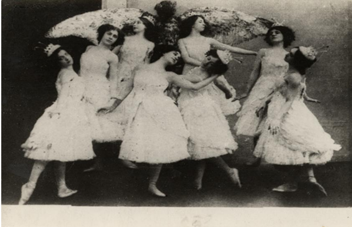
(sl.1) „Labuđe jezero“ 1910., Boljšoj kazalište / izbor : Novinski članak Victoria & Albert muzej, London