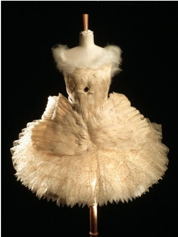
(sl. 16)/ The Swan Lake, baletni kostim, 1907., L. Bakst