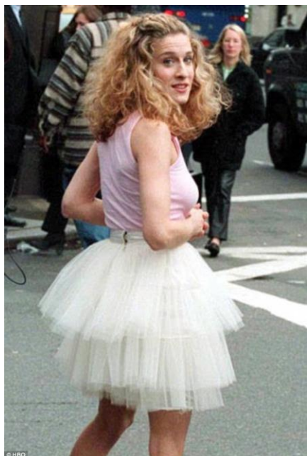
(sl.10) Sarah Jessica Parker, „Seks i grad“ 1998.god