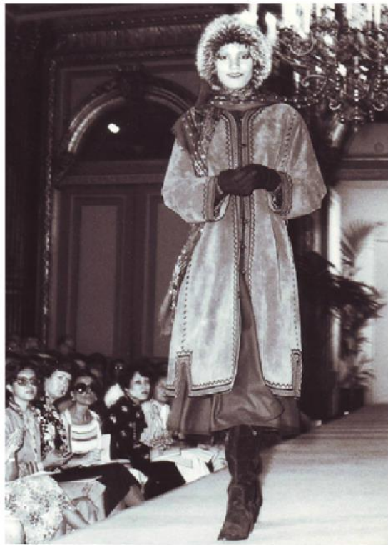
(sl.28,29) – YSL, kolekcija 1976.god u Inter Continental Hotelu