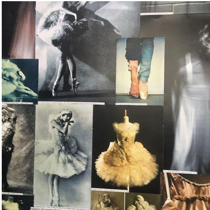
(sl.19) Pozadina baletne scene te isječci koji su inspirirali Valentina za kolekciju jesen/zima 2016.)