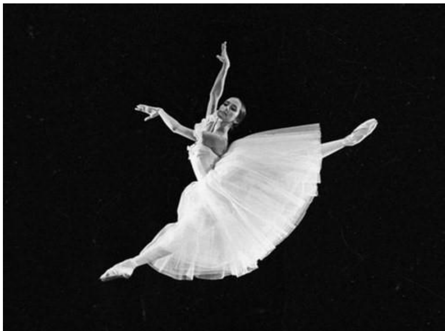
(sl.4) N. Bessmernova, Giselle, 1963.god, dugačka haljina