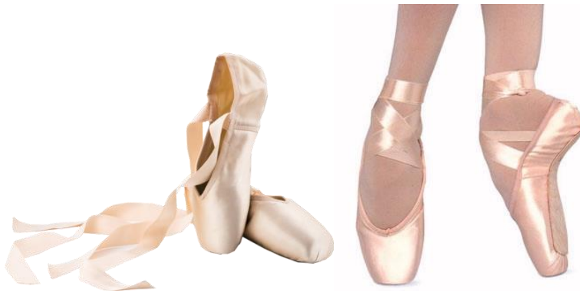
(sl.3) Špicerice danas

Danas poznajemo mnogo proizvodnih oblika špicerica no najjednostavniji primjer vidljiv je u satenskoj podlozi, drvu na vrhovima prstiju koje je pričvršćeno ljepilom za satenski materijal te kožnim dijelom na dnu stopala ukoliko je potrebno.