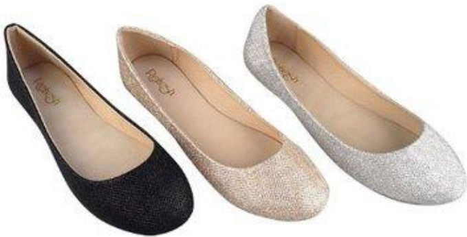
(sl.7) Baletanke bez potpetice