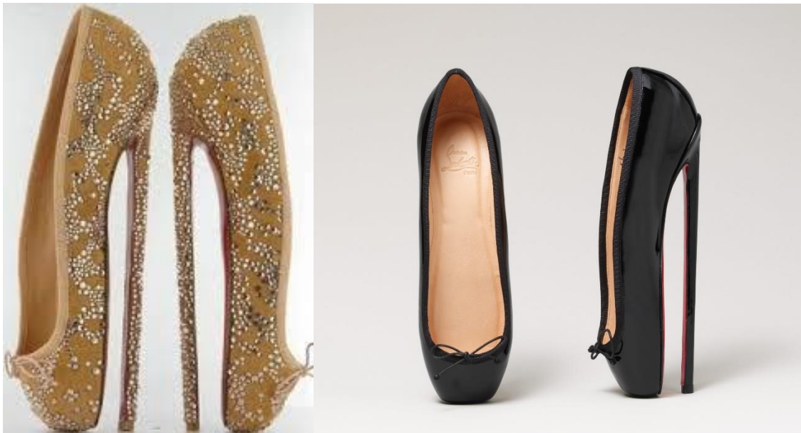
(sl.8/9) „Ballet boot“, primjerak cipele s izraženom potpeticom

Visoke potpetice izraženog vrha nisu obuća u kojoj je moguće hodati ili plesati. To su potpetice korištene u burleskama ili osobnim potrebama, često indicirajući na fetish proizvod. Ideja samog proizvoda je da nogu i stopalo učini što ispruženijom i duljim, potpetica ima minimalnu visinu od 18 centimetara dok predio prstiju ne izgleda nimalo drukčije od klasičnih baletnih špicerica. Po želji, to mogu biti čizme ili niskog kroja salonke, učvršćene gumom ili trakama. Najčešće se proizvode od lakirane, umjetne ili prave kože kako bi bile što čvršće i stabilnije. Nisu pogodne za šetnju te nisu dostupne u trgovinama. Kupnja se najčešće obavlja putem interneta ili osobnog dogovora sa dizajnerom. Prvi poznati primjerak ovakve obuće javlja se ne toliko davno, 1900.godine u Beču kao dio fetish obuće te je potpetica dosegla nevjerojatnih 28 centimetara! Upravo iz tog razloga, što je potpetica bila veća od same cipele – onemogućila je ikakvu mobilnost. Tek krajem XX. stoljeća (1980-tih godina) javljaju se u obliku kakav nam je poznat danas. Na svojoj internet stranici Pierre Silber napominje kako njegovi proizvodi nisu za svakodnevnu uporabu, cipele izrađuje po narudžbi te ih kupci uzimaju za svoje potrebe. Medicinski gledano, ovakav tip obuće ne ide ni malo u korist mušterijama što se tiče pritiska na kralježnicu i stopalo, ne anatomskeg položaja noge te mogućnosti izvrtanja gležnja. Ikakvo dulje nošenje ili korištenje ovakvih potpetica moglo bi ostaviti trajne posljedice.