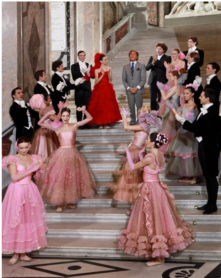
(sl.20) Valentino, 2010.god