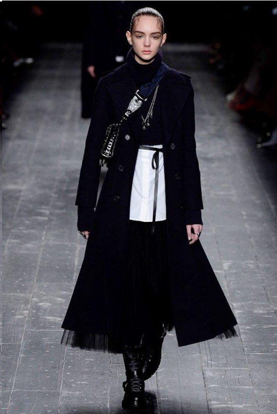
(sl. 21,22,23,24) Izgled piste te odjevni komadi Valentinove kolekcije jesen/zima 2016.