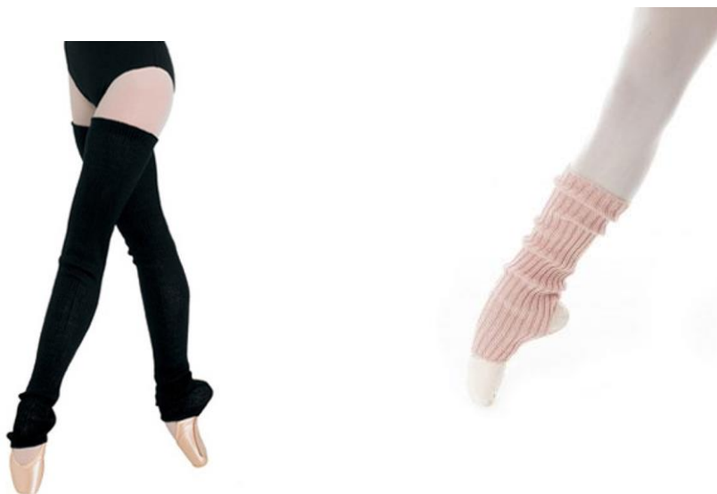
(sl.14) Grijači za noge