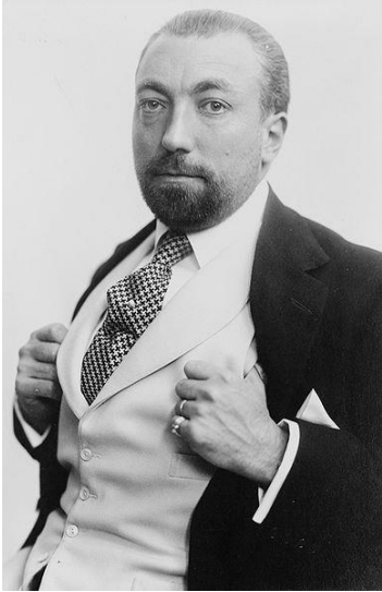
(sl.17) Paul Poiret, portret 1913.

Rođen 1879. u Parizu, pridonio je modnom svijetu koliko Picasso umjetnosti kroz XX. stoljeće. Život u neimaštini prisilio ga je da se snalazi kako bi razvijao svoje vještine koje su ga u kasnijim godinama uzdigle na modno prijestolje. Sakupljao je komadiće tkanine koje bi strgao sa starih kišobrana i sestrih lutaka te je kao tinejdžer prvi put odnio skice čuvenoj krojačici Madeleine Chéruit koja je napravila narudžbu od njega. Radio je za mnoge pariške modne kuće te je slavu stekao tek kada ga je dizajner J. Doucet 1896. zaposlio te prodao njegove primjerke crvenog ogrtača u čak 400 kopija. Poslije toga radio je mnoge jednostavne haljine te se istaknuo u području baleta kada je dizajnirao jednostavni kimono, inovaciju koja je zgrozila mnoge pa čak i samu plesačicu koja je izjavila „Koji horor!“ vidjevši haljinu u kojoj je nastupila. 3