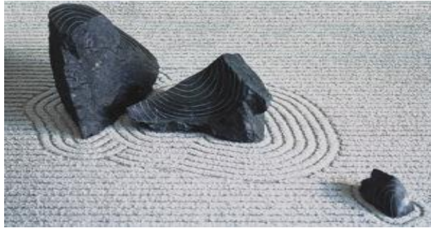
Slika 5.) Estetski objekt na najjednostavniji i najneposredniji način (Zen)

Zen umjetnik sugerira bit estetskog objekta na najjednostavniji i najneposredniji način. Unutar njegova sustava reprezentiranja, bilo što može postati objekt stvaranja. Ova umjetnost ne pokušava stvoriti iluziju "realnosti." Ono napušta prikazivanje "realnosti", i bavi se umjetnim prostornim vezama koje su dizajnirane na način da potaknu čovjeka na razmišljanje o onome što je iza ili iznad stvarnosti.