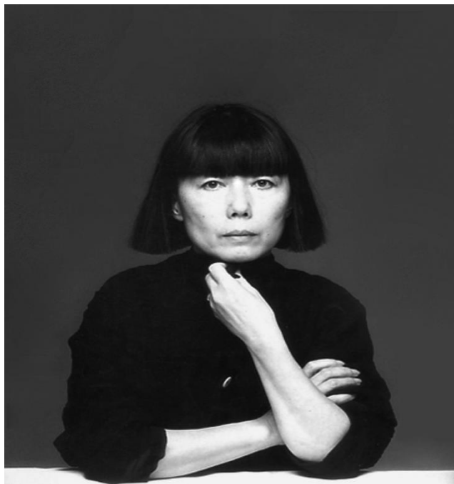
Slika 10.) Rei Kawakubo

Rei Kawakubo japanska je modna dizajnerica rođena 1942. godine u Japanu. Njen rad smatra se paradoksom i ideološkim imperativom. Minimalno, monokromatski i modernistički, njeni su pristupi da modnim dizajnom izazove konvencionalnu ljepotu, bez odricanja stilskih tkanina, skraćivanja i boja. Njezine kreacije se ne baziraju konkretno na samu ljudsku figuru, već prikazuju samo ponašanje prostora oko tijela. Arhitektonski u koncepciji i apstrakciji, bezvremenost odjeće potječe i japanske tradicionalne kulture.