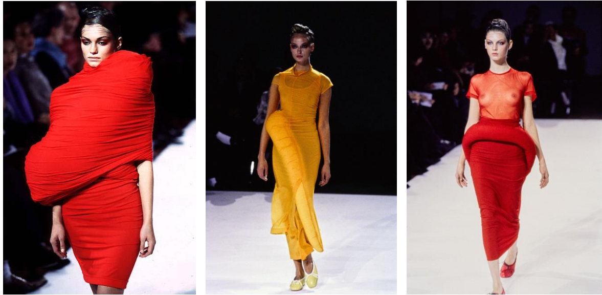
Slika 11.) Rei Kawakubo, proljeće/ljeto 97.

Metropolitan art museum 2017. godine je najavio temu izložbe Costume Institutea u New Yorku; Rei Kawakubo/ Comme de Garçons. čime joj je dobila titulu prve žive dizajnerice kojoj je pripala ova čast, sve od izložbe Yves Sain Lourena iz 1983. Izložba je uključivala oko sto dvadeset kreacija ženske linije Comme de Garçonsa dizajniranih od strane same Kawakubo. 48