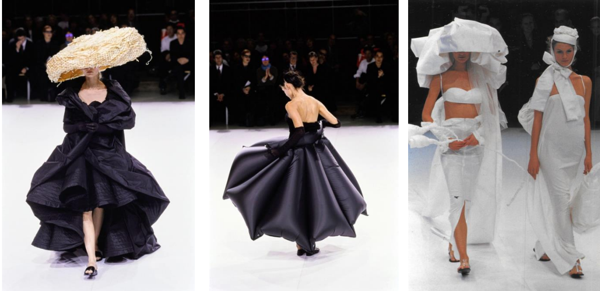
Slika 9.)Yohji Yamamoto, proljeće/ljeto 98/99.

dizajna smatraju se prostornim umjetničkim djelima u kojima je valoviti oblik zgrade poistovjećen s organskom dinamikom postignutom pokretom tijela u haljini. 44