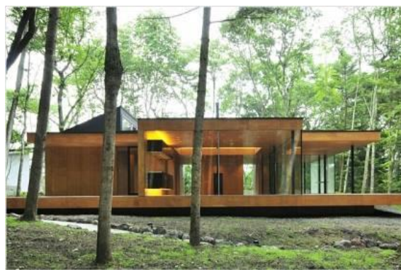
Slika 4: Primjer japanskog doma izvan