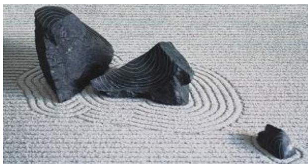
Slika 5.) Estetski objekt na najjednostavniji i najneposredniji način (Zen)

Zen umjetnik sugerira bit estetskog objekta na najjednostavniji i najneposredniji način. Unutar njegova sustava reprezentiranja, bilo što može postati objekt stvaranja. Ova umjetnost ne pokušava stvoriti iluziju "realnosti." Ono napušta prikazivanje "realnosti", i bavi se umjetnim prostornim vezama koje su dizajnirane na način da potaknu čovjeka na razmišljanje o onome što je iza ili iznad stvarnosti.