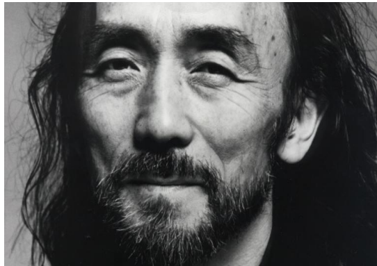
Slika 7.) Yohji Yamamoto

Yohji Yamamoto je nagrađivani japanski modni dizajner sa sjedištem u Tokiu i Parizu. Smatra se jednim od najvećih dizajnera današnjice, specifičan po svom avangardnom stilu koji sadrži estetiku japanskog dizajna. 42