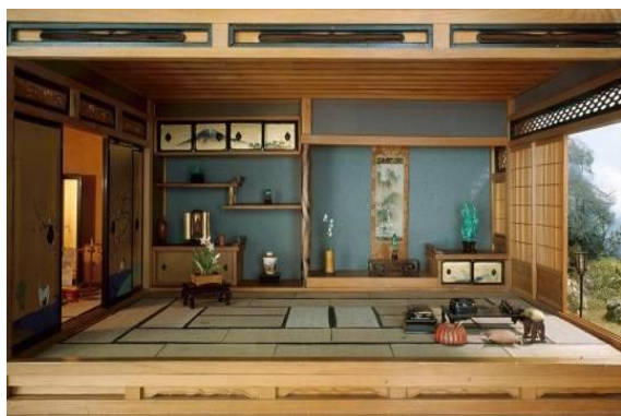
Slika 3: Primjer japanskog doma iznutra

Japanska kultura je svojim vizualnim jezikom, nužno usklađenim s duhovnom i svjetonazorskom misli Dalekog Istoka i proizašlim iz, gotovo, straha od redundancije, bila okidačem europskoga modernizma. Danas, ustrajanjem na načelima poput minimalizma u oblikovanju forme, odgovornosti u društvu i estetizaciji trenutka, iskazanoj u ritualima svakodnevice, predstavlja dragocjenu povezanost masovne kulture neoliberalnog kapitalizma. Japanski arhitekti i dizajneri u suvremenom trenutku, spajajući visoku tehnologiju i inovativne materijale s dekonstrukcijom i dekonstruktivizmom stvaraju dijela koja su uzbudljiva, na način da uznemiruju. 13