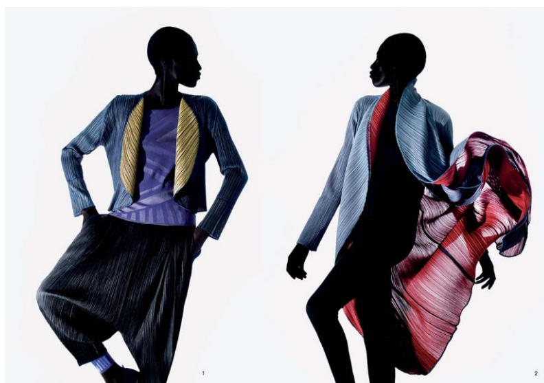
Slika 13.) Issey Miyake, jesen/zima 91/92.

Svojevrsan preokret dogodit će se u drugoj polovici osamdesetih, kada Miyakeov studio broji zavidan broj dizajnera učenika, od kojih iskače Dai Fujiwara. Uz njegovu pomoć nastaje vrlo snažan i utjecajan brend „ Pleats Please by Issey Miyake “. Radi se o originalnom dizajnu odjeće dobivenom obrnutom tehnologijom proizvodnje. Materijali su prvo izrezani i prošiveni, a tek potom oblikovani uzorcima nabora u parnim prešama. Na taj način obrađena odjeća zadržala je oblik nametnut prešom i bila spremna za upotrebu. 50