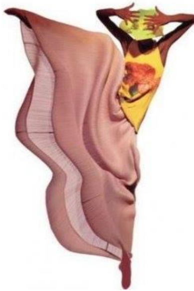
Slika 6.) Ilustrativni primjer japanskog dizajna

Osnovica japanske konstrukcije je kimono koji je rastavljen i otvara neke nove prostorne segmente; drapiranjem i asimetrijama kao specifični i prepoznatljiv kriterij sa Istoka.