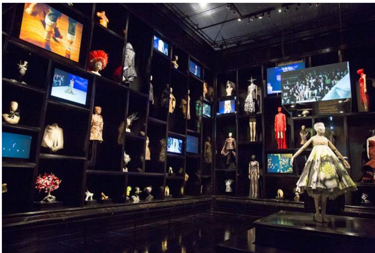
SI. 8