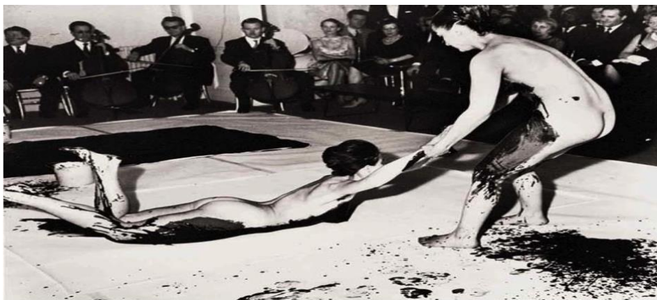
Sl.10 Yves Klein, performans Anthropometries , 1985.