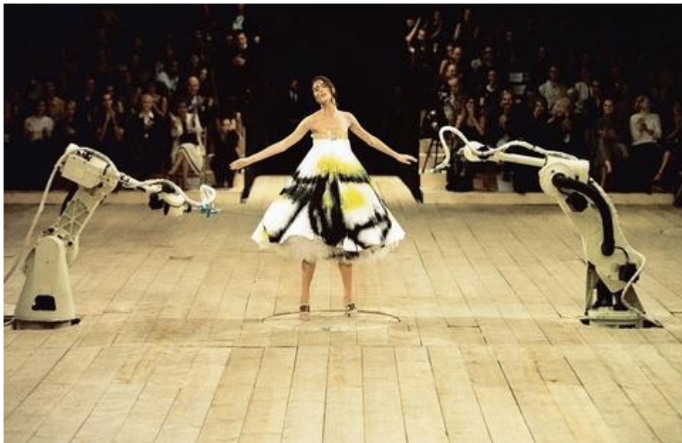
SI. 4

Suradnja ovog dizajnera s Givenchyjem trajala je do 2001. godine, neposredno prije nego što je Guccijeva modna grupacija otkupila 51 posto njegova vlastitog modnog branda Alexander McQueen. Kao razlog prekida suradnje dizajner tada ističe činjenicu da ugovori u ovoj modnoj kući ograničavaju njegovu kreativnost.