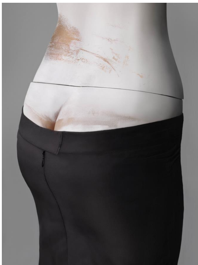
SI. 3

McQueenova sposobnost da zaintrigira medije dovela ga je ubrzo u uzak krug potencijalnih couturiera.