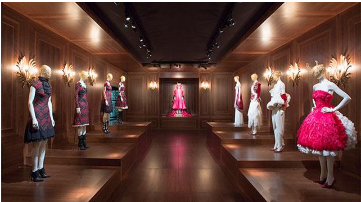
SI. 6

Prva i najveća europska retrospektivna izložba slavnog dizajnera Alexandera McQueena jedno je od hit događanja u modnoj industriji cijelog svijeta. Do ulaznice za “Alexander McQueen: Savage Beauty”(Alexander McQueen: Divlja ljepota) u londonskom Victoria and Albert muzeju gotovo je bilo nemoguće doći, a prve ulaznice – puštene u prodaju putem interneta – prodane su u svega nekoliko minuta.