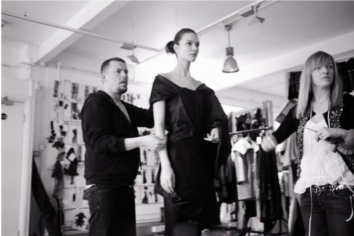
Sl. 5 Alexander McQueen i Sarah Burton za vrijeme zajedničkog rada

Zadnja McQueenova kolekcija za proleće 2010 Platos's Atlantis bila je inspirirana leptirima i izvanzemalcima, a karakterizirala ju je apstraktna odjeća, sa naglasakom na jedinstvene cipele koje je dodatno proslavila Lady Gaga. Armadillo ili monstruozne cipele su tada, pored slavne pjevačice, oduševile mnogobrojne poštovaoce rada ovog dizajnera širom planete. Obojena notom romantike, kako je pisala modna kritika, ova kolekcija je McQueen-a dovela do sasvim različitog nivoa visoke mode sa dramatičnim tonom. Zbunjene emocije, kao što su bjes i agresija, iskazuju se u jakim bojama i ludoj kombinaciji materijala, raznolikih linija i apstraktnog printa.