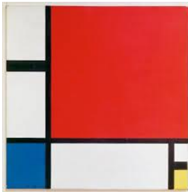
Sl.9 Likovna umjetnost, kompozicija II s crvenom, plavom i žutom, P. Mondrian, 1930.

Premda riječ „umjetnost“ danas uglavnom označava likovne, odnosno vizualne umjetnosti, u tradicionalnom smislu riječi pod umjetnošću podrazumijevamo, književnost, glazbu, likovnu umjetnost i filmsku umjetnost. Svaka se od ovih makro-umjetnosti može dodatno dijeliti na umjetničke discipline, rodove, vrste itd. Književnost se može podijeliti na prozu, liriku i dramu, koja se opet može podijeliti na scenske ili plesne umjetnosti i sl. Glazba se može podijeliti na tradicionalnu, klasičnu, jazz i rock glazbu, od kuda se dalje može doći do pjevačke ili sviračke umjetnosti; likovnu umjetnost na slikarstvo, kiparstvo i arhitekturu, od kuda se može doći do umjetnosti preformansa, video umjetnosti, fotografske umjetnosti, internet umjetnosti i sl.