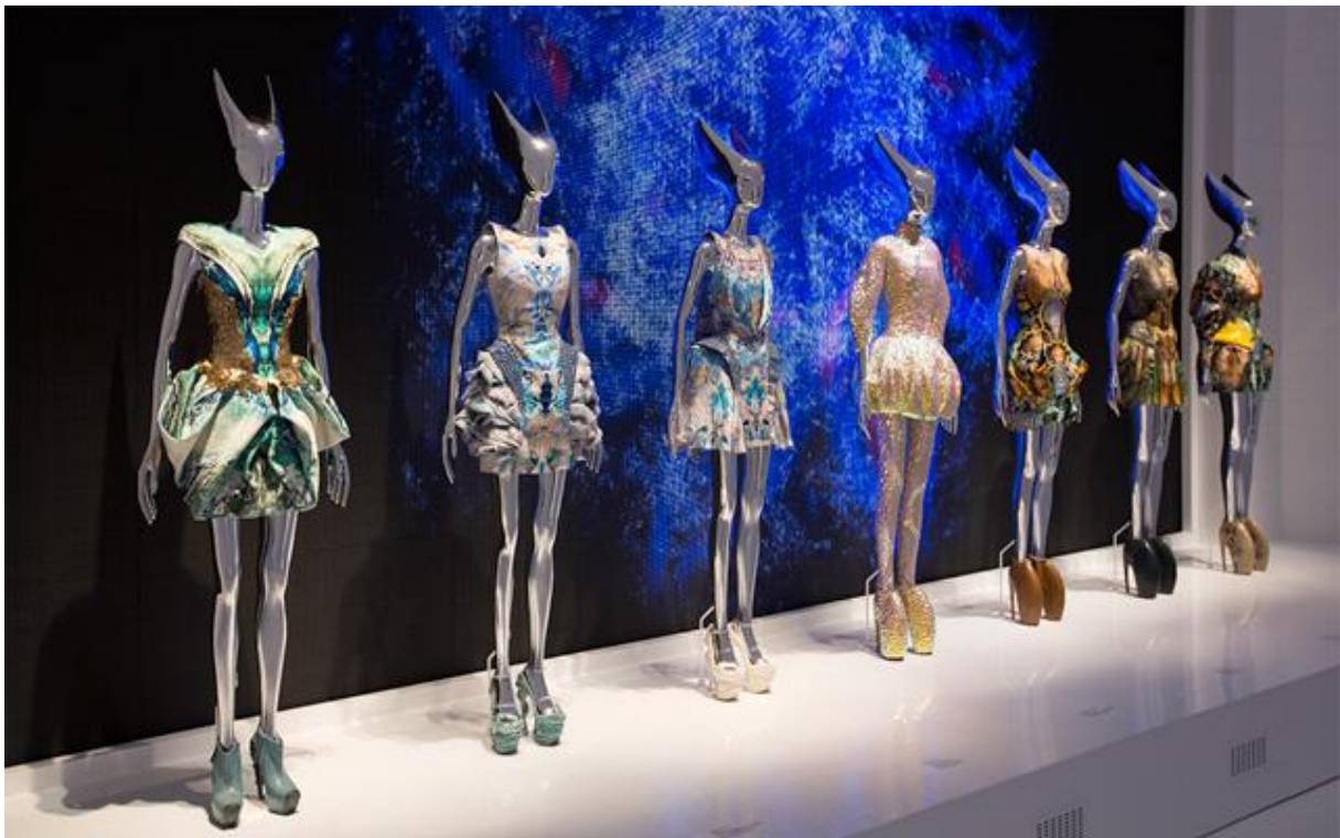
SI. 7

McQueenova priča je potpuno londonska. Prva prostorija na izložbi to i naglašava i podsjeća na Gatliff Road skladište, gdje je prikazana njegova prva revija – ona u kojoj su se mogle naći kreacije u koje je dizajner ušivao pramen svoje kose. Druga prostorija sa sivim zidovima i sivom rasvjetom priziva ugođaj Hoxton studija iz njegove rane faze. Tu su izložene i njegove čuvene hlače s niskim strukom. Prostorije se dalje povećavaju i postaju sve raskošnije kako raste i njegov uspjeh, dizajnira visoku modu za Givenchy i izlaže na Pariškome tjednu mode; sivi zidovi i rasvjeta dalje prelaze u drvene podloge s pozlatom, a industrijska rasvjeta zamijenjena posebnom rasvjetom prilagođenom pozornici, tzv. Stage Spotlight.