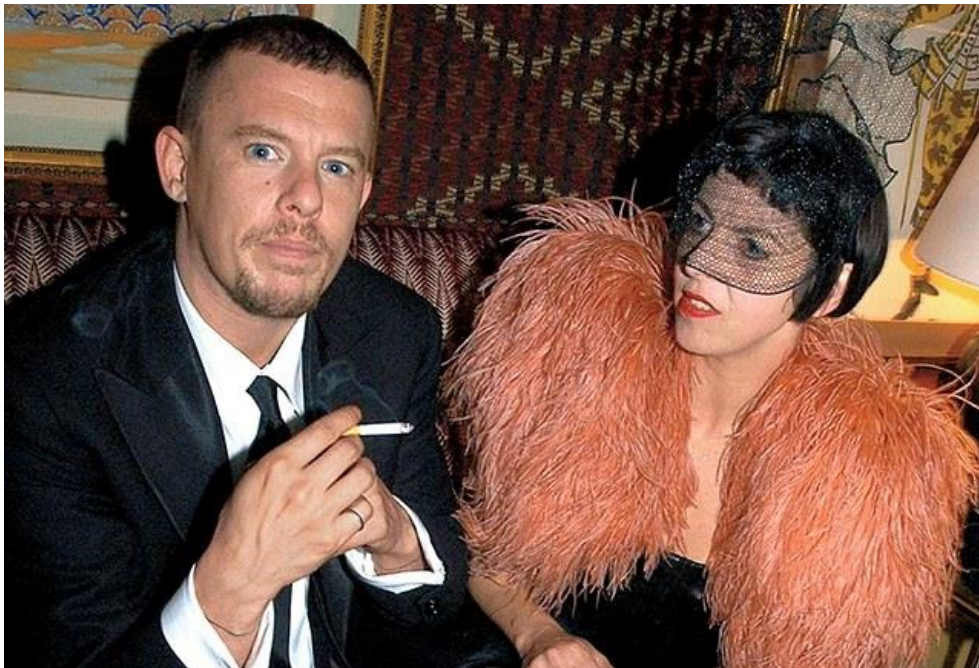
Sl.2 Alexander McQueen i Isabella Blow

Od prvog trenutka bila je sigurna da se radi o izvanserijskom modnom genijalcu te ga je odlučila materijalno i moralno podržati. Njihovo prijateljstvo preraslo je u legendu. Ni revije koje su uslijedile nisu bile manje kontroverzne. Održavao ih je u botaničkom vrtu, pod cirkuskim šatorom, na klizalištu, katkada su manekenke hodale poput Isusa po vodi, a ponekad ih se i odrekao, prikazujući svoje ideje na lutkama. Od samih početaka vidljive su sve ideje koje će se tijekom karijere razviti u jedinstven "McQueen look": korzeti, haljine-krinoline, kombinezoni, svemirska odijela, ali i izraziti utjecaj starohollywoodskog glamoura.