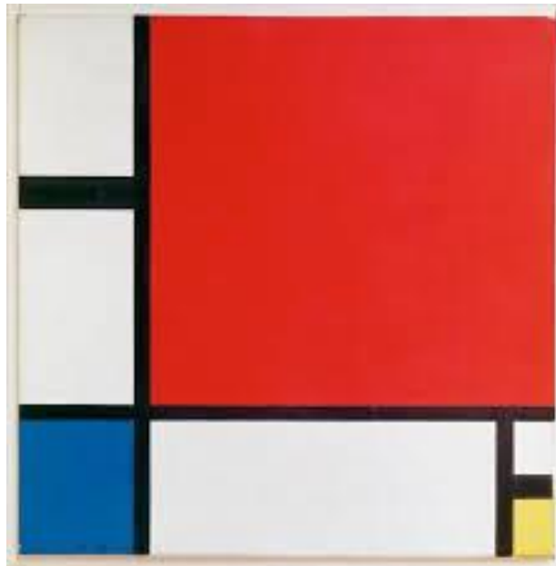
Sl.9 Likovna umjetnost, kompozicija II s crvenom, plavom i žutom, P. Mondrian, 1930.

Premda riječ „umjetnost“ danas uglavnom označava likovne, odnosno vizualne umjetnosti, u tradicionalnom smislu riječi pod umjetnošću podrazumijevamo, književnost, glazbu, likovnu umjetnost i filmsku umjetnost. Svaka se od ovih makro-umjetnosti može dodatno dijeliti na umjetničke discipline, rodove, vrste itd. Književnost se može podijeliti na prozu, liriku i dramu, koja se opet može podijeliti na scenske ili plesne umjetnosti i sl. Glazba se može podijeliti na tradicionalnu, klasičnu, jazz i rock glazbu, od kuda se dalje može doći do pjevačke ili sviračke umjetnosti; likovnu umjetnost na slikarstvo, kiparstvo i arhitekturu, od kuda se može doći do umjetnosti preformansa, video umjetnosti, fotografske umjetnosti, internet umjetnosti i sl.