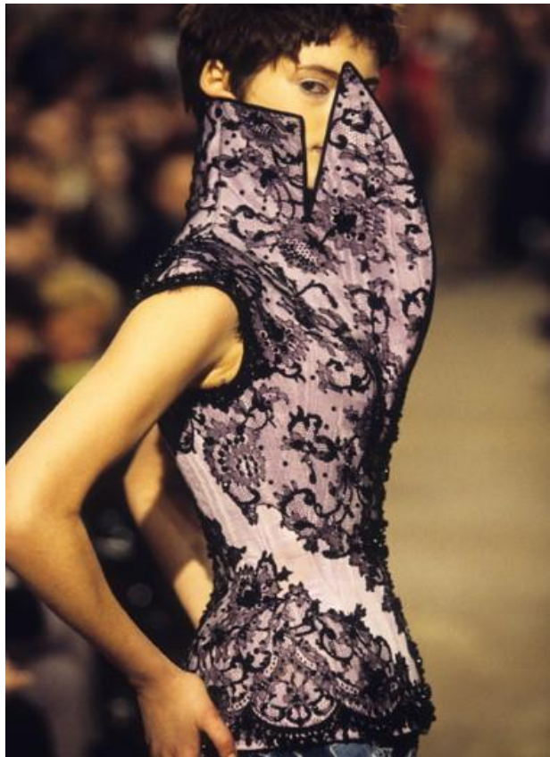
Sl.11 Alexander McQueen, „Dante“ collection, jesen/zima 1996.

Prve modne revije su počele još u 19. stoljeću u Parizu, a kasnije se proširile na SAD i druge zemlje. Od 2000. godine, pa sve do danas modne revije se obično snimaju i pojavljuju na specijaliziranim televizijskim programima ili čak u dokumentarcima.