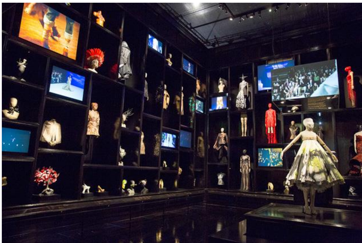
SI. 8