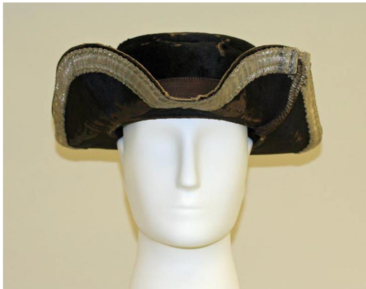
Slika 2. Tricorne šešir napravljen od vune, kasno 18. stoljeće, Europa 19

Što se tiče modnih dodataka koji su se nosili uz muško odijelo u to svrstavamo perike, šešire, kravate itd. Voluminozna perika iz sedamnaestog stoljeća smanjila se, vraćajući se prirodnom izgledu. Muškarci su postupno napustili perike te svoju kosu češljali tj. uvijali u franc. toupet . Dio muškaraca kombinirao je vlastitu kosu i perike te prelaze prekrivao puderom. Povlašteni društveni sloj koristio je jednostavnije perike, bilo da se radilo o engl. club-wigs ili engl. queues . 18 Karakteristika frizure club-wigs bio je konjski široki rep ukrašen širokom vrpcom. Za vrijeme spavanja perika se nije nosila, zamjenila ju je pamučna kapa.