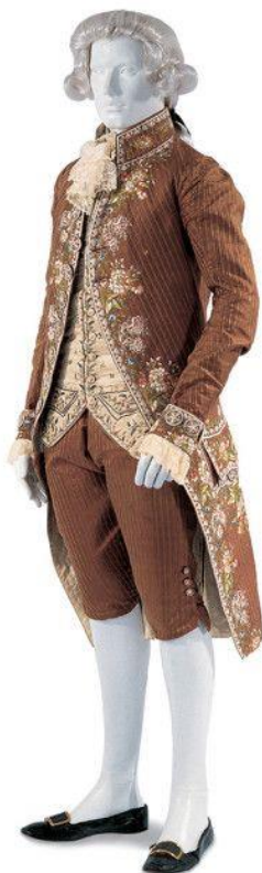
Slika 3. Muška odjevna kompozicija - Habit à la française , Francuska, 1780.

modelima, napravljeni isključivo za nošenje ispod ruke, što objašnjava njihovo ime fra. chapeaux-bras ( Boucher 1987, 312-313)