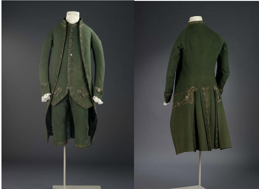
Slika 11. Muško formalno troslojno odijelo, Engleska, 1770.-1780. 44

U Parizu je razbibriga bila jahanje, od konjskih utrka do običnog jahanja u parkovima, po uzoru na velike londonske vrtove Ranelagh i Vauxhall. Muškarci odijeveni u frak kaputima i čizmama, dok su žene bile odijevene u haljine na engleski način ( robes à l'anglaise ). Osim odjevnih engleskih formi u modi i u engleskim tkaninama, Anglo-francuski komercijalni ugovor omogućio je veliko povećanje uvezenih engleskih tkanina u Francusku, dodajući modnom tržištu fine indijske musline koje je u Francusku izvezla britanska istočnoindijska kompanija ( British East Indian Company ). 45 Ovaj se muslin posebno isticao tijekom revolucionarnih godina u Prvom carstvu, čak je i Napoleona to smetalo, koji je htio da dame na njegovom dvoru nose samo francuske tkanine.