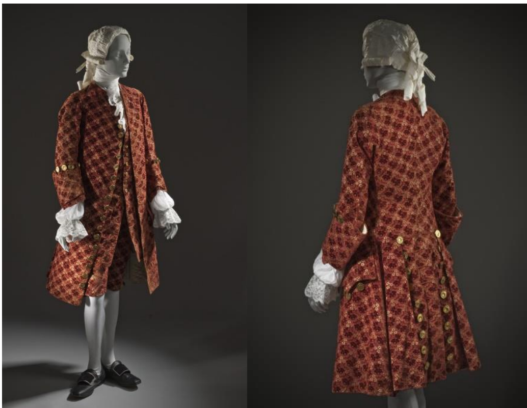
Slika 1. Muško odijelo sprijeda i straga, Francuska cca. 1755. , Los Angeles County Museum of Art 10

Justaucorps je bio otvoren i ukrašen nizom dugmadi. Njegovi rukavi, široki i kratki, imali su ukrase u obliku krila koji su pristajali uz prijevoje ruke na laktu, prevrnuti na zglobovima šaka ispod kojih se nazirala čipka košulje. Forma haljetka se posebno na leđima širi od struka prema koljenima te oblikuje pet ili šest nabora sa podstavom od platna (Grau 2008, 64; Boucher 1987, 308).