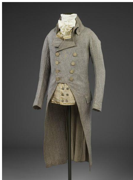
Slika 10. Muški dvoredni frock napravljen od vune sa gumbima omotan u svilu, Engleska, 1790. 42

Prema Giorgio Riello i Peter McNeilu (2010.) do sredine stoljeća bilo je uobičajeno za muškarce iz engleskih viših i srednjih klasa, da u svakodnevnim prilikama, nose ležerno odijelo od platna koje je bilo povezano s neformalnim načinima ladanjskog života. Najpopularniji oblik kaputa bio je frock . Umjesto teških ukočenih bočnih nabora svečanog kaputa, sada su imali jednostavnije bočne proreze. Osim toga, za razliku od francuza nosili su pripijene kapute bez džepova ili nabora sa ravnim rukavima i bez puno ukrasa. Dok je Francuska njegovala stil carstva i u odijevanju u engleskoj se njegovao ladanjski život i ležernija funkcionalna odjeća. Ustavna monarhija u Engleskoj, nije dopuštala da kralj ili kraljica postanu modne ikone (izuzetak princ od Walesa, kasnije Georga IV 43 ) (Riello, McNeil 2010, 228).