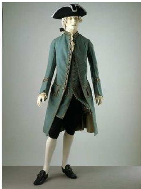
Slika 8. Muško troslojno odijelo, Engleska, cca 1760. 37

možda je otišao u Italiju zbog kulture i vjerojatno kupiti baršun svilu u Genovu, ali je otišao u Pariz kako bi naručio najkvalitetniju lyonsku svilu za odijelo. Kad je engleska moda težila ka većoj jednostavnosti, kritičari su to smatrali zamornim, baš iz razloga jer je bilo teško ići u korak s intenzivnim modnim promjenama koje su dolazile iz Pariza. Čak i kad su pokušali biti u toku sa Parizom, uvijek su bili tri koraka iza (Riello, McNeil 2010, 217-218).