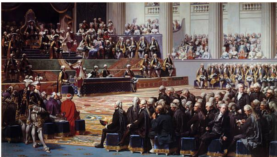
Slika 5. Zasjedanje Zakonodavne skupštine u Versaillesu 5. Svibnja 1789., slikar Auguste Couder (1789.-1873.) 26

Od kraja osamnaestog stoljeća moguće je otkriti prve znakove velikih promjena koje su uslijedile. Nakon 1789., općom demokratizacijom, socijalnim i ekonomskim napretkom došao je kraj standardima Ancien Regimea , te ih zamjenjuje utilitarizam i individualizam. Početni udar idealizma i transformacije koje su uslijedile, pridonijele su modifikacije u odijevanju. Trend francuskog odijevanja započeo je još prije revolucije i postojao je kontinuitet tijekom čitavog revolucionarnog razdoblja. U Francuskoj je kraj monarhije i nestanak dvorskog života doveo do suzbijanja cijele dvorske mode, premda je kasnije ponovno uveden pod Napoleonom. Društveni život u Francuskoj istisnule su političke skupštine. Treći stalež nosio je crnu odjeću za Etats Generaux 25 iz 1789. godine a odjeća u pitanju se sastojala od kratkog crnog kaputa, crnih hlača i jednostavnog šešira bez bogatog ukrasa.