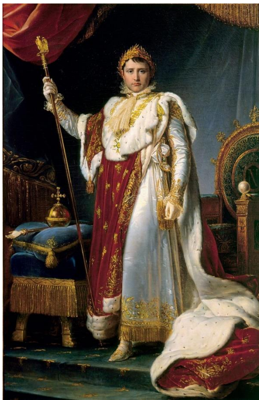
Slika 7. Portret Napoleona, Cara Francuske, u Ceremonijalnoj odjeći, 1805. slikar François-Pascal-Simon Gérard 30

Senatori su je nosili bez ovratnika, dok su službenici nosili kravatu od muslina. Tijekom Prvog carstva kravate su bile bijele i mogle su biti dugačke ili kratke, sa kompliciranim čvorovima i suptilnim načinima vezanja. To je dijelom stvorilo slavu Beau Brummelu (1778.-1840.). Brummel je vezanje kravate napravio kao jednu od glavnih preokupacija Dandiesa , 31 koji su svu svoju pozornost usmjerili na dodatke i besprijeekorna odijela. Posljednje godine osamnaestog stoljeća u modu su vratile kravatu od muslina, ali u vrlo različitom obliku od kravate nošene za vrijeme Luja XVI. Bio je to velik kvadrat presavijen dijagonalno, zatim se obavijao oko vrata, vezan samo malim čvorom bez rozeta. Ujutro su muškarci nosili kravate od prugaste svile ( madrassa ili foulard svila). 32 To je bilo dostupno samo dobrostojećim građanima, jer su tkanine tog tipa zbog rata s Engleskom na francuskom tržištu bile rijetke. Uz visoko istaknute ovratnike koji su se pojavili u 1804. godini,