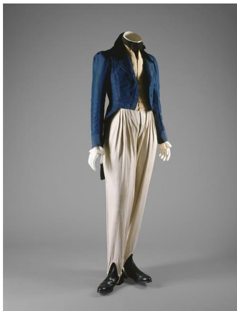
Slika 12. Muško odijelo, Engleska, cca. 1830. 46

među vrhunske svjetske obrtnike. Beau Brummell je bio zaslužan za uvođenje nove mode u muškom odijelu, te se takva odijela nose i dan danas ( Boucher 1987, 351).