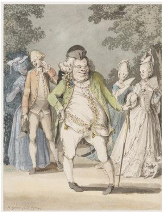
Slika 9. Macaronis , Satiričan crtež, Engleska, 1774. Samuel Hieronymus 39

Tako je u engleskoj 1770-ih muško odijelo sadržavalo običan kaput bez ukrasa, koji se rezao na stražnjim krajevima, prsluk je sezao do struka, vratni izrez bio je pokriven maramom, dok su hlače postalje sve dulje i uže. 38