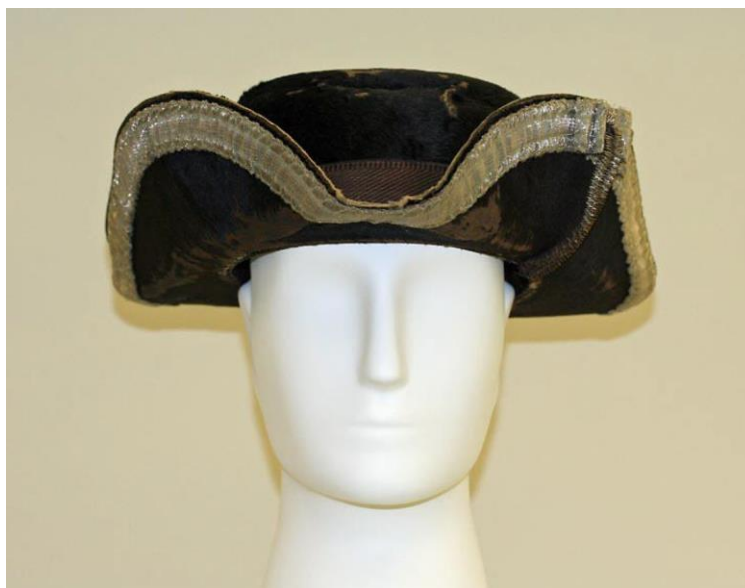
Slika 2. Tricorne šešir napravljen od vune, kasno 18. stoljeće, Europa 19

Što se tiče modnih dodataka koji su se nosili uz muško odijelo u to svrstavamo perike, šešire, kravate itd. Voluminozna perika iz sedamnaestog stoljeća smanjila se, vraćajući se prirodnom izgledu. Muškarci su postupno napustili perike te svoju kosu češljali tj. uvijali u franc. toupet . Dio muškaraca kombinirao je vlastitu kosu i perike te prelaze prekrivao puderom. Povlašteni društveni sloj koristio je jednostavnije perike, bilo da se radilo o engl. club-wigs ili engl. queues . 18 Karakteristika frizure club-wigs bio je konjski široki rep ukrašen širokom vrpcom. Za vrijeme spavanja perika se nije nosila, zamjenila ju je pamučna kapa.