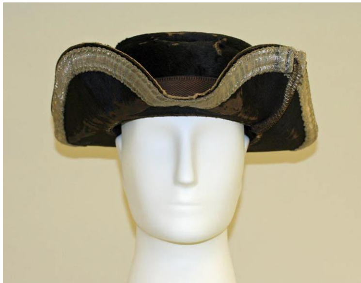
Slika 2. Tricorne šešir napravljen od vune, kasno 18. stoljeće, Europa 19

Što se tiče modnih dodataka koji su se nosili uz muško odijelo u to svrstavamo perike, šešire, kravate itd. Voluminozna perika iz sedamnaestog stoljeća smanjila se, vraćajući se prirodnom izgledu. Muškarci su postupno napustili perike te svoju kosu češljali tj. uvijali u franc. toupet . Dio muškaraca kombinirao je vlastitu kosu i perike te prelaze prekrivao puderom. Povlašteni društveni sloj koristio je jednostavnije perike, bilo da se radilo o engl. club-wigs ili engl. queues . 18 Karakteristika frizure club-wigs bio je konjski široki rep ukrašen širokom vrpcom. Za vrijeme spavanja perika se nije nosila, zamjenila ju je pamučna kapa.