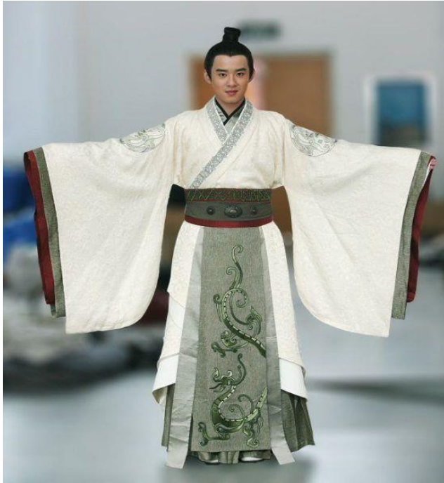
Slika 6. Muški kimono

Ženska obuća je zaobljenija dok muškarci nose zori i geta obuću koja je četvrtastog oblika. U japanskoj kulturi zaobljene linije su za žene, a ravne za muškarce.