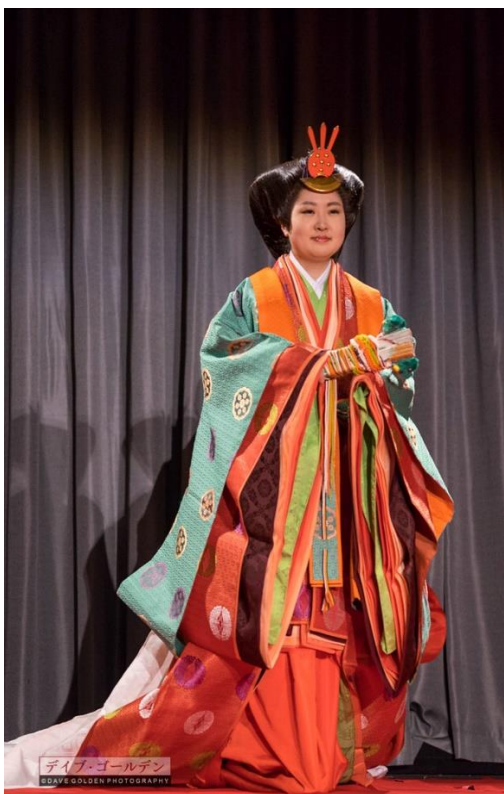
Slika 2. Junihitoe odjeća iz razdoblja Heian

Odjeća se kao i kultura počela uvelike mijenjati. Žene su nosile slojevite tarikubi kimone. Unatoč slojevima i dalje su se mogle nazirati hakama hlače, dok su leđa kimona krasile ceremonijalne Mo suknje, koja je izgledala poput pregače.