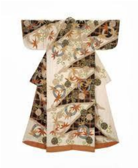
Slika 8. Formalni kimono

Najviša razina formalnosti se očituje kroz metalne brokate te obojani brokati pripadaju srednje formalnima. Dok je sjajna obojana svila formalna, vuna, pamuk i kudelja spadaju u svakodnevno nošenje. 37