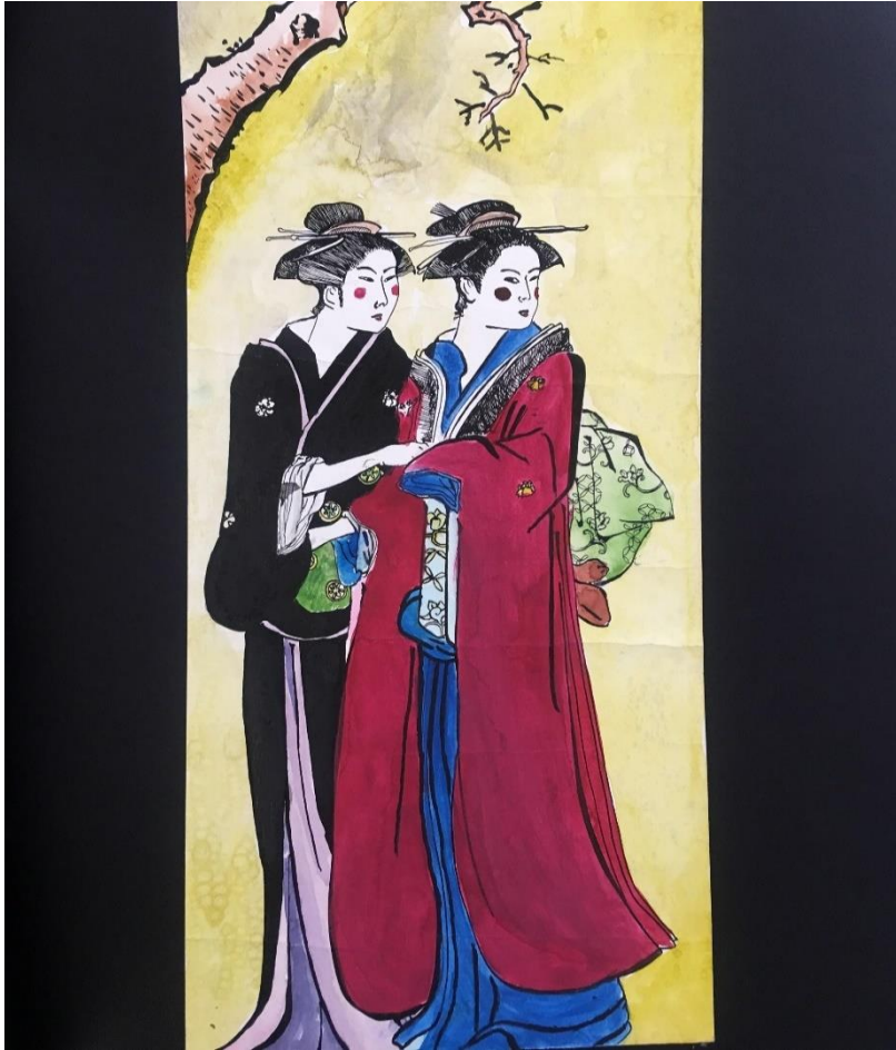
Slika 4. Vlastita ilustracija – Matea Zgurić

U svom modnom crtežu, prikazuje se kimono koji spada u moderno i suvremeno doba. Zbog svoje nefunkcionalnosti, ovakvi tipovi kimona nose se u formalnim prigodama.