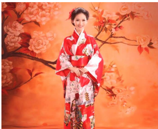
Slika 5. Narodni kimono

Jeftina odjeća napravila je neekonomičnost, dok pad poljoprivredne radne snage oslabio je seoske kulturne tradicije. Radna regionalna odjeća ( noragi ) izumrla je bez javnih obavijesti.