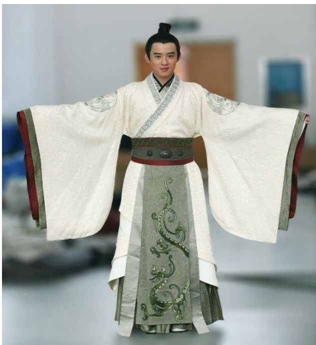
Slika 6. Muški kimono

Ženska obuća je zaobljenija dok muškarci nose zori i geta obuću koja je četvrtastog oblika. U japanskoj kulturi zaobljene linije su za žene, a ravne za muškarce.