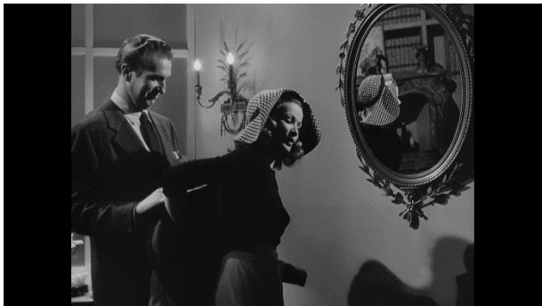
Izvor: Isječak iz filma

Kroz film pratim razna, situacijama objašnjiva pokrivala, šlampavi, od tkanine šivani, mladenački šešir, prikladan za obavljanje svakodnevnih aktivnosti radi ležernog izgleda i praktičnosti, uz cloche šešir odvažno ukrašen perjem kojeg Laura nosi kada odlaz ljubavniku, razotrkiti njegovu prevaru.