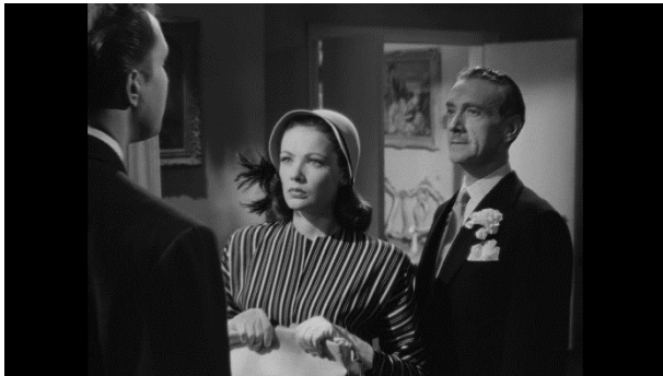
Slika 14.: Film "Laura" Otto Preminger (1944.)