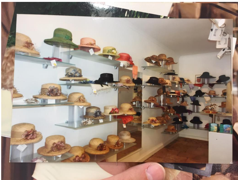
Slika 4.: salon šešira Kobali