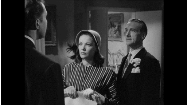
Slika 14.: Film "Laura" Otto Preminger (1944.)