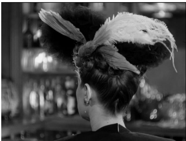
Slika 15.: "Phantom Lady", Robert Siodmak (1944.)

"Čovjek život? Kakve to veze ima sa šeširom?"