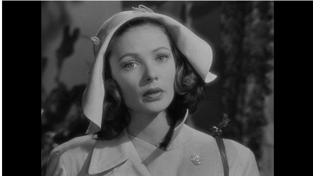
Izvor: Isječak iz filma