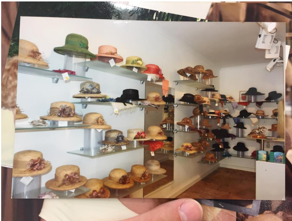
Slika 4.: salon šešira Kobali