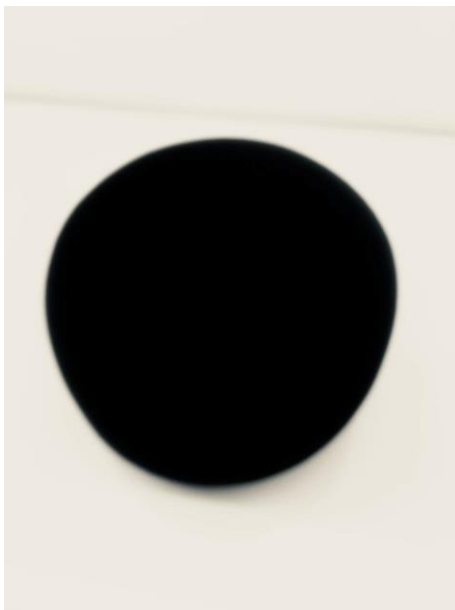
Slika 17.: Toka "Ana", Kobali