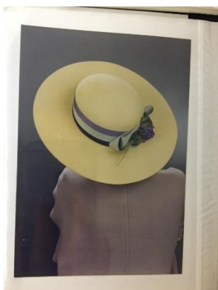
Slika 2.: Girardi oble glave, Kobali