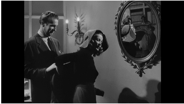
Izvor: Isječak iz filma

Kroz film pratim razna, situacijama objašnjiva pokrivala, šlampavi, od tkanine šivani, mladenački šešir, prikladan za obavljanje svakodnevnih aktivnosti radi ležernog izgleda i praktičnosti, uz cloche šešir odvažno ukrašen perjem kojeg Laura nosi kada odlaz ljubavniku, razotrkati njegovu prevaru.