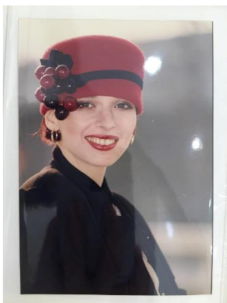
Slika 1.: Kobali kapa

Poštujući želju Nade Kobali o tome kako rad govori bolje od pisane riječi, sve što se o nečijoj ljubavi i životu može reći, izdvojila sam fotografije meni najdražih radova obrta Kobali.