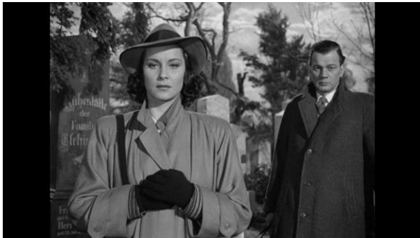
Slika 11.: Film "The Thrd Man", Carlo Reid (1949.)