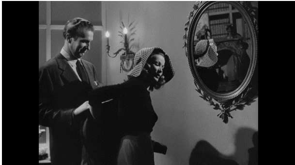
Izvor: Isječak iz filma

Kroz film pratim razna, situacijama objašnjiva pokrivala, šlampavi, od tkanine šivani, mladenački šešir, prikladan za obavljanje svakodnevnih aktivnosti radi ležernog izgleda i praktičnosti, uz cloche šešir odvažno ukrašen perjem kojeg Laura nosi kada odlaz ljubavniku, razotrkati njegovu prevaru.