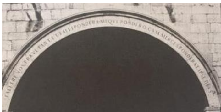
SLIKA 3 Natpis na zidu palače Sponza- Falletre nostra vetant et falli pondera meque pondero dum marces ponderat ipse Deus – Naši uetzi ne dopuštaju da varamo, niti da budeo prevareni, i dok ja važem robu, sam Bog važe mene

Trgovinom i pomorstvom sticali su Dubrovčani sredstva za svoj život i opstanak: politika Dubrovnika prema mnogim državama nužno je morala biti oportunistička, jer je malo koja država onoliko ovisila o stranom svijetu koliko Dubrovačka Republika. More je razvijalo u njima smijelost, ustrajnost i dalekovidnost, te su bili odvažni pomorci, dobro trgovci i spretni državnici. U borbi s orirodom i sa stranim svijetom Dubrovčani su ulagali sve svoje energije i pokazivali nevjerovatne društvene sposobnosti. U Republici je vladao red i javna sigurnost bila je zagantirana. Dubrovački arhiv nam pokazuje da nitko od Slovena, osim Čeha, nije imao toliko smisla za administraciju kao Dubrovnik. 2