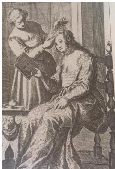
SLIKA 6 Prikaz iz dnevnog života grada