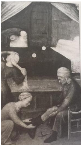
SLIKA 4 Iz dnevnog života grada

1664. dozvoljeno je plamkinjama čiji muževi nose plašt da mogu nositi na glavi vrpcu od svile, u ušima naušnice od zlata s dragim kamenjem i biserom, na vratu ogrlicu od zlata, biresa ili koralja. 10