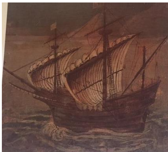
SLIKA 5 Dubrovački brod s predele glavnog oltara Franjevačke crkve u Slanom, 16. stoljeće

Vetranović krtitizira gradnju bogato opremljenih palača a i raskošnih ljetnikovaca, držeći to nerazumnim hirom vremena. On, isposnik, uočava svuda oko sebe pretilost i bogatsvo u zajedništvu s bludom i lakomošću. Trgovci i pisari krađu, konstatira ogorčeno, čak da se i svećenstvo pokvarilo, nitko se ne obazire na nemoćne i bijedne. Džore Držić razočarano konstatira da se u tom vremenu, u kojem sve ima cijenu, čak i ljubav žene može kupiti samo novcem. 20