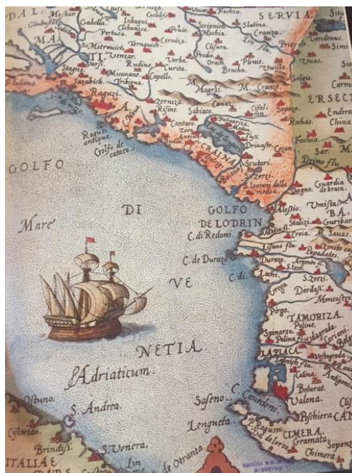
SLIKA 1 Karta južnog Jadrana, detalj

Poslije zadarskog mira 1358. zatvorili su sva vrata i otvore s morske strane. Već u 11. stoljeću podignuta je tvrđava Lovrijenac koja je kasnije dobila današnji oblik.