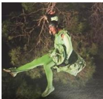
SLIKA 9: Marin Držić, Grižula, Festivalski dramski ansambl, Dubrovnik. 21.08.2003.