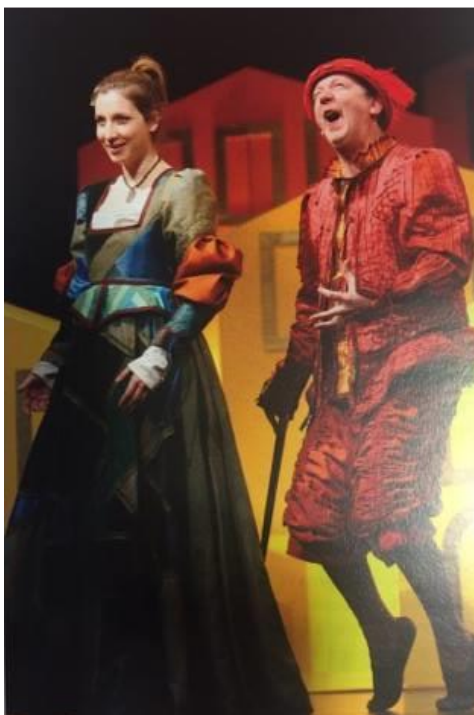
SLIKA 7: Marin Držić: Skup Hrvatsko Narodno Kazalište, Split 28.03.2008.