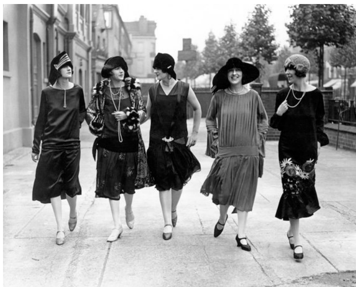
Slika 5. Moda 1920.

Premda su na modnim pistama vladale jednostavne, minimalne linije, 1920-e nisu mogle proći bez luksuza. Šarene tkanine, svila, baršun, saten bili su omiljeni od strane dizajnera tog doba. Robne kuće imale su jeftinije varijacije tog dizajna s novoproduzvenim sintetičkim tkaninama. Počinju se isprobavati kombinacije različitih tkanina kako bi se osmislile modne kombinacije za posao, formalno, neformalni druženje, socijalne aktivnosti i dr.