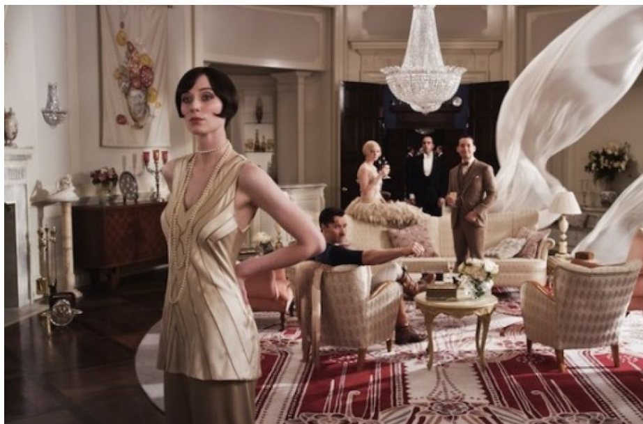
Slika 9. «The Great Gatsby» 2013.

Kad se gledaju dvadesete, šteta je da se ne osjeti živost i istinska ljepota tokom filma. Kostimi su u ovom slučaju postali gotovo središnja tema filma, ali to i jest bit, jer upravo oni odražavaju sve karakteristike perioda, samostalnost, emancipaciju, lude godine.