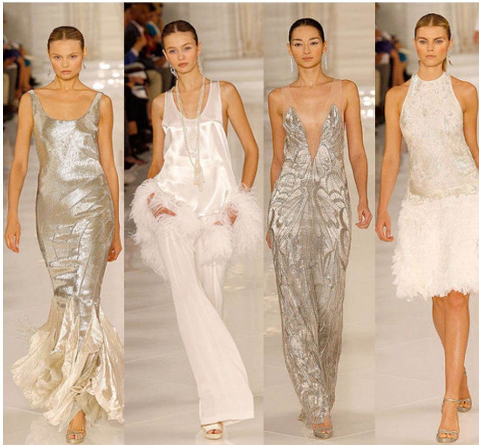
Slika 10. Ralph Lauren «Gatsby Inspired» Collection

za oživljavanje modnog perioda dvadesetih godina jer ako malo bolje pogledamo već dobrim djelom i živimo modnu reinkarnaciju spomenutog razdoblja. Krzneni šalovi i bunde, midi potpetice, haljine ravnih silueta, sve je to zastupljeno na policama trenutno aktualnih modnih trgovina. I sve je to po prvi put dostupno ne samo u haute-couture izvedbi nego kako moda uličnog stila. Pokazalo se da za dizajniranje filmskih kostima najpoznatiji svjetski dizajneri oduvijek pokazuju izniman interes jer na taj način uvelike mogu utjecati na modne trendove. Chrine Martin je to zasigurno uspjelo.