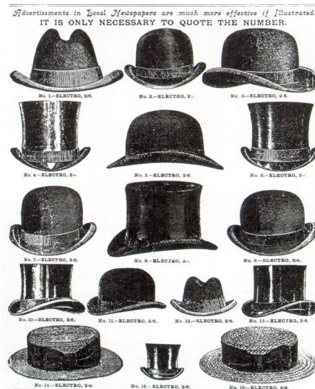
Slika 6. Muški šeširi 1920.

Do 1925. godine pojavljuju se šire hlače poznate pod nazivom «Oxford hlače». Kod odijela se vraća normalan struk. Nose se rukavice, a tijekom kasnih dvadesetih javlja se prsluk s dvostrukim kopčanjem, koji se često nosi ispod kaputa. 70