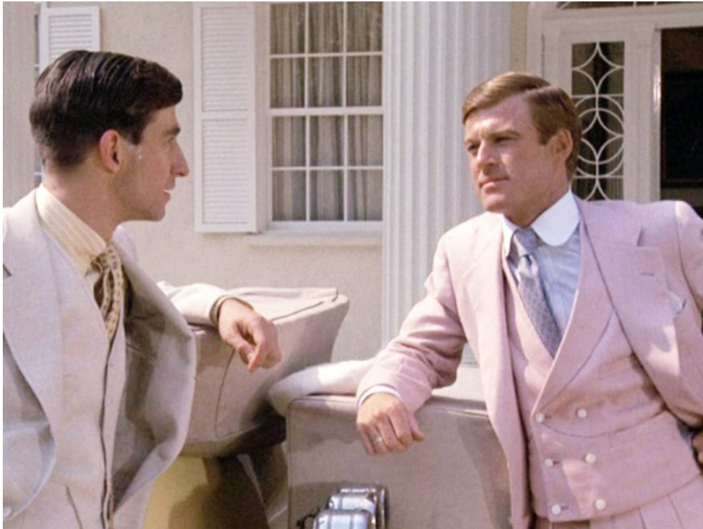
Slika 7. «The Great Gatsby» 1974.