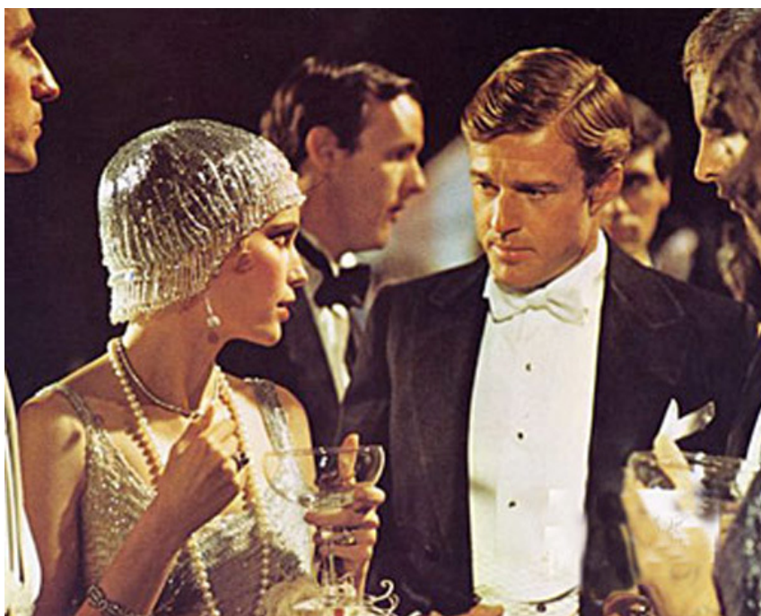
Slika 2. Robert Redford i Mia Farrow («The Great Gatsby» 1973.)

Možda i najpopularnija adaptacija filma je ona iz 1973. godine s Robertom Redfordom i Miom Farrow u glavnim ulogama. Film je u režiji Jacka Claytona. «The Great Gatsby» bio je jedan od tada najambicioznijih projekata studija Paramount Pictures. U to vrijeme šef studija bio je Robert Evans, a njegova supruga Ali McGraw, te ju je on htio za glavnu ulogu. Ona u međuvremenu napustila, ali projekt unatoč tome oko sebe okuplja niz velikih imena, scenarista Francisa Forda Coppole, Redforda u glavnoj ulozi, a valja napomenuti da je on tada bio na vrhuncu popularnosti. Kada je započelo snimanje, saznalo se da je Mia Farrow trudna, a taj se taj detalj od publike nastojao skrivati korištenjem posebnih kostima. 29