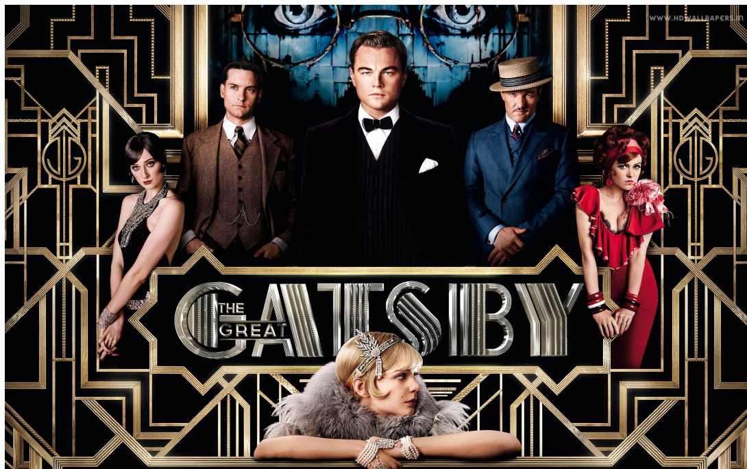
Slika 3. «The Great Gatsby» 2013.

2011. godine u Fox studios Australia, a završeno je 22. prosinca 2011. s dodatnim snimkama snimljenim u siječnju 2012. 35