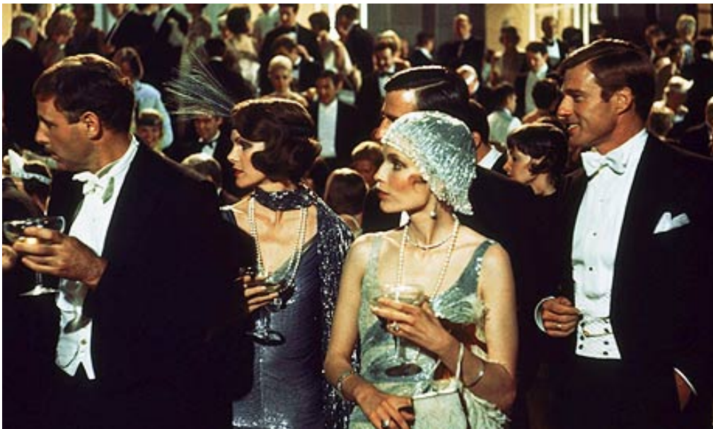
Slika 8. «The Great Gatsby» 1974.; Jay's Party