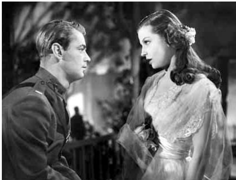
Slika 1. Alan Ladd i Betty Field («The Great Gatsby» 1949.)

Maibaum je za Alana izjavio: „Nikada nisam vidio drugog glumca koji se poletno kretao kao Alan, koji je imao takvu koordinaciju. Lijep, dubok glas. Svi su rekli da nije glumac, ali su pogriješili. Znao je što radi. Bio je pretjerano skroman, sramežljiv, introvertiran. Ali, kad jednom osvojite njegovo povjerenje, ne možete učiniti ništa loše. Paramount Pictures je Alana Ladd smatrao sumnjivim glumcem, ali nisam im vjerovao. Bio sam u njegovoj kući i odveo me do drugog kata, gdje je imao garderobu sve do kraja sobe. Otvorio ga je, pogledao me i rekao: «Nije loše za Okie, zar ne?» Imam gušće hlače jer sam se sjetio kad je Gatsby uzeo Daisy da joj pokaže svoju vilu, pokazao joj je i svoju garderobu i rekao: «Imam čovjeka u Engleskoj koji mi kupuje odjeću, a na početku šalje niz stvari svake sezone, proljeća i jeseni». Rekao sam sebi: «Bože moj, on je Veliki Gatsby!» I bio je na neki način Veliki Gatsby. Uspjeh se naselio na njega kao što je to bilo na Gatsbyju. Budući da je filmska zvijezda, imao je jednaku vrstu uspjeha, ali nije znao postupati. Imao je isti precizan, pažljiv govor, kontrolirani način, pažljivo modulirani glas.» 22