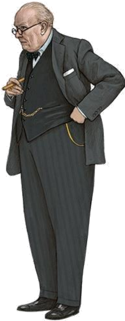
Slika 1. Glumac Gary Oldman, uloga Winston Churchilla, film: Darkest Hour (2017.), kostimografija Jacqueline Durran