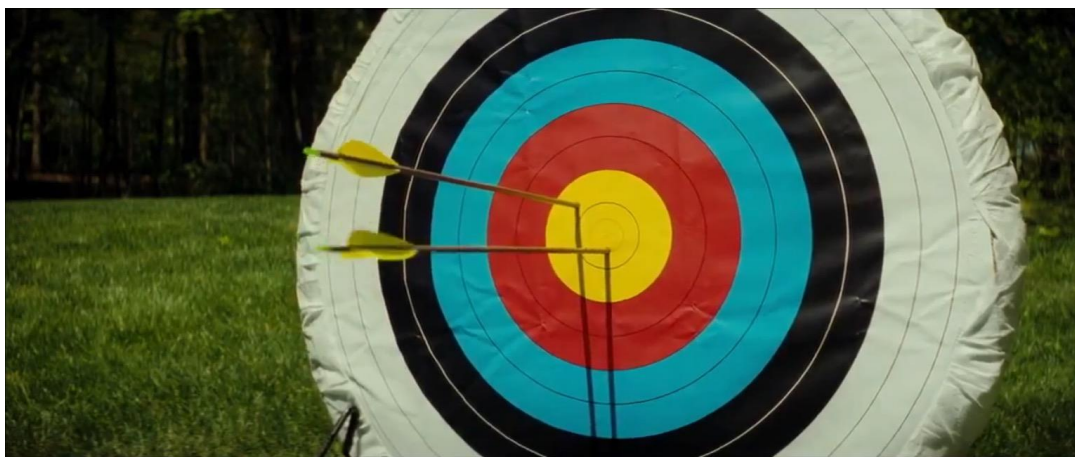
Slika 2. Screenshot filma We need to talk about Kevin (2011.), scena gađanja streljačke mete, otac i Kevin.

Kostimi filma We need to talk about Kevin (Trebamo pričati o Kevinu) vrhunski su primjer kostimografske metode kojom dominira izraz boja. Za kinematografsko rješenje nalik art filmu 1 zaslužni su: kinematograf Seamus McGarvey, produkt dizajnerica Judy Becker i kostimografkinja Catherine George. Osnovna paleta boje streljačkih meta (crvena, bijela, žuta, plava, crna) boja kadrove i utjelovljuje ozbiljnu tematiku filma.