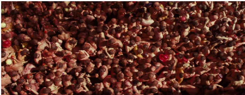
Slika 3.,4.Screenshot filma We need to talk about Kevin (2011.), Eve na festivalu (glumica Tilda Swinton)

Crvena boja je simbolična okosnica radnje, predstavlja krv, krvoproliće u Kevinovoj školi i obitelji te želi pronaći odgovore o Kevinovoj apatiji, okrutnosti. Crvena boja otvara vrata priče, prva scena, Buñol, Valencija, Španjolska, La Tomatina festival 2 : Eve, kasnije majka, sada putopisac, prisjeća se veselog festivala gdje se adrenalinom opijena kolona mladih ljudi gađa rajčicom. To je ujedno jedna od posljednjih scena u kojoj je sretna. U preostalim scenama filma crvena će biti dominantni estetski akcent i alarmni nagovještaj krvoprolića u završnici. Dematerijalizacijom predmeta (rajčica) gubi se prepoznatljivost, indeks voća, u oblinosti i jarkosti krupnih planova, u prvim scenama filma uspostavlja se ton i atmosfera događaja ubistva koji dolaze. Odabirom kadrova i crvene boje, vizualno se povezuje gomila u Španjolskoj koja izgleda poput užasnutih članova obitelji i prijatelja koji čekaju u neizvjesnosti života voljenih ispred srednje škole, u kojoj će Kevin slavljenički ubijati svoje vršnjake.