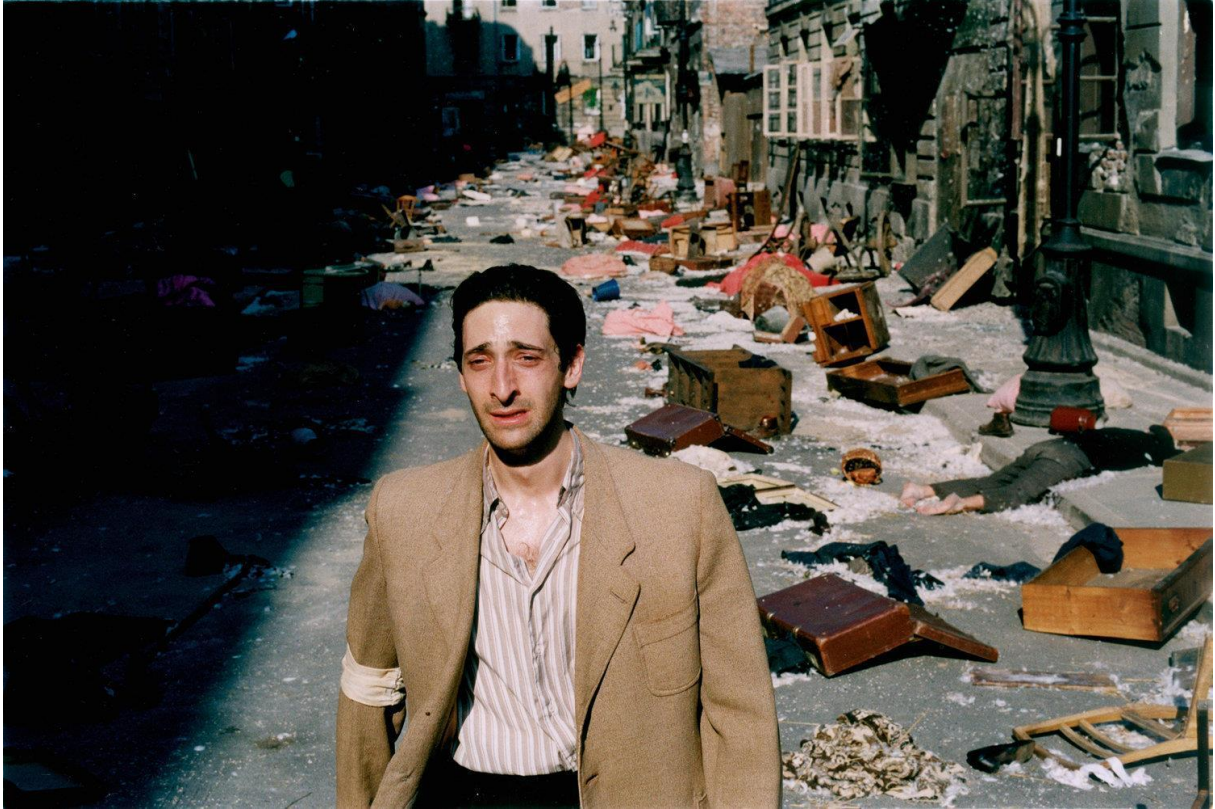
22. Scena iz filma The Pianist (2002.), lik Wladyslaw Szpilman (Adrien Brody)

Kostimu je zadatak funkcionalan i očit, unatoč utilitarnosti, sceni može podariti potrebnu emociju. Alan Starski, produkt dizajner Polanskovog Pijanista ( The Pianist 2002.) oslovio je to u svojim master class predavanjima. Ponekad, samo jedan malen odjevni detalj govori tako mnogo.