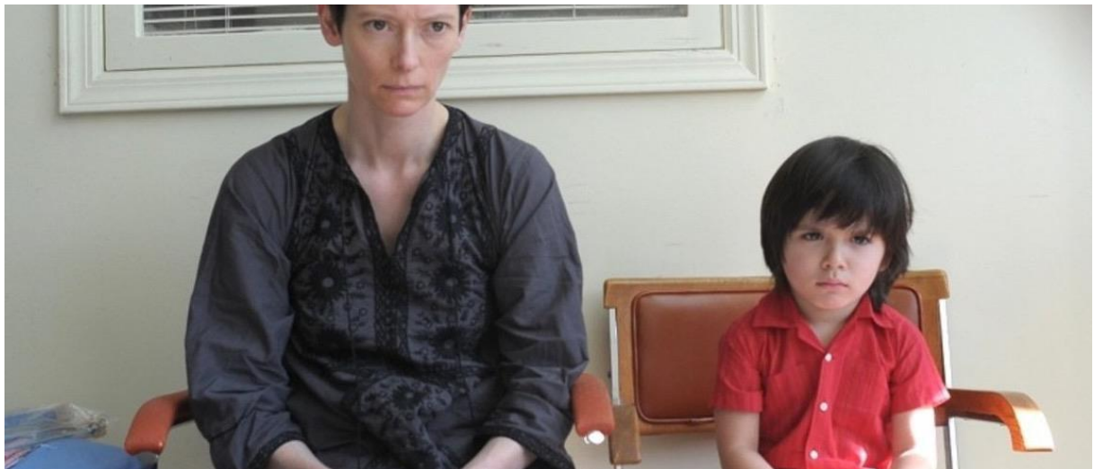
Slika 9.,10. Eve (T.Swinton) na trudničkom tečaju i u posjeti dječijem psihologu. Screenshot We need to talk about Kevin(2011.)

Eva u neželjenoj trudnoći s Kevinom nosi široku narandžastu majcu koja podsjeća na zadnju fazu Kevinova života u zatvorskoj uniformi. Upravo bojom postižu vizualni sukob majke Eve i Kevin, sličnom frizurom, istim tonovima kose, redateljsko pitanje raste i vizualno kulminira, je li Eve energetski, biološki i odgojno stvorila sociopata? Evin istočno-folklorni modni izričaj prikazuje putopisni, ne komfornistični, avanturistički duh a u jednoj psihološkoj portretizaciji prikazuje sram. Veliki ovijajući trudnički kostim u sceni garderobe trudničkog tečaja dočarava Evinu anksioznost i gađenje prema trudnoći, u kontrastu društva sretnih trudnica u sportskim grudnjacima. Jasno je u posturi, pogledu i skrivanju kako nije spremna prihvatiti ulogu majke.