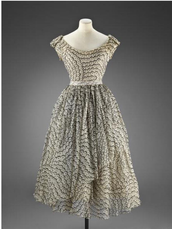
Slika 22: Haljina iz linije Tulipan, Christian Dior, 1953., pohranjeno u muzeju Viktorije i Alberta http://collections.vam.ac.uk/item/O34656/la-ligne-tulipe-evening-dress-dior-christian/ , (10.11.2018.)