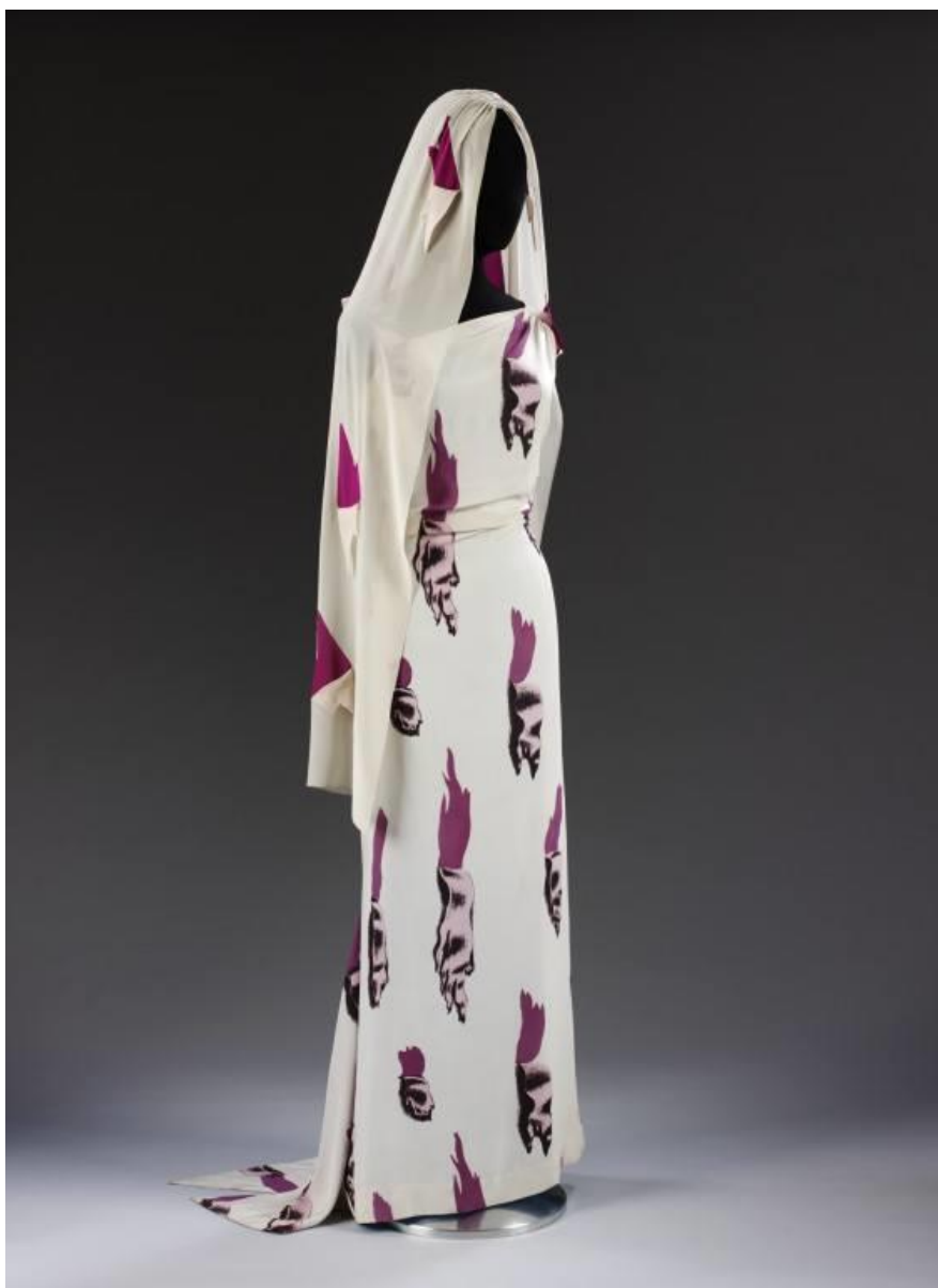
Slika 8: Haljina suza, Elsa Schiaparelli, 03.1938., pohranjena je u Dali muzeju na Floridi, http://emad.pgsri.hr/rad/suradnja-dalija-i-else-schiaparelli/ (10.11.2018.)

Haljina suza ( Tears Dress ) je bijela, večernja haljina koja ima veo dugačak do butina i motive koji daju iluziju životinjskog mesa. Suze su namijenjene da predstavljaju krzno, a sama haljina je napravljena od životinjskog krzna okrenutog iznutra. 16