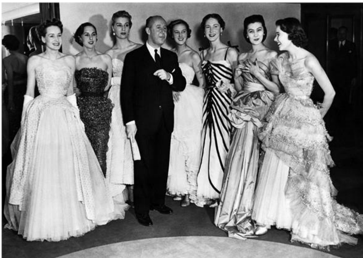
Slika 11:Christian Dior s modelima, http://www.modamo.info/index.php/moda/style-fix/3480-christian-dior-pria-iza-modne-legende (10.11.2018.)