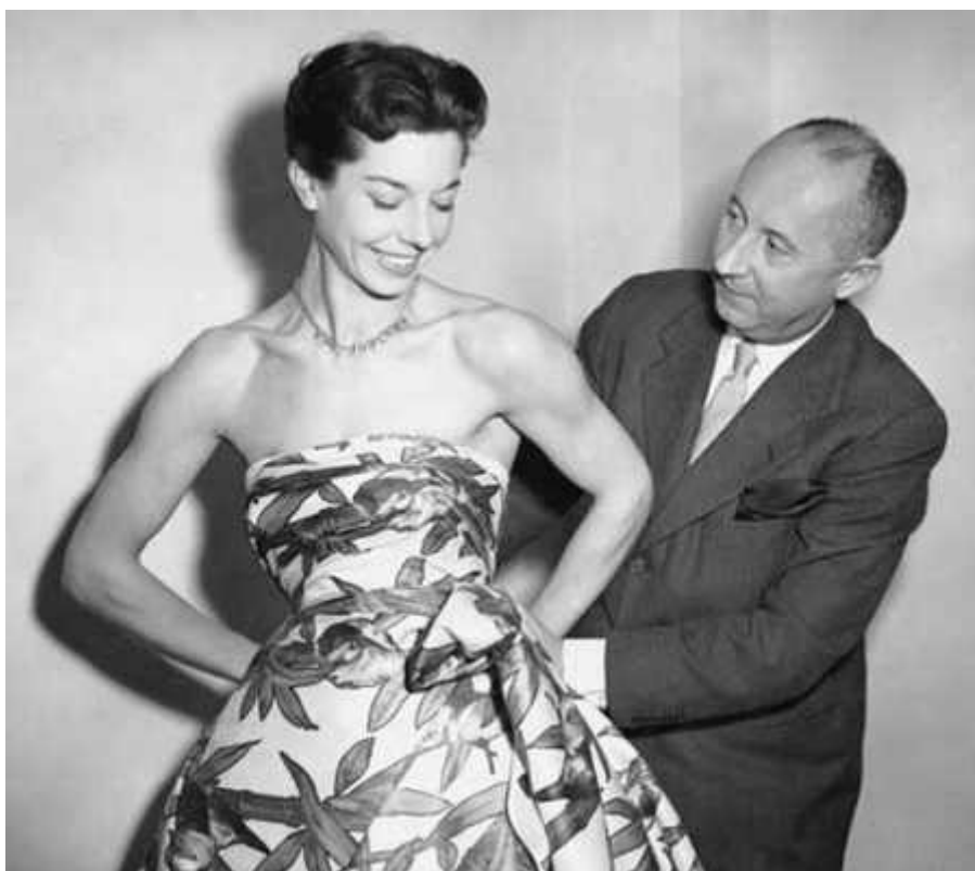
Slika 12:Christian Dior i model, http://www.modamo.info/index.php/moda/style-fix/3480-christian-dior-pria-iza-modne-legende (10.11.2018.)