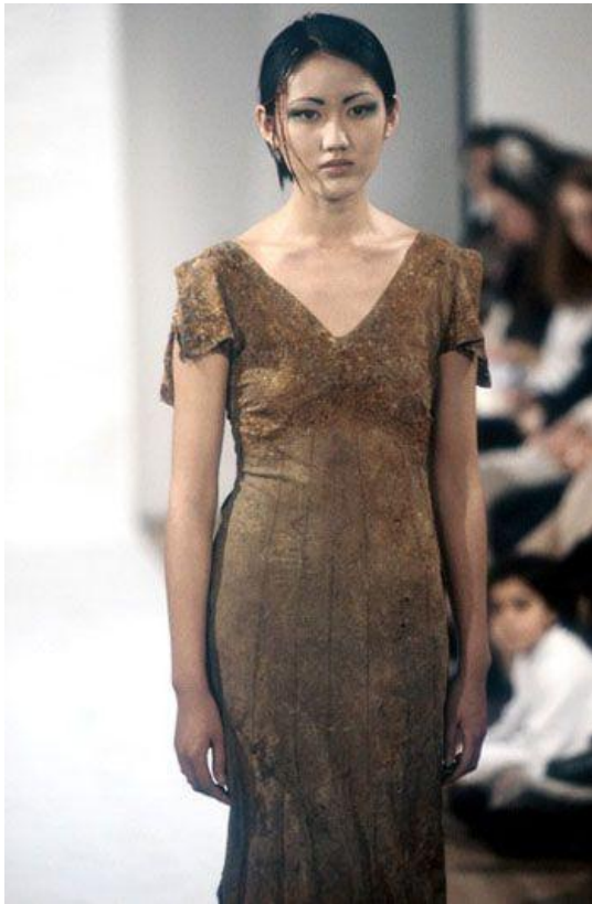
Sl.2. Hussein Chalayan, "The Tangent Flows", 1994

Modni dizajneri počeli su raditi kolekcije koje nisu bile nosive, dok im revije nisu izgledale kao revije već kao modni show. Revije Husseina Chalayana su izgledale upravo tako. 1994. godine Hussein Chalayan je imao reviju na kojoj je odjeća bila praćena tekstom koji govori o nastanku kolekcije. Govori o tome kako je neko vrijeme bila zakopana u zemlji prije nego li je prikazana javnosti na modnoj pisti. Chalayan je, s pravom, govorio kako bi njegove kreacije bolje odgovarale zidu neke galerije nego ljudskom tijelu.