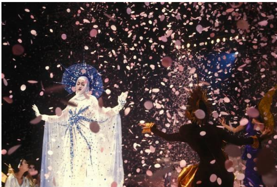
Sl. 9. Thierry Mugler, "The Winter of the Angels", 1984.

ga u šumsku oazu. Standard za maštovite revije je postavljen 1984./1985. godine kada je Thierry Mugler prikazao svoju kolekciju za jesen/zimu iste godine. Thierry Mugler je želio rekonstruirati djevičansko rođenje na modnoj pisti punoj opatica, a finalni dio revije je bio kada je model sišao s neba u oblaku dima uz puno ružičastih konfeta. Mnogi su Muglera kritizirali da je njegova odjeća u potpunosti zasjenjena, ali su ubrzo nakon toga spektakularne revije, baš poput njegove, postale pravilo a ne iznimka.