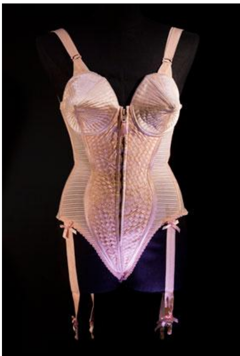
Sl.1. Jean Paul Gaultier, 1990. Korzet s podvezicama kojeg je Madonna nosila na svojoj turneji

Worth je "oslobodio" kreatora od uloge obrtnika, koji je bio podčinjen željama kupaca. Otvorivši svoju modnu kuću u Parizu 1857. godine bio je prvi stvarni "modni kralj". Sam bi birao materijale, razvijao dizajn te stvarao vlastiti odjevni predmet. Uz njega su modni kreatori počeli "potpisivati" svoje kreacije stavljajući oznaku na odjevni predmet, baš kao što su to činili i umjetnici. Ali "umjetnička sloboda" kreatora je bila poprilično ograničena s obzirom da su oni morali odgovarati estetskim referencijama kupaca koji nisu željeli platiti odjeću koju na kraju ne bi mogli nositi, što je značilo da kreacije nisu smjele previše odskakati od stila koji je vladao u određeno vrijeme. Ipak se Worth borio da kreatori budu priznati kao punopravni umjetnici. Paul Poiret je u još većim razmjerima poveo borbu modnih kreatora kako bi bili priznati kao umjetnici. 1913. godine je izjavio: "Ja sam umjetnik, a ne krojač". On je prvi počeo kreacijama davati nazive i imena, poput "Magyar" i "Byzants", umjesto brojeva koji su se prije koristili. Modni kreatori nikad nisu zadobili priznanje punopravnih umjetnika, ali za tim još uvijek teže. Strategija je bila da se preokrenu unutarnje i vanjske razlike, što je Gaultier napravio kreirajući svoj čuveni korzet koji se nosi na odjeću, a Helmut Lang je kreirao haljine s naramenicama.