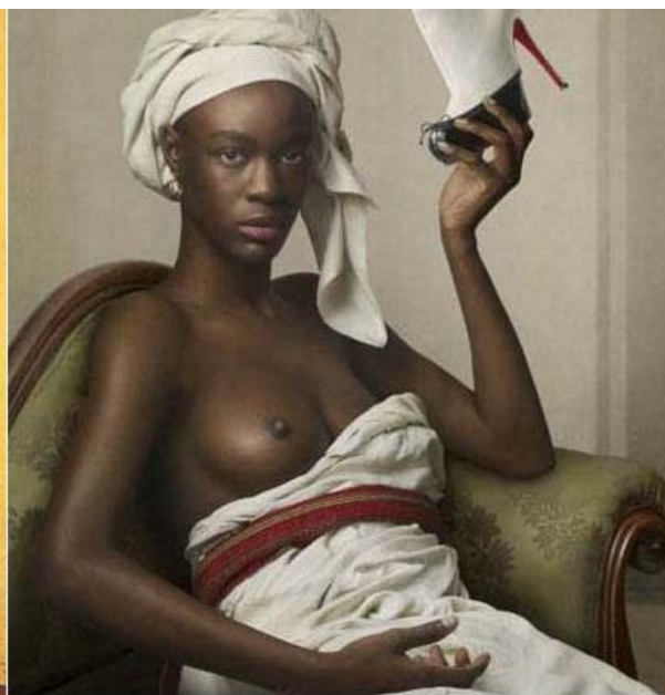
Slika: modna fotografija