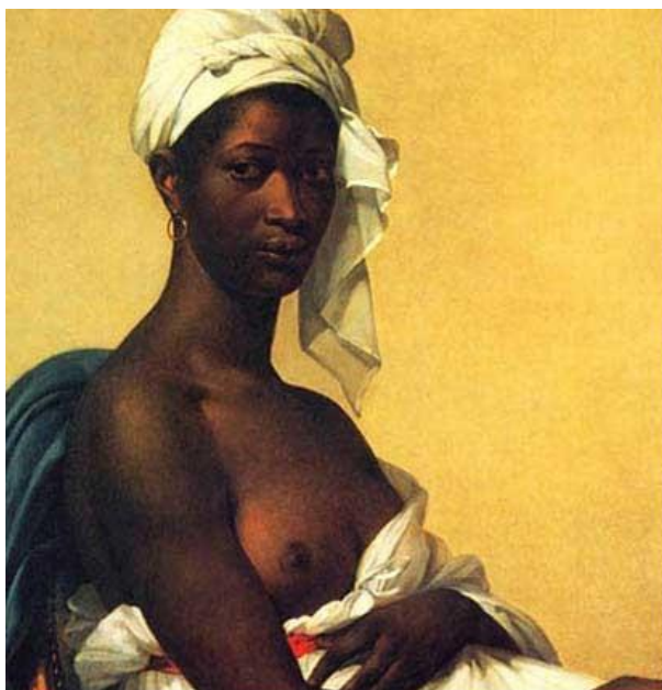
Slika: Marie Benoist - Portrait d'une négresse

Neki tvrde da ne postoji umjetnost koja je politički neutralna i ja mislim da bi moda trebala biti manje podložna politici. Modna industrija nije doživjela preporod ukidanjem ropstva, nije se dogodila promjena kada su crnci započeli borbe za svoja osnovna prava. Zapravo moda je uspjela prodati svaki pokret otpora do sada izražen odjećom kao novi modni trend. Po mom mišljenju pogrešno prozvana umjetnošću, moda zaslužuje jednaku diskriminaciju kakvu i sama propagira.