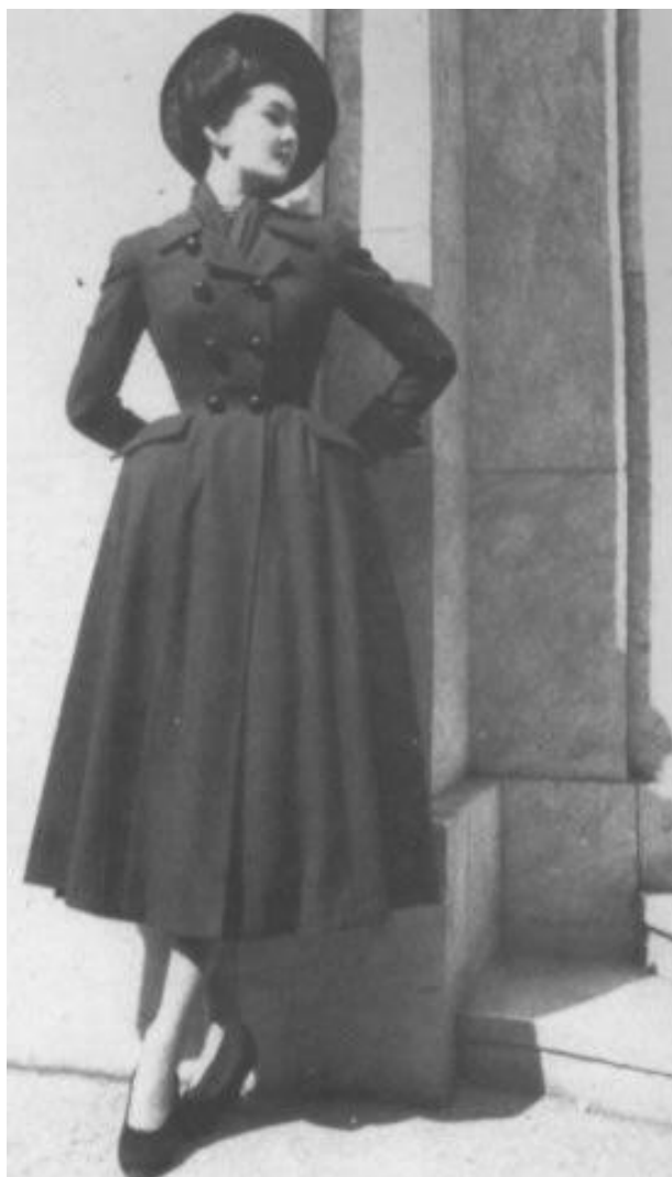
Slika: New Look

Nakon rata snažna želja za razdvajanjem bogatih od siromašnih bila je utjelovljena upravo u modi. Jasno se davalo do znanja tko je tko u društvu, i nije bilo empatije prema radnicima pogođenim poslijeratnim tragedijama i glađu. Zakonom su zabranili duge i raskošne suknje tog vremena jer su istovremeno ljudi prosjačili za hranu. Ovo neslaganje po pitanju odjeće bilo je simptom, ili uzrok, propadanja suradnje vlasti, kapitala i rada. Poslijeratno društvo opet je postalo podijeljeno – velika poduzeća i bogataši su profitirali, a radnici su ostali prikraćeni. Moda je simbol ovakvog poretka i iz tog razloga predstavlja izvor zaziranja. Ovaj pojam potječe od latinskoga izraza abjectio , a posebno ga je