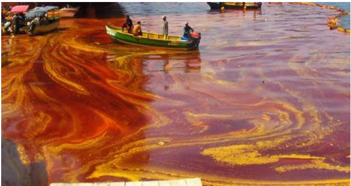
Slika: Zagađena voda

Je li zato i proizvodnja jednako široko rasprostranjena ili se ipak radi o zemljama zaduženima za proizvodnju odjeće za naručitelje, odnosno o centriranju proizvodnje samo na jednom mjestu i koja su to popularna mjesta za proizvodnju odjeće?