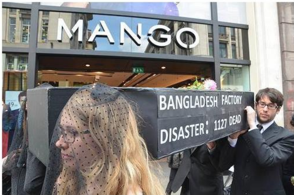
Prosvjed zbog smrtnosti u tvornicama tekstilnih proizvoda u Bangladešu

Kad bi se zarada reinvestirala i prioriteta posložili moglo bi se napraviti više i bolje od svega što imamo u svim granama industrije na svijetu pa tako i u modnoj.