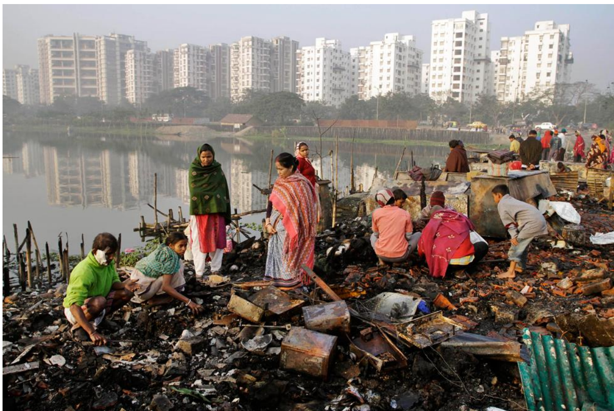
Slika: Svakodnevna scena iz Indije

Slika izgleda kao napredak civilizacije. Uskoro će ovi primitivni sakupljači nestati, a njihovo mjesto zauzet će one bijele zgrade u daljini. Pitanje je želi li ta kultura postati civiliziranom? Jesu li to stvarne ili nametnute potrebe? Zašto pristajemo na to (neoimperijalizam)? Je li to loše po nas (neoliberalizam)? Kako se prilagoditi tome (budućnost)? Ima li moderan čovjek dušu? Pravo na izbor? Je li današnjica rezultat civiliziranog ponašanja i potiskivanja nagona? Postoji li još uvijek spontanost? Zašto se rijetko govori o ovakvim temama?