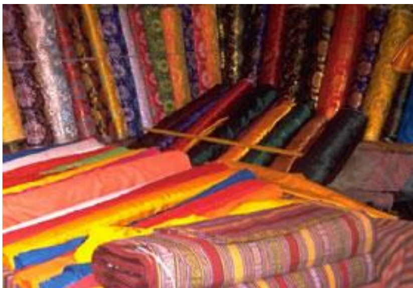
Slika: Obojana tkanina