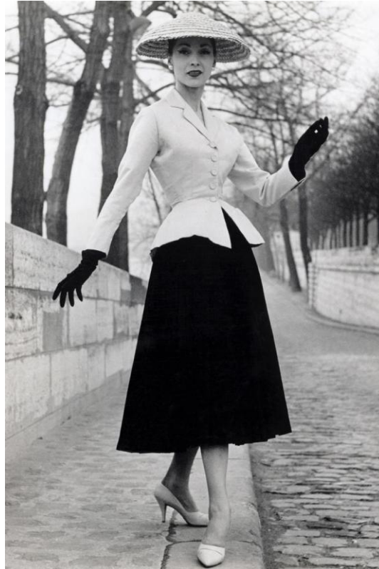
Slika: New Look

dolara za haljinu, a naša djeca nemaju mlijeka!“ uzviknuo je netko u znak protesta kad se Diorova kolekcija pojavila u trgovinama diljem Francuske. Dior nije jedini koji je gradio karijeru zajedno s usponom nacističke okupacije - to isto su činili i Coco Chanel, Hugo Boss, Louis Vuitton i drugi poznati dizajneri. 5