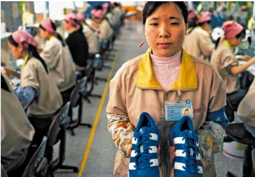
Slika: Rad u tvornici

Elitni dućani ostvaruju profit koji je nesrazmjeran u odnosu na uloženi kapital , što stvara isto tako neravnopravne društvene odnose i omogućuje izrabljivanje. Isticanje ovakvih odnosa kroz modu ne bi bio toliko značajan problem da se ne radi i o katastrofalnim posljedicama za zdravlje ljudi i okoliša - pokraj kojih se bogataši hvale. Da zaključim, mislim da se vlasnici tvornica boje podizanja plaća radnicima jer misle kako će time otjerati velike marke za koje šiju i stoga se natječu u ponudi (tko će ponuditi manje) i tako koče napredak i srozavaju standard vlastite države. Vlast bi morala nešto poduzeti - uvesti zakone kojima bi se iznosi plaća regulirali, odnosno zakone i propise kojima bi se štitila prava te države i njenih stanovnika, a zašto se to ne radi i hoće li se standardi jednom podići je upitno, a ja se nadam da hoće.