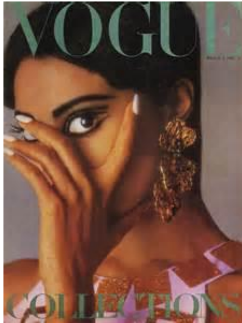
slika: Luna Donyale

Prva pojava tamnopute manekenke u modnom časopisu bila je 1959., iako se prvom službeno smatra Luna Donyale koju je Vogue prikazao na naslovnici 1966. godine. Njena prva pojava je bila na naslovnici izdanja Harper's Bazaara 1965. iste godine kad je prepoznata na ulici i angažirana kao model. 14