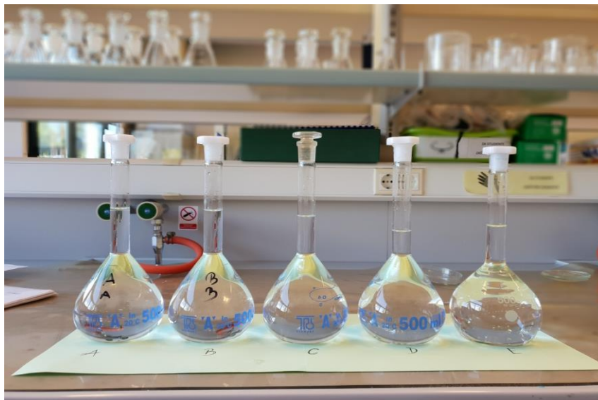
Slika 10 Pripremljen umjetan urin

Cilj ove metode bio je utvrditi ponašanje i mogućnost apsorpcije SAP različitih smjesa urina kako bi dobili što moguće vjerniji prikaz ponašanja superupijajućeg polimera u kontaktu s pravim urinom. Prva faza pokusa sastoji se od pripremanja umjetnih tjelesnih tekućina po sljedećim recepturama: