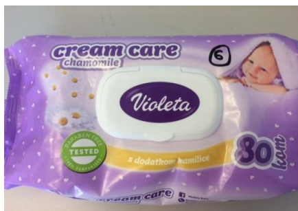
Slika 6 Violeta maramice

Vlakna se stavljaju u Asepsoleta maramice, koje su prethodno osušene u sušioniku (slika 6, 9).