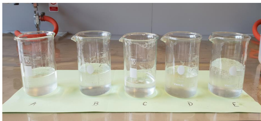
Slika 23 Upijanje urina

Rezultati upijanja umjetnog urina prikazani su u tablici 10, a način provedbe na slici 25.