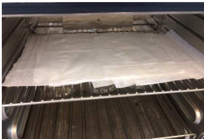
Slika 9 Violeta maramice u sušioniku

Maramice se potom presavijaju, ispune vlaknima i prošiju po rubovima kako bi se dobili mali punjeni jastučiće koji se onda važu (slika 10).