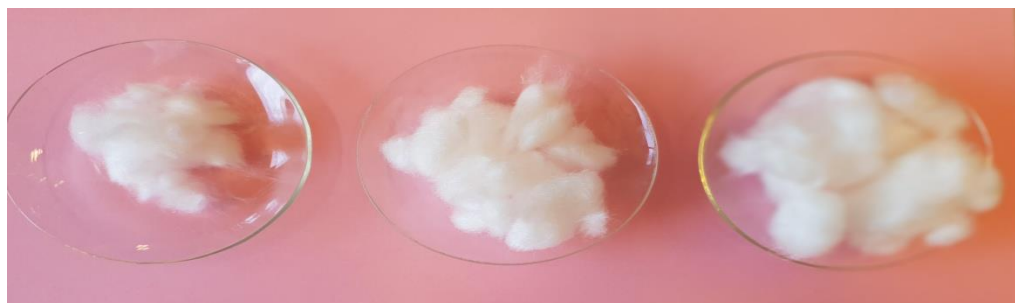
Slika 5 Pripremljeni uzorci od 1 g, 3 g i 5 g za ispitivanje

Svaka skupina vlakana stavljena je u zasebnu laboratorijsku čašu. U čaše se lagano dodaje, u početku 30x više ml u odnosu na masu vlakana otopine NaCl (30 ml, 90 ml, 150 ml).