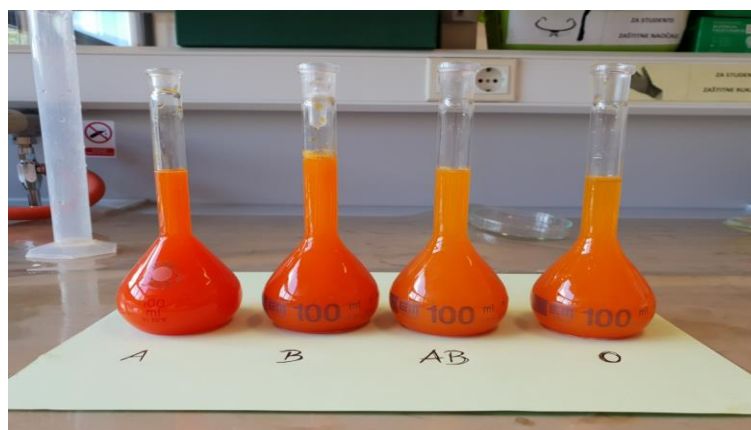
Slika 9 Pripremljena umjetna krv

destilirana voda + jestivo crveno bojilo