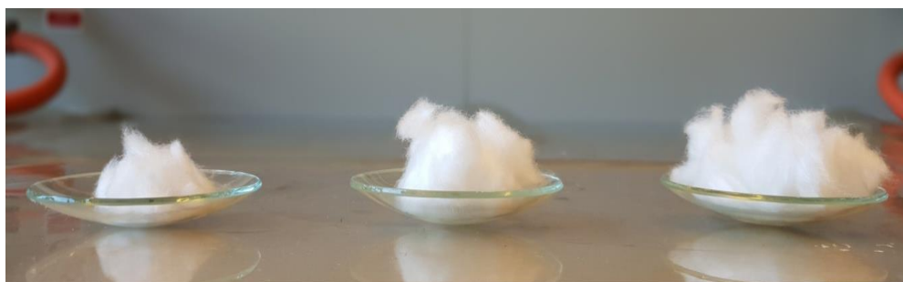
Slika 3 Uzorci vlakana od 1 g, 3 g i 5 g