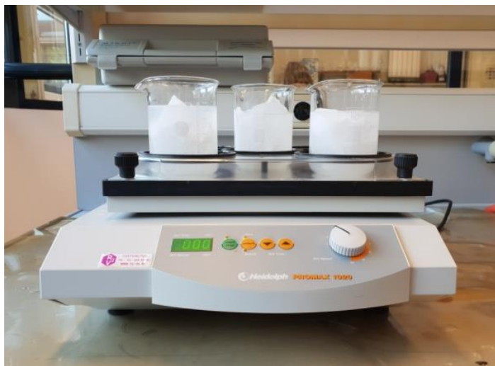
Slika 15 Uzorci tijekom ispitivanja na mućkalici

Grupa vlakana od 3 g po rezultatima nalazi se između dvije prethodno spomenute grupe.