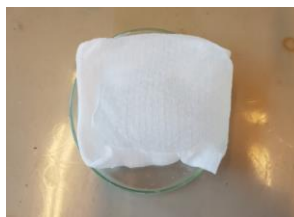
Slika 16 Centrifugirani uzorak