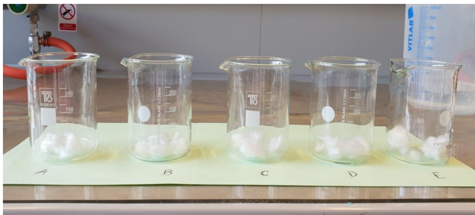
Slika 11 Uzorak od 1 g SAP-a raspoređen u laboratorijske čaše prije dodavanja umjetnog urina

U 5 izvaganih laboratorijskih čaša stavlja se prethodno izvagani uzorak SAP-a od 1 g.