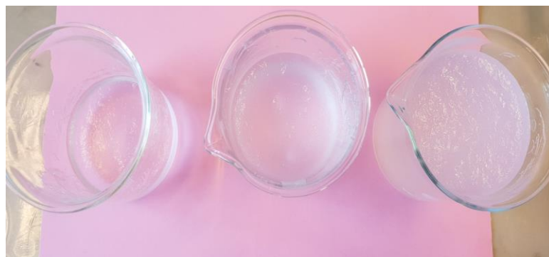
Slika 14 SAP vlakna u gel stanju II

Usporedbom dobivenih rezultata može se zaključiti kako je maksimalan upijeni volumen veći za 20 mL po gramu vlakana od minimalno uvjetovanog volumena koji je 30x veći u odnosu na masu vlakana, odnosno kako maksimalna apsorpcija vlakana iznosi 50x više otopine NaCl u odnosu na svoju masu.