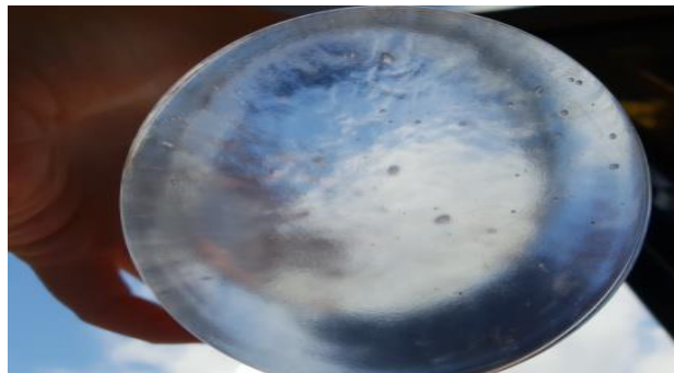
Slika 25 Mjehurići u uzorku

Maksimalna sposobnost superupijajućih vlakana mase 1 g da upiju smjesu tekućine D iznosi 106.7 mL, odnosno njihova masa u tom stanju iznosi 103.33 g. Vidljivi mjehurići.