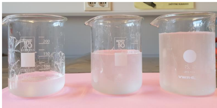
Slika 13 Maksimalni volumen kojeg SAP od 1 g, 3 g i 5 g mogu upiti

Volumen za uzorak 5 g koji je 30x veći s obzirom na njegovu masu iznosi 150mL. Maksimalni volumen koji uzorak 5 g može apsorbirati iznosi 250 mL te masa takvog vlakna/ gela iznosi 229.30 g.