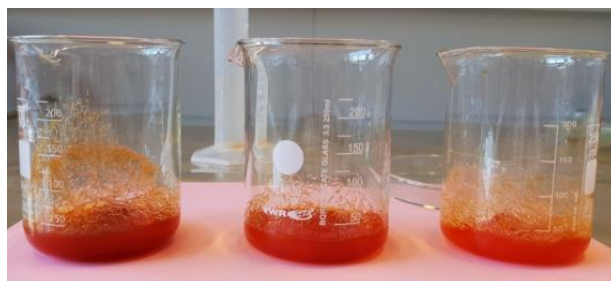
Slika 20 Apсорpcija krvne grupe AB

Krvna grupa AB: 1 g SAP ima mogućnost apsorpcije 26.6 mL krvne grupe AB.