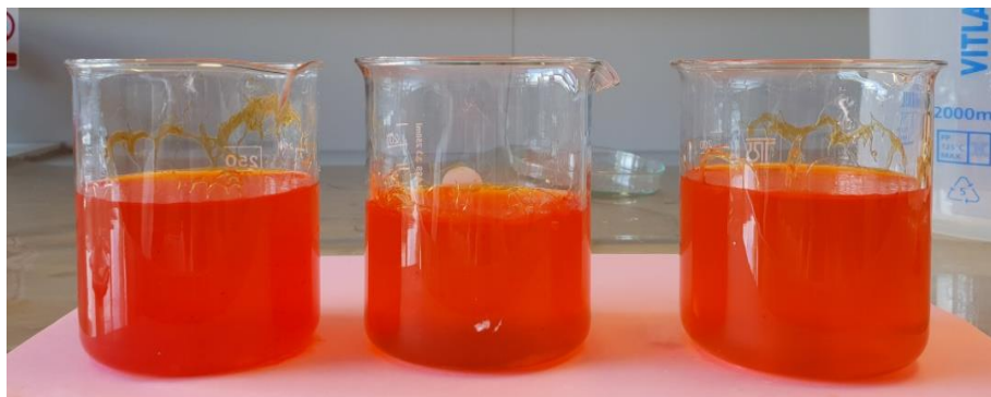
Slika 22 Apsorpcija krvne grupe 0

Krvna grupa 0: 1 g SAP ima mogućnost apsorpcije 153.33 mL krvne grupe 0.