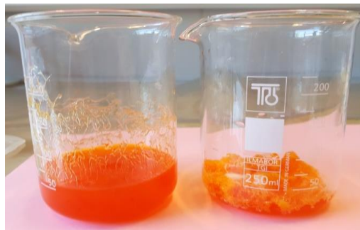
Slika 18 Apсорpcija krvne grupe B

Krvna grupa B: 1 g SAP ima mogućnost apsorpcije 30 mL krvne grupe B.