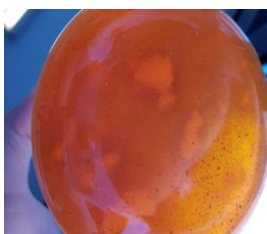
Slika 19 Nastale grudice

Krvna grupa AB: 1 g SAP ima mogućnost apsorpcije 26.6 mL krvne grupe AB.