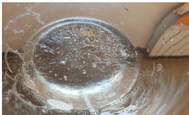
Slika 24 Nastali mjehurići

Maksimalna sposobnost superupijajućih vlakana mase 1 g da upiju smjesu tekućine A iznosi 100 mL, odnosno njihova masa u tom stanju iznosi 94.7 g. Vidljivi mjehurići.