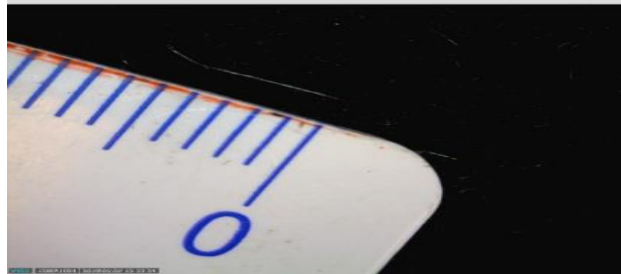
Slika 1 Duljina vlakna

Pomoću Dino-lite sustava za mikroskopiranje, tj. njegovog nastavaka za mikroskop (Dino-eye) promatran je prijelaz u gel stanje (slika 2).