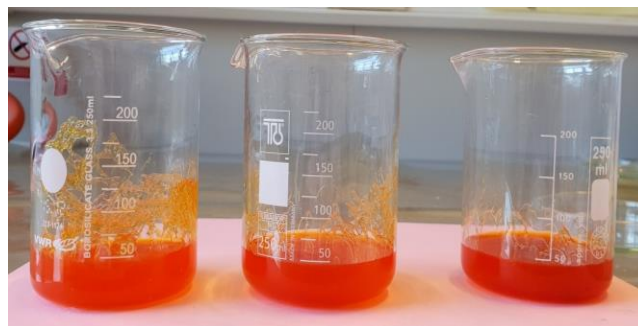
Slika 17 Apсорpcija krvne grupe A

Krvna grupa A: 1 g SAP-a ima mogućnost apsorpcije 40 mL krvne grupe A.