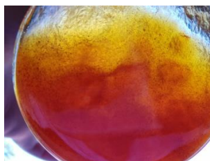
Slika 21 Nastale grudice