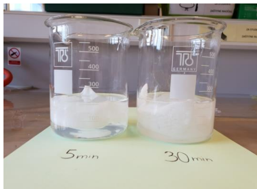
Slika 8 Jastučići s uzorkom uronjeni u 0.9% tekućinu NaCl