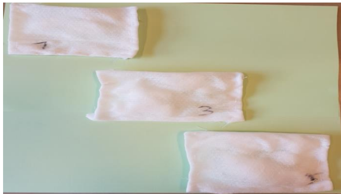
Slika 7 Uzorci od 1 g, 3 g i 5 g sašiveni u violeta maramicama

Violeta maramice koriste se iz razloga jer su u formi netkanog tekstila i nemaju pore kroz koje bi SAP mogao izaći, a opet su hidrofilne te dovode tekućinu do SAP vlakana.