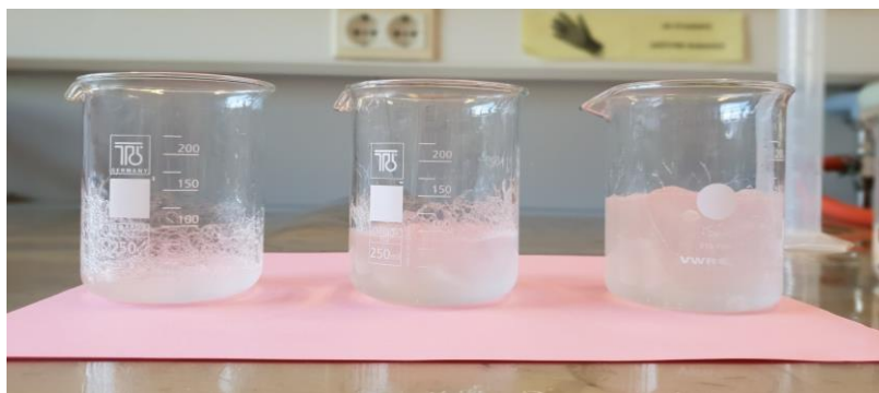
Slika 12 SAP uzorak u gel stanju