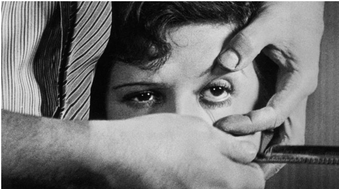
Slika 8. Scena iz filma "Un Chien Andalou" 20

Cilj im je bio šokirati intelektualnu buržoaziju svoje mladosti: „Povijesno, film reprezentira nasilnu reakciju protiv onoga što se tada nazivalo „avangardnim filmom“ koji je usmjeren isključivo prema umjetničkoj osjetljivosti i razumu promatrača“ (Buñuel, 2006). Naprotiv njihovih nada i očekivanja, film je bio veliki uspjeh među Francuskom buržoazijom (Koller, 2012), na što je Buñuel komentirao: „Što mogu učiniti s ljudima koji obožavaju sve što je novo, čak i kad ide protiv njihovih dubokih uvjerenja, ili o neiskrenom, korumpiranom novinarstvu, i praznom stadu koji su vidjeli ljepotu ili poeziju u nečemu što je doslovno ništa više nego očajni poziv za ubojstvo“ (Buñuel, 1929).