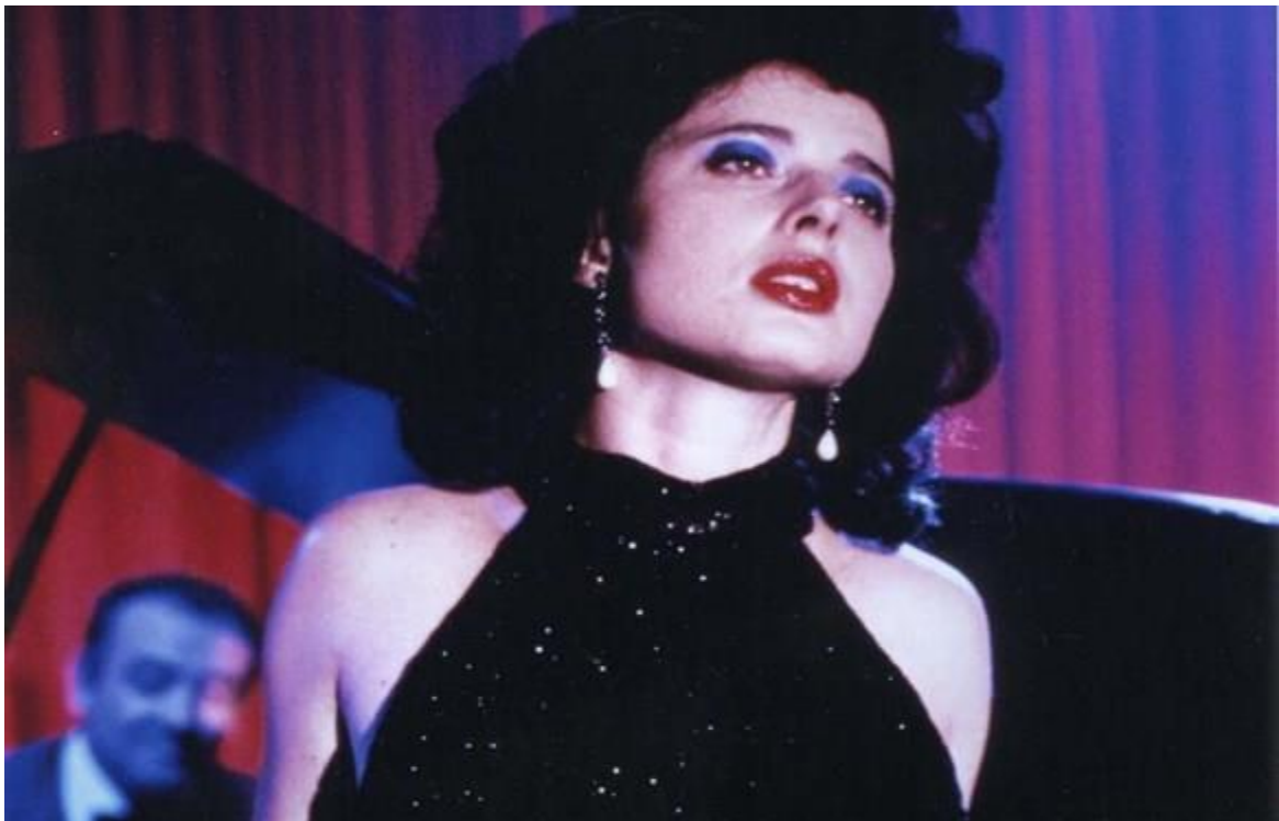
Slika 11. Dorothy Vallens u filmu "Blue Velvet" 26

Prvi put kada susrećemo Dorothy Vallens – u njezinu duboko ružičasto nijansiranom stanu kada Jeffrey ulazi prerušen u istrebljivača insekata – ona je odjevena u crvenu, svilenu haljinu u tipu ogrtača, koja, iako senzualna u tonu i teksturi, namjerno je nezavodljiva i neformalna u kroju (ona čeka posjetu enigmatičnog „Yellow man-a“). Njena kosa i šminka, su pak dramatične – voluminozna kovrčava smeđa kosa, jarko crveni ruž i istaknuto plavo sjenilo za oči – ostaju njezin prepoznatljivi izričaj kroz cijeli film. Lynch prekriva prelijepu Rossellini apsurdno pretjeranim „glamur“ , činjenica je koja čini Vallensin karakter još mističnijim.