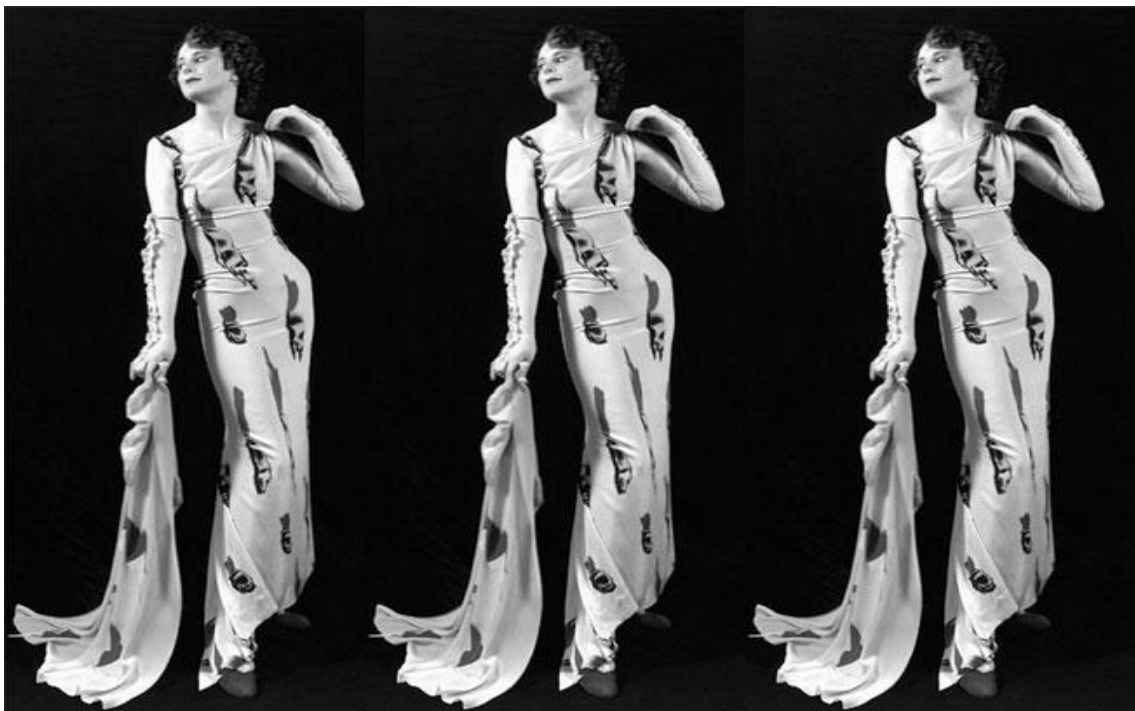
Slika 7. Model nosi "Tear dress" 18

„Tear Dress“, dio je poznate Schiapparelline „Circus“ kolekcije iz 1938. godine, koja odiše psihoanalitičkim konceptima smrti, kastracije i fetišizma, i inspirirana je Dalíjevom slikom „Three Young Surrealist Women Holding In Their Arms The Skins Of An Orchestra“. Haljina je imala optičku iluziju koja je izgledala kao rastrgani komadi odjeće. Bila je to haljina za žalovanje sa dugačkim veom. Radove sa takvom pričom u podlozi, vidimo tek devedesetih godina nadalje, u suvremeno doba tehnološke revolucije kod dizajnera kao što su Alexander McQueen, na koje se danas referiramo kao umjetnike.