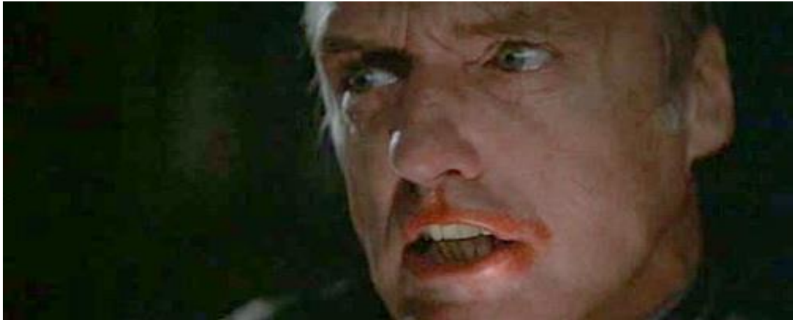
Slika 14. Frank Booth u filmu "Blue Velvet" 30

U zadnjoj sceni filma, Dorothy pak nosi običnu smeđu bluzu, izgledajući tako puno manje izuzetno i zavodljivo nego u dotadašnjim kombinacijama, a više kao zadovoljna majka, koja sad napokon može postati. Neobičnom mješavinom ranjivosti i senzualnosti, ljepote i pretjeranog glamura, Vallens je postala jedna od najkoničnijih filmskih heroína.