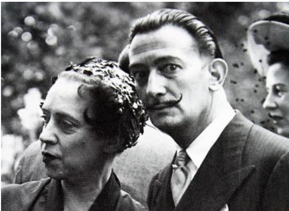
Slika 5. Schiapparelli i Dalí 16

„Konstantna tragedija života je moda i to je razlog zašto sam uvijek volio surađivati sa [...] gospođicom Schiapparelli, samo da dokažem da je ideja odijevanja, ideja prekrivanja samog sebe, samo posljedica traumatskog iskustva rođenja, koje je najjače od svih trauma koje ljudsko biće može doživjeti, pošto je prvo.“