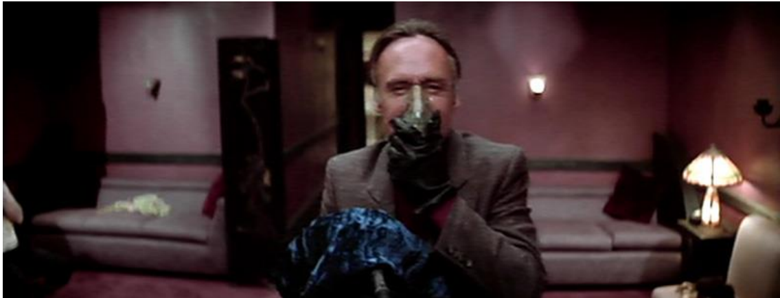
Slika 13. Frank Booth u filmu "Blue Velvet" 29

kroz bol i poniženje. S druge strane, krupni kadar njene glave kako pada unazad sa izrazom intenzivnog užitka na njenom licu pretpostavlja auto-erotsku želju i njeno ostvarenje. Kada Frank na nju vikne da ga ne gleda, ona, iako ne pogleda, zadržava svoju moć kroz užitak erotske samodovoljnosti. Ona doživljava užitak iz kojeg je muškarac isključen. Njezin pogled je usmjeren na mjesto unutar nje.