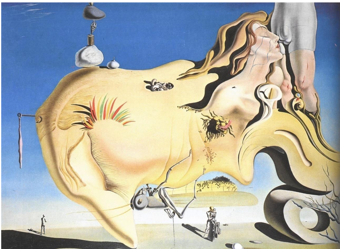
Slika 4. Salvador Dalí "Le Grand Masturbateur" 15

da je njegov stariji sin umro od neke vrste spolne bolesti koju mu je prenjeo. Zato, da bi upozorio adolescenta Salvadora o postojećim opasnostima, davao mu je knjige koje su sadržavale slike lezija nastalih sifilisom. Dalí se sjećao tih ilustracija kao strašnih i odbojnih i počeo ih je kao takve povezivati sa seksualnošću u cijelosti. To ga je navelo da izbjegava bilo kakvu formu tjelesnog kontakta i da se oslanja na onanizam kao svoj izvor užitka. Dalí je dvadesetih godina u Madridu stupio u kontakt sa mladim nadrealistima, te sklopio prijateljstvo s redateljem Luisom Buñuelom. Upravo u Madridu je Dalí otkrio psihoanalizu dok je čitao Freudov „Die Traumdeutung“, koji je ostavio snažan utjecaj na njega: „Bilo je to jedno od najvećih otkrića u mom životu. Bio sam opsjednut porokom vlastite interpretacije – ne samo mojih snova, već svega što mi se dogodilo, koliko god se slučajno na prvu činilo“ (Dalí, 1942).