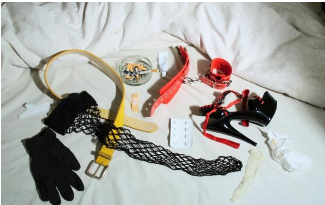
Slika 2. Fetišistički objekti 7

Valerie Steele istražila je vezu između fetišizma i mode u svojoj knjizi „Fetish: Fashion, Sex and Power“ iz 1996. godine. Steelin rad se širi na veze između odijevanja i