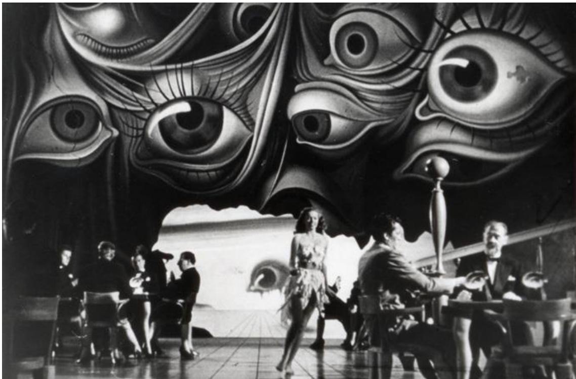
Slika 9. Dalíjeva sekvenca sna iz Hitchcockovog filma "Spellbound" 22

Zaposlen da osmisli sekvencu sna, Dalí je producirao više od dvadeset minuta snimke. „Ne mogu razlučiti kakvo je to mjesto bilo“ Gregory Peck muca, sjedeći na terapeutovom kauču, dok se scena pretapa u njegov um i Dalíjevu vizualnu estetiku. „Činilo se kao kockarnica, ali ondje nije bilo zidova, samo puno zavjesa sa očima na njima. Čovjek je hodao uokolo sa velikim parom škara rezajući svu draperiju na pola. Onda je došla djevojka sa gotovo ničime na sebi i počela hodati oko sobe, ljubeći svih“. Naravno da nije postojao bolji kandidat za realiziranje takve vizije od Dalíja. 21