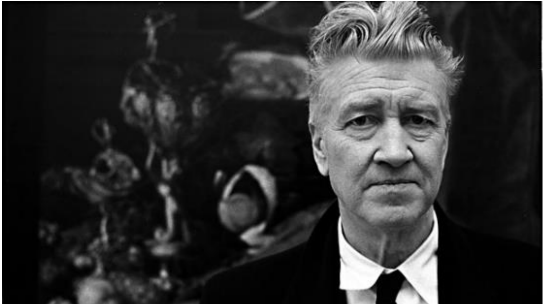
Slika 10. David Lynch 24

spomenutu dokumentarcu Lynch navodi mnoštvo nadrealističkih filmova i filmaša te govori o nadrealizmu kao o nečemu što se zanima za ono što se nalazi skriveno ispod površine, ono što je apstraktno i mnogo nejasnije i strašnije od onoga što nam je odmah dostupno. Budući da se i sam zanima za isto, zaključuje da i sam sebe može smatrati nadrealistom (Dugandžić, 2016).