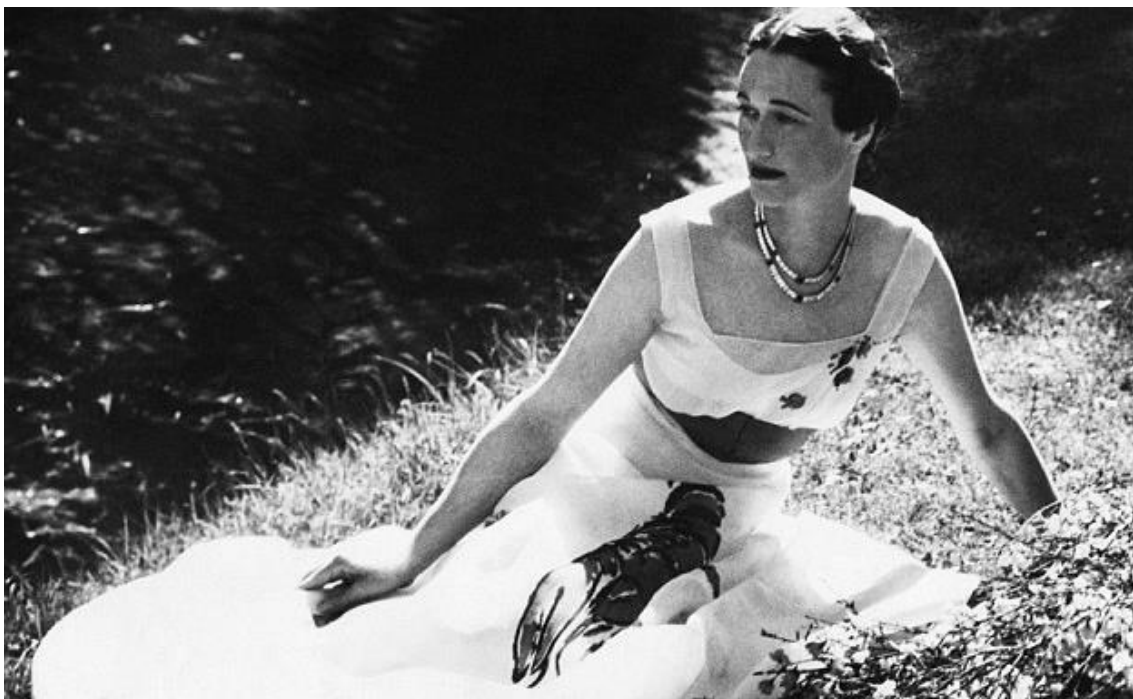
Slika 6. Vojvotkinja od Windsora nosi "Lobster Dress" 17

Schiapparellina kolekcija iz zime 1936./1937. godine prezentirana u kolovozu 1936. godine bila je prva njihova suradnja. Dalíjev „Antropomorphie Cabinet“ (1936.), čiji je torzo zapravo prsa s ladicama, inspirirao je Schiaparellino odijelo iz iste godine, čiji su džepovi bili oblikovani kao kutije, a gumbi kao ručkice ladicama, a ideja za poznatu kapu-cipelu proizašla je iz fotografije Dalíja koji stoji sa cipelom na glavi.