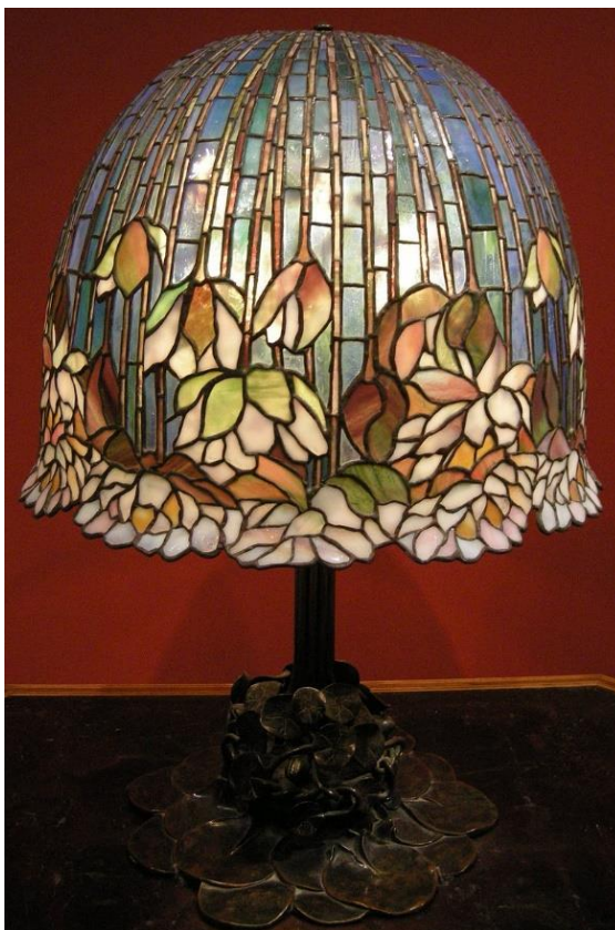
Slika 10. Louis Comfort Tiffany, svjetiljka, 1900.

Što se nakita tiče, René Lalique, Louis Comfort Tiffany i Marcel Wolfers stvorili neke od najcjenjenijih dijela na prijelaza stoljeća, proizvodeći gotovo sve, od naušnica do ogrlica, narukvica, broševa, pa se i danas Art Nouveau povezuje s luksuznim fin-de-siecle komadima.