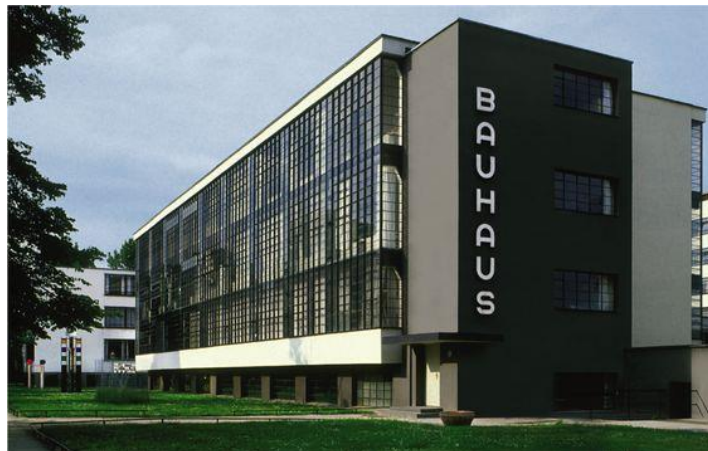
Slika1.: W.Gropius, Bauhaus, Dessau 1925. godina

Dolaskom u Ameriku 1938. godine zbog rata u Njemačkoj, Gropius biva imenovan ravnateljem škole za arhitekturu na Harvardu. Od tada radi, živi i djeluje u Americi sve do svoje smrti 1969. godine. Fotograf i slikar Moholy-Nagy je otvorio novi Bauhaus u Sjevernoj Karolini, a Mies van der Rohe je postavljen za voditelja arhitektonskog odjela Tehnološkog instituta Armour u Chicagu gdje je od njega naručena dvadeset jedna golema zgrada. Muzej moderne umjetnosti je postavio izložbu pod nazivom "Bauhaus 1919. – 1928." u čast Gropiusa i njegovog djelovanja na mjestu ravnatelja. Kasnije u MoMA-i ostaju mogli slikarski radovi i grafike značajnog Kandinskog i mnoštva drugih članova, tad bivšeg Bauhauusa. Razna imena američkih arhitekata i članova umjetničke scene su ostavljala svoje poslove kako bi došli studirati kod bauhausovaca koji su sada došli na njihov kontinent poučiti ih europsko-modernističkom radikalizmu.