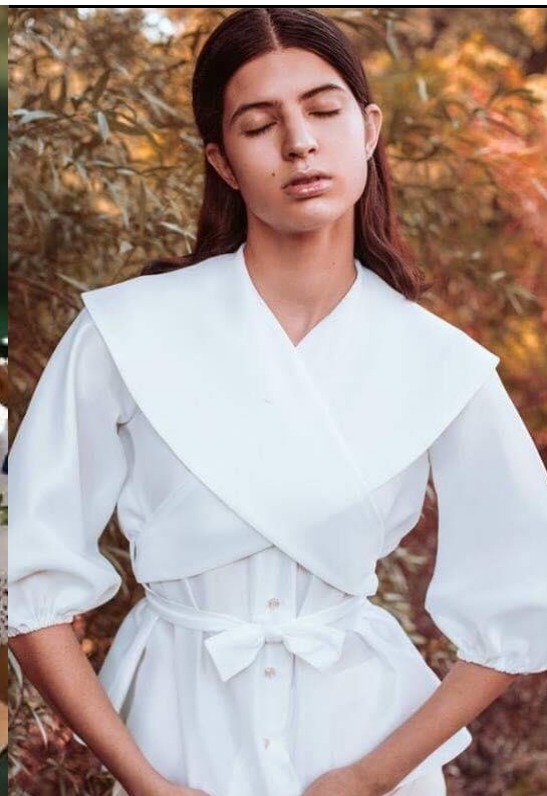
Sl. 13. interpretacija brenda Twins 2016.god.