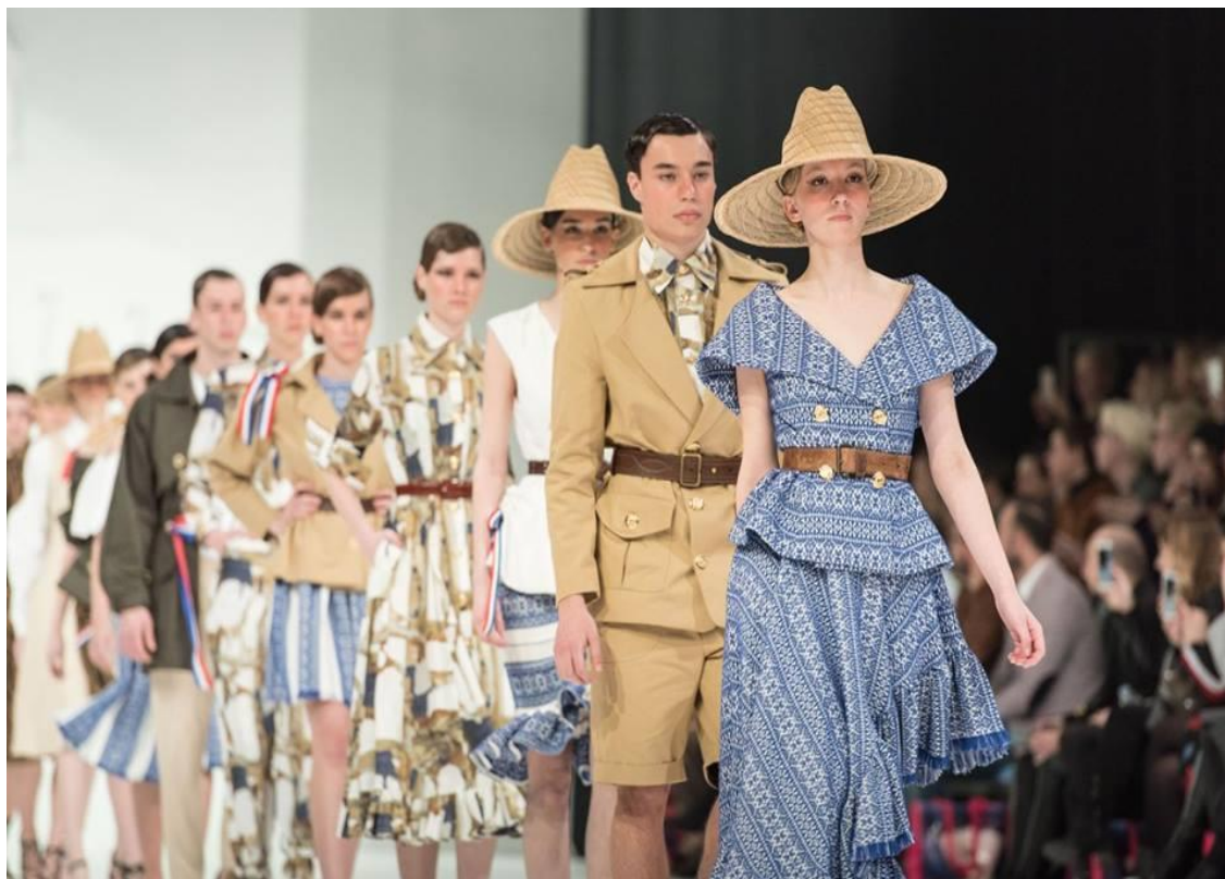
Sl. 25. Početak defilea Twins kolekcije Slavonski safari, proljeće/ljeto 2018. godine

U modi postoje dvije velike kolekcije. Ona za proljeće/ljeto i ona za jesen/zimu. Način predstavljanja kolekcije ovisi do dizajnera, a najčešći način prikazivanja je monolog. Koncept brenda Twins se zasniva na ideji da kolekcija kod promatrača mora potaknuti reakciju zato je način predstavljanja kolekcije više dijalog nego monolog. Za potrebne modne revije potrebno je unajmiti manekenke i obaviti fitting nekoliko dana prije predstavljanja revije kako bi se sašiveni modeli za potrebe modne prezentacije mogli prilagodili manekenkama. Osim samih komada potrebno je složiti cjelokupan stajling kako bi sveukupni dojam bio potpun. Razlika između dizajna i stajilinga je u namjeri oblikovatelja. Dizajnirajući želimo poboljšati proizvod mijenjajući mu svojstva, a stajilingom kod kupca želimo stvoriti pogrešan dojam o kakvoći ili vrijednosti proizvoda tek površnom promjenom njegovog izgleda. Proizvod ostaje isti, samo je minimalnim estetskim zahvatima promijenio svoj vizualni dojam.