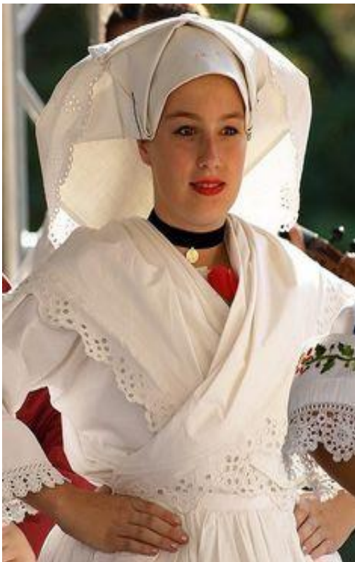
Sl. 12. Narodna nošnja Beravci

Zatvorenija seoska područja koja su slabije izložena miješanju stanovništva, izolirana geografski i lošim prometnim vezama kao krševiti predjeli te neki otoci najduže su uspjeli zadržati tradicionalan način života, a time svoje običaje i narodnu nošnju. Narodna nošnja je simbol stanovništva određenog područja, ponaša se kao živi organizam i prilagođena je sredini u kojoj ju stanovništvo odijeva. Narodna nošnja se uklapa u sliku kraja u kojem se nalazi, otkriva osnovne grane gospodarstva, iz nje se očitavaju klimatski uvjeti te se na njoj odražava blagostanje šire zajednice kao i imovinsko stanje pojedinca koji ju nosi. Osim estetskoj pridodaju joj se i uporabna (praktična), irealno-magijska, tradicijska i statusna simbolika. Narodna nošnja je sažetak višestoljetnog ljudskog iskustva toga kraja i prava osobna karta svakog pojedinca. Prikazuje kako se mijenjala kroz stoljeća i svaku životnu fazu seljaka, osobito kod žena (djevojaštvo, mladovanje, materinstvo, zrelost i udovištvo), uz varijante blagdanskog i obrednog ruha. Upravo to je polazna točka kolekcije za proljeće/ljeto 2016. godine. Twinsi su se inspirirali načinom odijevanja i opremanja slavenskih žena i udanih Slavonki. Postupak odijevanja narodne nošnje i vezivanja marame im je bila nit vodilja pri stvaranju moderne interpretacije. Velika marama prebačena je oko vrata, prekrížena na grudima i povezana s leđa.