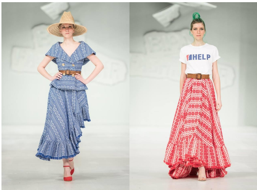
Sl. 20, 21, 22. i 23. Twins modeli iz kolekcije Slavonski safari- proljeće/ljeto 2018.