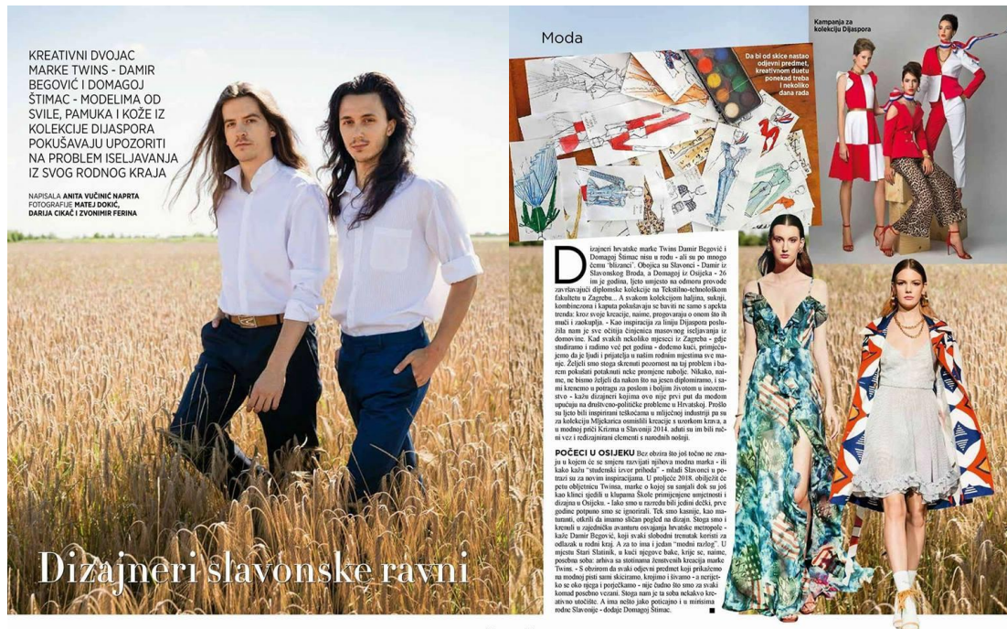
Sl. 8. Intervju s Twinsima piše Anita Naprta za magazin Glorija, Srpanj 2017. god.

Kolekcija za jesen/zimu 2015.-2016. godine prekretnica je njihovog rada. Twinsi počinju svoj rad fokusirati isključivo na hrvatsku te predstavljaju kolekciju inspiriranu Hrvatskim Narodnim Preporodom. Sljedeće sezone kolekcija za proljeće/ljeto 2016.god. izaziva veliki interes hrvatskih medija i publike zbog svog društveno-političkog konteksta. Potaknuti lošim ekonomskim i gospodarskim stanjem u Republici Hrvatskoj, Twinsi progovaraju o lošoj politici koju trenutna vlada vodi i šalju poruku kako je moda odraz vremena u kojem žive. Potaknuti poljoprivrednom emisijom (Plodovi Zemlje) koja se prikazuje na HRT-u, Twinsi za medije nakon revije izjavljuju: „Ako se prisjetite 2012. godine održan je prosvjed mljekara koji su prosvjedovali jer je otkupna cijena mlijeka pala 2,30 kn po litri. Mljekari su tada tvrdili kako je takvo stanje neodrživo. Danas (2016.) otkupna cijena litre mlijeka 1,90 kn. Kako će mljekari opstati u tim uvjetima ne znaju ni oni sami. Zato svakoga dana muzne krave idu u klaonicu, farme diljem Hrvatske se zatvaraju, a sama činjenica da je litra mlijeka jeftinija nego litra vode je uznemiravajuća...“ Interpretacijom sela u kolekciji uvijekvječili su mali dio seoske kulture, što je upozorenje na gubitak povijesti. Svjesni da jedna kolekcija ne može promijeniti trenutno loše stanje u selima diljem Republike Hrvatske trude se na kreativan i optimističan način poslati poruku i upozoriti na izumiranje seoskih običaja, kulture i života na selu koji odlazi u zaborav.