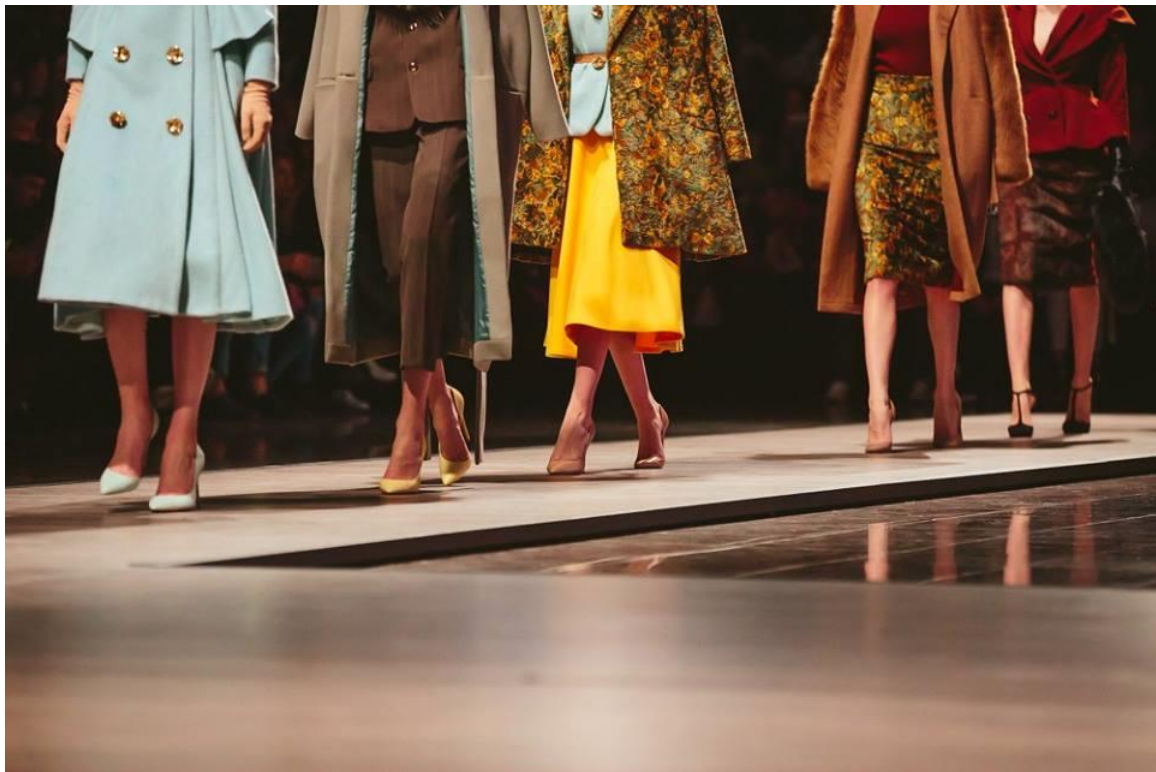
Sl. 5. Mercedes Benz Fashion Week Ljubljana, Slovenija 2017, Twins defile

Od ljeta 2013.god. pa sve do danas Twinsi u sklopu Cro-A-Portera predstavljaju dvije kolekcije godišnje po sezonama proljeće/ljeto i jesen/zima, a svake godine do danas, u lipnju putuju u Split kako bi predstavili svoje ljetne cruise kolekcije na modnom događaju Montura Fashion Destination. U listopadu 2016. god. Viktor Drago i organizacija Cro-A-Portera obavještavaju ih kako udružuju snage s Zagreb Fashion Week platformom tjedna mode na kojoj Twinsi predstavljaju svoje dvije kolekcije koje im zbog svog predstavljanja na službenom tjednu mode omogućuju internacionalnu vidljivost zbog koje na proljeće u travnju 2017.god. putuju u Sloveniju na Mercedes Benz Fashion Week Ljubljana predstaviti kolekciju jesen/zima 2017.-2018.godine sastavljenu od najjačih komada iz prijašnjih Twins kolekcija u jednu.