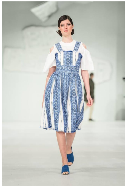
Sl. 17. Twins interpretacija nošnje, 2018.god.

Moderna interpretacija elemenata slavenske nošnje može se prepoznati po stajlingu kao kombinacija košulje preko koje se oblači haljina (slika br.16.) što podsjeća na slojevito oblačenje narodnih nošnji, po etno elementima koji su utakni ili našiveni na materijal, po izboru boja karakterističnih za narodnu nošnju a i po izboru materijala budući da se plavo-bijeli materijal za Twins interpretaciju moderne narodne nošnje ručno tka u Hrvatskoj od pamuka što je također karakteristično za narodnu nošnju.