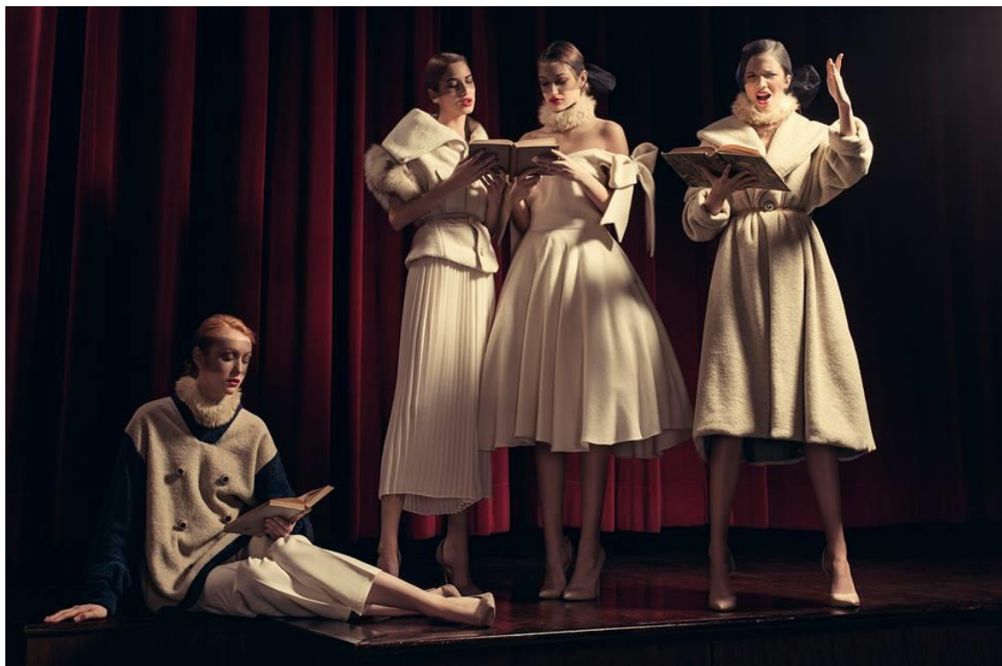
Sl 28. Twins kampanja Hrvatski narodni preporod, jesen/zima 2016.-17. god.

Pod pojmom “promocija“ podrazumijeva se komunikacija između brenda i krajnjeg potrošača. Kampanje se koriste u reklamne svrhe, a reklame su most koji korporacije koriste kako bi došle do potrošača. Njihova svrha je da prodaju proizvode kako bi se ostvarila maksimalna zarada. Kao takva, reklamna industrija je samo simptom sustava u kojem živimo, a ne glavni problem. U reklamnim kampanjama svaka nova kolekcija predstavlja se kao maštovitija, kreativnija ili kvalitetnija od prethodnih. Za većinu modnih kampanja, promocija je ključ za privlačenje pažnje i uspostavljanje navika kod modne publike i kupaca, a glavna svrha promocije je da vizualima govori u ime brenda kako bi informirao i uvjerio kupca da je baš to ono što mu treba. U suštini na umu treba imati činjenicu da promotivnu strategiju treba mijenjati u skladu s kretanjem mode kroz ciklus prihvaćanja. Ono što je odgovarajuća promotivna strategija za jednu modnu liniju koja se uvodi prvi put, neće biti odgovarajuće za brendove koji se nadmeću u osvajanju dijela već osvojenog tržišta. Prilikom istraživanja tržišta i odabira svoje ciljane publike treba imati na umu ponašanje potrošača, kako bi što efikasnije odabrali smjer i ideju kako kampanja treba izgledati, koju poruku šalje i kojoj točno publici se obraća.