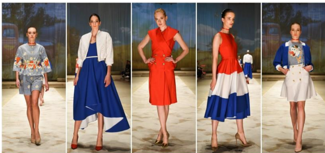
Sl. 9. Kolekcija inspirirana propadanjem Slavonskog sela, proljeće/ljeto 2016. godine