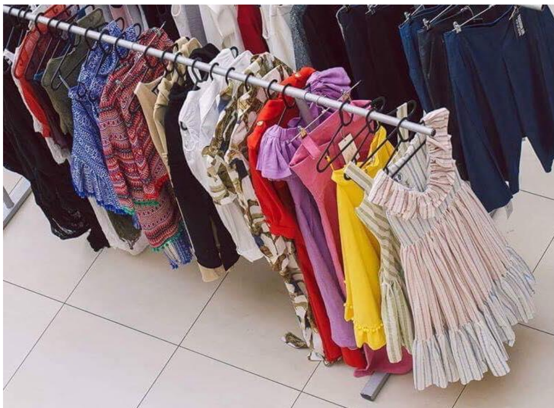
Sl. 31. Gotovi proizvodi brenda Twins u trgovačkom centru City Center One West

Dučani kolekcije naručuju tijekom cijele godine ali prve isporuke kolekcije za proljeće/ljeto dolaze već u Siječnju dok potrošači borave u trgovini zbog zimske rasprodaje potencijalno mogu biti privučeni novim kolekcijama pa proizvodnja istih mora početi tokom studenog i prosinca. Siječanj i veljača su najteži proizvodni mjeseci u sezoni dok se tijekom svibnja i travnja zaokružuje lista narudžbenica, a ako se neke narudžbe ponove zbog dobre prodaje određene linije ta proizvodnja će se također obaviti u tom periodu. Za prodavaonice na malo, tradicionalno vrijeme prodaje je najvažnije. Tijekom godišnjeg perioda prodaje mogu se pratiti trendovi što može pomoći pri izboru proizvoda za sljedeću godinu. Prodavači na malo trebaju evidentirati podatke o tjednoj prodaji i uspoređivati ih s zalihama, a iz prodajnog prostora (butika) se mogu ukloniti linije kolekcija koje se slabo prodaju kako bi u isti bile vraćene u vrijeme rasprodaje. Tim postupkom se osigurava slobodan prostor za naručivanje kolekcija koje se dobro prodaju.