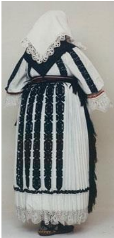
Sl. 16. Starovirska nošnja Bapska

Takva vrsta jednodijelne rubine zadržala se u Baranji te istočno od nje uključujući i Rumunjsko područje dok su rukavi široki u laktu, stisnuti s bogatim zarukavljem, te stražnji skuti rubine složeni u polegnutim naborima od boka do boka, zadržali su slavenske karakteristike. Starovirsko ruho ukrašeno je karakterističnim slavenskim crno-modro-crvenim vezom na bijeloj rubini. Vezu se uzdužne pruge, stupi duljinom rukava, te na stražnjem dijelu skuta (doljnji dio rubine) i uz porub. Na rubinu se pripasuje pregača od domaćeg suknenog tkanja ukrašena šarama i resama po rubovima a na nogama su šarene dekorativne čarape i opanci kapičari.