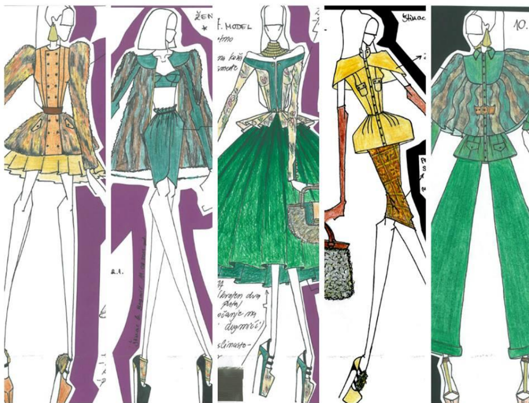
Sl. 11. Modni crteži brenda Twins za kolekciju jesen/zima 2012. godine

Princip i pristup rada na kolekcijama razlikuje kod svakog dizajnera i ne postoje točne upute koje garantiraju uspjeh ili kvalitetu kolekcije. Za Twinse rad na svakoj kolekciji počinje od ideje. U lipanjskom izdanju časopisa Ljepota i Zdravlje Twinsi o kreativnom procesu stvaranja navode: „Svoju ideju prenosimo na papir, provodimo tjedne istražujući temu kojom se inspiriramo i na kraju radimo layout kolaž od skica, modnih ilustracija, crteža, inspirativnih citata iz literature koja je povezana s tematikom inspiracije, filmova, glazbe, tkanina i svega što smatramo esencijalnim kako bi jednim pogledom na tu umnu mapu shvatili koja je inspiracija kolekcije.“