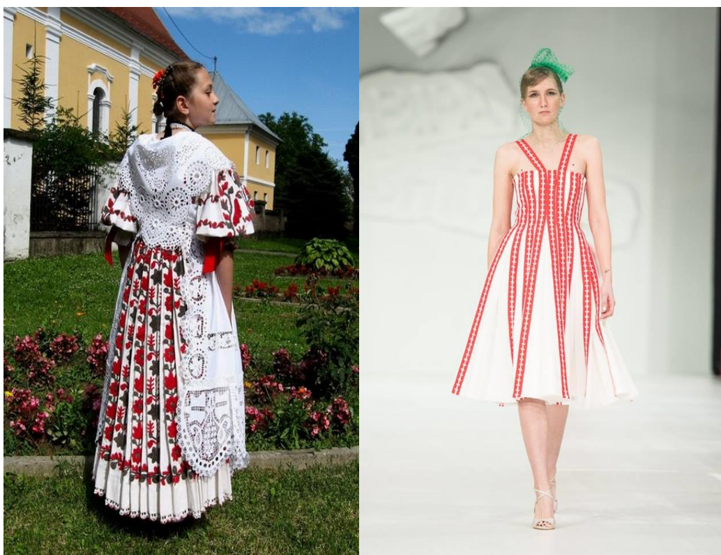
Sl. 18. Nošnja Slavnskog Kobaša