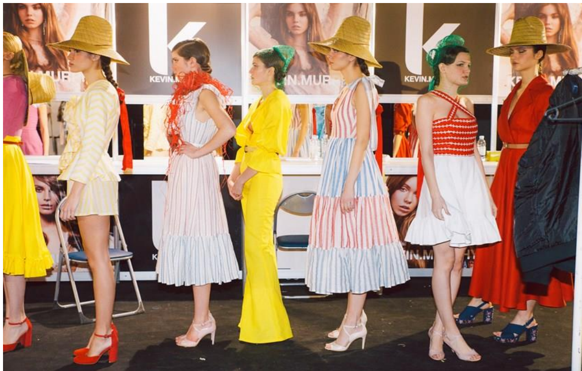
Sl. 24. Backstage defile za Twins kolekciju Slavonski-safari za proljeće/ljeto 2018.g.

Jelka Radauš Ribarić u svojem istraživanju narodne nošnje piše: „Opremanje glave u žena na selima se izvodilo na bezbroj načina, a razlikuju se od sela do sela što im je i svrha. Ipak staroslavenski običaj pokrivanja kose udanih žena zajednički je svima, a ostatak je vjerovanja da je u kosi skrivena životna snaga koju treba štititi od zlih sila. Djevojka kosu posljednji put ima otkrivenu na vjenčanju pod bogato iskićenom svadbenom krunom. Dotad je na začušljanu kosu vezivala vrpce ili polagala vijenac kao znak djevojaštva, nakon vjenčanja kosu je morala pokrivati poculicom (kapicom) koju nije više skidala ni noću. Nakon prve godine braka preko poculice stavlja se široka platnena marama pod nazivom peča bez koje se žena ne pojavljuje u javnosti, a oblici kapice variraju. Dvoroga poculica ženske narodne nošnje Sjeverozapadne hrvatske iz Pisarovine ukazuje na srodnost s srednjovjekovnim oglavljima, dok je u Trgu kod Ozlja šupljikasta kapica izrađena tehnikom preplitanja napetih niti koja potječe iz brončanog doba.“ Česta seljenja i premještanja stanovništva kao posljedica turskih provala uzrok su razlika u nošnjama susjednih naselja. Interpretaciju tih običaja kako bi što vjernije prenijeli temu inspiracije Slavonskim selom možemo vidjeti i u Twins kolekciji u kojoj je dio manekenki nosio šešire, a ostala polovica je imala crvene vrpce svezane na kraju svake pletenice u kosi.