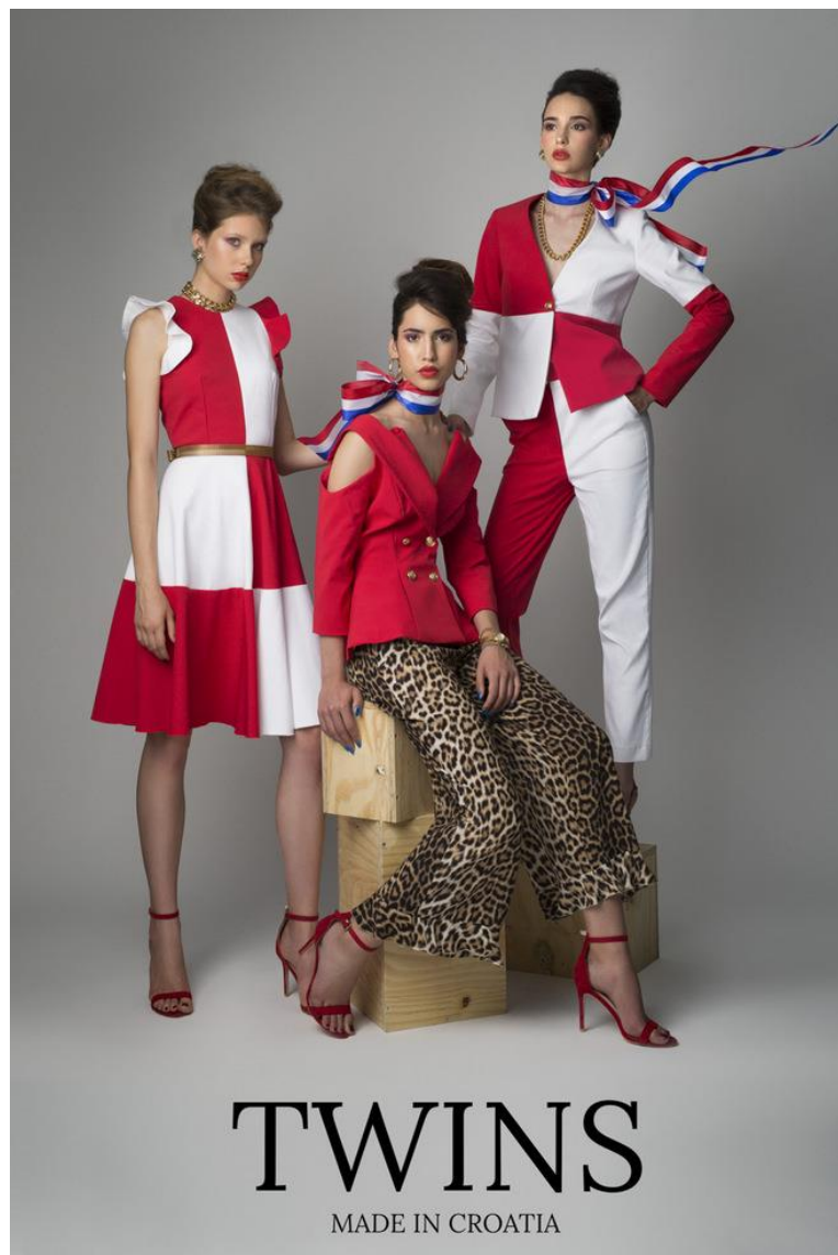
Sl. 10. Twins kampanja za kolekciju Hrvatska Dijaspora, proljeće/ljeto 2017. god.

Twinsi su jedini brend u hrvatskoj koji se posvetio tematici koja progovara o današnjem stanju prostora i vremena u kojem živimo. Kritički se obraćaju publici koja promatra njihove kolekcije koje svojom inspiracijom, glazbom i dizajnom progovaraju o relevantnim društveno-političkim temama svakodnevnice danas kao što su kolekcije o: propadanju i gubitku Slavenskog sela kolekcija ( proljeće/ljeto 2016.), zatim kolekcija posvećen starom gradu Zagrebu (jesen/zima 2016.-2017.), ili kolekcija pod nazivom “Hrvatska Dijaspora“ za ( proljeće/ljeto 2017.) inspirirana sve većim brojem iseljavanja mladih ljudi iz cijele Hrvatske, a najviše iz Slavonije. Cilj Twins kolekcija je prikazati kako modni dizajn može djelovati aktivistički te osvijestiti i educirati publiku o bitnim problemima današnjice u Hrvatskoj na kreativan način.