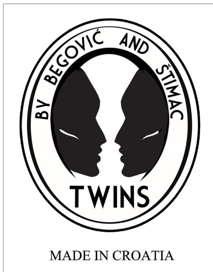
Sl. 7. Zaštitni simbol i logo brenda TWINS koji se nalazi na svim etiketama.

Ideja za naziv brenda TWINS nastala je promišljanjem o nečem karakterističnom za dizajnere što povezuje njih i brend za koji rade. Definicija pojma Blizanci predstavljaju dva embrija koja se u tijelu iste majke istovremeno razvijaju i rode neposredno jedan poslije drugoga. Blizanci mogu biti dvojajčani ili jednojajčani i jednojajčani tj. identični. Ako se radi o tri, četiri ili više embrija onda su u pitanju trojke, četvorke, petorke itd. U psihologijskom rječniku Boris Petz objašnjava: „Kod višejajčanih blizanaca radi se o bićima koja su nastala razvojem više istodobno oplodjenih jajnih stanica majke, pa prema tome takvi blizanci mogu biti različita spola, a ujedno su i različitih bioloških karakteristika. ( kao što su obično braća ) Jednojajčani blizanci nastaju tako, što se nakon oplodnje jedne jajne stanice kromosomi te stanice raspolove po dužini i stvore novu stanicu jednakih bioloških svojstava, a ako su istoga spola onda i biološki predstavljaju jednaka identična bića.“