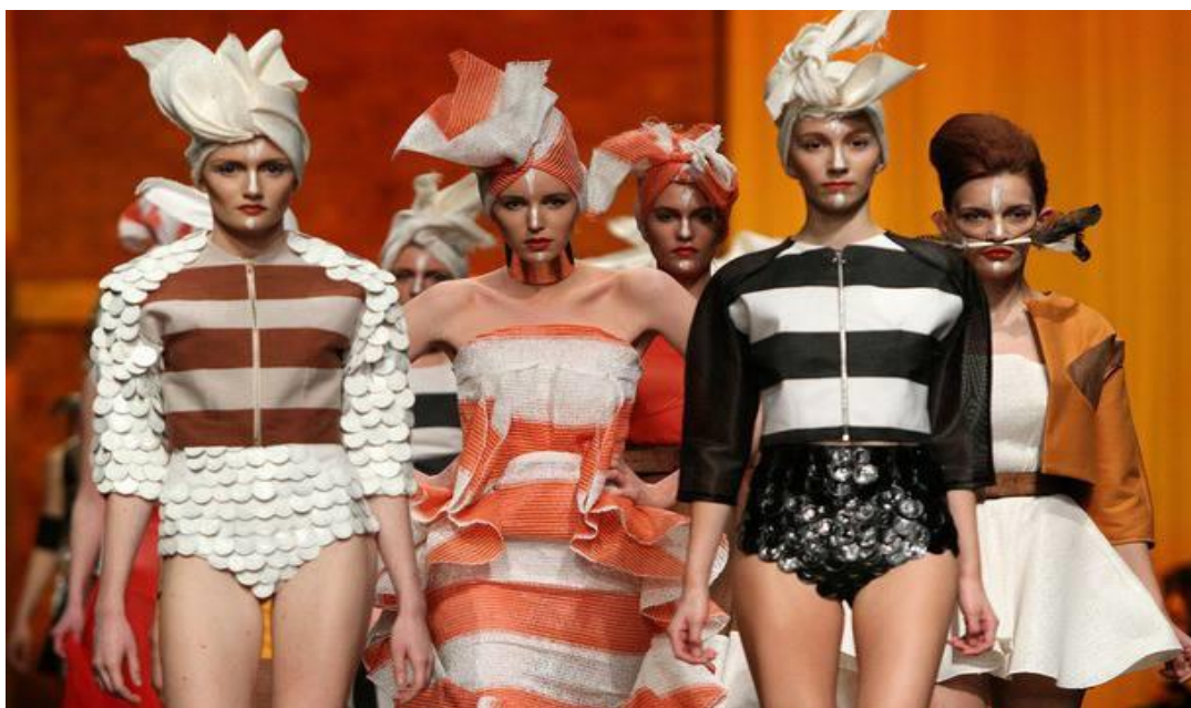
Sl. 3. Prva Twins kolekcija u Zagrebu, Cro-A-Porter proljeće/ljeto 2013.god.