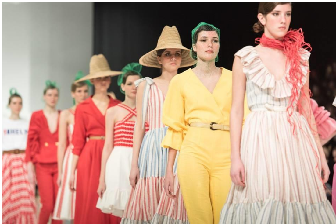
Sl. 26. Kraj defilea Twins kolekcije Slavonski safari, proljeće/ljeto 2018. godine

U procesu stvaranja i kreiranju svake kolekcije dizajner mora biti svjestan odgovornosti oblikovatelja jer osim ekonomske koristi dizajner mora biti svjestan i svoje uloge kulturnog radnika. Dizajn preobražava kulturu života i kulturu rada. Oblikujući pojedini odjevni predmet dizajner za brend oblikuje i skalu vrijednosti, stavove, mišljenja i ponašanja kako proizvođača tako i potrošača. Uskladiti kvalitetu, izgled i upotrebljivost proizvoda je najteži zadatak svakom dizajneru.