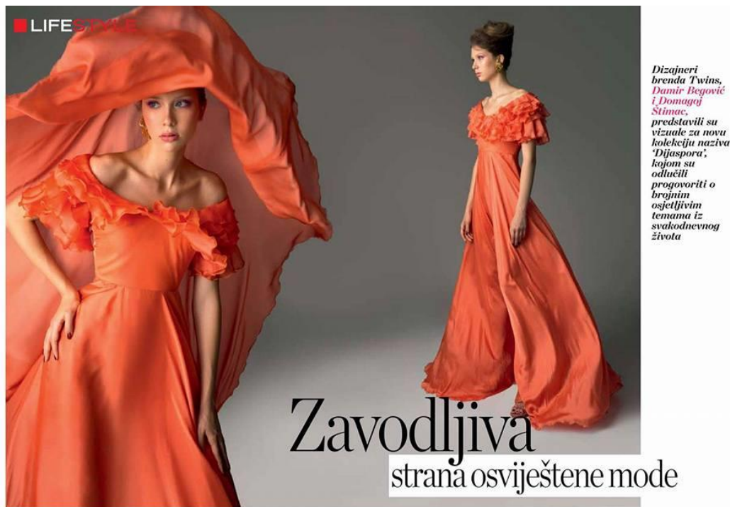
Sl. 29. i 30. Intervju s brendom Twins o kolekciji Dijaspore i novoj kampanji za proljeće/ljeto 2017. godine, piše Marko Banjavčić za časopis Story, Lipanj 2017. god.

Kupovanje putem medija znači osiguravanje prostora u novinama, časopisima itd. Vještina je da se s što manje novca plaćenog za oglasni prostor, što više poveća broj ciljanih potrošača koji će vidjeti poruku.