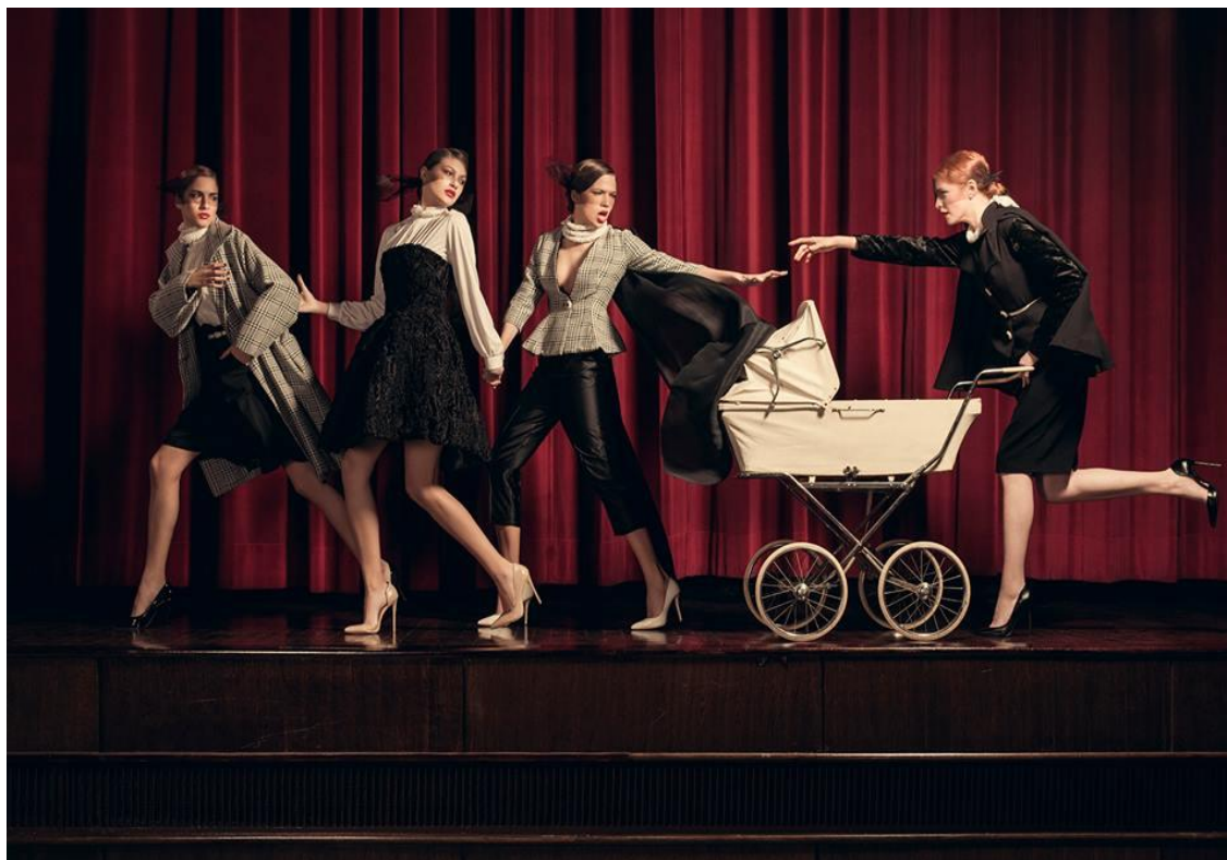
Sl. 27. Twins kampanja Hrvatski narodni preporod, jesen/zima 2016.-17. god.

U ovoj fazi traži se tip potrošača koji je spreman isprobati neki novi stil. Modne kampanje se snimaju kako bi se predstavljena kolekcija ponovno prezentirala potrošačima kroz zanimljive vizuale. Jedna moćna fotografija vam može ispričati sve što se događa u svijetu. Da bi neki stil bio prepoznat, stvorio novu publiku ili bio široko prihvaćen neophodno je da mora biti medijski eksponiran. Nije lako usvojiti kojem socio-ekonomskom području pripadaju oni koji usvajaju modu, iako postoji uvjerenje da su to uglavnom mladi ljudi. Jocelyn De Noblet piše: „Osim što se primjećuje da su modni lideri većinom mlađa publika vidljivo je da oni potiču iz grupacija s vrha i sa dna socio-ekonomske piramide. Modna ideja koju jednom ponese neka manja grupa može se proširiti i na širu publiku ali ne mora se obavezno kretati gore ili dolje. Usvajanje mode od strane ljudi istog tipa poznato je kao horizontalna teorija. Tinejdžeri su najbolji primjer za to.“ Modna kampanja mora sadržavati duh kolekcije koja je prikazana i prenijeti jasnu poruku publici za koju je namijenjena.