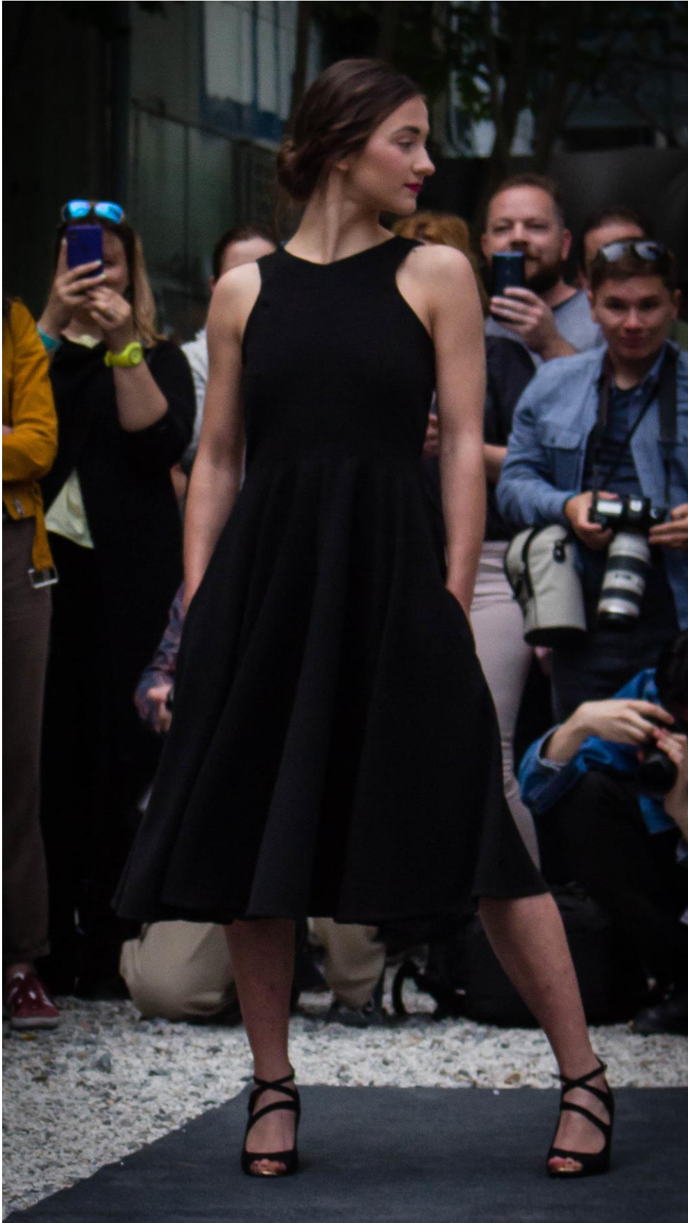
Slika 20: Model 3, naprijed