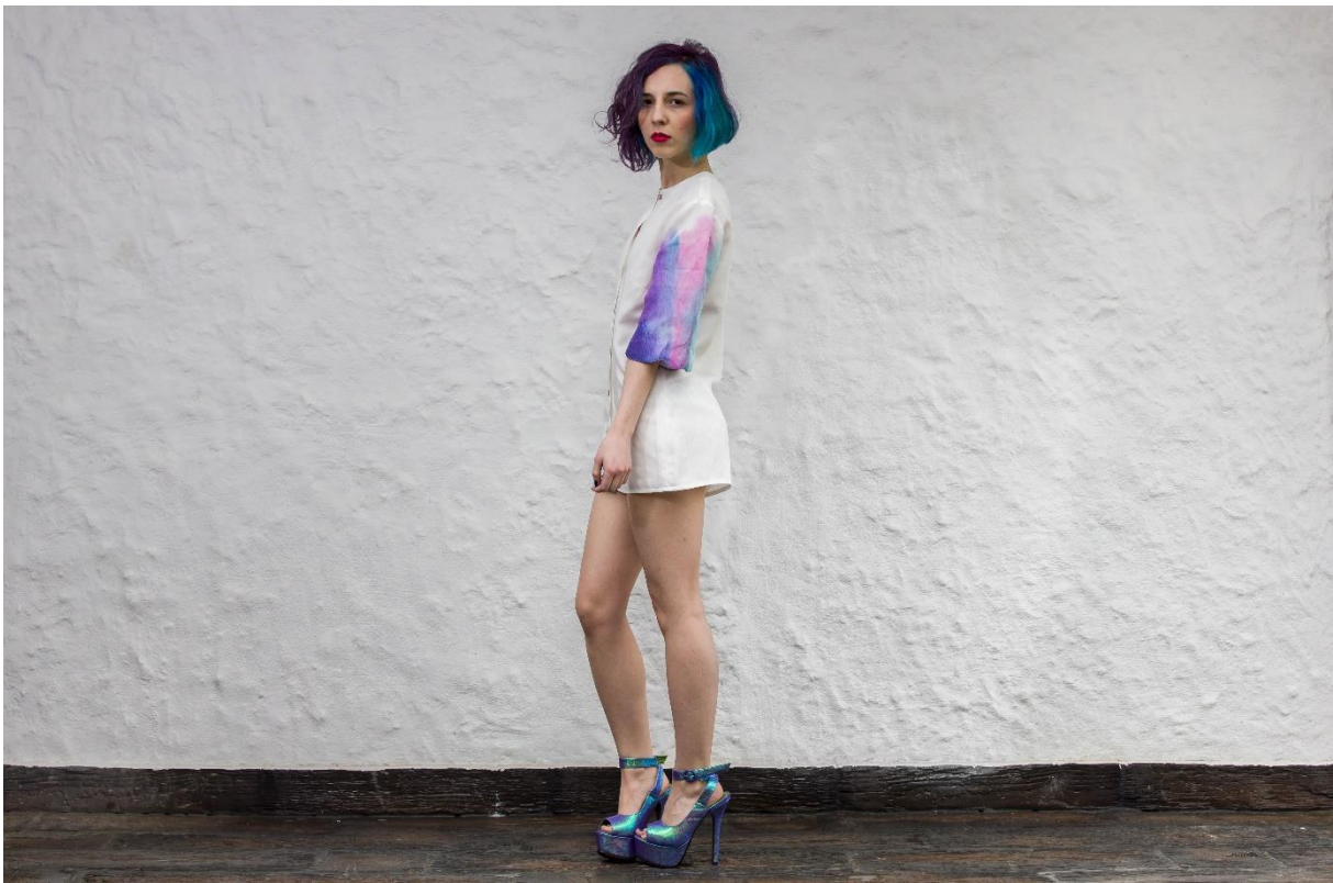
Slika 25: Model 4, profil