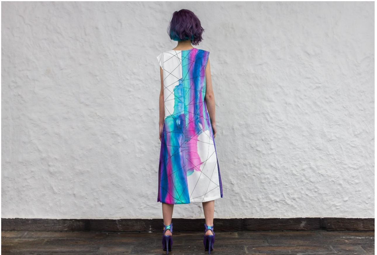
Slika 27: Model 5, iza