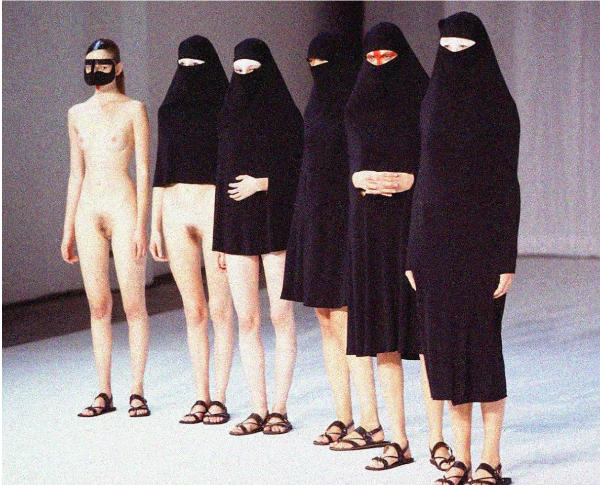
Slika 7: Kolekcija Between

Hussein Chalayan je dizajner koji svojim dizajnom i revijama prikazuje priče. On se izražava konceptualno i to na vrlo napredne načine pomoću tehnologije i vrhunskim stručnim izvedbama odjeće. Chalayan koncepte kojima raspravlja socijalne probleme često povlači iz svojih korijena te na tome gradi ostatak koncepta.