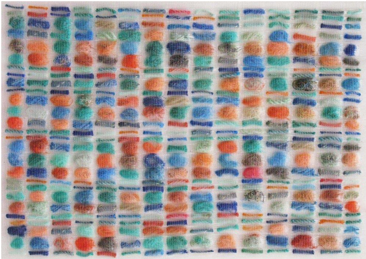
Slika 16: Tekstil tkan od oceanskog otpada