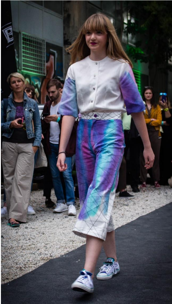
Slika 22: Model 4, naprijed