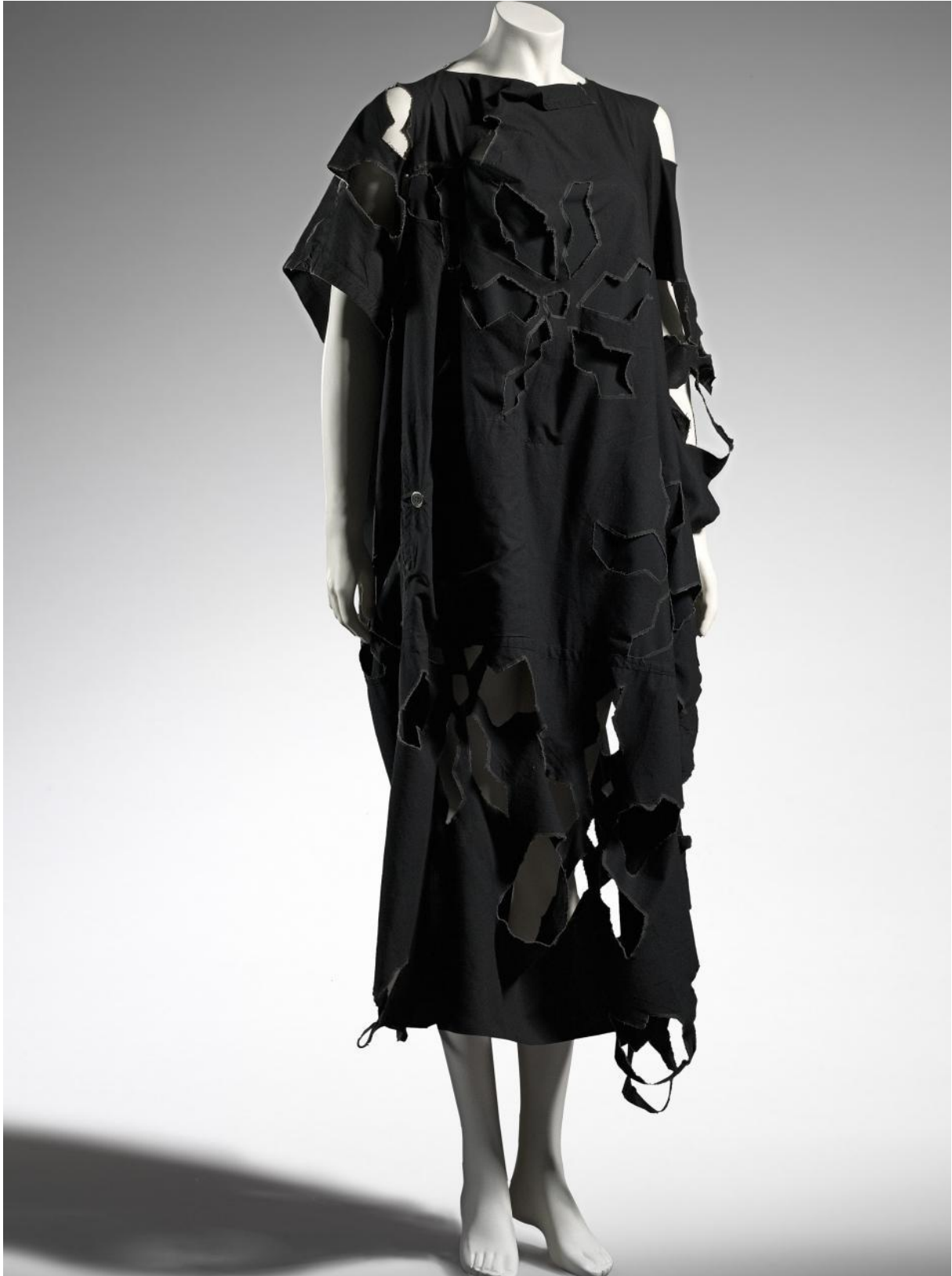
Slika 12: Yohji Yamamoto, primjer dekonstrukcije, 1983.