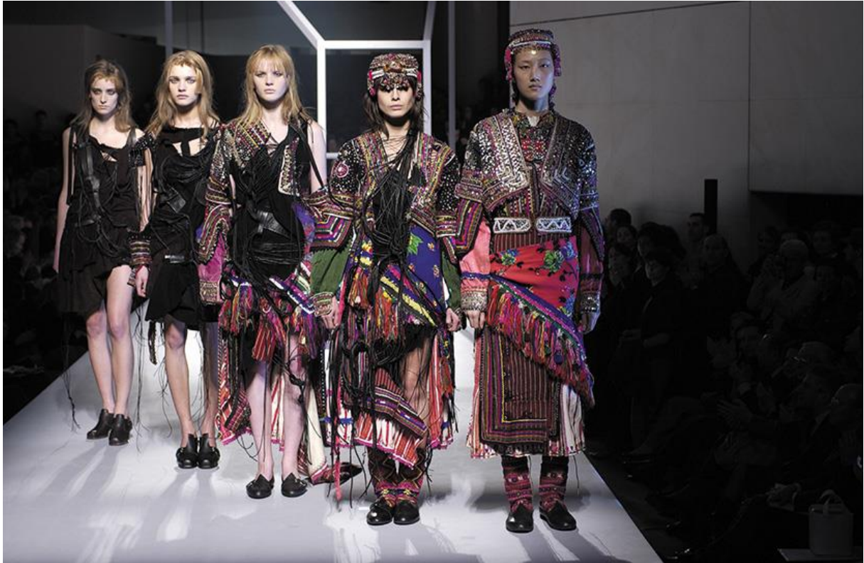
Slika 6: Ambimorphous kolekcija

Between je proljetna kolekcija iz 1998 godine. Revija se sastojala od samo 6 modela čadora koji su bili različitih duljina. Manekenke su išle iz krajnosti gdje su bile u potpunosti odjevene do toga da su bile gole. Čador je odjevni predmet koji prekriva cijelo tijelo i glavu, a lice je jedino otkriveno i tradicionalno ga nose žene muslimanske vjeroispovijesti. Ova je kolekcija kontroverzna jer su neki to shvatili kao kritiku muslimana općenito, ali je Chalayan razjasnio kako ga je inspirirala opresija nad ženama i nedostatak prava na izbor i da nije kritika kulture i tradicije cilj kolekcije. S obzirom na to možemo reći da je ta kolekcija feminističkog aktivističkog karaktera gdje on upozorava na opresiju žena. (Vrencoska,2009:879)