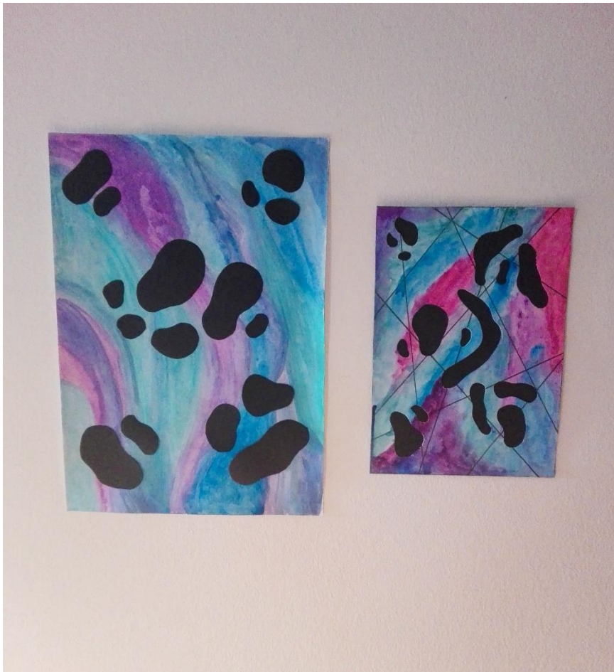
Slika 32: Tekstilni radovi