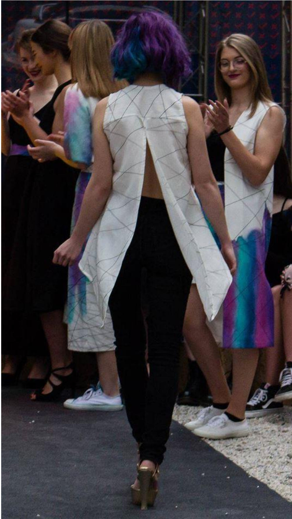
Slika 28: Model 6, iza