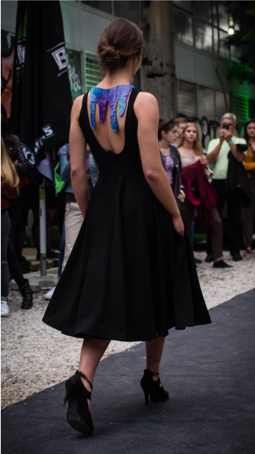
Slika 21: Model 3, iza