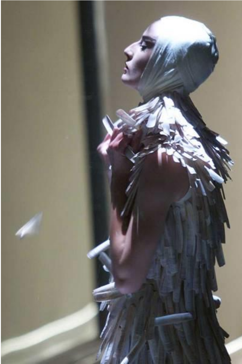
Slika 4: Asylum, haljina od školjaka