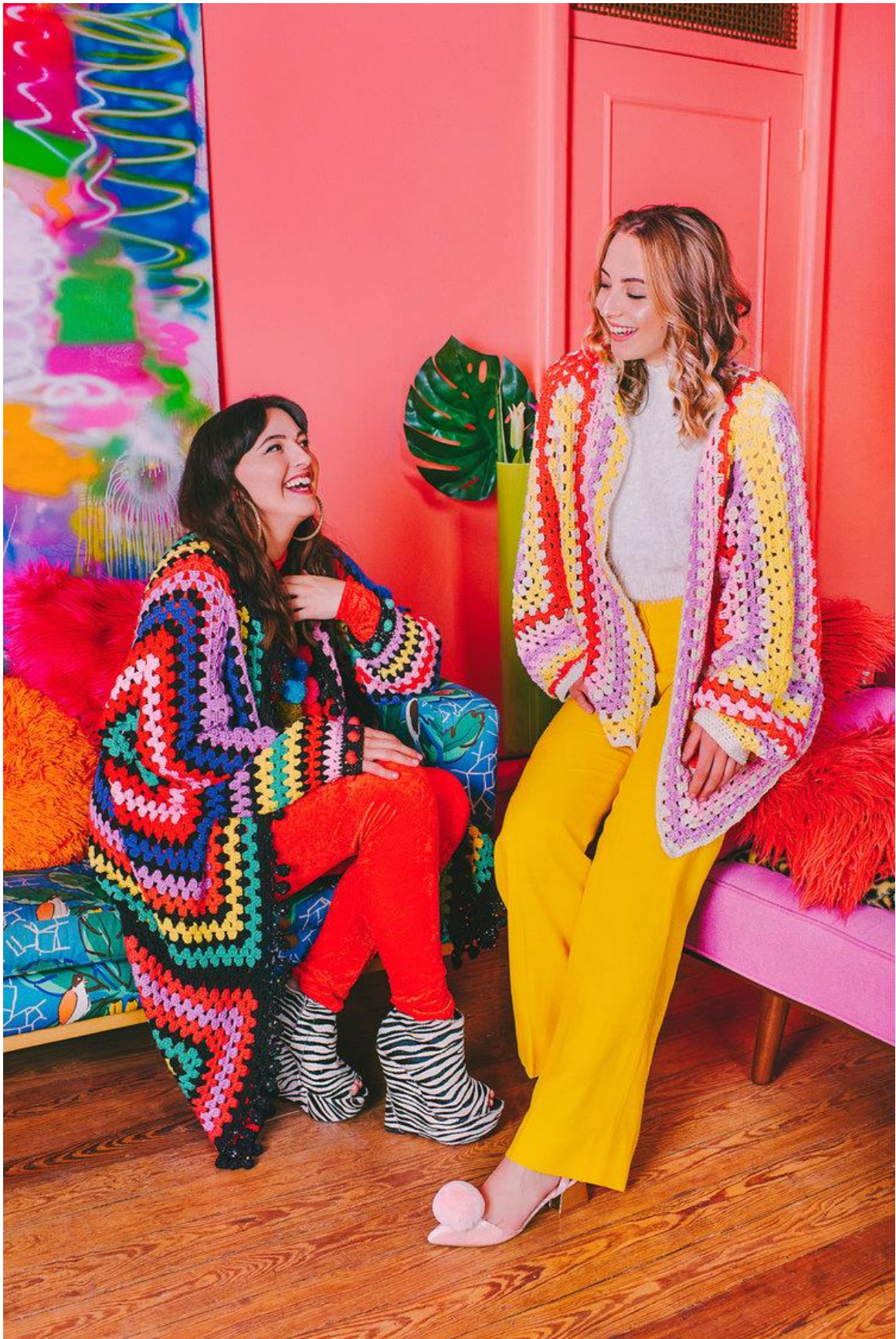
Slika 14: Kolekcija MIY 2018