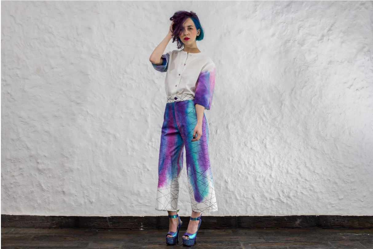
Slika 24: Model 4, naprijed