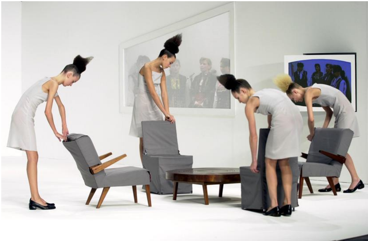
Slika 5: After Words kolekcija, performans

Ambimorphous je isto jesenska kolekcija, ali iz 2002. godine. Za nju ponovno inspiraciju prolazi u svojim korijenima pa je kolekcija prikaz dualnih strana njegovih kultura, turske i britanske. Kolekciju započinje tradicionalnom turskom haljinom te postepeno promjenama u modelima dolazi do klasičnog crnog kaputa koji predstavlja britansku kulturu i opet se vraća na tradicionalnu tursku haljinu. Na jedan poprilično jednostavan način nam prikazuje veliki sraz između tih kultura i prikazuje nam različitost svjetova te nam osim svog unutarnjeg sukoba i težnji za opstankom tradicionalnih elemenata stavlja na promatranje dvije kulture koje su vrlo oprečne i to nas potiče na razmišljanje o općenitoj kulturnoj diferencijaciji zbog koje često dolazi do sukoba, bilo velikih ili manjih proporcija.