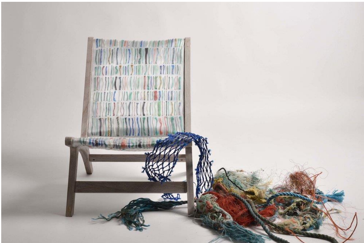
Slika 15: Stolica izrađena od tekstila tkanim s otpadom iz oceana

https://www.materialdriven.com/home/2017/5/12/textile-with-a-message-the-work-of-carmen-machado )