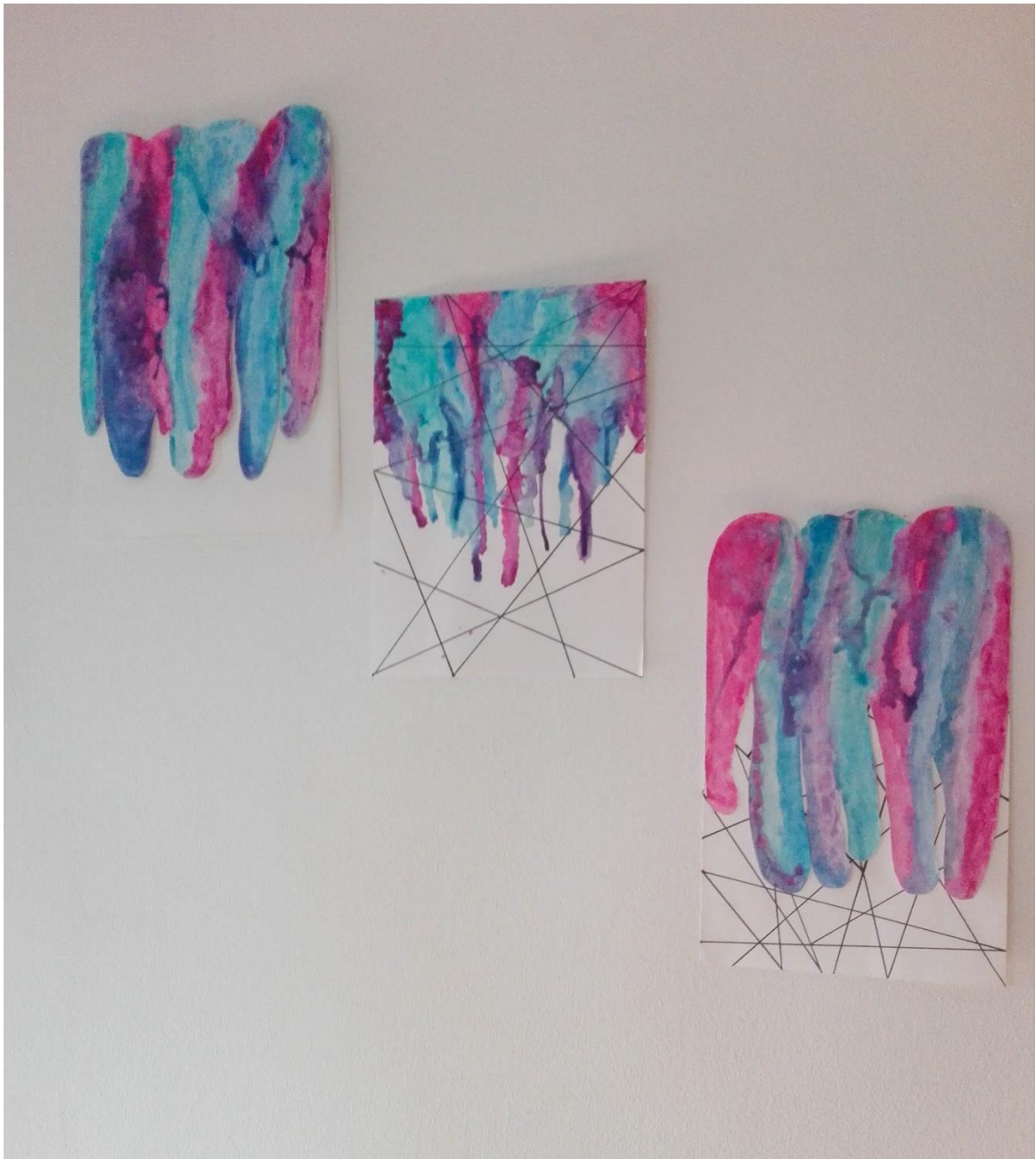
Slika 31: Tekstilni radovi