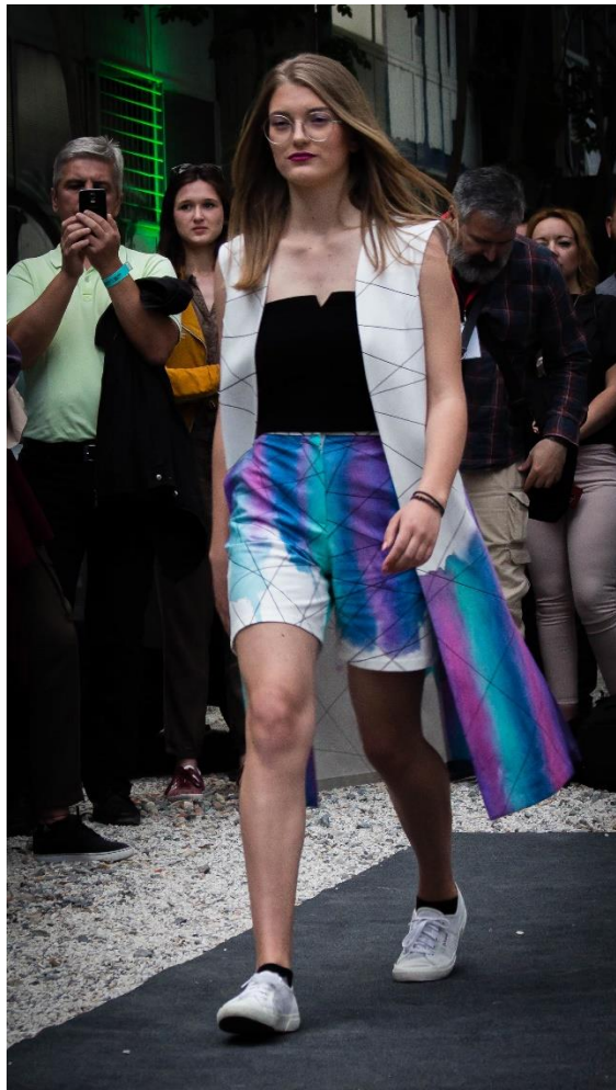
Slika 23: Model 5, naprijed