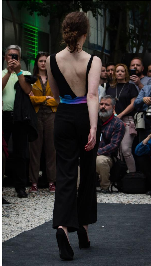
Slika 19: Model 2, iza