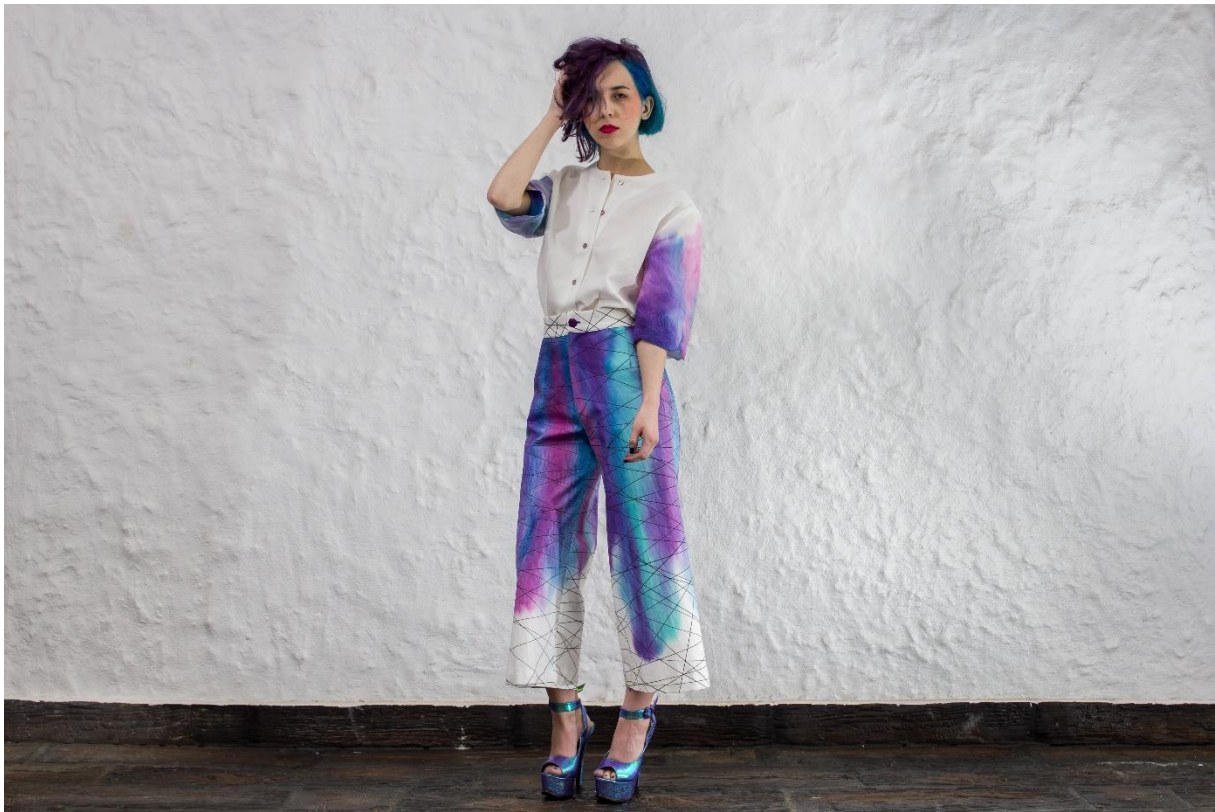
Slika 24: Model 4, naprijed