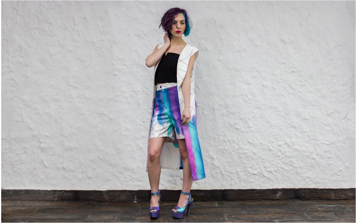
Slika 26: Model 5, naprijed