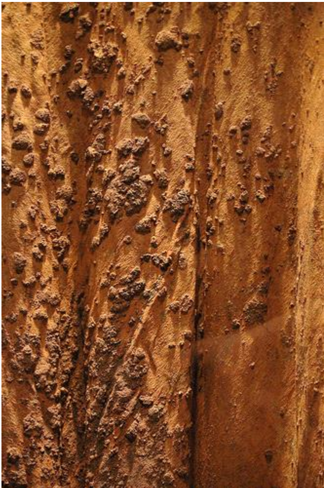
Slika 8: Tekstil iz kolekcije Tangent Flows

Neizostavan element u stvaranju koncepta i prenošenja istog je dizajn tekstila i tretiranje materijala. Tako je Chalayan u svojoj kolekciji Tangent Flows velik naglasak stavio upravo na tekstil. Sve odjevne predmete koji su bili dio kolekcije je zakopao na 6 tjedana ispod zemlje. Odjeća je bila svilena s ušivenim metalnim komponentama. Nakon iskapanja je odjeća bila prekrivena blatom, poderana na mjestima, a metalne komponente su različitim stupnjevima oksidacije svili dale ciglanu boju. (Vrencoska, 2009:873). Time se dobila vrlo zanimljiva teksturalna površina koja je vrlo očito prikazivala propadanje, a istovremeno je stvorio potpuno novi tekstil koji je postao pravi prikaz estetike ružnoće. Destrukcijom materijala je pokazao prolaznost mode i važnost recikliranja te kako lako predmeti mogu poprimiti potpuno novi život i izgled koji postaju lijepi na sebi svojstven način.