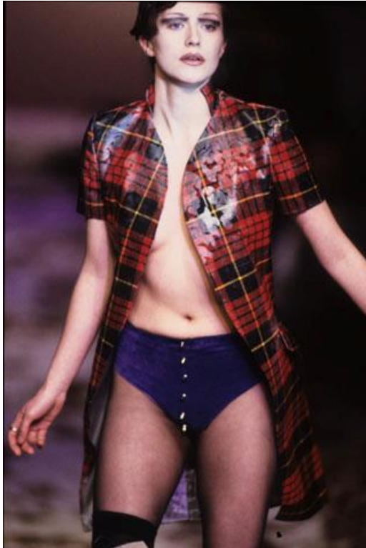
Slika 1: Kolekcija Highland Rape

Asylum je kolekcija iz 2001. godine. Revija je održana unutar staklene kocke u kojoj su bile manekenke i koje nisu vidjele publiku koja je sjedila izvan kocke i vidjela sve što se događa unutar. Ta kocka je predstavljala mentalnu instituciju. Time je postigao prikazati izoliranost od svijeta koju doživljavaju ljudi u psihijatrijskim ustanovama i obasjao je svjetlo na problem tretiranja psihički oboljelih osoba i općenito na mentalne bolesti i to na svoj mračan i groteskan način (Knox, 2010:30).