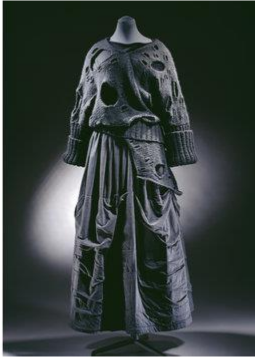
Slika 11: Rei Kawakubo, Commes des Garçons , 1982