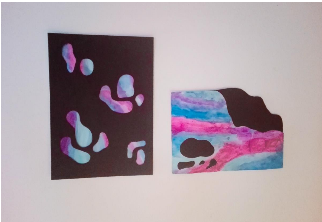
Slika 33: Tekstilni radovi