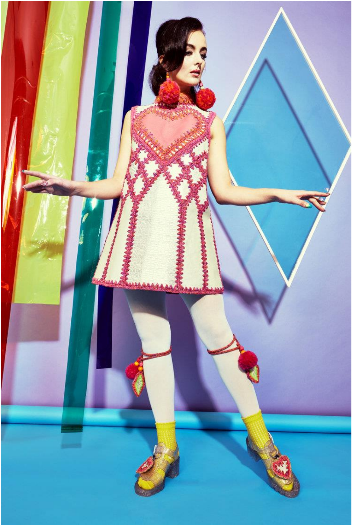
Slika 13: Kolekcija Highland Fling