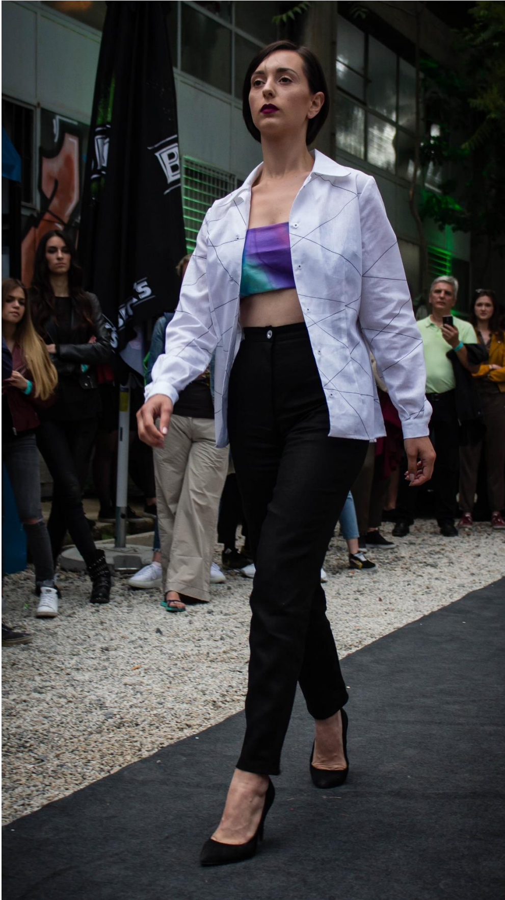
Slika 17:Model 1