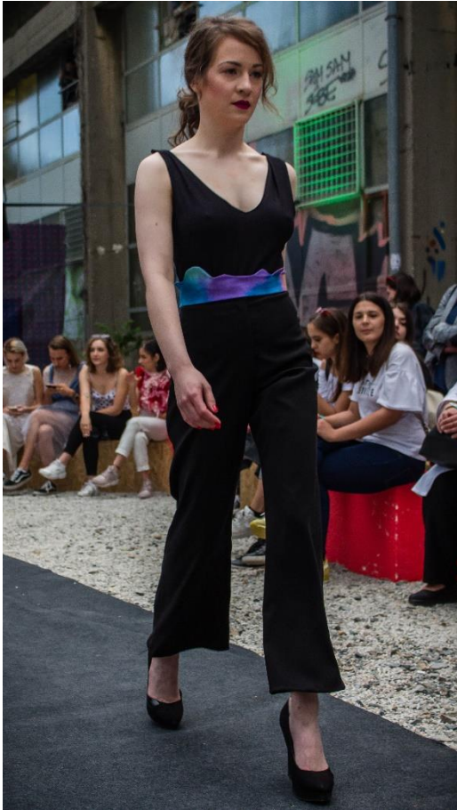
Slika 18: Model 2, naprijed