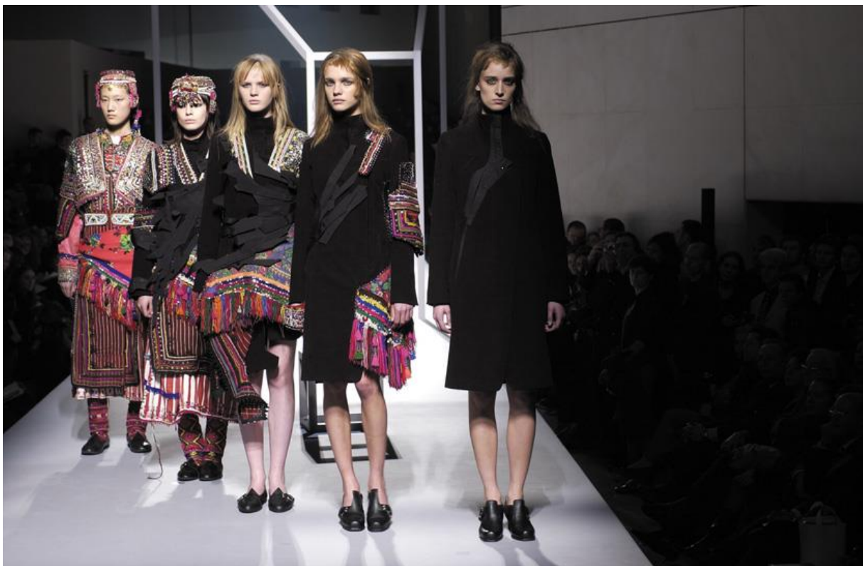
Slika 10: Ambimorphous kolekcija

Najveća razlika između kultura je vidljiva u tekstilima i bojama istih. Tako se za englesku uglavnom koristi crna i deblja tkanina dok su turski tekstili bogati dekorativom i uzorcima. Time je kontrast odmah uočljiv i neizbježan i podjednako se kombinacijom tako oprečnih elemenata naglašavaju obje kulture i tekstili. Dodatno, materijali govore i o samim kulturama, to jest nekim karakternim i obilježjima društva u svakoj, Tako hladni i tamni materijali predstavljaju englesku kulturu koja odgovara hladnoći koju često pripisujemo englezima, a šareni i veseli materijali tursku kulturu. Na njih gledamo kao na temperamente i strastvene ljude.