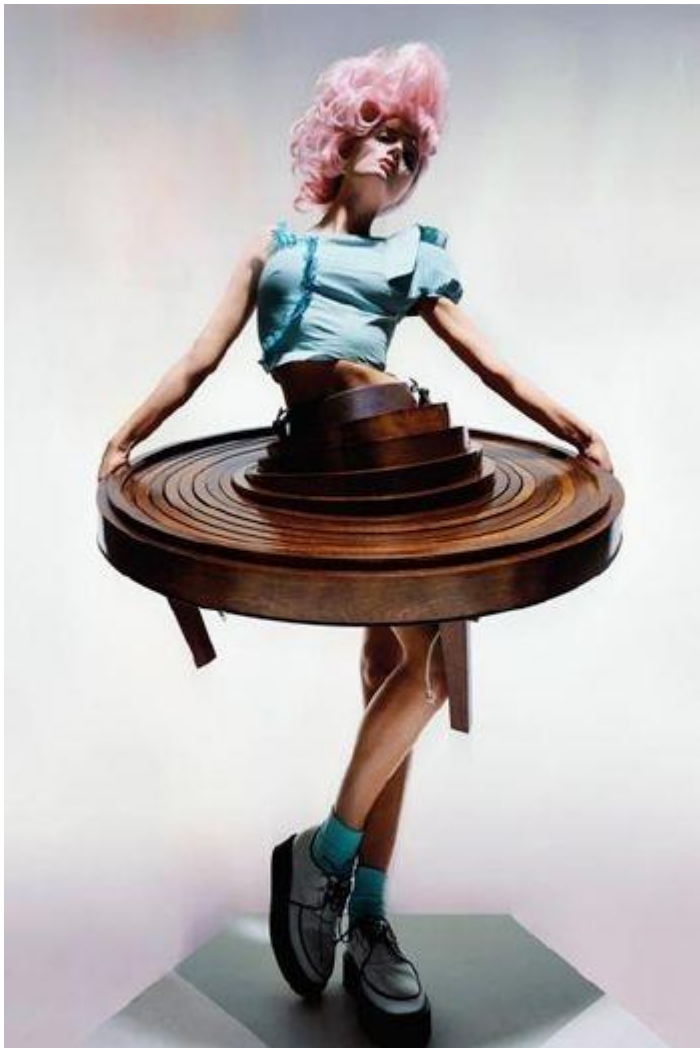
Slika 9: Stol koje se pretvara u suknju, kolekcija After Words

Korištenjem drveta koje je tamno, statično i masivno postiže da se publika jednostavnije uživi u problem i u ono što prikazuje. Težina suknje koju nosi manekenka govori i o težini situacije u kojoj se nalaze ljudi koji stalno mijenjaju životni prostor i za nijedan ne mogu reći da im je dom.