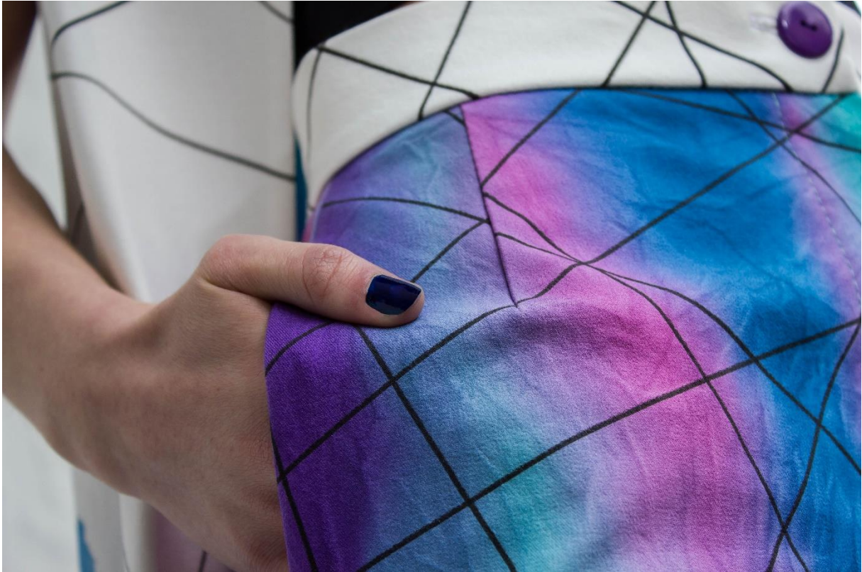
Slika 29: Detalj tekstila