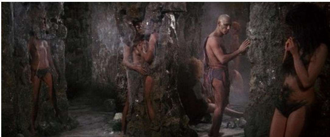
Slika 21: Stanovnici Labirinta, prizor iz filma Barbarella , 1968.

Stanovnici Labirinta prognani su iz Sogoa zbog svoje nedovoljne zloće. Tamo žive u duhovnom i svjetovnom siromaštvu i propadaju. U labirintu vlada sivilo upotpunjeno beskonačnim paukovim mrežama. Stanovnici su tihi, usporeni, plahi likovi bez identiteta; gledatelj tek vidi razliku između muškaraca i žena iako su oni pretežno anonimna bića koja