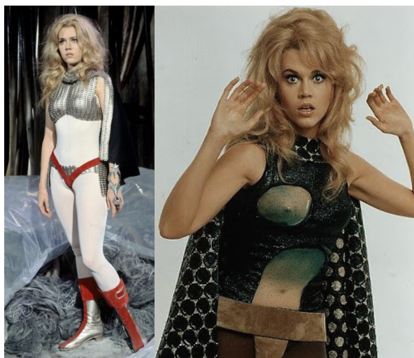
Slike 7 i 8 : Peta (lijevo) i šesta presvlaka (desno)