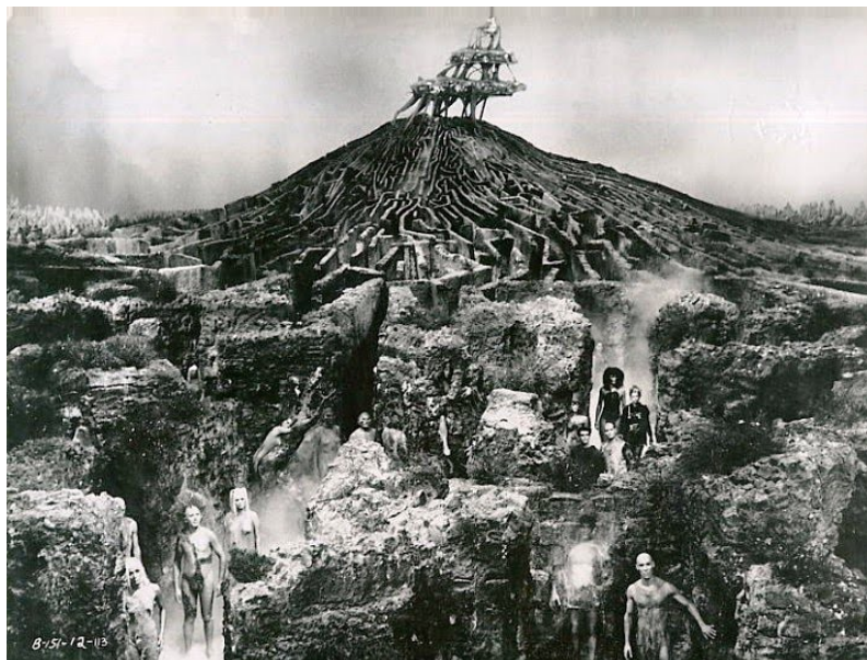
Slika 27: Labirint i grad Sogo, prizor iz filma Barbarella, 1968.

Snježni interijer Planeta 16 sagrađen je od plastike, suhog leda i umjetnog snijega koji je zasigurno najveći adut ovog dijela filma jer svojim realizmom doprinosi vizualnom dojmu scene.