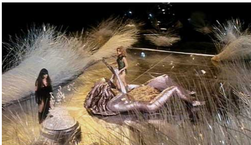
Slika 29: Odaja Snova Crne Kraljice, Barbarella i Crna Kraljica , prizor iz filma Barbarella , 1968.

Unatoč tome što film nastoji vizualizirati daleku budućnosti, interijeri su izrađeni s mnoštvom uzoraka i reljefa karakterističnih za 60-te godine 20.stoljeća. Tako se učestalo pojavljuju krzneni tepisi i zidne obloge, prozirna plastika odnosno pleksiglas, dijelovi od sjajnog aluminija, gumene prozirne cijevi.