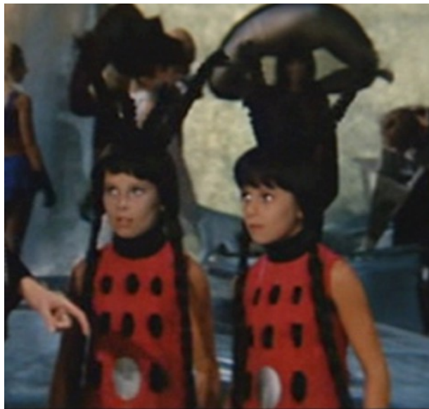
Slika 17: Blizanke Stomoxys i Glossina , prizor iz filma Barbarella , 1968.

Blizanke u svojoj prvoj pojavi djeluju potpuno benigno. Imaju usklađene bijelo – narančaste kostime i kosu u dugačkom bobu sa šiškama. Ni po čemu ne odaju dojam svoje nasilnosti.