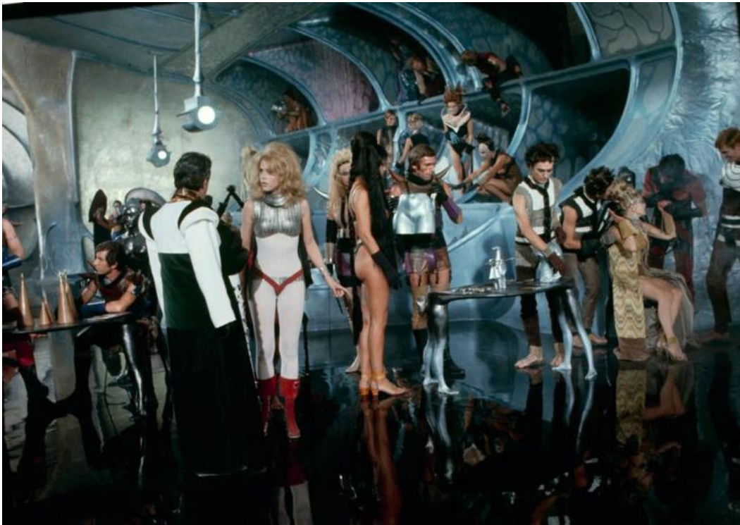
Slika 24: Stanovnici grada Sogo, Barbarella i Durand Durand, prizor iz filma Barbarella , 1968.

Stanovnike Sogoa čini sloj povlaštenih stanovnika. Njihov hedonistički stil života izgrađen je, ponekad i doslovno, na leđima drugih. Oni su vrlo oskudno odjeveni te obuća, frizura i šminka nose značaje 60-ih godina 20. stoljeća. Visoke frizure i niske četvrtaste potpetice, zagasiti, ali napadni uzorci osnovne su karakteristike njihovih kostima. Sve ono što nije prisutno u Labirintu, prisutno je u Sogou – izobilje, razvrat, neumjerenost.