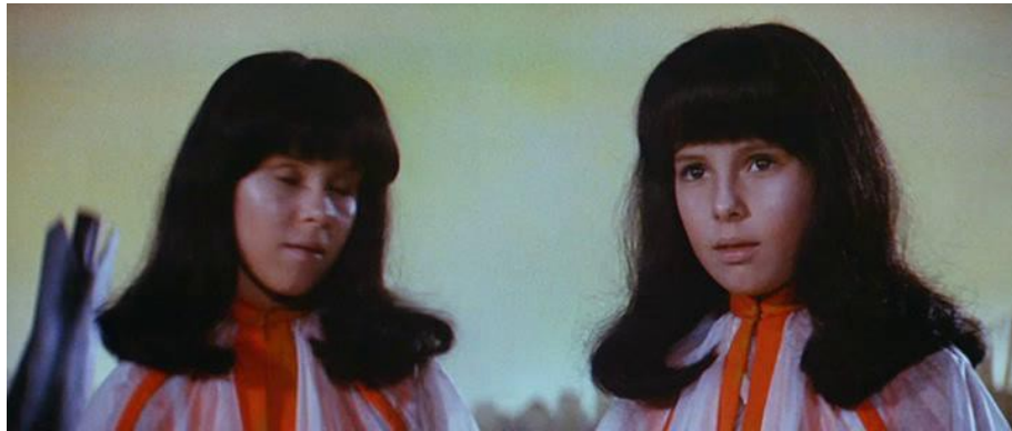
Slika 16: Blizanke Stomoxys i Glossina , prizor iz filma Barbarella , 1968.