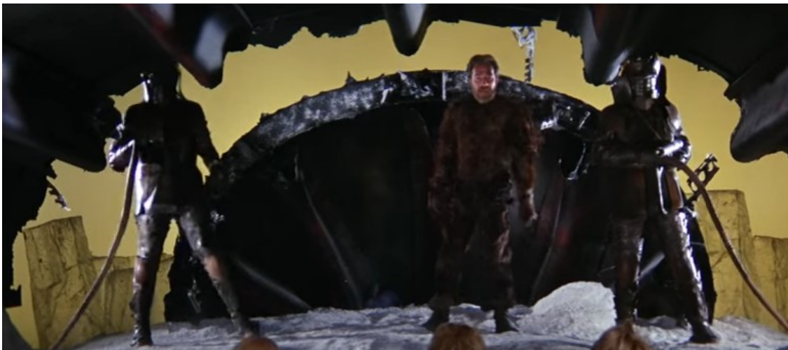
Slika 18: Lovac i stražari, prizor iz filma Barbarella , 1968.

Lovca u filmu tumači Ugo Tognazzi. Dlakavo stvorenje koje spašava Barbarellu iz ralja gladnih lutaka pokazuje se kao jedan od sluga Crne Kraljice. Njegov kostim, jednodijelno odijelo izrađeno od umjetnog smeđeg krzna asocira na tradicionalno zapadnjačko, u ovom slučaju vrlo karikirano, poimanje muževnosti – gusta zdrava kosa, brada, dlakava prsa. Sve na njemu sugerira animalno stoga ne čudi što od Barbarelle traži vođenje ljubavi na staromodan, tjelesni način.