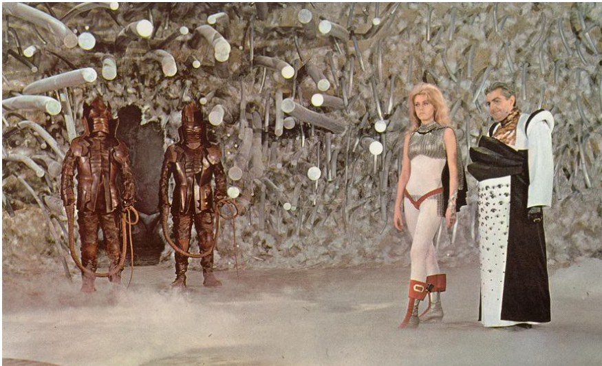
Slika 25: Kožni stražari Velikog Tiranina/ Crne Kraljice, prizor iz filma Barbarella , 1968.

Stražari beskompromisno slušaju naredbe Crne Kraljice. Oni su sazdani samo od kože što se i vidi kada ih Barbarella uništi i otkriva jednu praznu, kožnu ljušturu. Njihovi kostimi podsjećaju na srednjovjekovne viteške oklope i ljušturu žohara sugerirajući pritom na prirodu i svrhu njihova postojanja orijentiranu na obranu i promicanje zla.