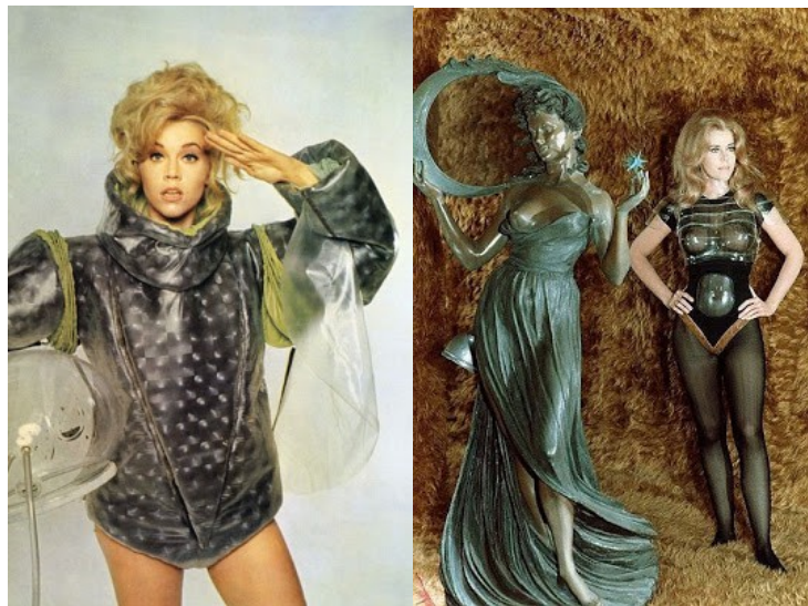
Slike 1 i 2: Barbarellino "astronautsko" odijelo (lijevo) i prva presvlaka na Alpha – 7 (desno)