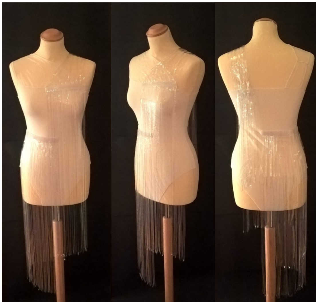
Slika 45: Prototip kostima za lik Barbarelle

Za drugi kostim koristila sam lycru, deltatek, plastične trake, čičak traku. Prema mjerama lutke konstruirala sam kroj i iz bijele lycre iskrojila sam triko. Za vratni izrez postavljen asimetrično preko desnog ramena postavila sam obamitani deltatek na leđima spojem pomoću dvije, od istog materijala, trake. Potom sam spojila čičak traku s nalijepljenim plastičnim prozirnima trakama duljine 75 centimetara za kostim.