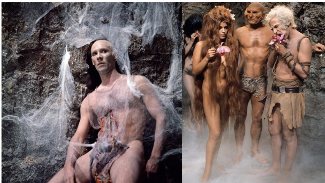
Slike 22 i 23: Stanovnik Labirinta, prizor iz filma Barbarella , 1968.

Kostimi teksturom i bojom asociraju na kamenje, neki stanovnici su u potpunosti goli sa spolnim organima prekrivenim kosom ili komadom materijala što podjeća na ljudsku dlaku ili pak imaju oko struka omotane komade otrcane kože.