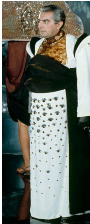
Slika 12: Milo O'Shea kao Durand Durand , fotografija prizora iz filma Barbarella , 1968.

jasne, a kasnije se saznaje da je on zapravo znanstvenik zbog kojeg je Barbarella i krenula u misiju. Ono što ga nikako nije moglo odati cijelo vrijeme bio je upravo njegov izgled; Barbarella je cijelo vrijeme mislila da traga za mladim muškarcem, a dočekao ju je – starac. Lik Durand Duranda zapravo šalje moralnu poruku u doba buđenja sve veće svijesti o tjelesnosti. Naime, zbog svoje zloće Durand Durand naglo je ostario gotovo četvrt stoljeća i, iako je vrlo karizmatičan i markantan, Barbarella je očekivala "nešto mlađe".