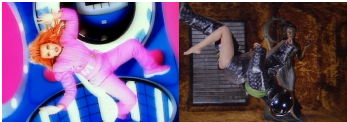
Slike 30 i 31 : videospot za pjesmu Put yourself in my place , Kylie Minogue, 1994. i prizor iz filma Barbarella , 1968.

Pjevačici Kylie Minogue prva scena filma u kojoj se Jane Fonda razodijeva u bestežinskom stanju poslužila je kao inspiracija za videospot pjesme Put yourself in my place iz 1994.godine 9 .