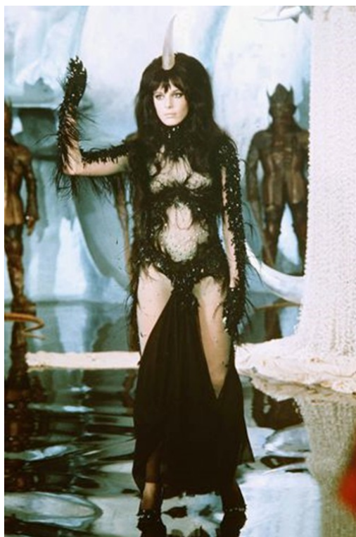
Slika 15: Crna Kraljica/Veliki Tiranin , prizor iz filma Barbarella , 1968.

Kostimi Crne Kraljice u filmu bojom sugeriraju o kome je riječ, svi su u tamnim, pretežno crnim tonalitetima s naglaskom na siluetu ženskog tijela. U svoje tri presvlake, Kraljica kompletno mijenja svoj izgled, odjeću, obuću pa čak i duljinu kose. Njezini kostimi snažno akcentiraju prsa i trbuh. Baš kao što priliči jednoj kraljici, ona mora biti reprezentativni primjerak. Tijelo je potpuno afirmirano, a sve točke koje se smatraju najizazovnijim atributima ženskog tijela (simbolima seksualnosti i plodnosti – prsa, trbuh) naglašene su, iako vrlo suptilnim, koloritom ili su otkrivene.