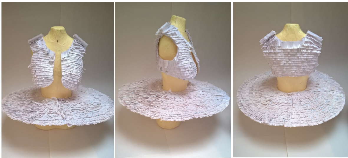
Slika 43: Prototip kostima za lik Barbarelle

Za prvi kostim s pačkom koristila sam papir, karton, akvarel i ljepilo.