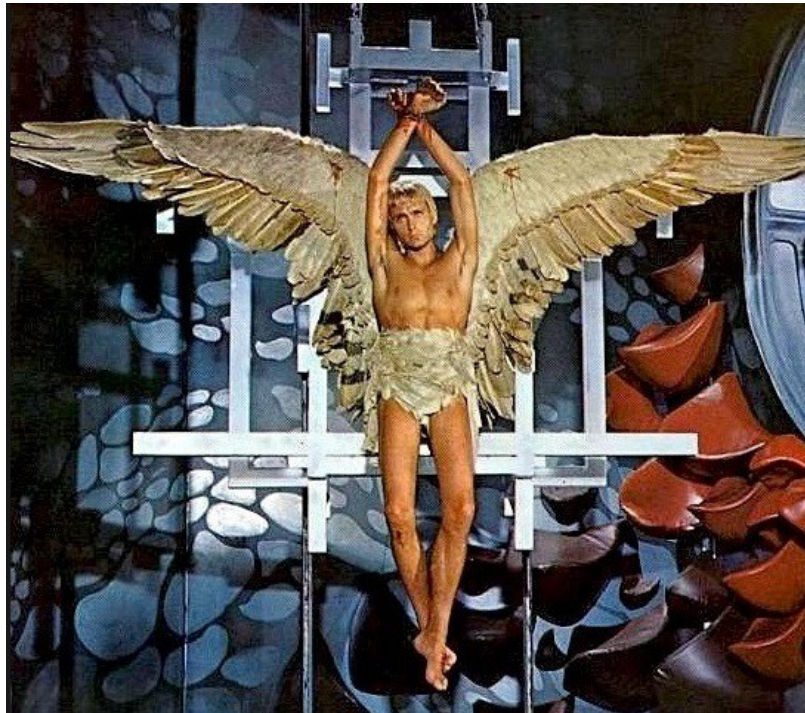
Slika 13: Pygar , prizor iz filma Barbarella , 1968.

Pygar je anđeo i muškarac, lišen vida, ali ne i slabosti na žensku privlačnost. Iako odbija udvaranje Crne Kraljice i njezinu ponudu za spolni odnos govoreći da "anđeo ne vodi ljubav, on je ljubav", potvrđuje svoju ljudsku stranu u zadnjoj sceni kada spašava Velikog Tiranina, a na Barbarellino pitanje zašto ju je spasio odgovara da "anđeo nema sjećanje". Time sugerira da se on uopće ne sjeća da je Crna Kraljica negativka čemu sigurno pomaže i činjenica da je Crna Kraljica kojoj je Pygar vrlo privlačan i obratno. Naposljetku, njihov odnos je u izvrsnoj ravnoteži, on je ultimativno dobro, a ona zlo; njih dvoje djeluju poput ying-yanga.