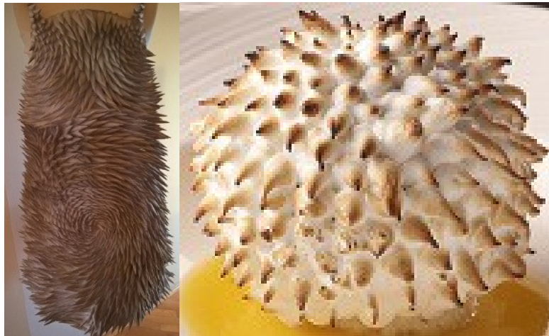
Slike 39 i 40: Prepečena Aljaska (lijevo) i Pečena Aljaska /Baked Alaska (desno)

Kao inspiracija za ovaj rad nisu poslužili samo film i balet. Jednostavni i dostupni materijali koji se neprestano iznova mogu koristiti zaintrigirali su me kroz rad na temu reciklaže predstavljen na skupnoj izložbi studenata u prosincu 2015. godine u galeriji Karas 43 . Koristeći već korišten papir i ljepilo izrađeno od brašna i vode izradila sam haljinu pod nazivom Prepečena Aljaska (originalni naziv: Baked Alaska ). Naziv je dobila po desertu koji je specifičan po svojim bijelim ispupčenim vrhovima od istučenog bjelanjka sa šećerom, takozvanog šauma, preko kojeg se naknadno prelazi brenerom kako bi se postigla zlaćana boja vrhova. Zadatak sam smatrala izuzetno poticajnim, zabavnim i opuštajućim, a kroz rad s papirom još sam više produbila svoju fascinaciju tim materijalom. Do gradivnih elemenata došla sam dekonstrukcijom božićnog ukrasa i ponovnim slaganjem u razne formacije dok nisam postigla željenu teksturu. Taj način rada vrlo je ekonomičan jer je ljepilo moguće kuhati doma, a papir je već ranije upotrebljavan i korišten. Osim toga, papirom je moguće postići razne efekte i teksture poput mekanog perja do šiljastih čvrstih vrhova.