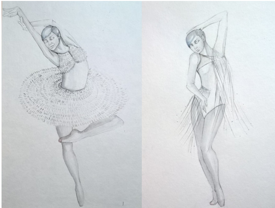
Slike 37 i 38 : Skice za kostim Barbarelle

Barbarellu sam odlučila obrađivati kao lik ne zbog toga što je glavni lik filma, nego zbog toga što je ona lik koji se kroz film izražava vrlo kratkim, sažetim rečenicama bez nekog bitnog sadržaja. Iz tog razloga sva pažnja upućena je na njezinu gestikulaciju i mimiku te senzualne, vrlo naglašene pokrete tijela. Njezine karakteristike čine ju pogodnim likom za teleportaciju s filmskog ekrana na kazališnu pozornicu i u plesne papučice. Vedrina i vrcavost dio su njezine prirode, a smatram da bi se dobro uklopile u jedan takav baletni koncept. Snaga i ženstvenost njezine pojave potaknule su me da za njezina prva dva kostima odaberem nešto luckasto i lepršavo. Prvi kostim oslanja se na klasičnu baletnu tradiciju u kojoj balerina pleše u prepoznatljivoj pački. U tom kostimu spojila sam pačku s papirom. Naravno, radi se o prototipu, no kostim je u suštini nosiv i funkcionalan. On je u osnovi triko koji skidanjem prsluka i pačke postaje osnova za idući kostim. Dodajući mu ponovno resice transformira se u kičasti kostim koji pokretom postaje dinamična cjelina. Taj kostim više je inspiriran siluetom koja prevladava u filmu; kostim prati linije tijela, a asimetrično pozicionirane resice naglašavaju ženstvenost tijela ističući krivinu struka i prsa. Prozirnost resica dobro surađuje s pokretom, a osim toga, odgovara i toj estetici kiča. Zamislila sam da Barbarella nema klasičnu baletnu punđu ili bujnu kosu kao u filmu. Smatram da ide u prilog današnjem poimanju žene