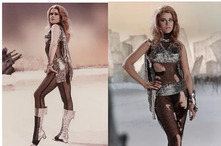
Slike 3 i 4: Druga presvlaka na Planetu 16 (lijevo) i kostim nakon napada lutaka (desno)

6 Kali Yuga (IDoba Kali, također poznato kao Željezno doba) je jedno od četiri stadija razvoja kroz koje svijet, prema hinduističkim spisima, prolazi u ciklusu Yuga. Ostale Yuge su Dwapara Yuga, Treta Yuga i Satya Yuga. Prema Suryi Siddhanti, astronomskom traktatu koji čini temelj za sve hindu i budističke kalendare, Kali Yuga je počela u ponoć 18.2. 3102. p.n.e. u julijanskom kalendaru ili 23.1. 3102. p.n.e. u gregorijanskom kalendaru što mnogi hindusi također smatraju trenutkom kada je Krišna napustio svoje tijelo (prema hindu vjerovanjima avatari ne umiru) https://sh.wikipedia.org/wiki/Kali_Yuga 11.11.2016.