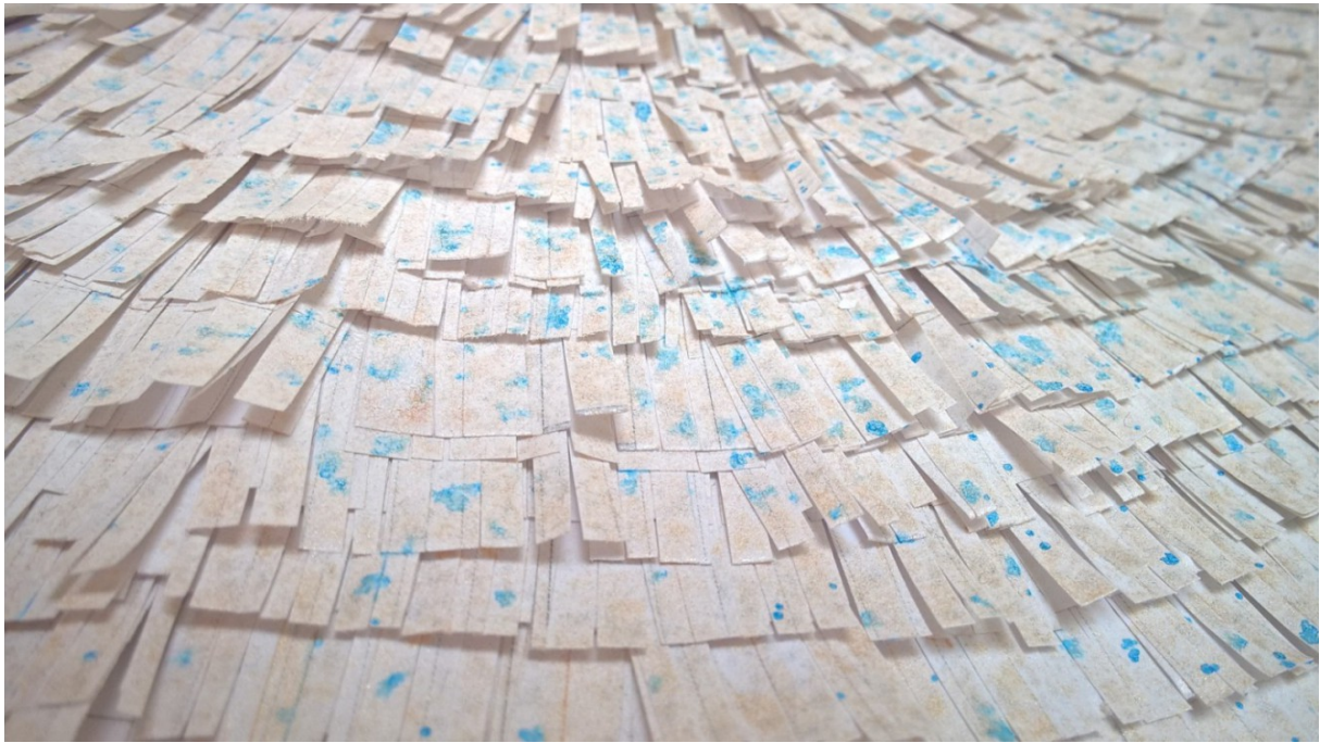
Slika 44: Detalj kostima

žutice, na mašini spojila ušitke i prednje sa stražnjim dijelovima te sve uredno izglacala glačalom na paru. Potom sam lutku oblijepila u prozirnu prijanjajuću foliju kako bih ju zaštitila od ljepila. Na nju sam stavila sašiveni gornji dio i pribadačama ga dodatno učvrstila na lutki. Nanijela sam dva sloja ljepila čekajući između slojeva 30 do 60 minuta, ovisno o vlažnosti zraka, da se osuši. Na svaki sloj nanijela sam i sloj papira kako bih osigurala što veću čvrstoću i što pravilnije plohe za daljnji rad. Za kaširanje sam koristila univerzalno ljepilo za drvo. Nakon toga uslijedila je priprema resica koje sam izradila od iskorištenih papira za printanje A4 veličine. Nakon pripreme resica lijepila sam ih na gornji dio kostima.