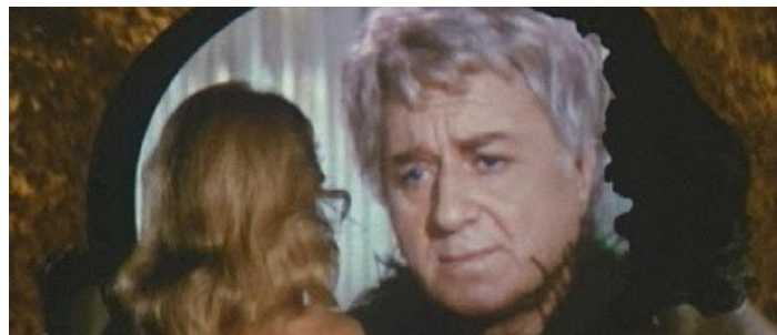
Slika 26: Claude Dauphin kao Predsjednik Zemlje , prizor iz filma Barbarella , 1968.

Ulogu Predsjednika koji se u filmu pojavljuje vrlo kratko tumači Claude Dauphin. On se pojavljuje u prvoj sceni kada preko videopoziva moli Barbarellu za pomoć pri nalasku Durand Duranda. Nimalo smeten, ali vidno svjestan prisustva mlade, lijepe i u potpunosti gole žene, on Barbarelli objašnjava misiju. Budućnost je takva da je golo tijelo u potpunosti prihvaćeno pa čak i u prisustvu osobe od visoke važnosti kao što je to Predsjednik Zemlje.