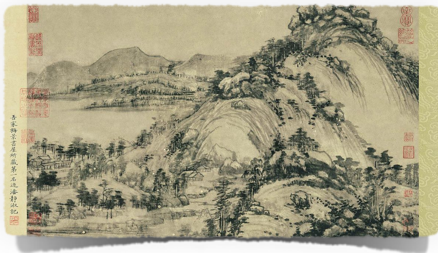
SI.3. Dwelling in the Fuchun mountains, Huang Gongwang