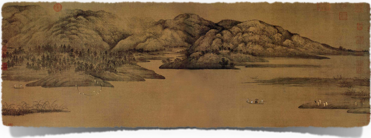
Sl.2. Xiao and Xiang Rivers, najpoznatije djelo iz shui mo perioda, kineskog slikara Dong Yuana

htjeli oprobati u likovnoj umjetnosti. Ove slike su služile u dekorativne svrhe carskih odaja i njihovi tvorci su se smatrali akademskim slikarima, profesionalcima, što je označavalo da se ovi umjetnici profesionalno bave slikanjem, imaju svoje stalne mušterije u visokim društvenim krugovima (najčešće pripadnike kineske aristokracije) i njihova slikarska djela su im glavni izvor zarade za život. Njihove slike su bile izrazito skupe i nije ih svako mogao priuštiti, bile su jedan od sigurnih pokazatelja da vlasnik pripada visokom društvenom staležu. Ovaj stil je izričito precizan i pedantan, nastoji preslikati predmete iz prirode što je vjernije moguće, zahtjevao je puno strpljenja i rada na detaljima i slike su često rađene na najfinijoj svili. Nerijetko se ovaj slikarski pravac nazivao i 'dvorskim stilom'.