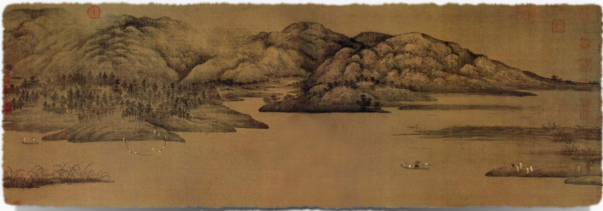
Sl.2. Xiao and Xiang Rivers, najpoznatije djelo iz shui mo perioda, kineskog slikara Dong Yuana

htjeli oprobati u likovnoj umjetnosti. Ove slike su služile u dekorativne svrhe carskih odaja i njihovi tvorci su se smatrali akademskim slikarima, profesionalcima, što je označavalo da se ovi umjetnici profesionalno bave slikanjem, imaju svoje stalne mušterije u visokim društvenim krugovima (najčešće pripadnike kineske aristokracije) i njihova slikarska djela su im glavni izvor zarade za život. Njihove slike su bile izrazito skupe i nije ih svako mogao priuštiti, bile su jedan od sigurnih pokazatelja da vlasnik pripada visokom društvenom staležu. Ovaj stil je izričito precizan i pedantan, nastoji preslikati predmete iz prirode što je vjernije moguće, zahtjevao je puno strpljenja i rada na detaljima i slike su često rađene na najfinijoj svili. Nerijetko se ovaj slikarski pravac nazivao i 'dvorskim stilom'.