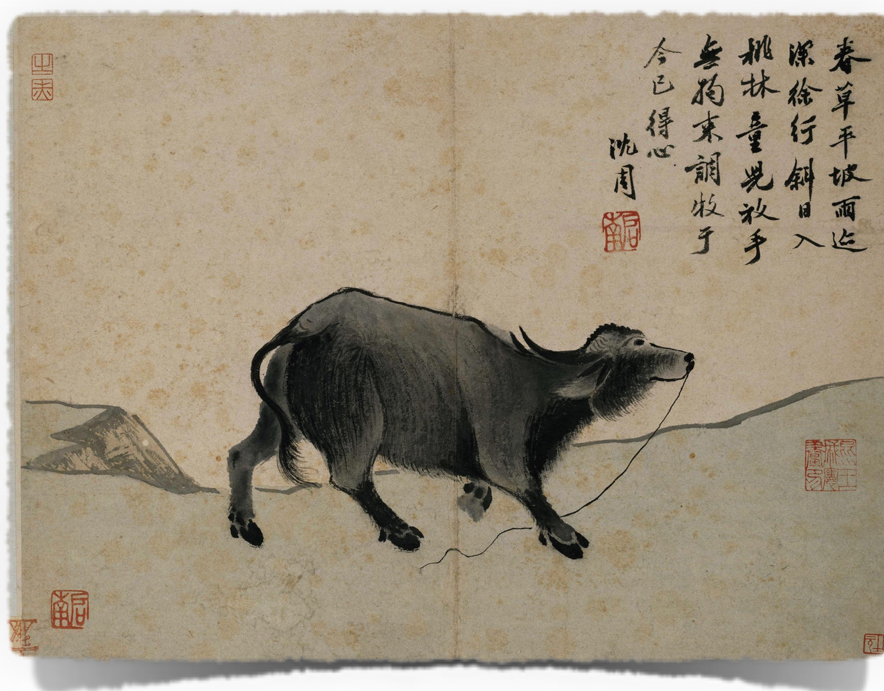
Sl.5. Stranica iz dijela 'Dreaming of Traveling While in Bed', Shen Zhou

Shen Zhou je pripadao literati umjetnicima iz perioda Ming dinastije. Iako je također poznat po pejzažima, njegov rad je upamćen i po upečatljivim prikazima životinja, voća i cvijeća. Bio je osnivač Wu škole čiji su se članovi fokusirali na personaliziranje svojih slika kroz dodavanje tekstova koji bi opisivali osjećaje i misli autora u trenutku slikanja. U narednim godinama ova karakteristika je postala uobičajena za literati slikare.