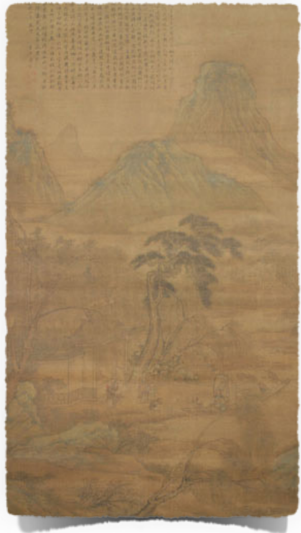
Sl.6. The Return Home of Tao Qian, Tang Yin

ispit (kasnije je dokazana njegova nevinost u ovom slučaju i da je najvjerojatnije bio žrtva političkih spletki svojih neprijatelja). Ali ova iskustva i kontroverzni momenti koji su im doprinjeli rezultirali su novim i neistraženim formama izražavanja u literati slikarstvu. Tang Yin je prvi kineski slikar koji je u svojim djelima uključio poeziju daleko mračnije i negativnije tematike od one viđene kod njegovih prethodnika. Teme ljubomore, pohlepe, zavisti i zla ispreplitale su se kroz njegove tekstove koji bi ponekad i počeli vedrijim tonom ali bi se uvijek završili tragično i tužno. Njegove literati slike su vizualno bile prilično slične ostalim učiteljima Ming dinastije i pratile su formu i vizualni sadržaj shui mo pravca, ali opisi poput stihova koji pišu o oslikanom bambusu ali se fokusiraju na mračne sijenke koje bambus ostavlja na tlu iza sebe su slikama ovog umjetnika dale novo, pamtljivo ruho. Njegova najpoznatija slika je The Return Home of Tao Qian (slika 6).