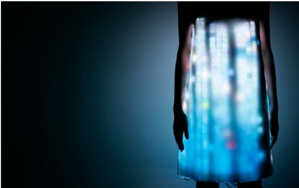
Slika 7) Hussein Chalayan, Led Dress, kolekcija Airborne A/W 2007.

Materijalni i virtualni svijet međusobno su isprepletene društvene realnosti koje koegzistiraju simultano i preko zajedničke mreže. Proučavajući njihove odnose, u mogućnosti smo razumjeti načine na koji je suvremeni svijet mode transformiran, unaprijeđen i reproduciran u prostoru i vremenu. Internet nam je otvorio nove potrošačke prostore mode, fluidnosti, apsolutne imerzije i interakcije. Novi su prostori mode, ističe Crewe, prenosivi, konstantno nas prate, te putuju s nama kroz svijet i vrijeme. Novi način bivanja u prostoru, odsutnost je fizičke prisutnosti kao naše druge prirode. Sudar virtualnosti i materijalnosti modnog svijeta podrazumijeva šire promišljanje o budućoj ulozi proizvodnje, potrošnje, znanja, zakona tržišta i samog pojma mode uopće. (Crewe, 2013:760)