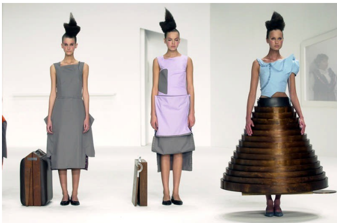
Slika 10 i 11) Hussein Chalayan Afterwords kolekcija, Autumn/Winter, 2000. Final