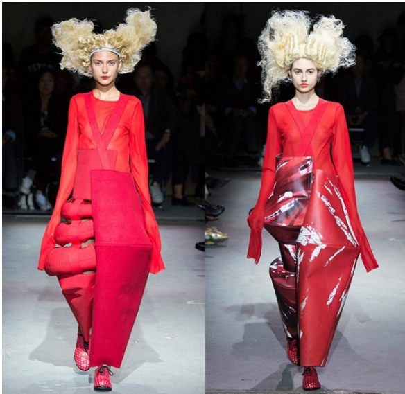
Slika 4) Rei Kawakubo, Comme des Garçons Spring, Ready-to-Wear Collection, 2015.

„Naša su tijela rođena da se kreću, ujedno dišemo i svakodnevno iskušavamo svijet krećući se kroz nj. Organizacija teatra, gdje su gledatelji posjednuti i miruju u svom percepcijskom doživljaju pokreta, nadasve je neprirodna, iako se kroz vlastitu povijest i različite kulture mijenjala i razlikovala. Danas, u novom stoljeću kad su digitalne tehnologije preuzele svaki dio našeg života, pitanje prostora i pokreta, ključna je problematika suvremenih dizajnera i arhitekata, a glavni cilj konstruiranje novih prenosivih i pokretnih svjetova.“ (Birringer, 2009:2)