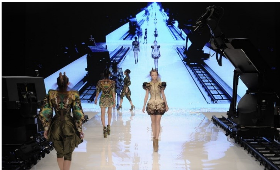
Slika 3) Alexander McQueen, Platos Atlantis, S/S 2010.