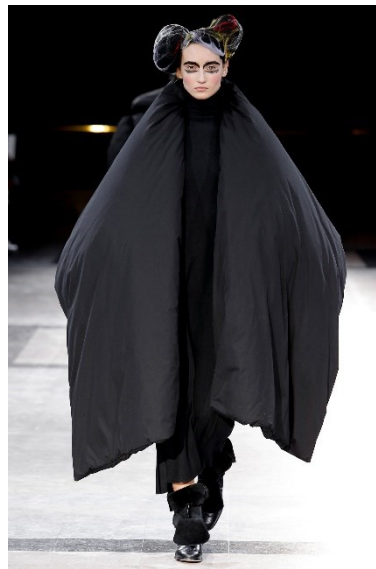
Slika 5) Yohji Yamamoto, Ready to wear, Paris, Fall/Winter, 2014.

Linea Bagander kroz svoj rad „ Body (Dress), Space (Room) “, kroz tjelesno iskustvo pokreta i performativnosti tijela, istražuje razlike između arhitekture i odjeće koji obavijaju naše svakodnevno tijela, ali gledajući ih zajedno na scenografskoj pozornici suvremenog teatra spektakla, u mogućnosti smo vidjeti mnoge njihove sličnosti. Oboje gledamo kao okvire koji organiziraju neku vrstu prostora, te su oboje usko vezani uz tijelo i performativnost. Promatrajući tradicionalne granice tijela, o odjeći većinom govorimo kao o drugoj koži tijela, a arhitektura dolazi kao treća. Razlika je tih dviju koža, arhitektonskih prostora kao prostora tijela u pokretu, i odjeće kao prostora koji nosimo sa sobom. S obzirom da se tehnologija sve