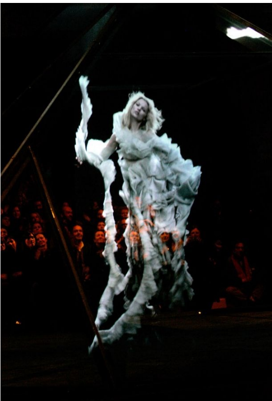
Slika12) Kate Moss Hologram

Imamo se pravo zapitati što ova potraga za brzinom znači za našu percepciju vremena ali i prostora. Marta Colpani, u svom djelu „ New Media Shaping of Perception of Space and Perception of the Body “, istražuje odnos sverastućeg novomedijskog carstva i njegov utjecaj na prostornu i tjelesnu percepciju, ovu suvremenu žudnju za brzinom povezuje s ekstremnim pokušajima i željom za ostajanjem i zadržavanjem sadašnjosti, prisutnosti i prisutnosti. Ta digitalna, virtualna prisutnost, izolira nas od prostora i vremena koordinirane stvarnosti i povlači nas u vrtlog povratnih sprega, odgovora, mreža koje nas tjeraju da zaboravimo stvarno vrijeme i stvarni prostor, naše susjede, kolege i živi okoliš. Mi se ne osjećamo odvojeni od stvarnog prostora/vremena, jer nismo tijelo koje koristi nebiološke alate. Štoviše osjećamo se produženi, poboljšani, jer smo umovi prosuti preko biološkog i nebiološkog tijela, umreženi s ostalim tijelima koja su također dio istog ekosistema. (Colpani, 2010:40) Ono što još osjećamo kao svakodnevno utjelovljenje samo je aktualizacija ispreplitanja senzornih i perceptivnih virtualnosti, konkretiziran kroz određeni vremenski period i vrijeme u navike i prepoznatljiv obrazac. (Colpani, 2010:22-23)