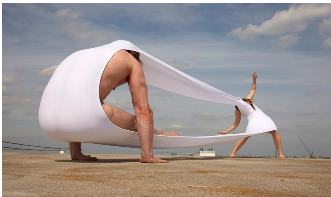
Slika 2) Hussein Chalayan, Gravity Fatigue, Elastic Bodies Section, 2015.

U našoj svakodnevnoj interakciji sa svijetom, neophodno je konstituiranje odnosa spram drugih, bili da su oni stvari ili tjelesni entiteti poput nas. Štoviše, sami sebe postajemo svjesni tek u odnosu spram percepcije drugoga, a moda je nepobitno upravo takva vrsta raspršenog prostora, koja nam je to u mogućnosti i pružiti. Tradicionalna uloga onoga koji se lijepo odijeva uvijek se interpretira spram drugoga koji tek u tom odnosu zadobiva ili dekonstruira vlastitu poziciju u društvu i svijetu.