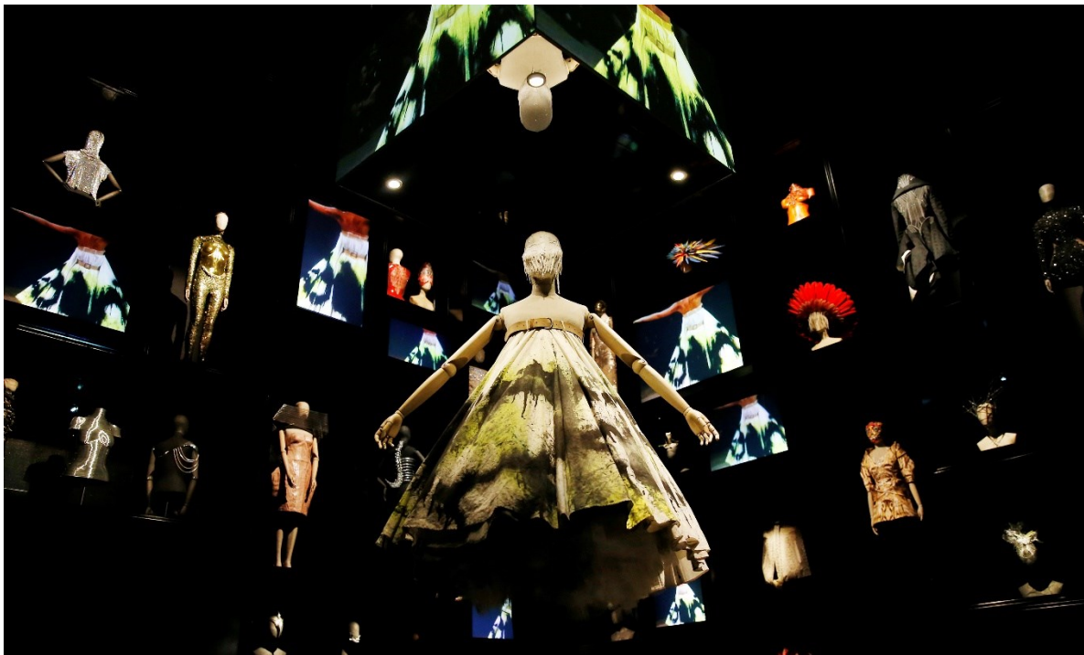
Slika 1) Alexander McQueen, Savage Beauty, V&A Museum, 2015.

Tijelo, onakvo kakvo ono uistinu jest, ne kao stvar u objektivnom prostoru, već tijelo kao sistem mogućih akcija, jedno virtualno tijelo čije je fenomenalno mjesto definirano njegovom zadaćom i njegovom situacijom. Tijelo je ondje gdje ono mora nešto učiniti, pokrenuti. Ujedno je tamo i njegova prostornost. Ovo virtualno tijelo iziskuje realno tijelo dok god se subjekt više ne osjeća u svijetu u kojem je on zaista, i da umjesto svojih pravih ruku i nogu, osjeća ruke i noge koje bi trebao imati da hoda i djeluje u određenoj sobi, on stanuje u prizoru. Tijelo utječe na svijet kada nam vlastita percepcija pruža prizor koji je toliko raznolik i toliko jasno raščlanjen koliko i moguć, i kada naše motoričke intencije, rasprostirući se, dobivaju od svijeta odgovor koji su očekivale. Ovaj maksimum jasnoće u percepciji i akciji određuje perceptivno tlo, pozadinu života, općenitu sredinu za koegzistenciju tijela i svijeta. Posjedovanje tijela donosi sa sobom moć da se promjeni i razumije prostor. Perceptivno se polje uspravlja a ja ga identificiram bez problema zato što u njemu živim, zato što se čitav unosim u novi prizor i što u njega stavljam svoje težište. (Merleau-Ponty, 1978:264-265)