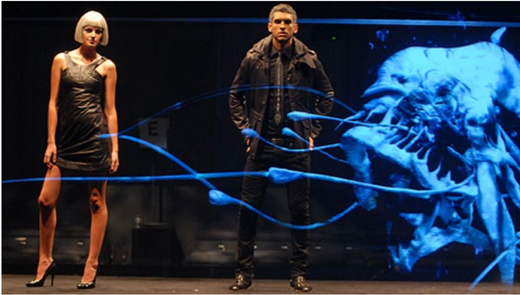
Slika 6) Diesel 'Liquid Space' Holographic Fashion Show, 2007.