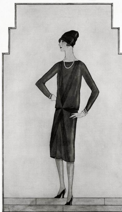
Sl.5. Little Black Dress, 1926.

OCTOBER ..... 1926 ..... THE FIRST VOGUE INTRODUCES COCO CHANEL'S LBD.