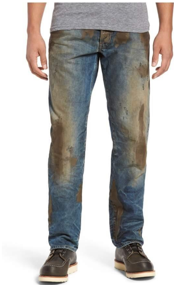
Sl.8. Barracuda traperice, 2017., http://shop.nordstrom.com

Suvremenu modu vežemo uz proces oslobađanja tijela i građanskih konvencija koje su određivale odijevanje. Suvremena moda posebnu pozornost pridaje stilu koji ne vapi za pogledima s rezultatom odobravanja, baš kao što je opisano u knjizi „Subculture: the meaning of style“, gdje punk kao supkulturu povezanu upravo s ružnoćom naziva stilom koji sadrži iskrivljene odraze svih glavnih poslijeratnih supkultura.