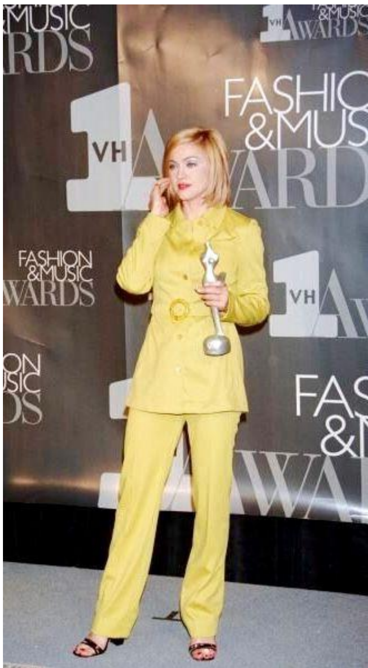
Sl.18. Madonna, VH1 Awards 1995., www.pinterest.com

Posljedice pokazivanja ove kolekcije vidjele su se već u prvim mjesecima nakon izlaganja i to u prodaji vintage odjevnih predmeta, posebice obuće. Zanimljiv je to prikaz ritma mode i stila koji nikada ne staje, već vuče jednu promjenu za drugom i prilagođava se u trenutku.