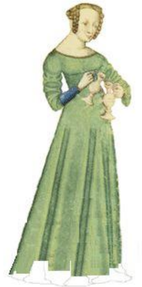
Sl.3. 14. stoljeće, ženska odjeća

briga i oko razlikovanja udanih od neudanih žena, tradicije koja se nastavila još dugo godina, a nekim je dijelovima svijeta još uvijek popularna. 12