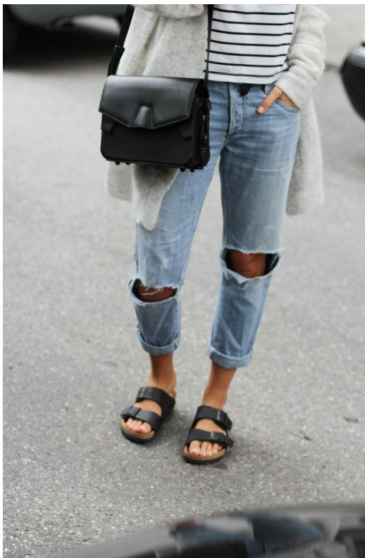
Sl.6. Normcore trend, boyfriend jeans, Birkenstock, 2016., www.pinterest.com

Poanta ovog trenda u početku je bila suprotstavljanje pravom trendu, markama, brendovima, no zahvaljujući brzini širenja informacija u današnje vrijeme ovaj anti-trend postao je moda. Upravo su preko normcore trenda u modu ušle široke traperice i natikače, te stvorile trend ružne odjeće koja ne privlači poglede muškaraca, već daje poruku da se žena treba odijevati za sebe, ne razmišljajući pritom što će okolina misliti o njoj.