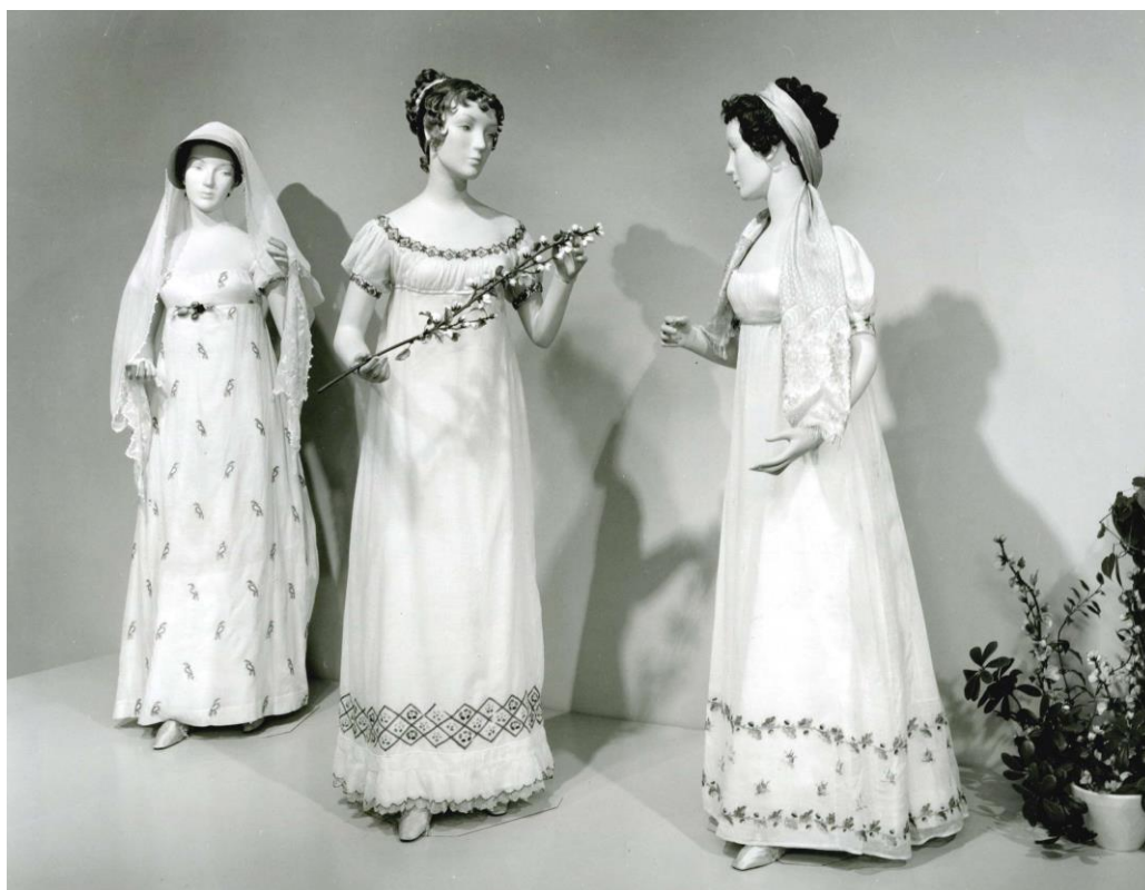
Sl.4. „Summer in Style“ (MET), haljine iz 1805. (1960.), www.metmuseum.org/

Smatra se da je oslobađanju mode u 19. stoljeću prethodila liberalizacija ženske odjeće krajem 18. stoljeća, što je pripisano engleskom utjecaju. Međutim, upravo je kraj 19. stoljeća bio početak mode kakvu znamo danas. Odjeća postaje slobodnija, razbija nametnute društvene okvire i pravila, te omogućuje svakom pojedincu traženje i otkrivanje vlastitog identiteta putem odijevanja. 14 Društvene promjene i revolucije bile su odgovor na podjele u društvu, velike klasne razlike, stoga je logično pretpostaviti da je težnja za manjim razlikama rezultirala i jednostavnošću u odijevanju, međutim u ženskoj modi pojednostavljivanje odjevnih predmeta nije potrajalo dugo.