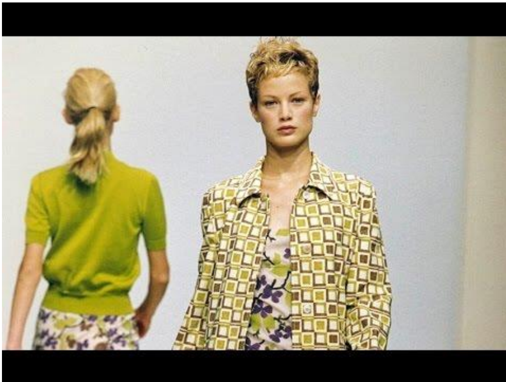
Sl.14. Prada S/S 96, izvor www.youtube.com

„Kruti krojevi nijanse zelene koje lebde negdje između mulja i plijesni, smeđe boje su mutne- poput boje vode koja stagnira nakon dugog, vrućeg ljeta.“ 55