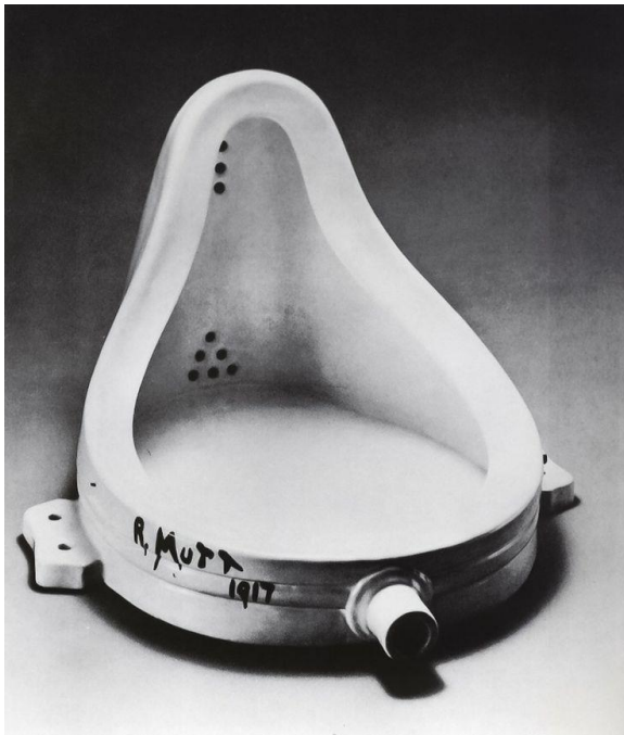
Sl.2. Marcel Duchamp, „Fountain“, 1917.