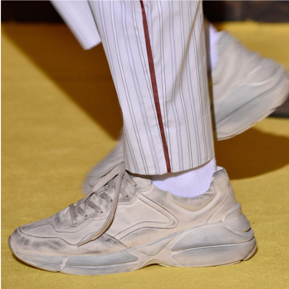
Sl.7. Gucci Resort 2018.

Nošenje prljave, neugledne odjeće smatrano je znakom prizivanja prezira. No ako razdvojimo higijenu od čistoće možemo objektivnije sagledati poruku nečiste, zgužvane odjeće, mrlje na taj način postaju namjerni ukras a ne slučajna pogreška.