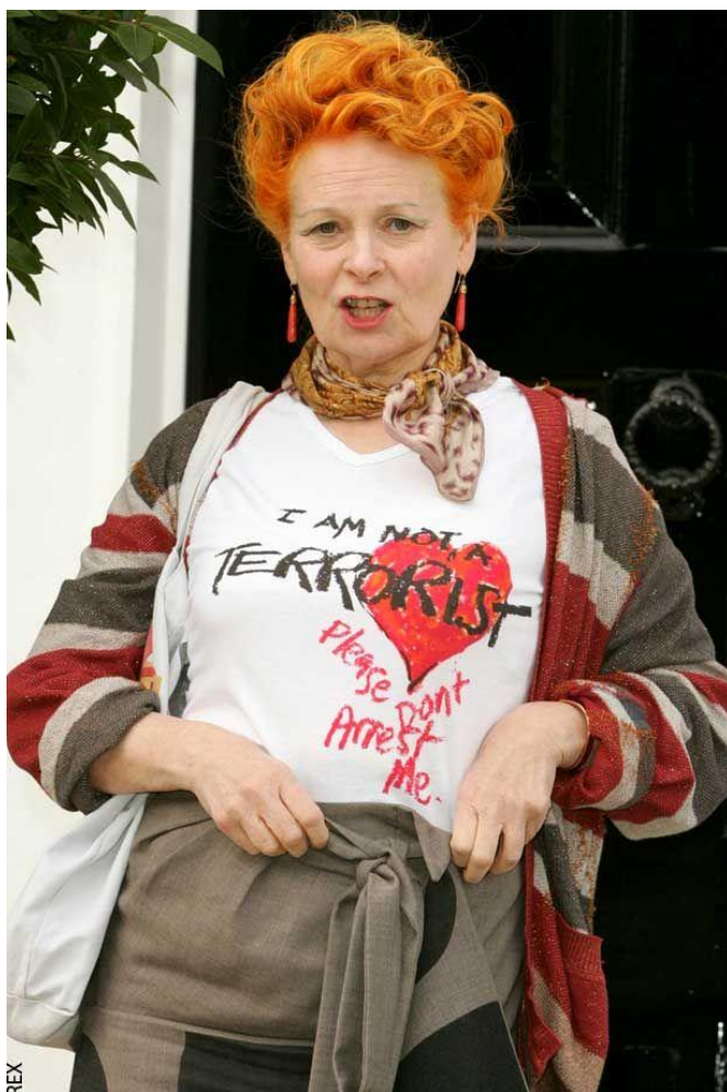
Sl.12. „I am not a terrorist, please don't arrest me“, V. Westwood, 2007., www.pinterest.com

2005. je dizajnirala majice i dječje odjevne predmete s natpisom „I am not a terrorist, please don't arrest me“, kao odgovor na antiterorističku kampanju koju je provodila britanska vlada. 50