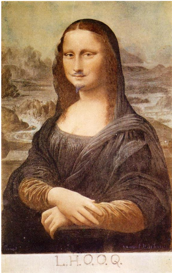
Sl.1. Marcel Duchamp, „Mona Lisa with moustache“, 1930.