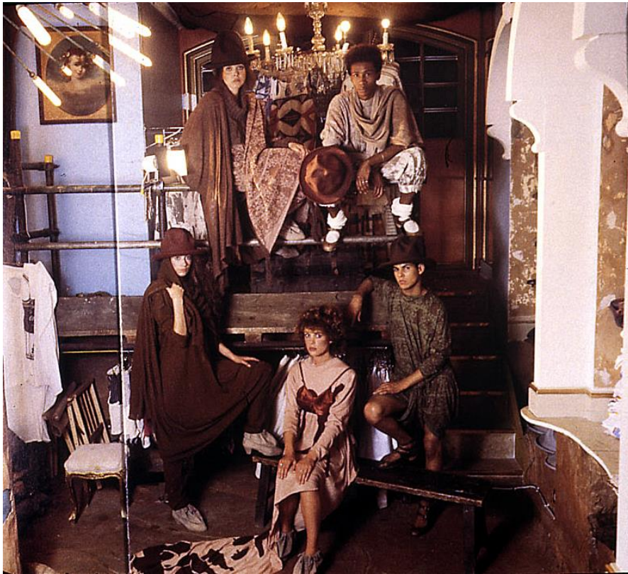
Sl.10. „Nostalgia of Mud“, unutrašnjost butika 1982., izvor: http://worldsendshop.co.uk/