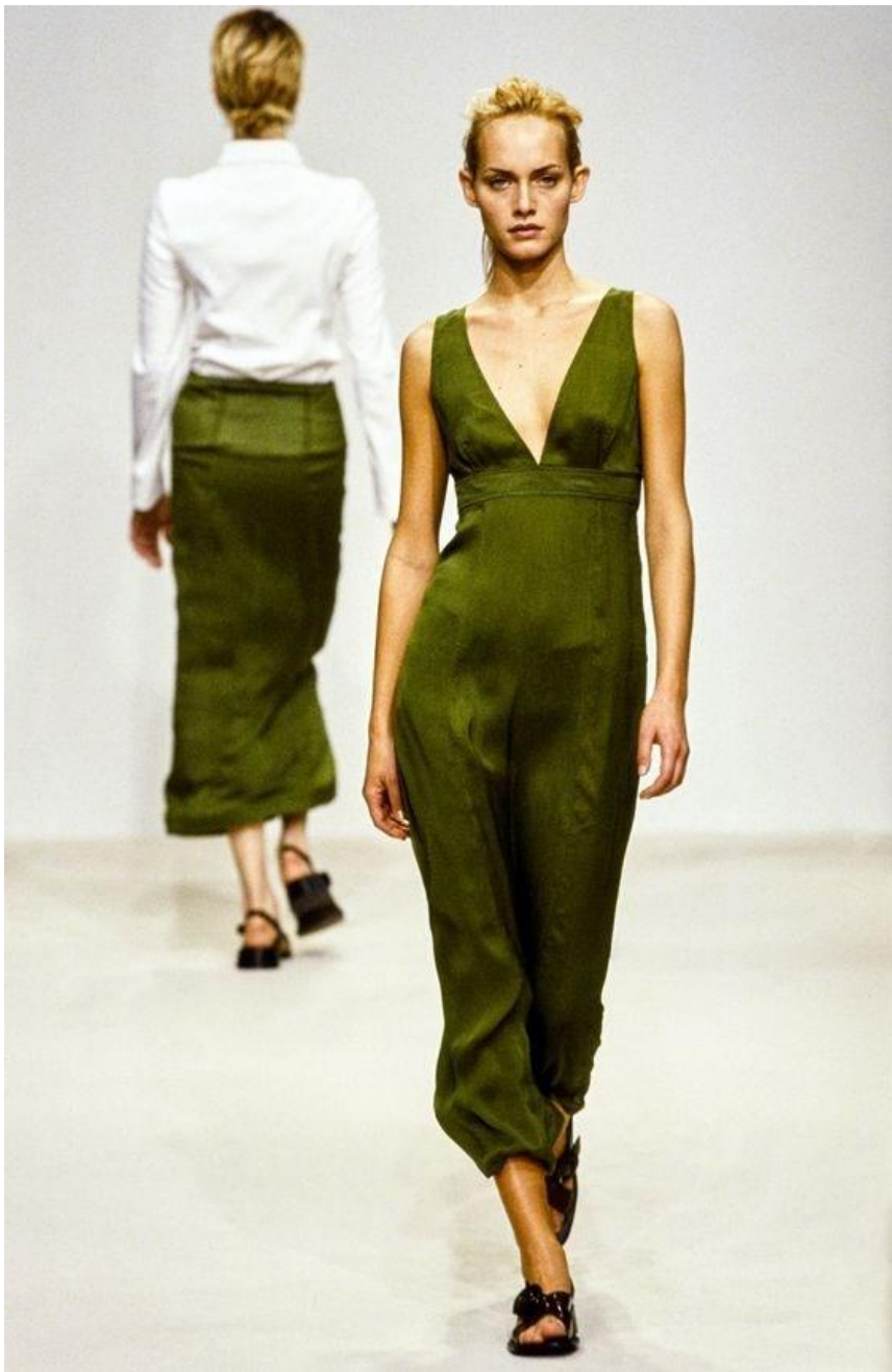
Sl.16. Prada S/S 96

Propitkivanje ružnoće u svijetu ljepote nije postavila samo kroz odjeću nego i stvarne žene, modele. Devedesete su poznate i kao era supermodela – Linda Evangelista, Naomi Campbell, Claudia Schiffer, Cindy Crawford, modeli koji su predstavljali ideale ljepote i sve ono čemu svaka žena treba težiti. Često je pozornost medija i javnosti bila usmjerena na njih više nego na odjeću koju su nosile. Na gore navedenoj modnoj reviji Pradini modeli bili su kratkokosi, mršavi, ni po čemu slični modelima koji bi inače šetali modnim pistama.