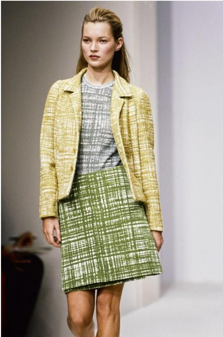
Sl.15. Prada S/S 96

Znajući da su te nijanse najmanje upotrebljive i popularne za komercijalni uspjeh, njezina hrabrost da ih koristi u svakom predmetu te kolekcije smatrana je revolucijom.