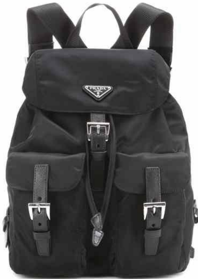
Sl.13. „Vela“ ruksak, Prada, 1984.

Kao feministkinja i doktorica političkih znanosti suočavala se s vlastitim stereotipima o modnoj industriji, te sama navodi kako je njezin pogled na svijet i probleme današnjice, prvenstveno problem položaja žena u društvu, najviše utjecao na njezin rad. 53