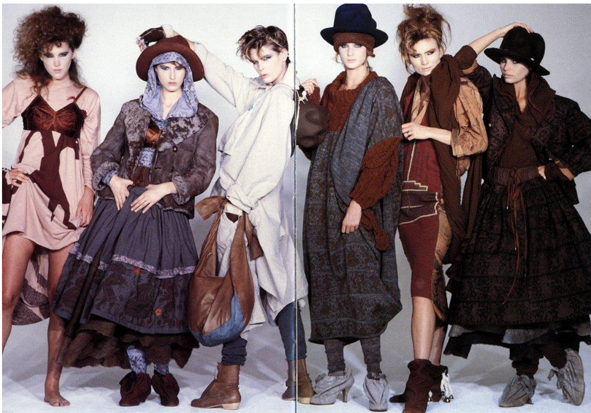
Sl.11: Buffalo Girls, Nostalgia of Mud 1982., www.tumblr.com