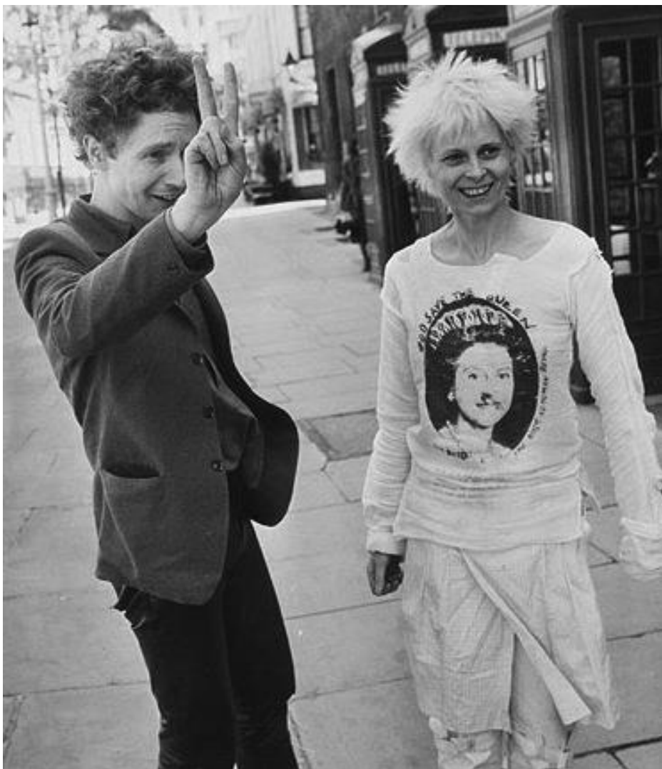
Sl.9. Vivienne Westwood i Malcolm McLaren ispred butika „Sex“, 1977.

Westwood i McLaren proizvodili su predmete koji su simbolizirali društveno propadanje oko njih. Proizvodili su ljepotu iz ružnoga, simbolično, trgajući tkanine, bojeći ih u sivo, prljajući ih, negirajući njihovu komercijalnu primjenu. 48